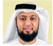
بقلم: أحمد عبد الكريم*

جاءني يوماً يوماً زوجان، كلاهما ينكر على الآخر بعض الأمور الماضية التي حصلت، يتبادلان الاتهام طوال الجلسة، يستذكران تفاصيل الماضي حدثاً حدثاً، قلت لهما: تريدان الصلح؟ قالا نعم، فقلت: لن يتحقق الصلح وما زلنا عند نقطة الماضي، كلاكما أخطأ، ولو جلسنا نعدّد الأحداث فلن تكفينا الجلسات الطوال، ولكن لو أردنا اختصار المسافات وتقريب الوجهات، علينا أولاً أن نستدعي مفهوم التسامح، وأن الخطأ وارد، لا يوجد بيننا كامل، وأن العفو وتقبل الآخر وفتح الباب للمعترف بخطئه هو أهم الأسس في إصلاح ذات البين.