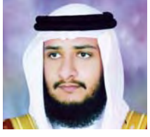
بقلم: محمد سبيعان *