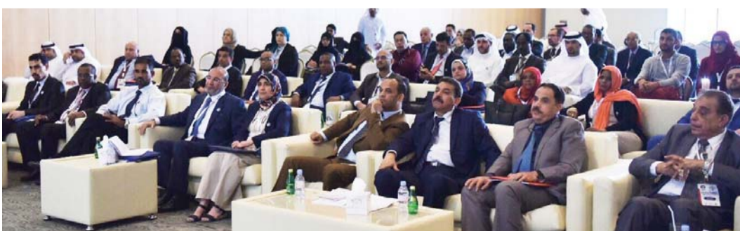
جانب من فعاليات مؤتمر الإبداع