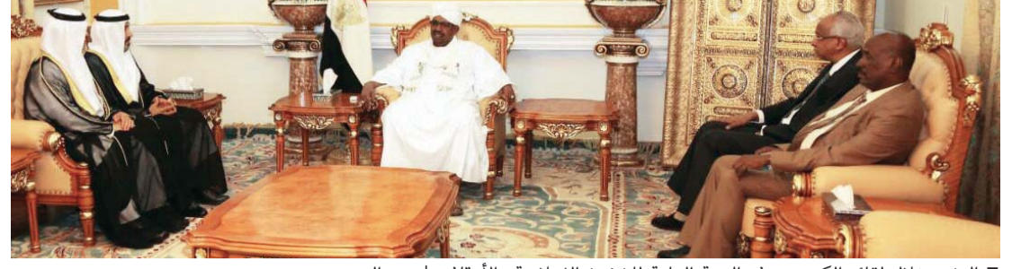
البشير خلال لقائه الكعبي ووفد الهيئة العامة للشؤون الإسلامية والأوقاف

استقبل المشير عمر البشير رئيس جمهورية السودان، الدكتور محمد مطر الكعبي، الرئيس العام للهيئة العامة للشؤون الإسلامية والأوقاف، والذي يزور السودان، ضمن برنامج التنسيق والتعاون المستمر في ما بين الهيئة العامة للشؤون الإسلامية والأوقاف، ووزارة الأوقاف والإرشاد في جمهورية السودان، وذلك بحضور حمد محمد الجنيبين سفير الدولة لدى الخرطوم، والوفد المرافق.