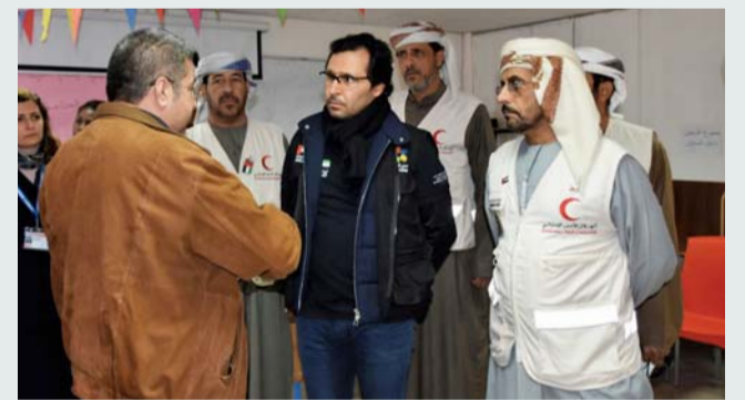
طارق الفرق خلال تفقده المخيم الإماراتي - الأردني