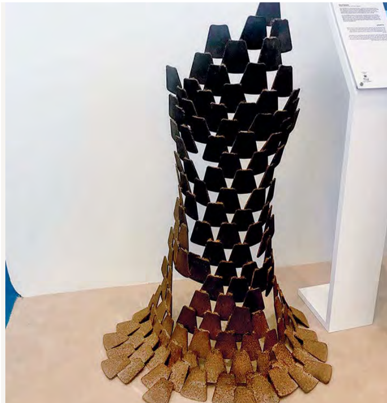
■ «الأساس 2».. تمت صناعته من سعف النخيل لمكانته في التراث الإماراتي