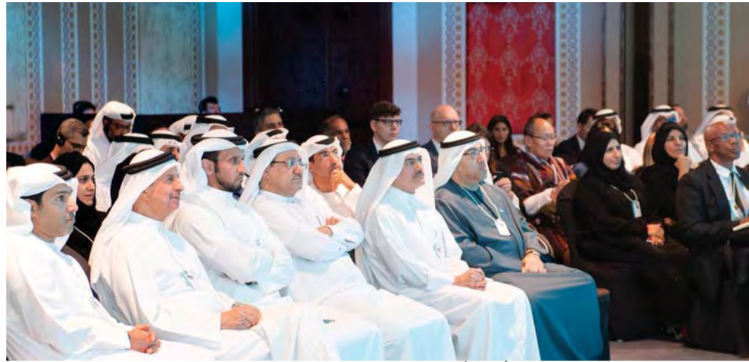
عبد الرحمن العويس وحفيد القطامي وأمين الأميري وجانب من حضور المنتدى

واستضافت القمة العالمية للحكومات في يومها الأول منتدى الصحة العالمي الذي ناقش عدداً من المحاور التي تناولت سبل الوقاية من أمراض المستقبل والحد من تداعياتها السلبية على مستقبل البشرية ودور الحكومات في تعزيز توظيف تقنيات الذكاء الاصطناعي لتطوير العلاجات وإيجاد آليات مبتكرة لإيصال الأدوية لكل الذين يعانون من الأمراض والأوبئة في جميع أنحاء العالم. وأكد معالي عبد الرحمن بن محمد العويس، وزير الصحة ووقاية المجتمع، في كلمته الافتتاحية أن العالم يتجه بشكل متزايد نحو تحسين جاهزيته لمواجهة الأمراض المستقبلية، مشيراً