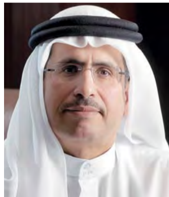
■ سعيد الطاير

ويشارك سعيد محمد الطاير، العضو المنتدب الرئيس التنفيذي لهيئة كهرباء ومياه دبي، تجربة الهيئة في تعزيز الأمن المائي في دبي في جلسة رئيسية بعنوان «مستقبل أمن واستدامة المياه عالمياً»، كما يشارك في جلسة نقاشية بعنوان «دور الحكومات في رسم مستقبل الطاقة»، وذلك ضمن فعاليات اليوم الثاني من القمة.