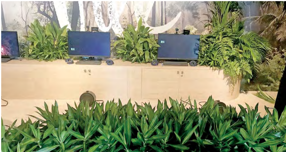
ركن «الشجرة» في القمة العالمية للحكومات | البيان