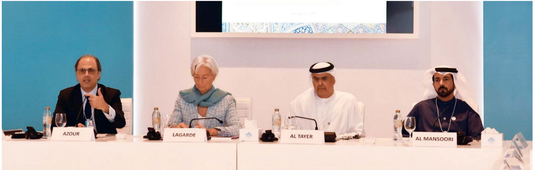
عبيد الطاير وراشد المنصوري وكريستين لاغارد وجهاد أزور خلال الطاولة المستديرة