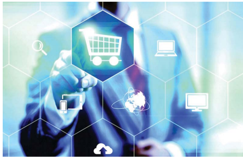
ترسيخ الابتكار لصناعة المستقبل وفق معايير التطورات الرقمية والذكاء الاصطناعي | أرضيفية

تحقيقاً للأفضل وترسيخاً للابتكار محركاً لصناعة المستقبل، لا بد من وضع معايير أساسية تتعلق بالذكاء الصناعي، والتطورات الرقمية، ورفع التنافسية، ومستوى الخدمات الحكومية، وترسيخ معايير السعادة وجودة الحياة واستشراف المستقبل، لتكون الحكومات قادرة على قيادة العالم، وتبني اقتصاد المستقبل القائم على البرمجيات والتكنولوجيا والبيانات.. نعم نستطيع أن نحقق أكثر، إن انطلقنا من رؤية أن المستقبل لا ينتظر.