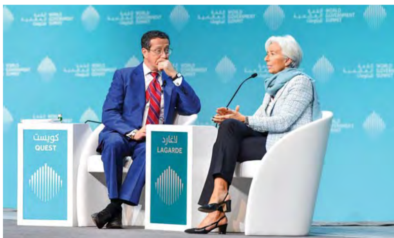
كريستين لاغارد وريتشارد كويست خلال الجلسة الحوارية

وناقشت الطاولة المستديرة سبل تطوير الحوكمة والمبادرات والأطر العالمية التي من شأنها المساعدة في كشف التحديات التي تواجه تطبيق الحوكمة وتحديد الحلول الملائمة، مع الأخذ بعين الاعتبار أن تطبيق الحوكمة وتفعيل آلياتها من شأنه تسهيل نمو القطاع الخاص ليكون شريكاً أساسياً في عملية التنمية، وبما يسهم في توفير وظائف جديدة ويساعد الحكومات على إدارة الإنفاق العام بشكل أفضل. واستعرضت الجلسة الدروس المستفادة من عدد من عمليات الإصلاح الاقتصادي حول العالم والكيفية التي يمكن من خلالها تطبيق الاستدامة في دول المنطقة. وقام بإدارة الجلسة المغلقة الثانية حول الحوكمة المدير الإقليمي لصندوق النقد الدولي في منطقة الشرق الأوسط جهاد أزور، وشارك في حلقتها النقاشية معالي مبارك بن راشد المنصوري، محافظ المصرف المركزي الإماراتي، ومحمد معيط، وزير المالية المصري.