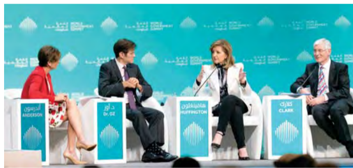
جانب من الجلسة

وأكد الدكتور أوز، مقدم برنامج «دكتور أوز»، أنه ينبغي على الحكومات بحث أسباب الإرهاق والإحباط، التي قد تكون نتيجة أسباب عضوية تتطلب تدخلاً علاجياً، أو أسباب مجتمعية تتطلب تغيير العادات التي تسبب