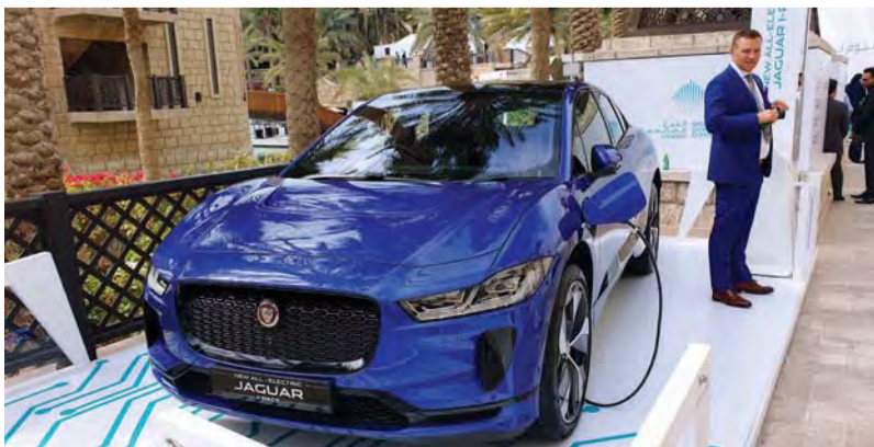
■ المركبات الكهربائية تدعم وسائل النقل المستدامة