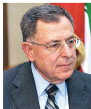
■ فؤاد السنيورة

وأكد السنيورة أهمية القمة باعتبارها حدثاً يطرح القضايا الكبرى والهامة للنقاش، حيث ترسم القمة ملامح التوجهات الرئيسية المقبلة، وتقدمها بشكل مباشر أمام صناع القرار من مسؤولين وخبراء، ليتمكنوا بدورهم من التعامل مع متطلبات المرحلة، وإعداد الحكومات والمجتمعات لمواكبة المستجدات. وتوجه بالشكر لحكومة الإمارات على تنظيم هذا الحدث الذي يستقطب أعداداً كبيرة من الخبراء والمسؤولين، لافتاً إلى أن الأفكار التي تطرح في القمة من شأنها إحداث صدمة في طرق العمل التقليدية، وهذه الصدمات تتطلب استجابة من صناع القرار للتعامل