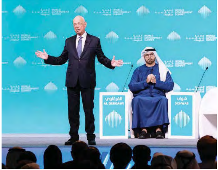
■ كلاوس شواب متحدثاً خلال الجلسة الافتتاحية للقمة بحضور محمد القرقاوي

العولمة يتناسب مع العالم الحديث متعدد الأقطاب، وفي ظل الثورة الصناعية الرابعة يجب علينا التخطيط للمستقبل وعولمة أخلاقيات الأنظمة والقضاء على الفساد.» وأكد شواب أن المنظومة العالمية في صورتها الراهنة تواجه الخطر بالخروج عن السيطرة، محمداً 3 مسببات رئيسية لهذا التحدي، هي: سرعة التغييرات الجيوسياسية على مستوى العالم، والتحول من عالم أحادي القطبية إلى عالم متعدد الأقطاب، والموجة الجديدة من الشعوبية، والناس الذين لا يريدون أن يتم إهمالهم باعتبارها أهم عوامل الضغط على النظام العالمي. ووصف اختلال التوازن الذي تسببه التكنولوجيا المتطورة، والتحدي المتمثل في حماية البيانات، وانتهيار النظم الاجتماعية والبيئية باعتبارها تهديدات للنسخة الرابعة من العولمة.