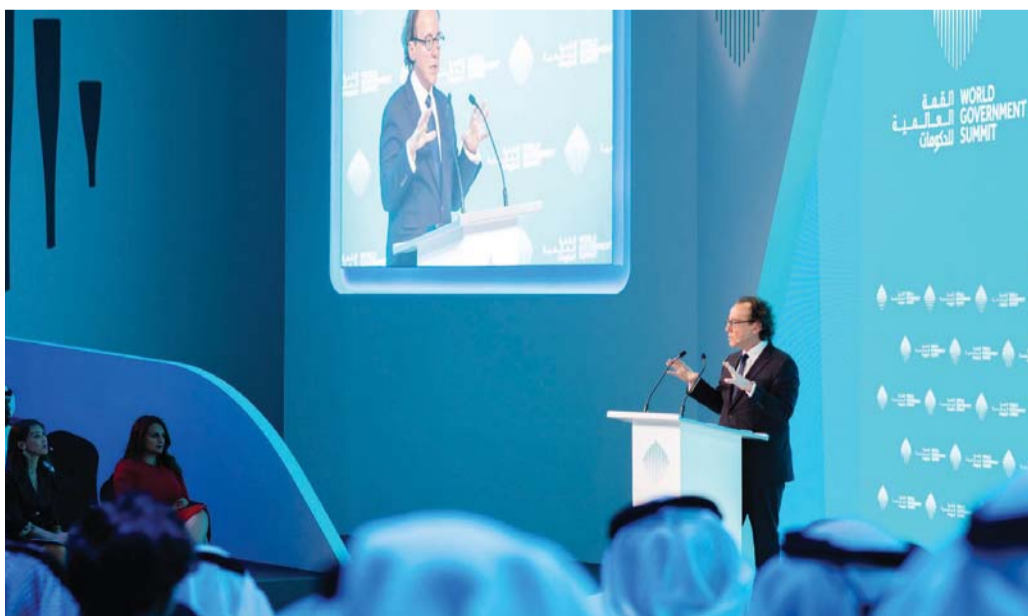
■ مارك ليل يتحدث في جلسة «كيف تطورت هوية الشعوب؟» | من المصدر

وأشارت إلى أن القبائل قد تكون مصدر حماية وعمل مشترك، وقد تكون سبباً في إقصاء الآخر، وعدم الثقة به، خصوصاً مع وجود سياسات ممنهجة تعذيبها وتطعيمها الإطار اللزم لصعود هذه المشاعر العدائية في المجتمع، فالقبيلة السياسية المعتمدة على اللون قد تؤدي بدورها إلى تشدد وانغلاق ومشاعر غير صحية تجاه الفئات المجتمعية الأخرى.