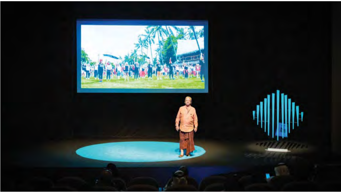
شرح عن المدرسة الخضراء في بالي خلال جلسة «قادة الاستدامة لمستقبل أفضل» | البيان

على مقاعد دراسية من الخيزران في قاعات بلا جدران تحد مخيّلهم، ومنهج أكاديمي يعوّدهم على دمج الممارسات البيئية والصحية في أعمالهم اليومية، ويسهم في غرس مبادئ الاستدامة في الأجيال القادمة. ونتيجة ذلك، خرج بعض الطلاب بعدد من المبادرات التي لاقت زخماً عالمياً، من بينها مبادرة «باي باي بلاستيك»، والتي مهدت الطريق لإصدار قرار حكومي في بالي يحظر استيراد واستخدام الأكياس البلاستيكية، ومبادرة أخرى لصنع وبيع الملابس المصنوعة من مواد عضوية بالكامل يعود ريعها إلى الطلاب الفقراء الذين يجدون صعوبة في تغطية التكاليف المدرسية، وغيرها الكثير من المبادرات البيئية الأخرى التي كانت ومن دول شك، وليدة غرس مفهوم الاستدامة والاهتمام بالبيئة، واستدامتها في عقل ووجدان وأسلوب حياة هؤلاء الطلاب منذ الصغر.