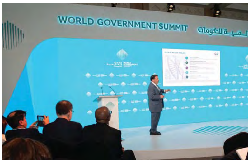
جانب من المنتدى

وتحدث الدكتور بيتر سبيرغر، مدير معهد ماكس بلانك للمواد الغروية والأسطح الفاصلة في جمهورية ألمانيا، عن جهود منظمة الصحة العالمية في مواجهة التهديدات الصحية العالمي، وصعوبة إنتاج اللقاحات والمعوقات