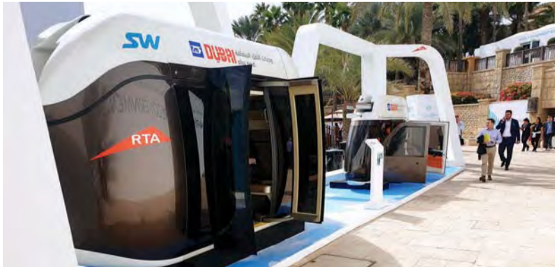
■ وحدات النقل المعلقة

ولأن القمة العالمية للحكومات أضحت «ورشة» لصناعة المستقبل، وتطوير أدواته، واستشراف أبرز ملامحه لتغيير حياة الشعوب إلى الأفضل، فإن القائمين عليها، يحرصون في كل دورة منها على عرض ابتكارات وتقنيات جديدة تجسد شعارها في استشراف المستقبل، وتتماشى مع المواضيع والعناوين