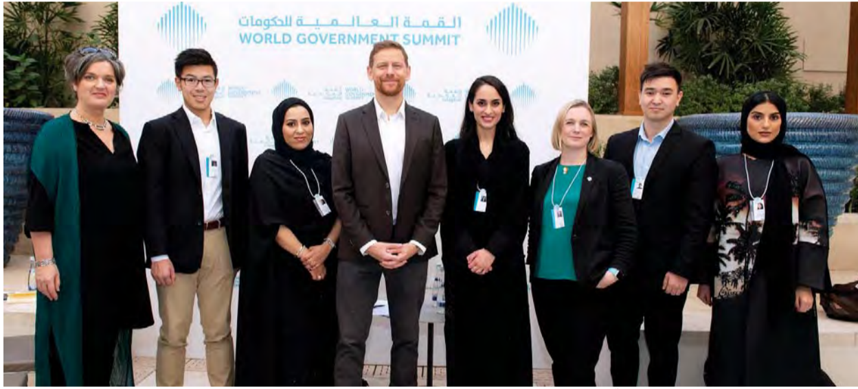
تشارلز مونغموري عقب جلسته الصباحية

وقال نورمان إن على الحكومات تمكين المبتكرين والمبدعين لتصميم وبناء مجتمعاتهم بحسب احتياجات كل منها، مؤكداً أن المليارات من المعونات والمساعدات التي تقدمها مؤسسات دولية قد لا تحقق في بعض الأحيان النتائج المرجوة، لأنها لا تفتقر بفكرة تمكين