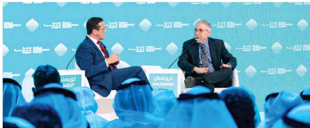
■ بول كروغمان متحدثاً خلال جلسة «ما الآفاق المستقبلية للتجارة الحرة؟»

ولفت إلى أنه من الأجد بالذول والمؤسسات وضع أسس رصينة لمنظومة اقتصادية تشكل شبكة أمان للمواطنين في حال حدوث الأسوأ، مشيراً إلى أن شبكة الأمان هذه غير موجودة اليوم في مجمل الاقتصاد العالمي. جاء ذلك، خلال جلسة حوارية بعنوان «ما الآفاق المستقبلية للتجارة الحرة؟» أدارها الإعلامي ريتشارد كويست من قناة سي إن إن، خلال أعمال اليوم الأول من القمة العالمية للحكومات. وقال كروغمان: «يتغير منظور الإنسان مع مرور الزمن، والمعرفة التي نتحل بها في مرحلة ما قد تغير الحاجة إليها لاحقاً، ما يستدعي التزود بمعرفة جديدة والنظر إلى الأمور من منظار مختلف. ففي 2017، وجدنا أنفسنا أمام العديد من التحديات الجيوسياسية والتوسع بحروب تجارية لا نهاية لها، واليوم في عام 2019 اكتشفنا أن المخاوف التي ساورتنا حقيقية، لكنها ليست بالحجم الذي كنا نتخوف منه، فالعلاقة بين الولايات المتحدة والصين لن تصل إلى ذلك السوء الذي كنا نتوقعه، كما أن التوجهات ضد المهاجرين ورفض اتفاقيات التجارة الحرة لم تصل إلى تلك المرحلة التي كنا نتخوف منها أن ينفجر نموذج مجتمعنا معها». وتطرق كروغمان إلى تصاعد النزعات الشعبوية لدى مختلف