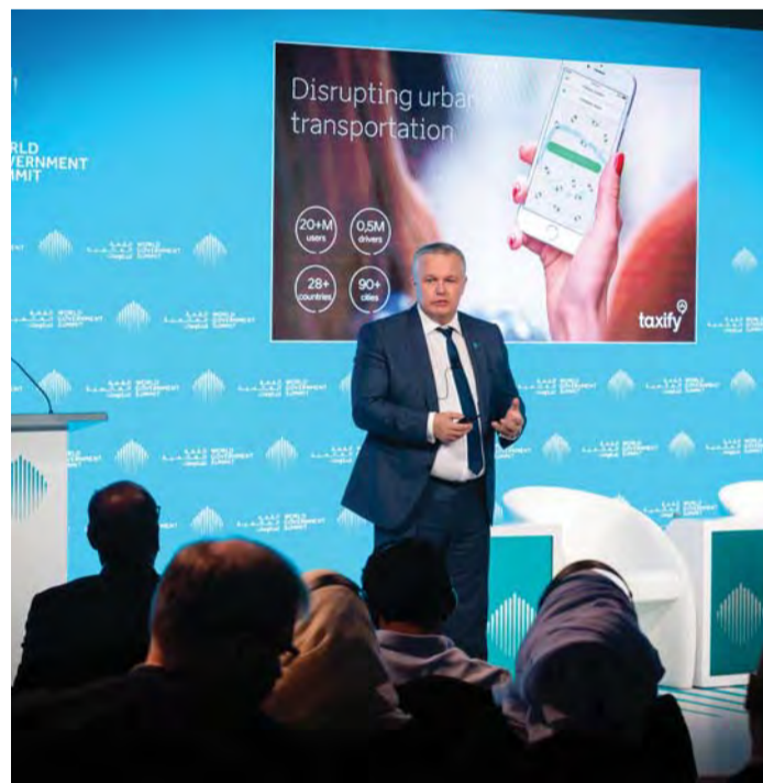
■ مارك هيلم يتحدث خلال الجلسة

وقال إن إستونيا منذ التسعينيات تستفيد من خدمات وأفكار ورؤى قيادات شابة في القطاعات الحكومية والخدمات، ما أسهم في تحقيق إنجازات عديدة محورها الإنسان، وقصة نجاحها هي سهولة الوصول إلى الخدمات وتذليل العقبات التي تعيقها.