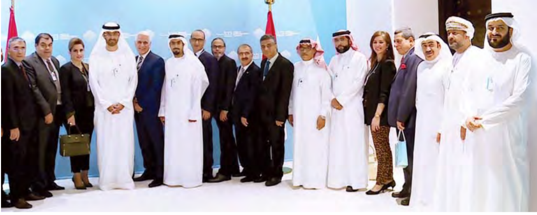
■ سلطان الجابر ومنصور المنصوري ومحمد الريسي وشخصيات عقب التوقيع

وتشمل بنود ميثاق وكالات الأنباء للتسامح التأكيد على الأهمية القصوى التي تمثلها القمة العالمية للحكومات 2019 والمحاور الرئيسية التي ناقشتها في صناعة مستقبل العالم والدور المأمول من الإعلام في تطوير أدواته عبر تقديم تقنيات وابتكارات تساهم في دعم صناعة المحتوى الإعلامي لما فيه صالح البشرية. وتتضمن البنود أيضاً الاتفاق على تبادل الأخبار المكتوبة، والصور، ومقاطع الفيديو، وأي مواد صحافية أخرى، باختلاف أنواعها، المتعلقة بموضوع التسامح، وكذلك الأخبار التي تعزز مفهوم التعايش بين الثقافات والشعوب إلى جانب أخبار المبادرات والمشروعات التي تهدف إلى تعزيز قيم ومبادئ التسامح وأخبار الحوارات التي تجرى بين الثقافات والحضارات المختلفة وأخبار البرامج الثقافية والمجتمعية التي تساهم في بناء مجتمعات متسامحة إلى جانب تلك التي تتعلق بصياغة تشريعات وسياسات تساهم في غرس التسامح الثقافي والديني.