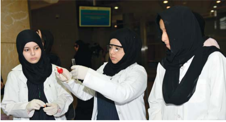
الطالبات يناقسن في مجال التجارب المخبرية

أكد الدكتور محمد عبدالله البيبي، مدير جامعة الإمارات، لـ«البيان» أن الجامعة تسعى وبشكل دائم لمواكبة تطوير آليات عملها الأكاديمي، وبما يحقق الأهداف والرؤية المستقبلية التي تسعى إليها كمؤسسة وطنية أكاديمية رائدة، تضاهي أفضل مؤسسات التعليم العالي، وتنافس على المراكز الأولى إقليمياً ودولياً، ووفق ذلك تقوم الجامعة الآن بالاستعداد لطرح آلية جديدة لتطوير سياسة القبول، بحيث يسمح للطلبة من حملة شهادة الثانوية القديمة، أو طلاب الجامعات الخاصة، بالتسجيل في جامعة الإمارات مقابل رسوم موازية، ووفق المعايير الأكاديمية والقدرة الاستيعابية، وذلك لجميع الطلبة المواطنين والمقيمين، اعتباراً من العام الأكاديمي القادم 2017-2018.