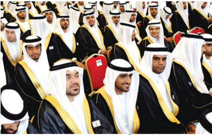
نماذج وطنية رائدة تتخرج سنويا | أرسيفية

أنشئت جامعة الإمارات في عام 1976، بموجب القانون الاتحادي رقم 4، بمبادرة كريمة من المغفور له، بإذن الله، الشيخ زايد بن سلطان آل نهيان، وأراد لها أن تكون جامعة اتحادية عربية إسلامية، ومنارة للفكر الإنساني، ومركزاً رائداً للتنمية الوطنية ونشر الثقافة، وتعميق جذورها وتطور المجتمع مع الحفاظ على عناصرها الأصلية. وكانت تضم في عام 1977 أربع كليات فقط، ثم توالى إنشاء الكليات، حيث باتت تضم الآن 10 كليات، حيث افتتحت كلية الشريعة والقانون في عام 1978، وكلية الهندسة في عام 1980، وكلية نظم الأغذية، وفي عام 1986 أنشئت كلية الطب والعلوم الصحية، وفي عام 2000 أنشئت كلية تكنولوجيا المعلومات، وتطور عدد المقبولين في الجامعة، من 502 طالب وطالبة عند الافتتاح في عام 1977، فيما يبلغ عدد الطلبة والطالبات لعام 2016 قرابة 14 ألفاً.