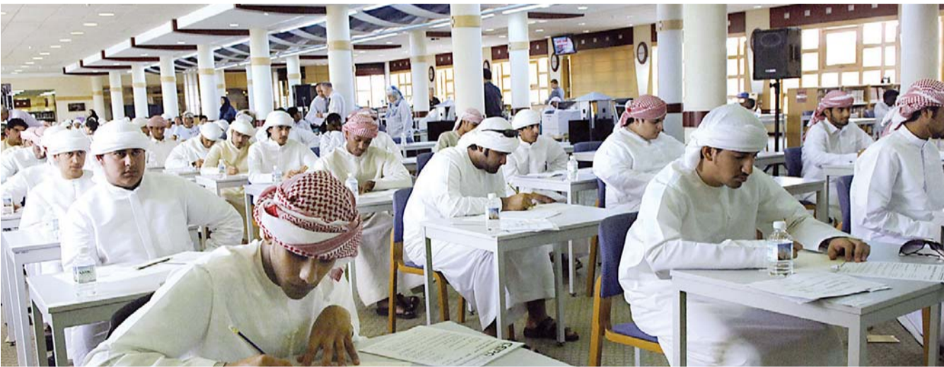
اللغة الإنجليزية ركن أساس في التعليم الجامعي | أرشيفية

أكد طلبة أكملوا المرحلة الثانوية بنجاح أنهم يواجهون تحدياً كبيراً وصعوبات كثيرة وعاثت متعددة في الحصول على شهادتي التوفيل والأيلتس حتى يتمكنوا من الدخول إلى الجامعات وبالتالي دراسة التخصص الذي يرغبون فيه، لافتين إلى أن ذلك الأمر يقف حاجزاً أمام تحقيق طموحاتهم وآمالهم، كما أن بعض الجامعات تشتترط حصول الطالب درجات عالية حتى يتمكن من استكمال إجراءات التسجيل في التخصص الذي حلموا بالاتحاق به بعد إكمال مراحل سني الدراسة الثانوية، وأن كثيراً من الطلبة تخلوا عن الجامعات أو غيروا تخصصاتهم بسبب التوفيل والأيلتس.