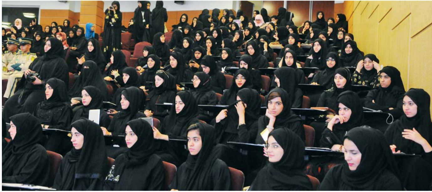
إقبال الطالبات على التخصصات العلمية | أرشيفية

وأوضح الشحيمة أن نظام التقديم المبكر يعني أن الجامعة تقبل طلبات الالتحاق بناء على نتيجة الصف العاشر والحادي عشر، فإذا كان الطالب حاصلًا على نتيجة 78% فما فوق في هاتين السنتين يتم إعطاؤه قبولاً مشروطاً بأنه طالب مقبول بشرط إنجاز السنة الأخيرة بنجاح، وقبول الطالب في كليات الجامعة يعتمد على المقاعد المتوفرة