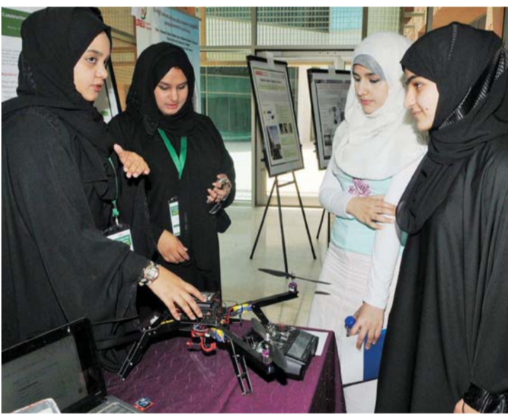
إقبال الطلبة على مشاريع البحث العلمي

بادرت جامعة الإمارات، بإنشاء مراكز أبحاث علمية بنية في مختلف التخصصات العلمية مثل، المركز الوطني للمياه، ومركز زايد للعلوم الصحية، ومركز خليفة للتقنيات الحيوية والهندسة الوراثية، ومركز أبحاث الطرق والمواصلات والسلامة المرورية، ومركز جامعة الإمارات للسياسة العامة والقيادة، والمركز الوطني لتكنولوجيا علوم الفضاء، وأخيراً مركز الإمارات للبحوث ودراسات السعادة. إضافة إلى ذلك فقد تم طرح مسابقة تمويل مشاريع بحثية ضمن اهتمامات المراكز البحثية ذات الأولوية الوطنية بالدولة لإجراء بحوث علمية ترتبط ارتباطاً مباشراً بخدمة الدولة والمجتمع فقد تم تمويل 121 مشروعاً بحثياً لهذه المسابقة منذ إنشائها في عام 2013 بقيمة قدرها 63 مليون درهم ضمن 6 مراكز بحثية.