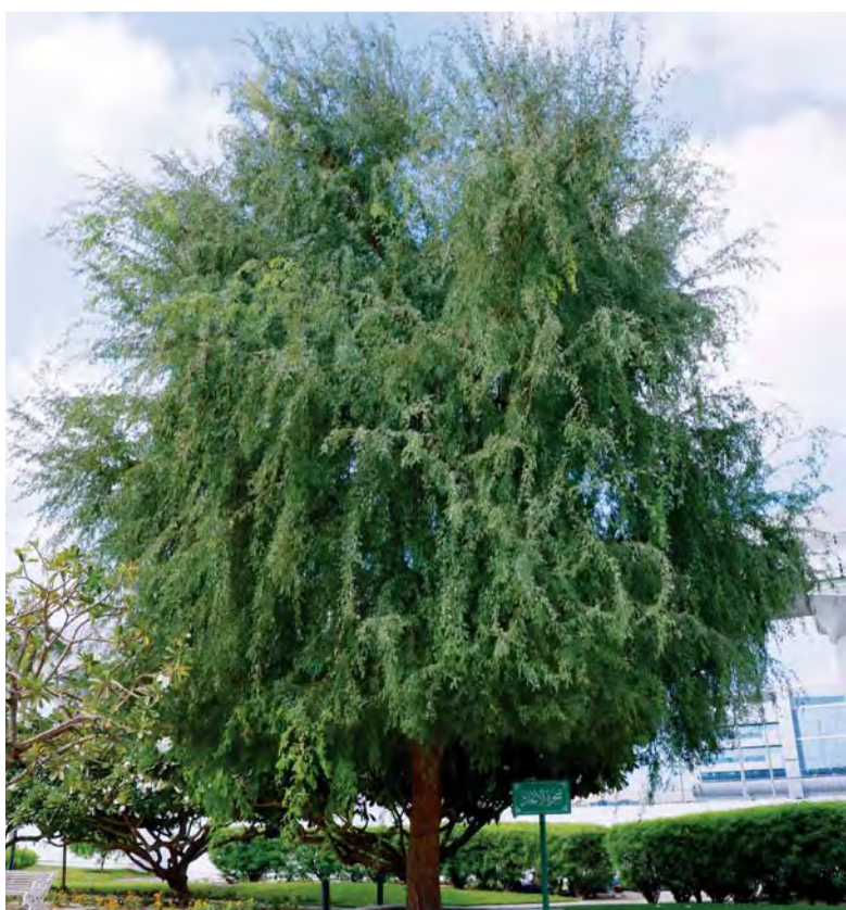
شجرة الاتحاد الآن