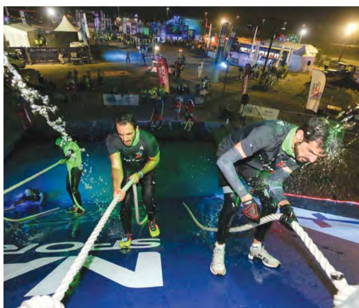
مشاركة واسعة من الدوائر الحكومية