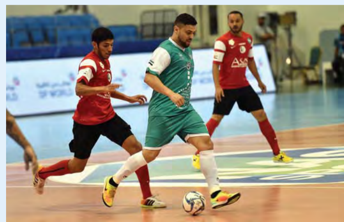
فريق شرطة دبي فرض نفسه بقوة | البيان