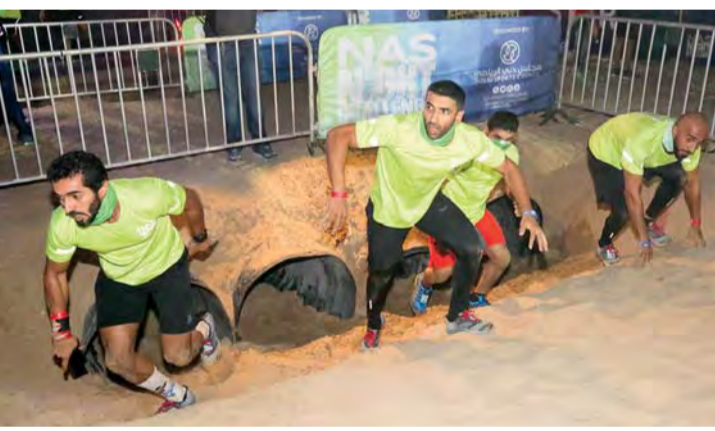
تزويد المشاركين خلال المنافسات بـ4200 لتر مياه معدنية | البيان