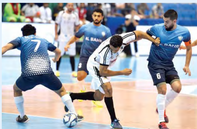
البحري حقق تأهلاً مستحقاً | البيان