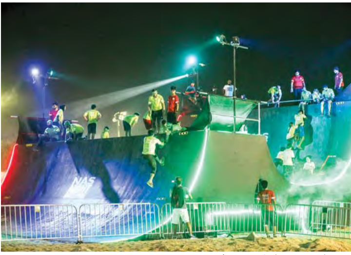
تنظيم مميز لبطولة التحدي | البيان