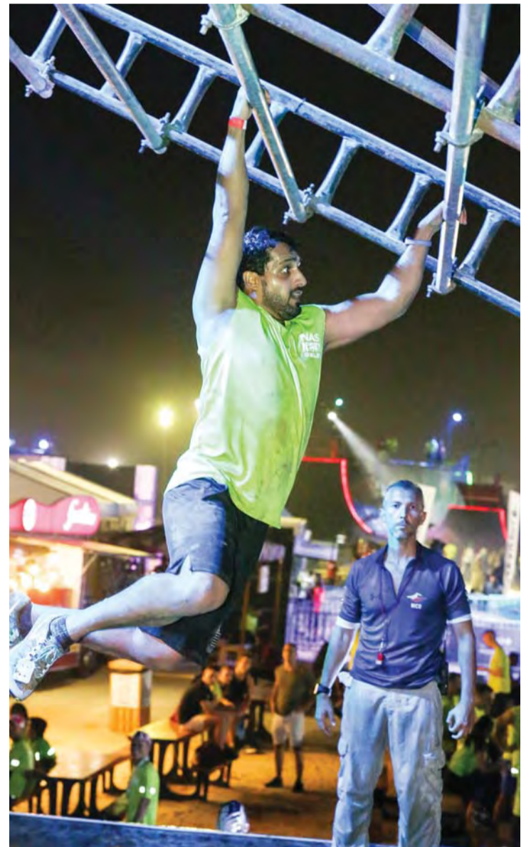
رياضة التحدي تحتاج إلى القوة البدنية لتخطي الحواجز

دبي، مؤسسة دبي لخدمات الإسعاف، هيئة الطرق والمواصلات في دبي، هيئة المعرفة والتنمية البشرية، الإدارة العامة للإقامة وشؤون الأجانب وغيرها. وأكد عبد الله بن طوق الأمين العام لمجلس الوزراء، أن تحدي ناس الليلي، يعد فرصة نموذجية للدوائر الحكومية للمشاركة في مثل هذه الفعاليات الرياضية، مشيراً إلى أن الأمانة العامة لمجلس الوزراء شاركت بأربعة فرق في النسخة الحالية من التحدي.