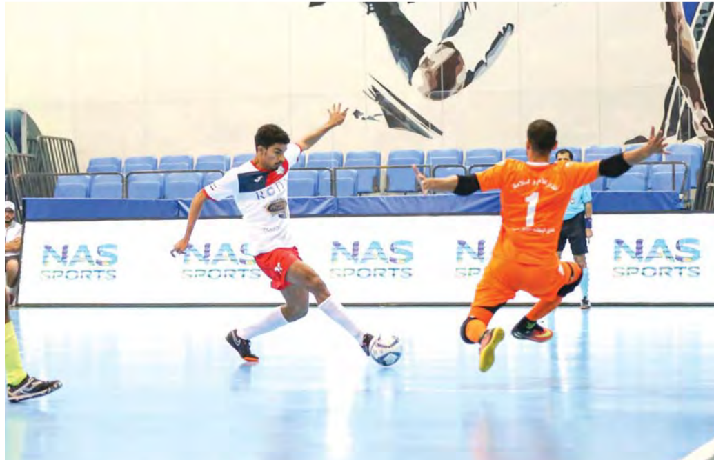
فريق الطاهر خلال مشاركته في البطولة