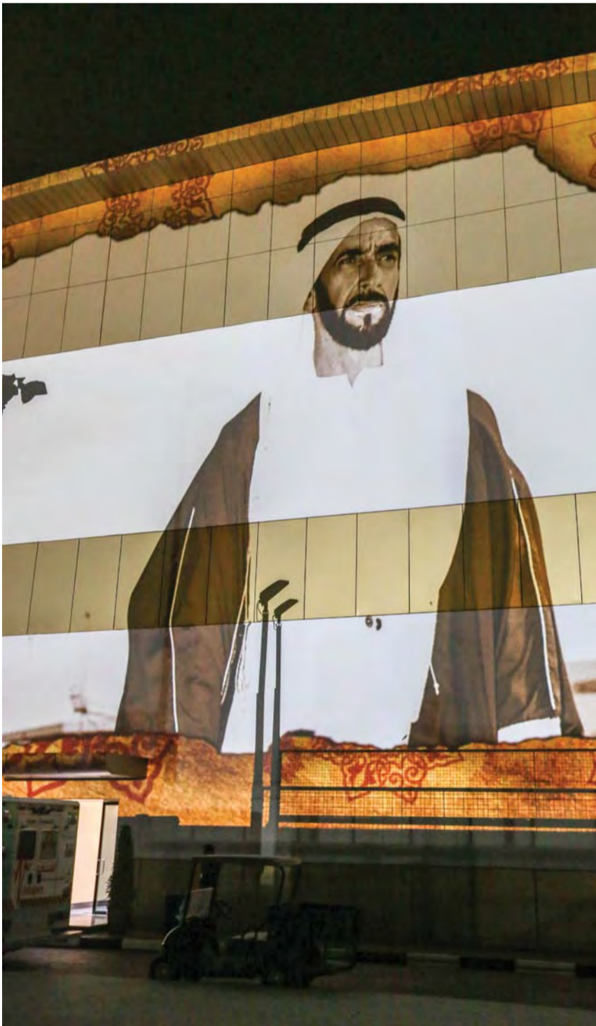
الدورة تحتفي بيوم زايد للعمل الإنساني سنوياً | البيان

وستكون محور التنافس في الجائزة المخصصة للأفراد والمؤسسات «مسؤولية العمل الإنساني في القطاع الرياضي» وتشمل مختلف الأنشطة التطوعية لتحقيق أهداف إنسانية أو اقتصادية أو اجتماعية. وتتضمن الشروط العامة للترشح، أن تكون الأعمال المقدمة ذات نفع ملموس للمجتمع وبمخرجات قوية تتوافق مع معايير الجائزة واستراتيجية الدولة، وأن يكون العمل موثقاً، وتم إنجازه أو ساري تطبيقه خلال فترة الترشح، وأن يكون متماشياً مع القيم والأخلاق الإنسانية، وأسهم في إثراء القطاع الرياضي.