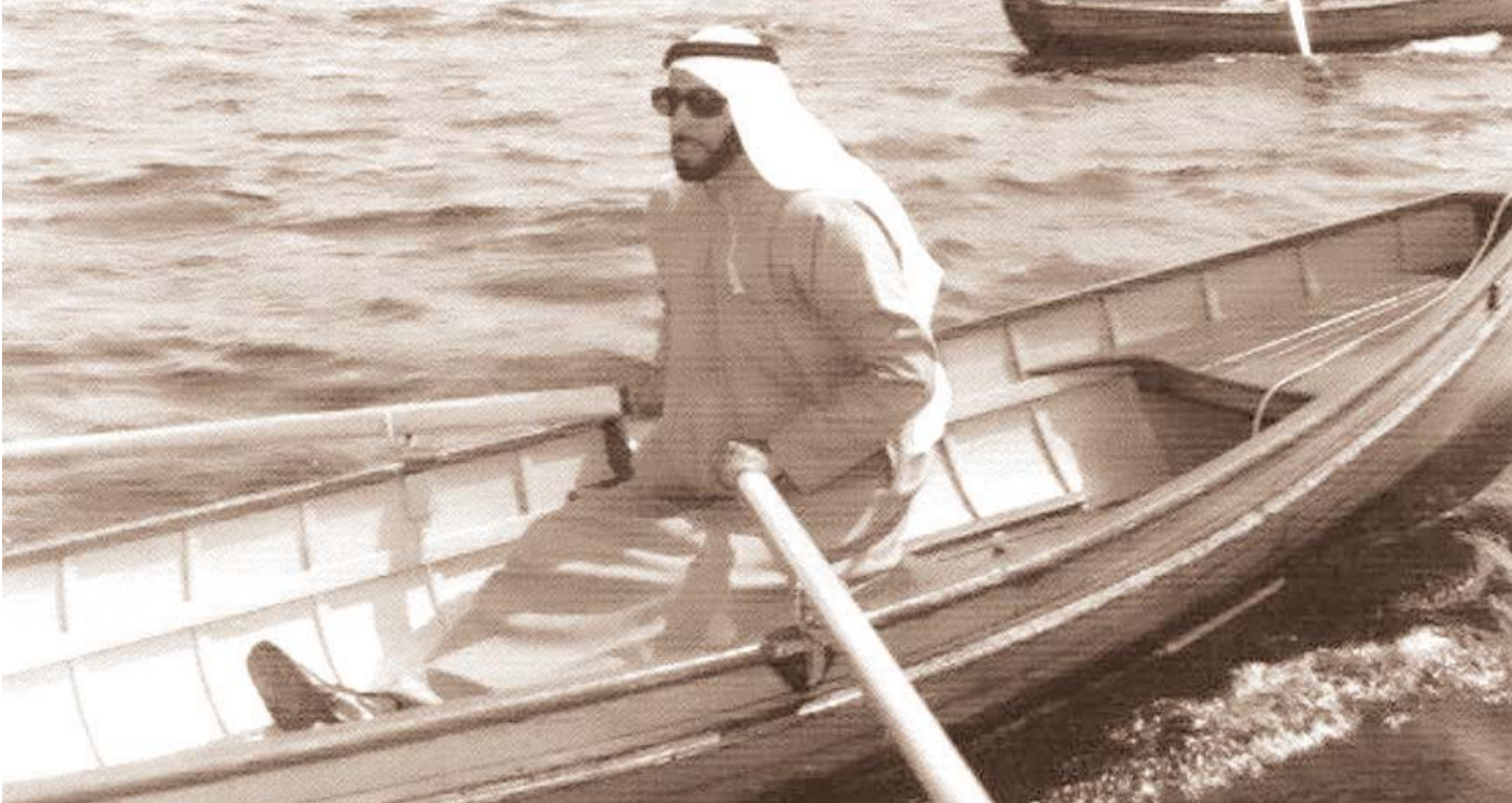
■ زايد أعاد إحياء الرياضات التراثية بما فيها التجديف