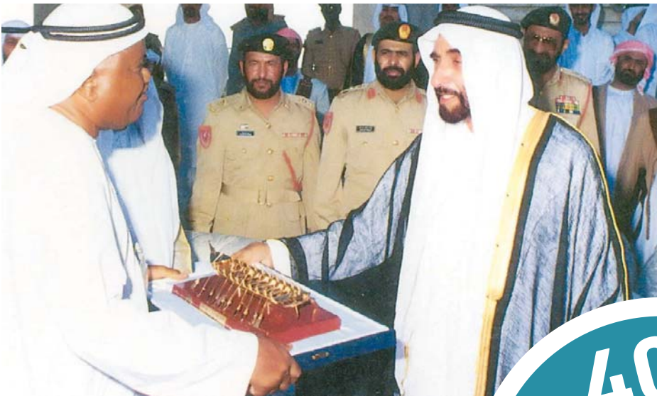
■ هدية تذكارية للفائزين بسباق القوارب

رياضات الشراع التراثية والحديثة وفي إطار السعي لتطوير المهارات البحرية لدى الناشئة والشباب في التجديف وركوب الزوارق السريعة وركوب القوارب الشراعية والمحامل الشراعية والقوارب الحديثة.