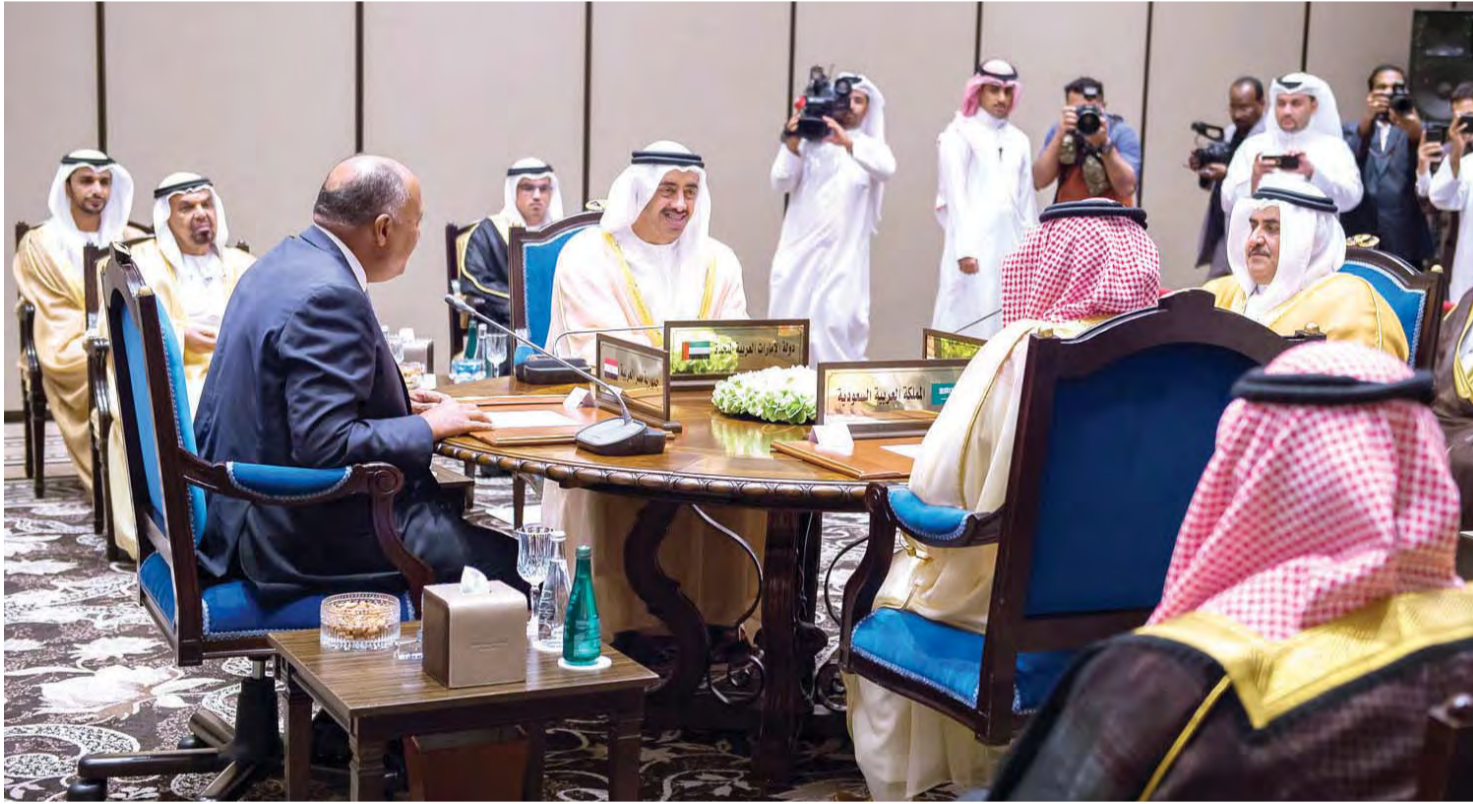
■ عبدالله بن زايد ووزراء خارجية السعودية والبحرين ومصر خلال اجتماع المنامة

■ البيان الختامي: المبادئ الستة تمثل الإجماع الدولي حيال مكافحة الإرهاب