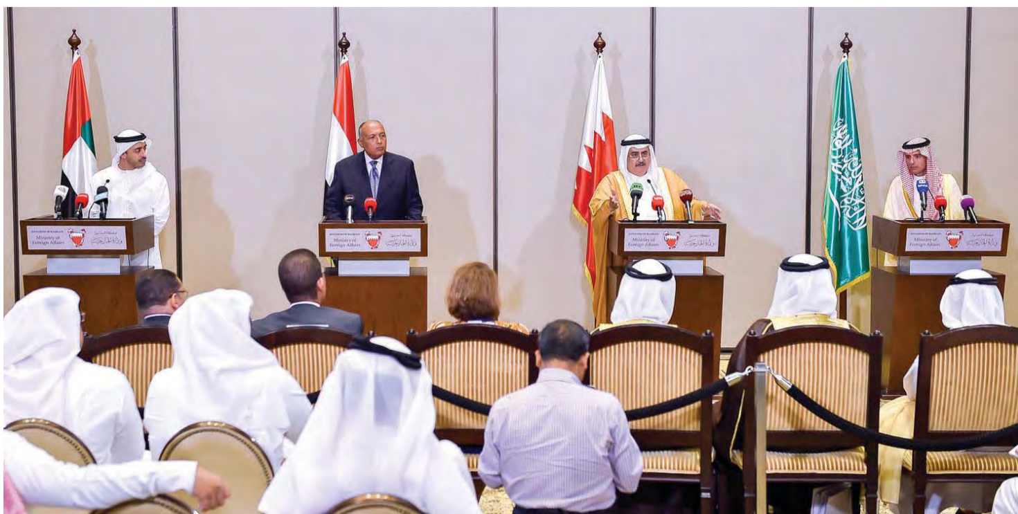
عبدالله بن زايد في المؤتمر الصحفي مع وزراء خارجية السعودية والبحرين ومصر

■ سموه: المسؤولية الأساسية في الأزمة تتحملها الدولة القطرية