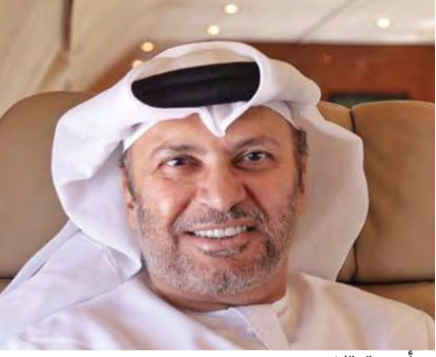
■ أنور قرقاش

أعرب معالي وزير الدولة للشؤون الخارجية د. أنور قرقاش، عن تمنياته بأن تتذكر قطر موقف صاحب السمو الشيخ محمد بن زايد آل نهيان، ولي عهد أبوظبي نائب القائد الأعلى للقوات المسلحة، الرجولي، مع أمير قطر الشيخ تميم، خلال اجتماع قياده الملك الراحل عبدالله بن عبدالعزيز آل سعود، ونصحت له ألا يخسر السعودية. وعاب قرقاش هجوم جريدة «الراية» المعيب على الشيخ محمد بن زايد، قائلاً: «بوخالد معدن نادر من الرجال في مواقفه وقراءته للأحداث وحرصه على الخليج»، موضحاً كيف أنه كان شاهداً على موقف الشيخ محمد بن زايد الرجولي مع الشيخ تميم، وكيف أنقذ الاجتماع في ذلك المفضل الصعب.