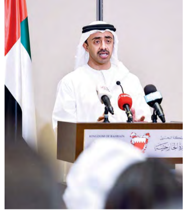
■ سموه خلال المؤتمر الصحفي في المنامة أمس

وأوضح وزير الخارجية السعودي أنه لا يوجد تفاوض حول المطالب الـ13 أو المبادئ الستة التي تم إصدارها في إعلان القاهرة، مؤكداً أنه «لا تفاوض حول دعم الإرهاب، فإما أن يكون هناك دعم للإرهاب أو لا يوجد، فلا نستطيع