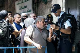
الاحتلال يعتدي على الفلسطينيين في الحرم القدسي