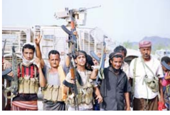
التحالف يدمر مخازن الانقلابيين في صعدة وعمران ونهم