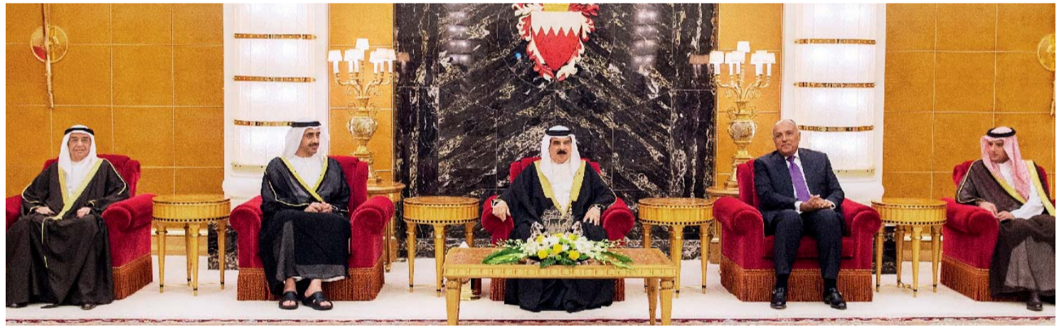
حمد بن عيسى خلال استقباله عبدالله بن زايد وعادل الجبير وسامح شكري في المنامة مساء أمس

وبحث العاهل البحريني مع وزراء الخارجية أبرز المستجدات الراهنة في المنطقة وتطورات الأحداث إقليمياً وعالمياً. في الأثناء، أعرب وزراء خارجية الدول الداعية لمكافحة الإرهاب خلال اللقاء، عن تطلعهم إلى أن يكون الاجتماع الذي يعقد اليوم خطوة مهمة تسهم في تقوية الموقف وتعزيز الجهود التي تقوم بها هذه الدول، مثنين المواقف الثابتة لملكة البحرين، ووقوفها إلى جانب قضايا الحق والعدل والدفاع عن قضايا أممتها العربية وإسهاماتها المشهوددة مع أشقائها في حماية الأمن والاستقرار في المنطقة.