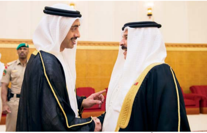
ملك البحرين مستقبلاً عبدالله بن زايد