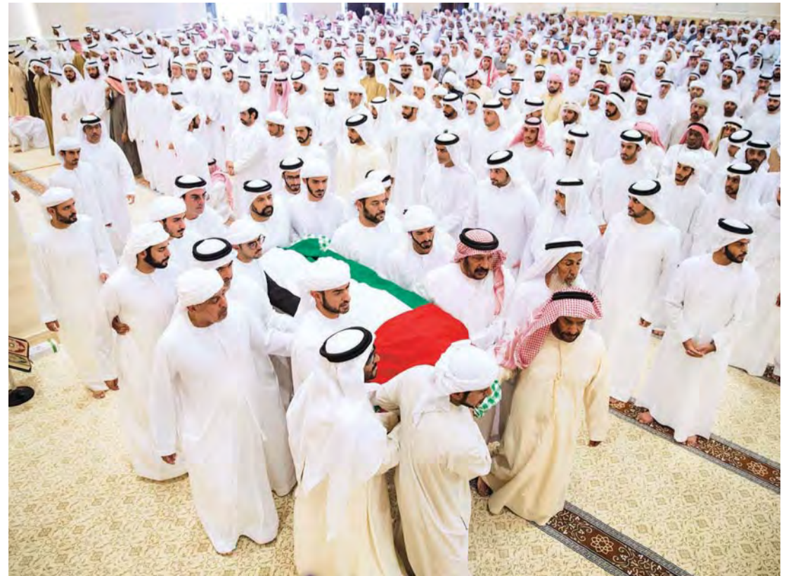
■ مكتوم وأحمد بن محمد بن راشد وسرور وسعيد بن محمد ونهيان بن مبارك والشيخوخ خلال تشيع الجنازة