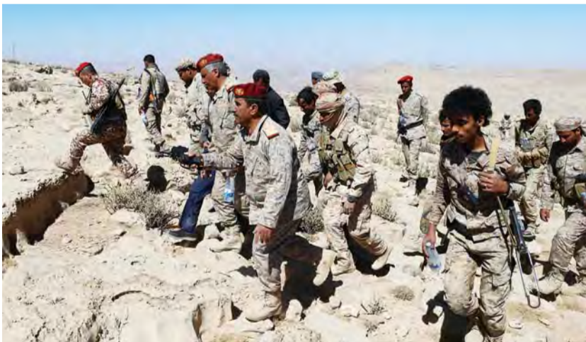
قيادات وعناصر من الشرعية في نقطة للجيش اليمني شرق صنعاء