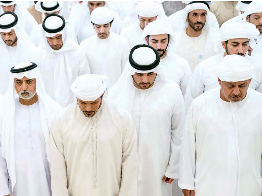
■ مكتوم بن محمد ونهيان بن زايد وسلطان بن خليفة ونهيان بن مبارك والشيخوخ خلال أداء صلاة الجنازة