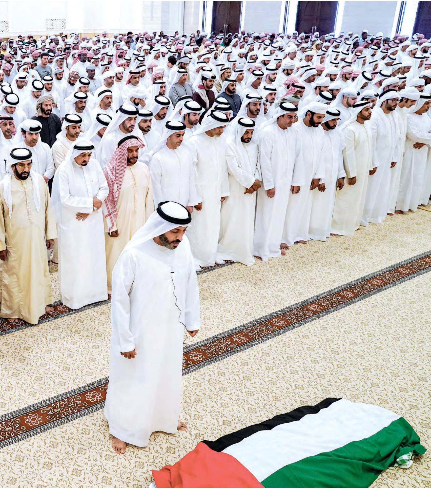
■ محمد بن راشد ومحمد بن زايد وحفيد النعيمي وسعود المعلا وعبدالله بن راشد المعلا وطحون وسرور بن محمد وسيف بن زايد ومحمد بن خليفة وسعيد بن محمد والشيخوخ وجموع المواطنين خلال أداء صلاة الجنازة

وقد شيع صاحب السمو الشيخ محمد بن زايد آل نهيان ولي عهد أبوظبي نائب القائد الأعلى للقوات المسلحة، وصاحب السمو الشيخ حمد بن محمد الشرقي عضو المجلس الأعلى حاكم الفجيرة، وصاحب السمو الشيخ سعود بن صقر القاسمي عضو المجلس الأعلى حاكم رأس الخيمة، وسمو الشيخ محمد بن حمد بن محمد الشرقي ولي عهد الفجيرة، وسمو الشيخ طحون بن محمد آل نهيان ممثل حاكم أبوظبي في منطقة العين، وسمو الشيخ سرور بن محمد آل نهيان.. الفقيدة إلى ثراها الأخير حيث ووري جثمانها الطاهر الثرى في مقبرة القصيدة وسط مدينة العين. شارك في التشيع سمو الشيخ نهيان بن زايد آل نهيان رئيس مجلس أمناء مؤسسة زايد بن سلطان آل نهيان للأعمال الخيرية والإنسانية، والفريق سمو الشيخ سيف بن زايد آل نهيان نائب رئيس مجلس الوزراء وزير الداخلية، وسمو الشيخ حامد بن زايد آل نهيان رئيس ديوان ولي عهد أبوظبي، وسمو الشيخ عمر بن زايد آل نهيان نائب رئيس مجلس أمناء مؤسسة زايد بن سلطان آل نهيان للأعمال الخيرية والإنسانية، وسمو الشيخ خالد بن زايد آل نهيان رئيس مجلس إدارة مؤسسة زايد العليا للرعاية الإنسانية وذوي الاحتياجات الخاصة، وسمو الشيخ الدكتور سلطان بن خليفة آل نهيان مستشار صاحب السمو رئيس الدولة وسمو الشيخ محمد بن خليفة آل نهيان عضو المجلس التنفيذي.