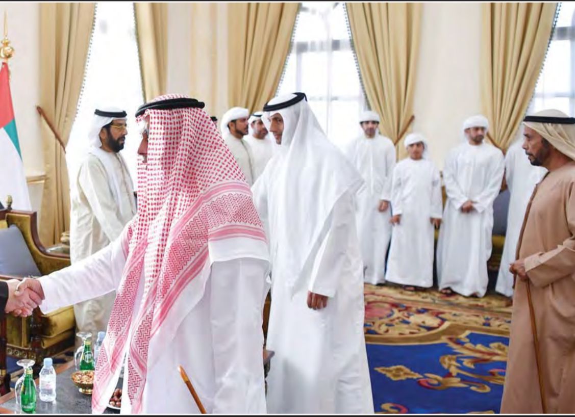
سلطان بن زايد يقدم واجب العزاء إلى طحنون بن محمد