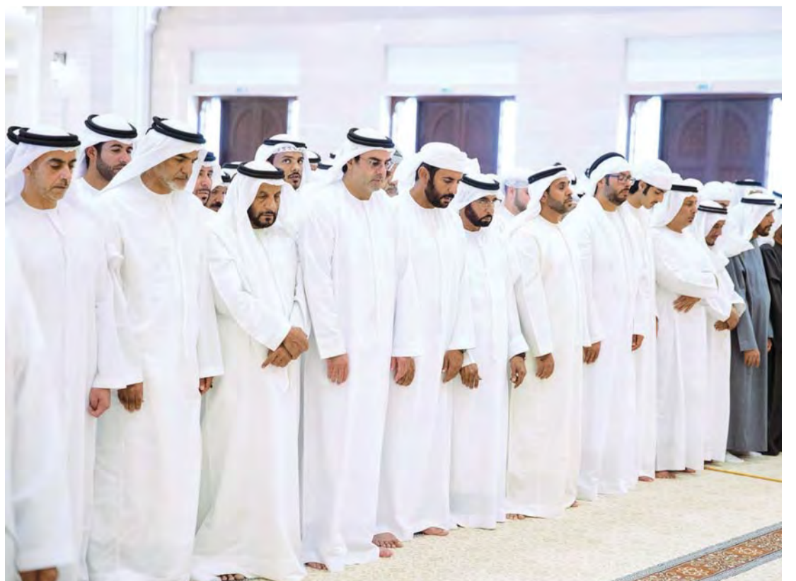
■ سيف بن زايد ومحمد بن خليفة آل نهيان وخليفة بن سيف بن محمد