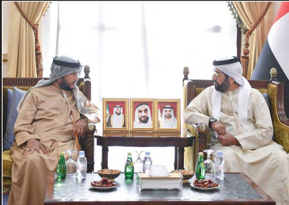
حمدان بن زايد يقدم واجب العزاء إلى طحنون بن محمد