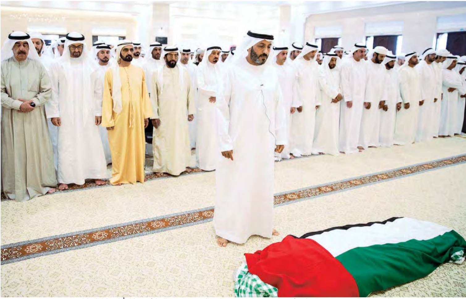
محمد بن راشد ومحمد بن زايد وحفيد التميمي وسعود المعلا ووطنون بن محمد وسيف بن زايد والشيخ وجموع المواطنين خلال أداء صلاة الجنازة على جثمان الفقيدة حصة بنت محمد