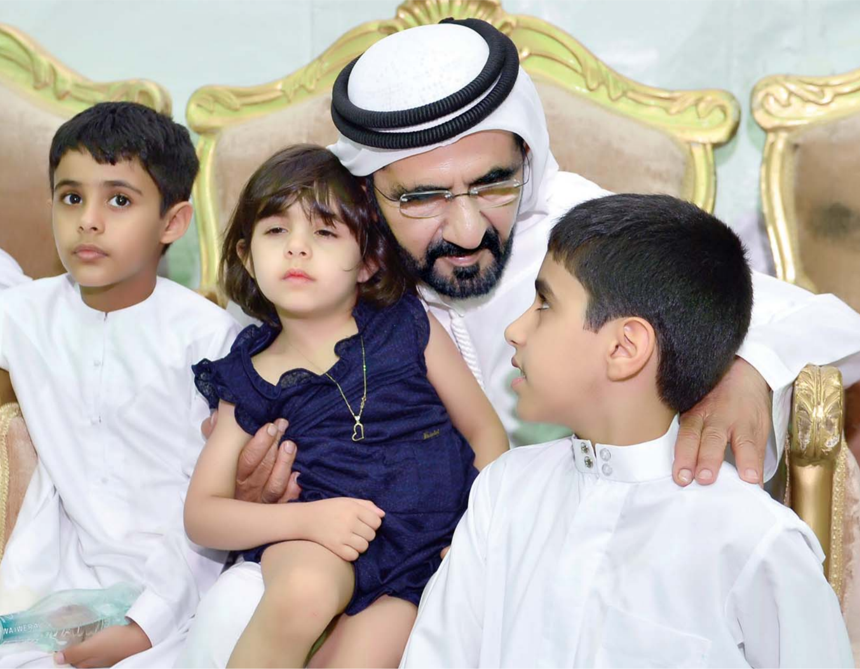
■ محمد بن راشد غرس في الأجيال عشق الوطن بأبوتة الحانية | أرشيفية