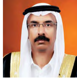
بقلم: محمد المر

وكان في كل مجهوداته القيادية يستوحى حكمة الأباء المؤسسين، ويثير حماسة القيادات الوطنية الشابة، ولا شك أن الالتفاتة الكريمة والنبيلة لصاحب السمو الشيخ محمد بن زايد آل نهيان لتحية أخيه صاحب السمو الشيخ محمد بن راشد آل مكتوم بمناسبة إكمال العقد 5 من تجربته القيادية الوطنية الرائدة، تستحق منا كل شكر وتقدير وثناء، ولا شك أن الأمم الكريمة والراقية هي التي تشكر قادتها الذين كانت مساهماتهم هي البوابات التي دخلت منها إلى عالم النهضة والتقدم والازدهار.