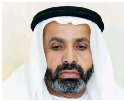
■ راشد النيايدي

واختتمت: «لا ننسى كأسر للشهداء ودعم واهتمام سموه الدائم بنا والشد على أيادينا، والتي تؤكد حرص وافتخار القيادة الرشيدة والاعتزاز بتضحيات الشهداء الذين قدموا أرواحهم ودماءهم الزكية فداء للوطن، ويجسد هذا النهج، معاني التلاحم بين شعب الإمارات وقيادته في السراء والضراء».