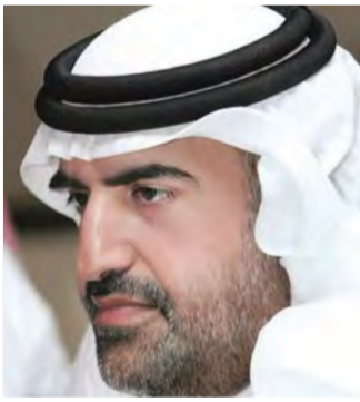
■ جمال بن حويرب

السمو الشيخ محمد بن راشد آل مكتوم بمناسبة إكمال سموه خمسين عاماً في خدمة الوطن، منذ أن تولي سموه أول مسؤولياته، قائداً لشرطة دبي، ليأتي رد ومجداً العهد والوعد على الإخلاص لهذا الوطن، والعمل من أجل رفعة ومجده وسؤدده. وأضاف الهاملي: إن وطناً تقود مسيرته مثل هذه القيادات الاستثنائية، التي تقدر عمل المخلصين، وتحفظ لهم مكانتهم، لهو وطن جدير بأن نشعر بالفخر لأننا ننتمي له، ونعيش على أرضه، نطلنا سماؤه، ونتنفس هواءه، وهو جدير بأن نحافظ على منجزاته، ونقدم أرواحنا فداء له. بورك هذا الوطن المعطاء، وبوركت قيادته الرشيدة، وهنئياً لصاحب السمو الشيخ محمد بن راشد آل مكتوم، كل هذا الحب والتقدير الذي يحظى به من قيادات الوطن وشعبه وأتمته.