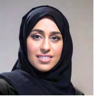
بقلم: حصّة بنت عيسى بوحميد وزيرة تنمية المجتمع

«50 عاماً للوطن» تعكس بعض إرادة صاحب السمو الشيخ محمد بن راشد آل مكتوم نائب رئيس الدولة رئيس مجلس الوزراء حاكم دبي، رعاة الله، في إعلاء قيم العطاء والبناء، لكنها لا تفي سموه حقاً يستحقّه بإجماع وطني وعربي وعالمي على حد سواء.. نصف قرن أمضاه صاحب السمو الشيخ محمد بن راشد آل مكتوم في خدمة الوطن منذ توليه أول مسؤوليّة «رئيساً لشرطة دبي». 5 عقود مضت مُبشّرة بعبقريته تزهو في أفق طموح دولة الإمارات الذي يتطلّع إلى المريح والقضاء.. تلك بعض المفردات التي أوجزها قاموس العطاء والريادة في مدرسة الإرادة والقيادة والسعادة التي شيّد أركانها صاحب السمو