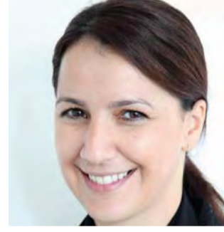
بقلم: مريم المهيري وزيرة دولة مسؤولة عن ملف الأمن الغذائي

يا صاحب السمو كمواطنة من دولة الإمارات، على أرض زايد لا نؤفيكم أجراً بما قدمتم وتقدمون لشعبكم من رضاء ونمو وتطوير وسعة عالمية، وتصدر دول العالم في العديد من القطاعات، وفي وقت قياسي. جعلكم الله لهذه الأرض نبياً صالحاً، وفضلاً من غيري، ورحمة طيبة تعم كل الأرجاء.