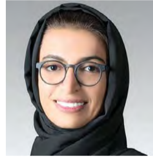
بقلم: نورة بنت محمد الكبي وزيرة الثقافة وتنمية المعرفة

بفكر محمد بن راشد ورؤيته نعبير إلى المستقبل، ونتخذ من الريادة والتميز سبيلاً لغد مشرق، ونتوّج طموحاتنا بإنجازات يفخر بها الوطن.