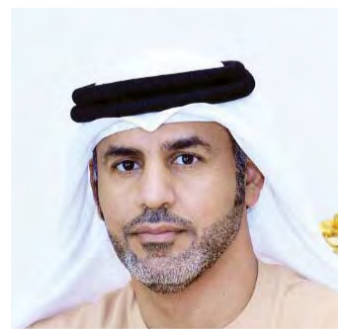
■ سند المقبالي

ناهمض بالوطن وقال الرئيس التنفيذي لشركة «ستاندرد العقارات»، عبدالكريم الملا: شكراً صاحب السمو الشيخ محمد بن راشد.. خمسون عاماً وسموك روح هذا الوطن ونبضه وقلبه وعينه وعقله، والرؤى التي تستشرف غد الإمارات بكل وعي وإيمان وحسب، فمن صفت عقيدته أنفاسك سيدي في طول الوطن وعرضه وكل جهاته.