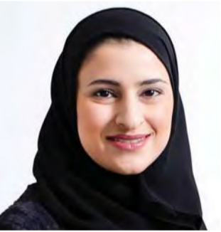
بقلم: سارة الأميري وزيرة دولة

شعورٌ بالفخر والحب والاعتزاز إغتراني عندما بدأت أكتب مقالتي هذا، وكيف لي أن أصف إنجازات من العمل الوطني لسيدي صاحب السمو الشيخ محمد بن راشد آل مكتوم، نائب رئيس الدولة، رئيس مجلس الوزراء، حاكم دبي، رعاة الله، ذلك الرجل الذي علمنا معنى العمل الوطني، والذي صنع منا قادة ومسؤولين نُفكر برؤيته ونسير على درب هو صنعه؛ لنمو وتقدم وطننا العظيم.