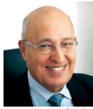
■ نبيل شعث

ما جعل دولة الإمارات تشهد انفتاحاً واسعاً وغير مسبوق على العالم الخارجي، كما أثمر شركات استراتيجية، في تنفيذ المشاريع التنموية والحيوية والاستثنائية.