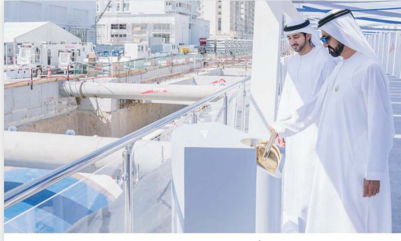
أخي محمد بن راشد..

بمثلك نفخر ويفخر الوطن.. تبقى الأخ والمعلم والمعلم.. وشريك مسيرة التنمية.. ومن قيمك وخصالك ينهل أبناء الوطن.. ومن تهجك نتعلم نبل العطاء وعبر الحياة