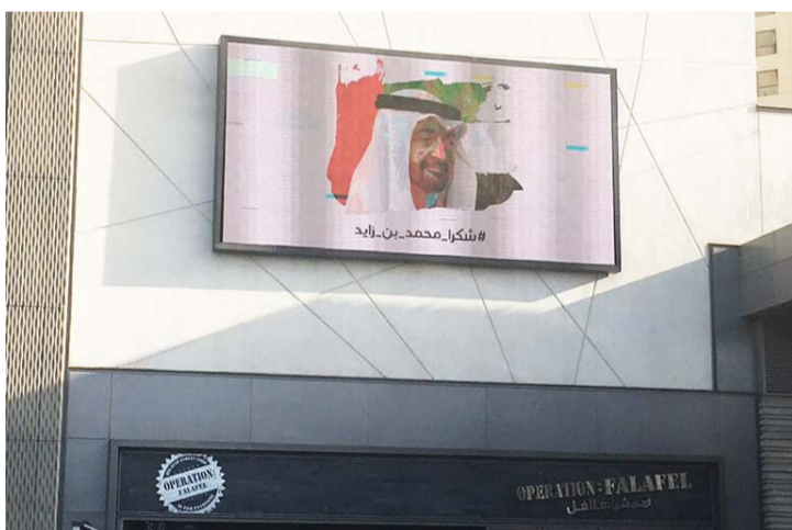
لوحات الحملة تتوج واجهات المحال التجارية