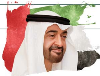
#شكراً.. محمد بن زايد