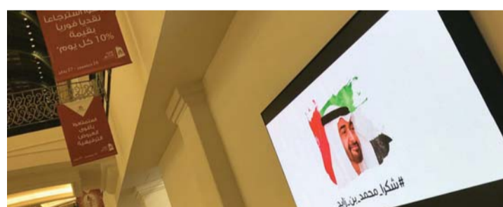
المراكز التجارية التابعة لمجاذ الفطيم تتفاعل مع الحملة