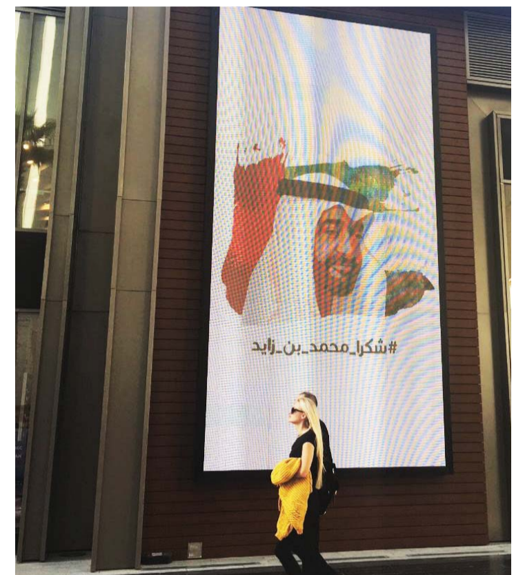
#شكراً محمد بن زايد تزين واجهات المراكز التجارية