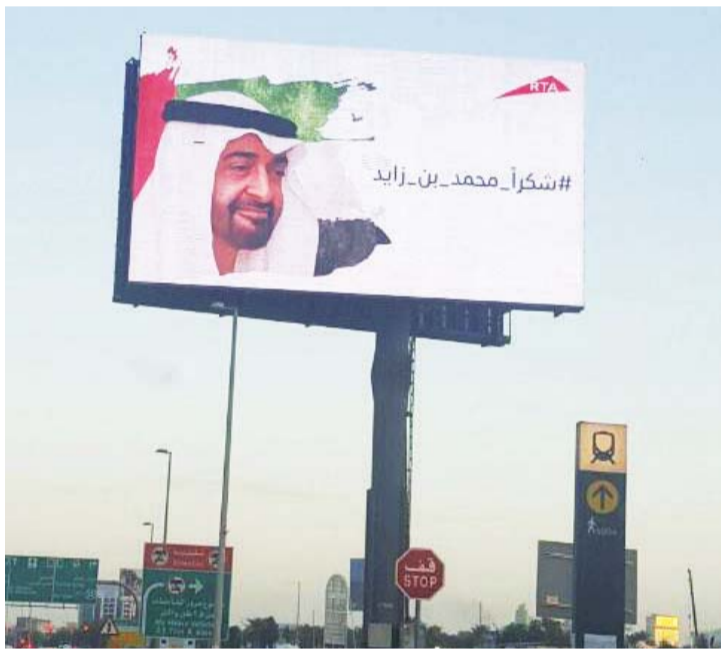
جانب من مشاركة «طرق دبي» في الحملة الوطنية