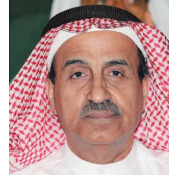
■ راشد الكشف

شكراً على عملكم الدؤوب ل نهضة الوطن سائرين على نهج القادة المؤسسين زايد وراشد، طيب الله ثراهما، وفي ظل القيادة الرشيدة لصاحب السمو الشيخ خليفة بن زايد آل نهيان، حفظه الله، واثقون بأننا بقبائدتكم ماضون في درب التنمية بأمن وأمان وحكومة تضع المواطن في أول سلم أولوياتها، شكراً لكم في بداية عام زايد؛ عام نسترجع فيه مآثر القائد المؤسس كما نعتز بدولتنا التي أصبحت محط أنظار العالم بقبائدتكم وإخوانكم حفظكم الله.