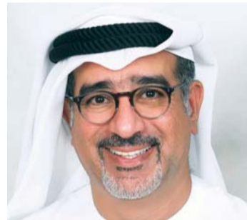
■ عبد الفتاح شرف

دولتنا من تلامح ومحبية بين قاداتنا، لنمضي جميعاً في مسيرة البناء والعمل مع دخول عام 2018، (عام زايد)، وكلنا إيمان وعزيمة على أن نحقق المزيد من الإنجازات، بفضل الدعم الذي نلقاه من قاداتنا». التنمية المستدامة وبدوره، قال علي الجاسم، الرئيس التنفيذي لشركة «الاتحاد إسكو»: «نتقدم بأسمى آيات التهنية والتبريكات لصاحب السمو الشيخ محمد بن راشد آل مكتوم، نائب رئيس الدولة رئيس مجلس الوزراء حاكم دبي، رعاه الله، بمناسبة الذكرى الثانية عشرة لتولي سموه مقاليد الحكم في إمارة دبي، لحققت خلالها الإمارة إنجازات كبيرة في المجالات والإبداع، وتحفز النمو والتنمية». ونود أن نعبر عن دعمنا الكامل لحملة صاحب السمو الشيخ محمد بن راشد آل مكتوم الوطنية، لشكر صاحب السمو الشيخ محمد بن زايد آل نهيان، ولي عهد أبوظبي نائب القائد الأعلى للقوات المسلحة، على خدماته وطنه وسعيه الدؤوب للإسعاد شعب دولة الإمارات والعقيمين على أرضها، حيث نحرض في هذا المقام على توجيه التحية لسموه ولي عهد أبوظبي على قيادته الحكيمة، وتفايه في العمل على رفعة دولة الإمارات وتطويرها وازدهارها.