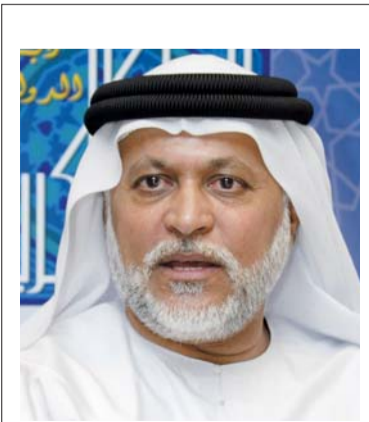
يقلم: إبراهيم محمد بوملحه

نحن محظوظون بهما من دون أدنى شك ولا مجال، محسودون عليهما.. نسمع عنهما آيات الشكر والتناء والمدح والإطراء والتغني بمآثرهما ومكارمهما أينما كنا.. ولا شك، فإن مآثرهما البارزة وإنجازاتها الماثلة وتصرفاتهما المعهودة، كل ذلك شاهد على ما لهما من المناقب والمكارم والخصائص التي تعلي من شأنهما، وتزيد من حبهما، وتبين عن صورتها في أعين الناس.. ألم ندرك ذلك المغزى الطيب وتأثيره العاطفي في كل من يشاهده حين يمر محمد بن راشد ومحمد بن زايد على أسر الشهداء أسرة أسرة لتعزيهم وتسرية الحزن عن قلوبهم المكلومة، بتلك اللسان الحنون والقبلة الصادقة واحتضان الأطفال والكبار، وزيارة المصابين وتقبييل أيديهم