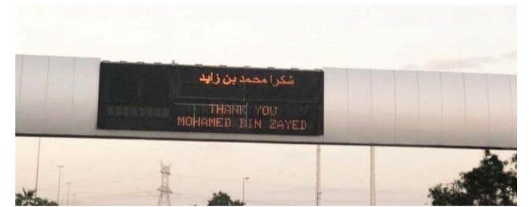
تفاعل مع الحملة عبر لوحات طرق دبي الذكية