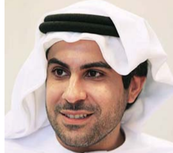
■ بدر العلماء