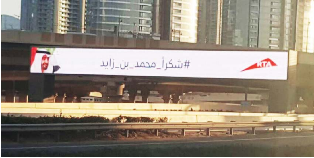
هيئة الطرق بدبي.. حضور ممتد في الحملة