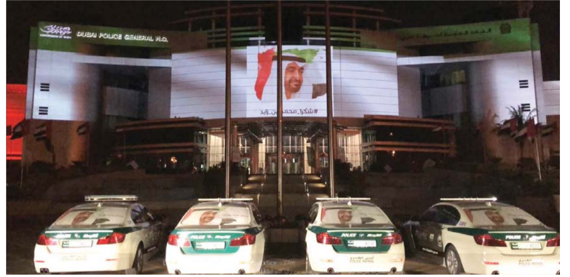
جانب من مشاركة شرطة دبي في حملة #شكراً محمد بن زايد | البيان