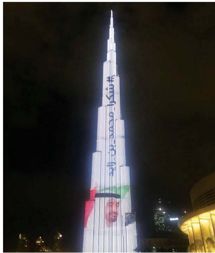
برج خليفة.. شكراً لسمو المجد والشموخ