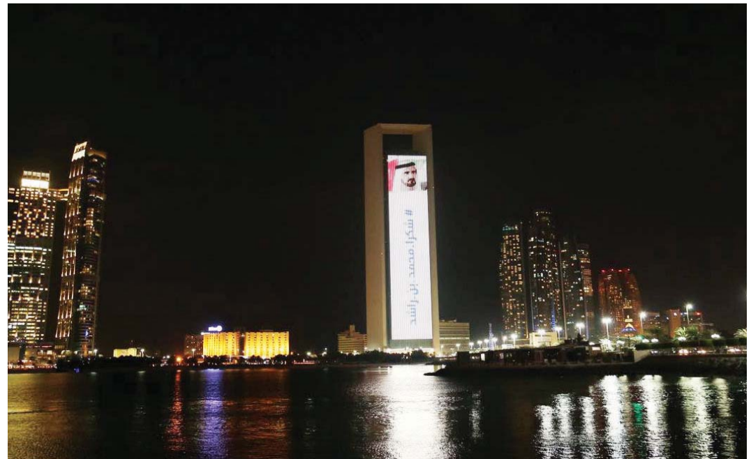
#شكراً محمد بن راشد على مبني أدنوك في أبو ظبي

شاركت شركة بترول أبوظبي الوطنية «أدنوك» مساء أمس في مبادرة «شكراً محمد بن زايد» تماشياً مع الدعوة التي أطلقها صاحب السمو الشيخ محمد بن راشد آل مكتوم نائب رئيس الدولة رئيس مجلس الوزراء حاكم دبي «رعاه الله». وعرضت «أدنوك» مساء امس مادة مصورة على واجهة المبني الرئيسي للشركة تضمنت صوراً للأب المؤسس الشيخ زايد بن سلطان آل نهيان طيب الله ثراه؛ وصاحب السمو الشيخ خليفة بن زايد آل نهيان رئيس الدولة «حفظه الله»، وصاحب السمو الشيخ محمد بن راشد آل مكتوم نائب رئيس الدولة رئيس مجلس الوزراء حاكم دبي «رعاه الله»، وصاحب السمو الشيخ محمد بن زايد آل نهيان ولي عهد أبوظبي نائب القائد الأعلى للقوات المسلحة.