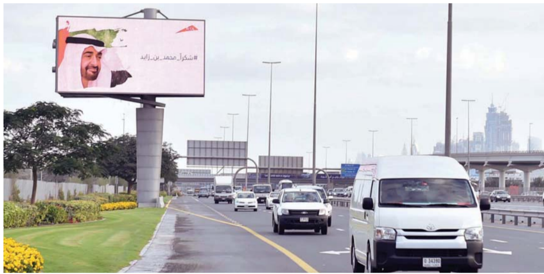
#شكراً محمد بن زايد على لوحات الشوارع الضوئية | من المصدر

تأتي في إطار حرصها على مشاركتها في المبادرات الوطنية، والتي تعكس أصالة شعب الإمارات وانتمائه لقيادته الرشيدة.