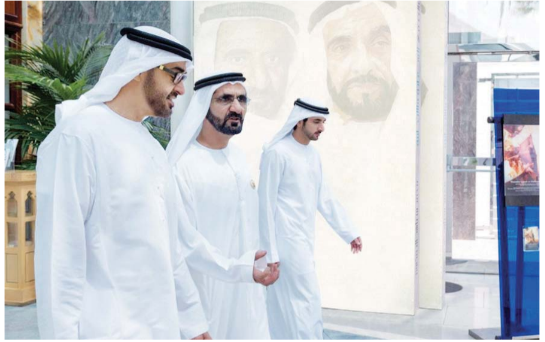
#قيادة الإمارات تضع الخطط الاستراتيجية وتستشرف المستقبل بحكمة | من المصدر