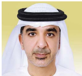
■ راشد المطوق

قالت نشرة «أخبار الساعة» إن الرسالة التي وجهها صاحب السمو الشيخ محمد بن راشد آل مكتوم نائب رئيس الدولة رئيس مجلس الوزراء حاكم دبي رعاه الله، إلى أخيه صاحب السمو الشيخ محمد بن زايد آل نهيان ولي عهد أبوظبي نائب القائد الأعلى للقوات المسلحة بعنوان «شكراً محمد بن زايد» تتضمن كل معاني التقدير والامتنان والاعتزاز والفخر ليس فقط لأنها تبرز الجهود الجبارة التي يقوم بها صاحب السمو الشيخ محمد بن زايد من أجل سعادة المواطنين والعمل على رفعة شأن الإمارات وتعزيز مكانتها على الصعيدين الإقليمي والدولي، وإنما أيضاً لأنها تدعو أبناء الوطن جميعهم للمشاركة في توجيه الشكر لسموه عبر كلمة مخصصة أو صورة معبرة أو لفظة طيبة تعبر عن الامتنان لهذا القائد العظيم الذي لا يألو جهداً من