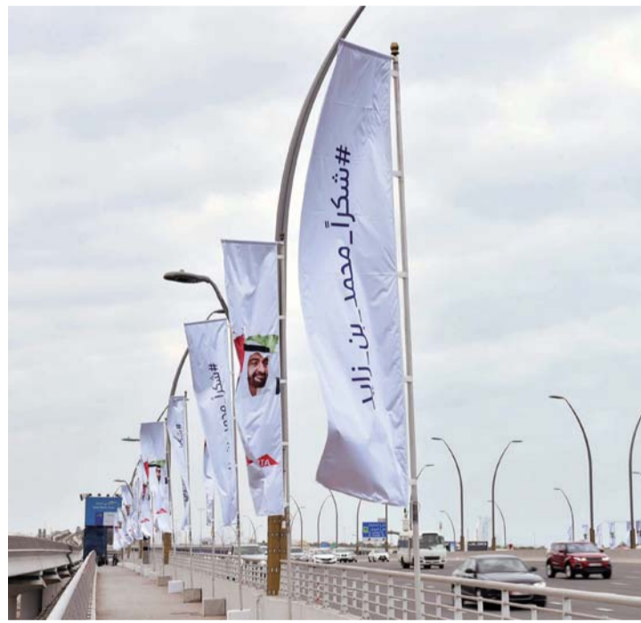
#شكراً محمد بن زايد على أعلام الجسور

وأكدت هيئة الطرق والمواصلات أن استجابتها لدعوة صاحب السمو الشيخ محمد بن راشد آل مكتوم، رعاه الله، «شكراً محمد بن زايد»،