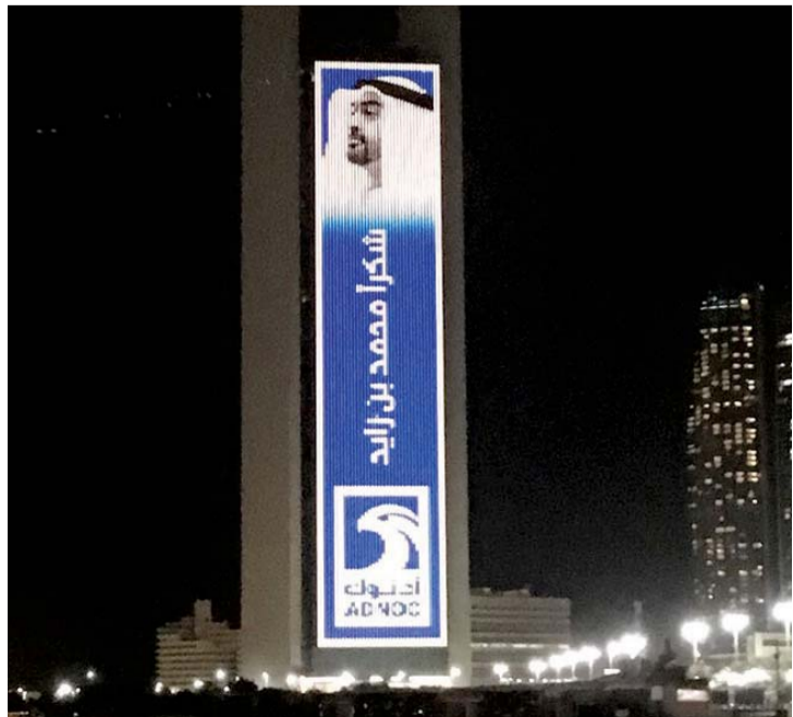
#.. وشكراً محمد بن زايد على واجهة المبني | وام