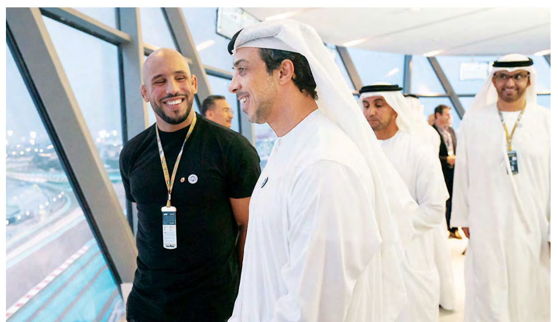
■ منصور بن زايد خلال حضوره الجولة الختامية بحضور سلطان الجابر