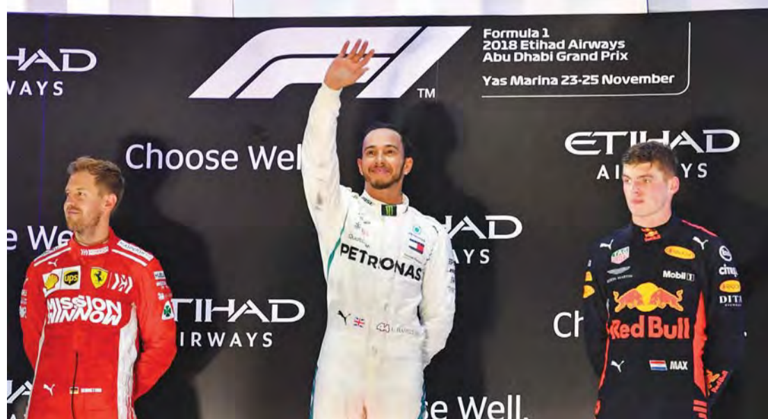
الأبطال هاميلتون وفيتل وفيرستابن على منصة التتويج

بطولة العالم للفورمولا 1، إذ سطع مجدداً نجمه في سباق جائزة الاتحاد للطيران الكبرى للفورمولا 1 في أبوظبي، بعدما قدم أداءً رائعاً مثبناً تفوقه وعلو كعبه على منافسيه بعد يوم حافل بالإثارة والأحداث التي شهدتها حلبة مرسى ياس، ليثبت مجدداً كفاءته بحسم لقب بطولة العالم للفورمولا 1 من خلال تحقيقه المركز الأول في السباق الجولة الختامية لسباق جائزة الاتحاد للطيران الكبرى للفورمولا 1 في أبوظبي.