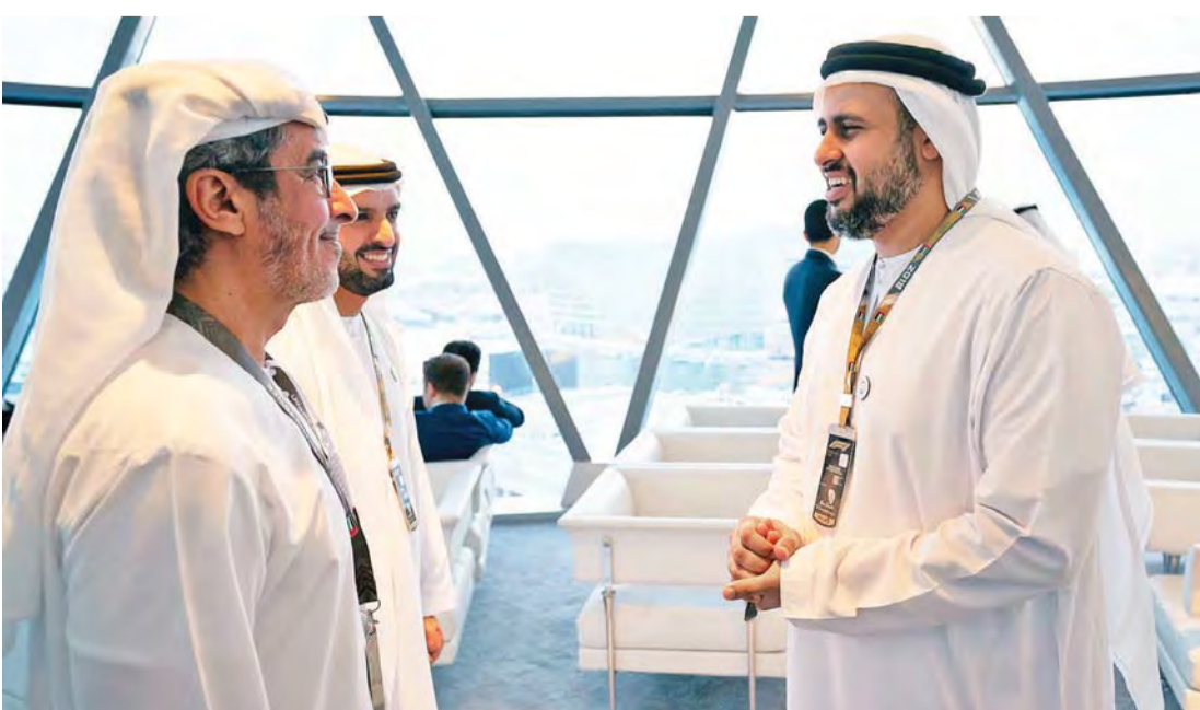
■ ذياب بن محمد بن زايد وراشد بن حمدان آل نهيان