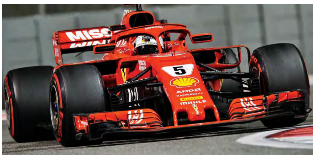
«بيريلي» وشراكة جديدة مع الفورمولا 1 | البيان

خضعت الإطارات الجديدة إلى التجربة في عدة دول خلال العام الحالي، حيث تهدف الشركة من خلال هذه الإطارات إلى مقاومة الارتفاع الكبير في درجات الحرارة الذي يتعرض له، إلى جانب تعزيز ديناميكية الحركة لدى سيارة الفورمولا 1. وقال تقيس كاري الرئيس التنفيذي لفورمولا 1: «يسعدنا التوصل إلى هذا الاتفاق الذي يضمن مستقبلاً طويل الأمد لأحد المكونات الرئيسية في فورمولا 1». وأكدت شركة بيريلي التزامها بالعمل لتنفيذ الاشتراطات الفنية الجديدة المتوقعة لعام 2021 ومن بينها إطارات 18 بوصة». ويل سميث يؤازر صديقه هاميلتون