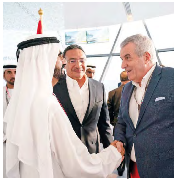
■ محمد بن راشد مرحباً بضيوف الدولة بحضور سلطان السبوسي

كما حضر ختام المنافسات سمو الشيخ حمدان بن محمد بن راشد آل مكتوم، ولي عهد دبي، وسمو الشيخ عبدالله بن راشد المعلا، نائب حاكم أم القيوين، ومعالي الدكتورة أمل عبدالله القبيسي رئيسة المجلس الوطني الاتحادي، وسمو الشيخ طحنون بن محمد آل نهيان، ممثل الحاكم في منطقة العين، وسمو الشيخ سرور بن