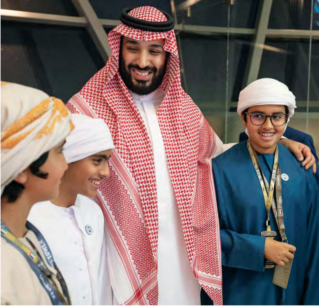
■ محمد بن سلمان في لحظة تذكارية مع زايد ومحمد بن عبدالله بن زايد وزايد بن نهيان بن زايد