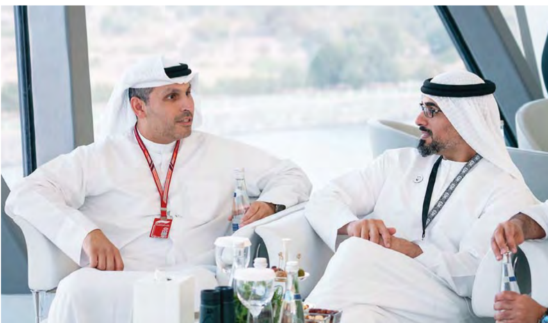
■ خالد بن محمد بن زايد وخلدون المبارك