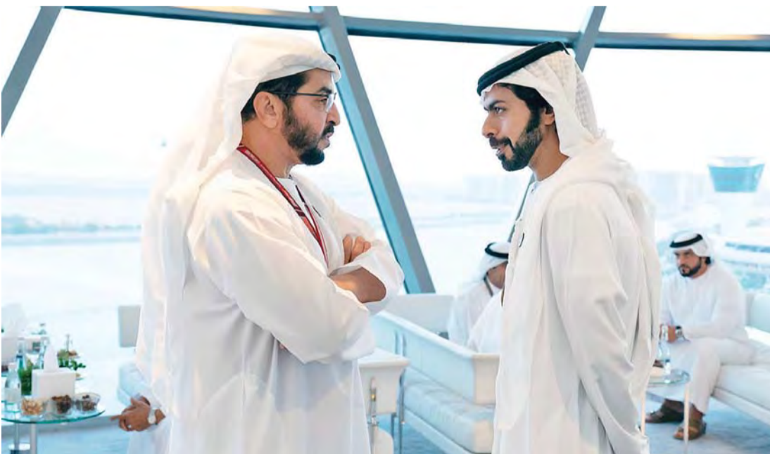
■ حمدان بن زايد في حديث مع خليفة بن طحون

كتب سمو الشيخ هزاع بن زايد آل نهيان، نائب رئيس المجلس التنفيذي لإمارة أبوظبي، على حساب سموه في موقع التواصل الاجتماعي «تويتر»: «رزنا فعاليات سباقات الفورمولا 1 التي تستضيفها أبوظبي بنجاح كبير، لتثبت مجدداً أن أبوظبي عاصمة الإمارات بما تمتلكه من بنية تحتية رياضية واقتصادية وثقافية وعلمية متطورة، أصبحت مركزاً ومقصداً عالمياً، وبرؤية الشيخ محمد بن راشد والشيخ محمد بن زايد يزداد التألق وتزهو الإنجازات.»