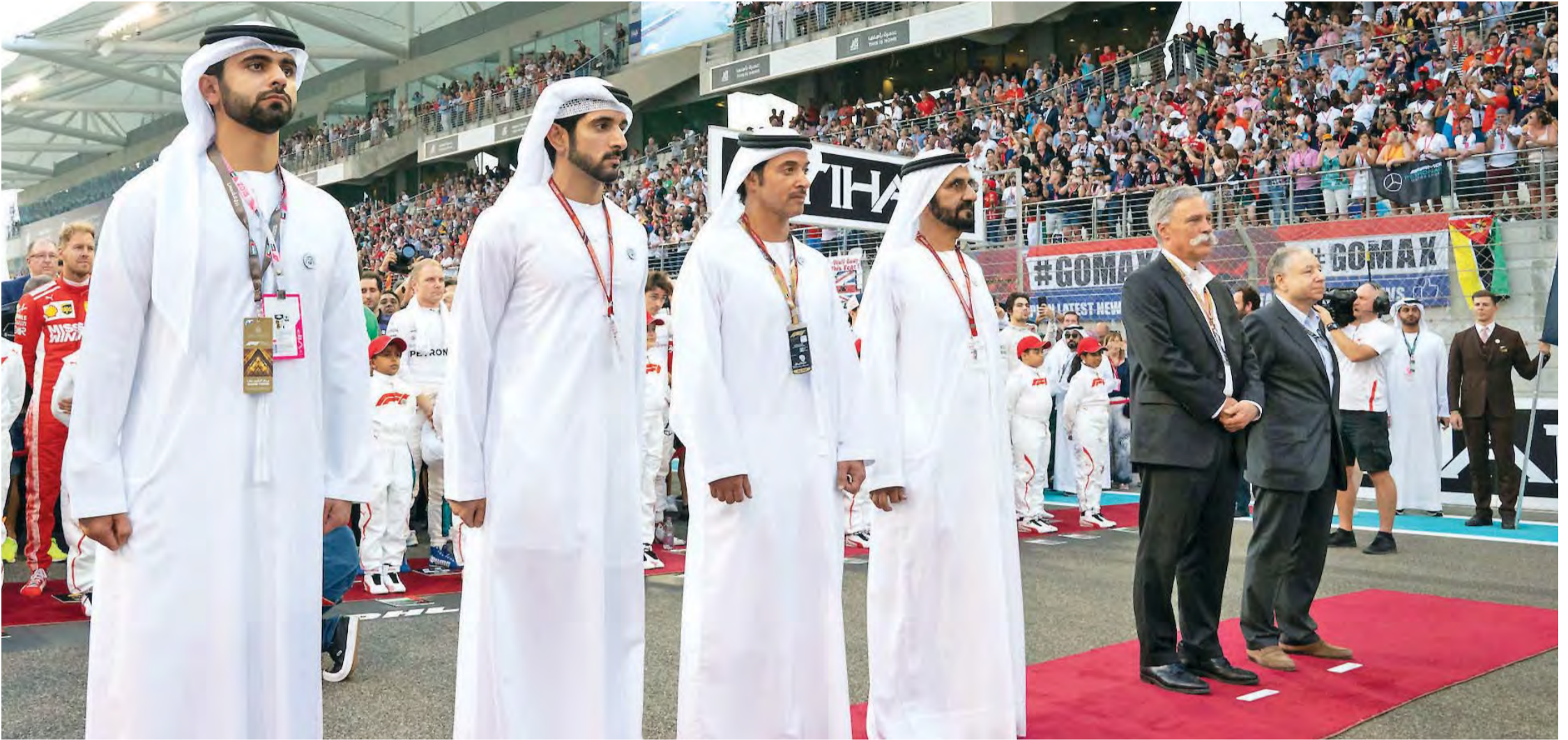
■ محمد بن راشد خلال حفل انطلاق الجولة الختامية للفورمولا 1 بحضور حمدان بن محمد وهزاع بن زايد ومنصور بن محمد