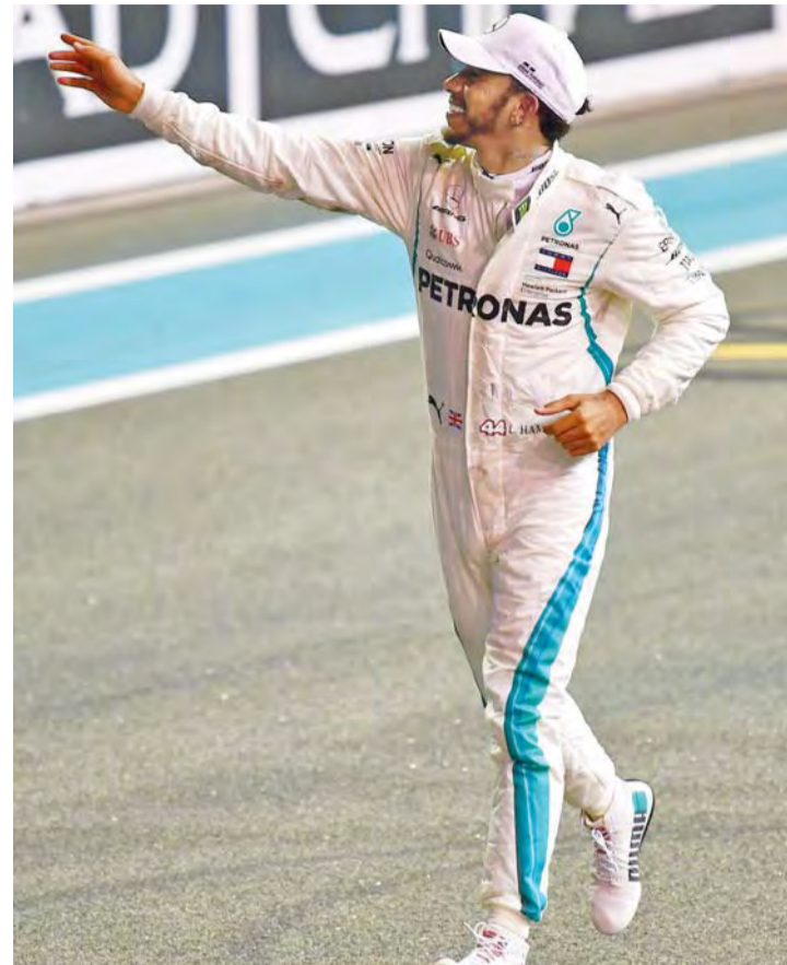
هاميلتون يحتفل باللقب