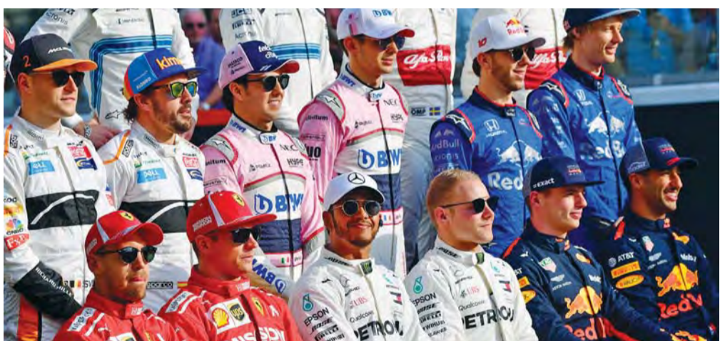
أبطال الفورمولا 1 في صورة تذكارية

مرتين عامي 2005 و2007 في حفل عشاء حضره عدد كبير من وسائل الإعلام العالمية ومحبو وعشاق أونسو على شرف وداعه للفورمولا 1 تقديراً للسائق الإسباني الذي حقق العديد من الإنجازات في عالم الفورمولا 1. وأهدى الطارق العامري الرئيس التنفيذي لحلبة مرسى ياس هدية تذكارية من الحلبة إلى أونسو عبارة عن لوحة تستعرض مسيرة النجم الإسباني طوال مشواره في عالم