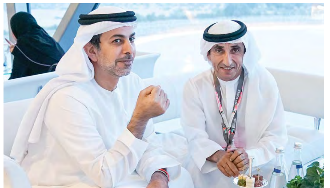
■ عمر بن زايد وسعيد بن مكتوم