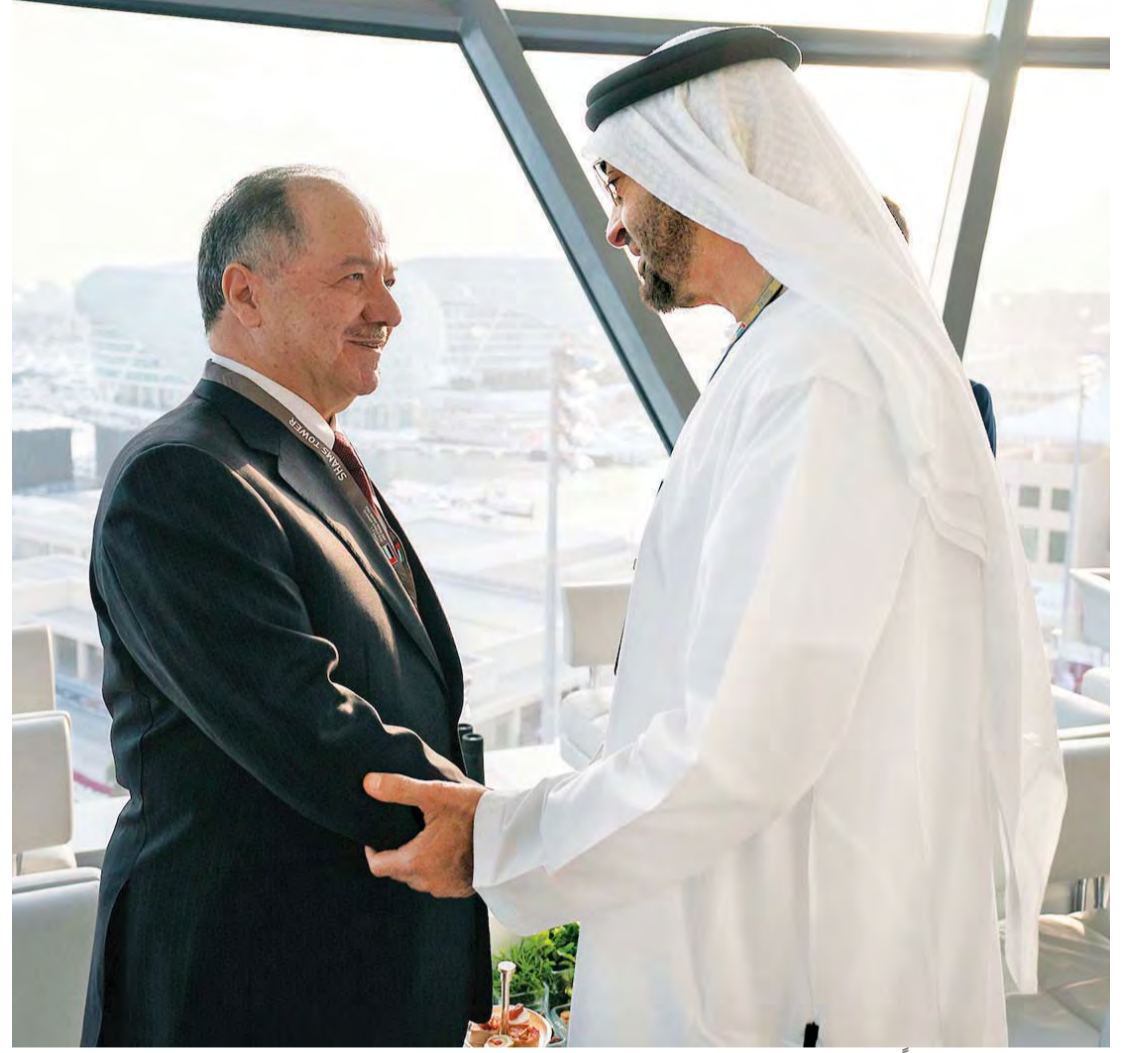
■ محمد بن زايد مصافحاً مسعود برزاني