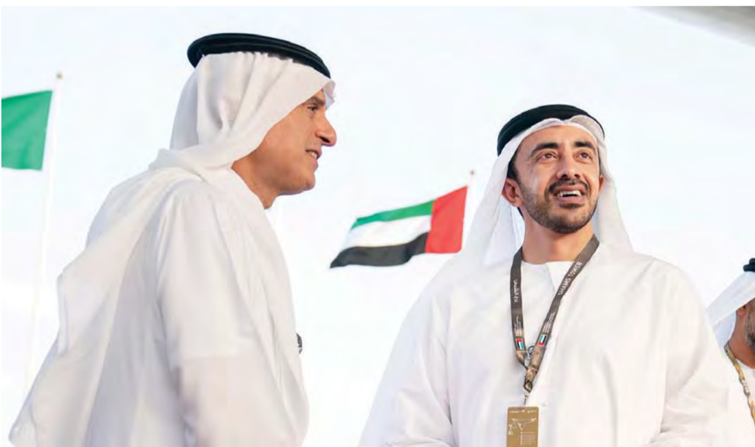
■ عبدالله بن زايد وعادل الجبير