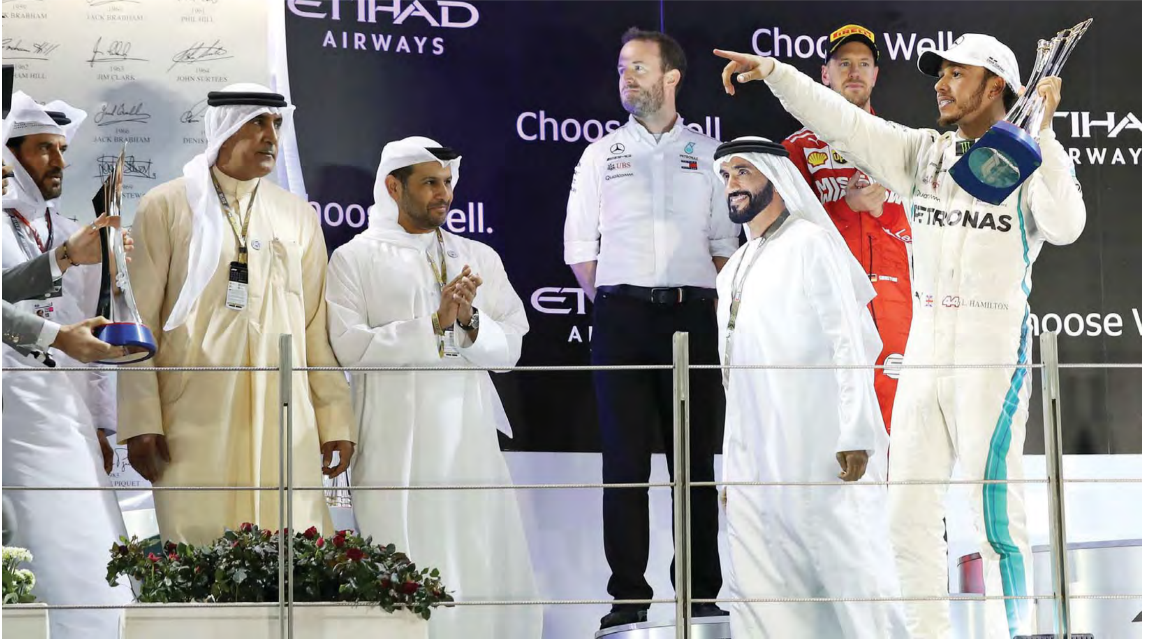
نهيان بن زايد يتوج البريطاني هاميلتون بحضور سيف الهاجري ومحمد الرميثي ومحمد بن سليم

وأضاف: «شهدنا أربعة أيام حافلة بالأنشطة الترفيهية الرائعة في مختلف أرجاء حلبة مرسى ياس، ابتداءً من أحداث الإثارة على مسار السباق الذي شهد سباقات فورمولا 1 وفورمولا 2 وجي بي 3، ووصولاً إلى الفعاليات المتنوعة في مناطق الواحات، وانتهاءً بحفلات ما بعد السباق التي أمتعت الجميع على مدى أربعة أيام متواصلة».