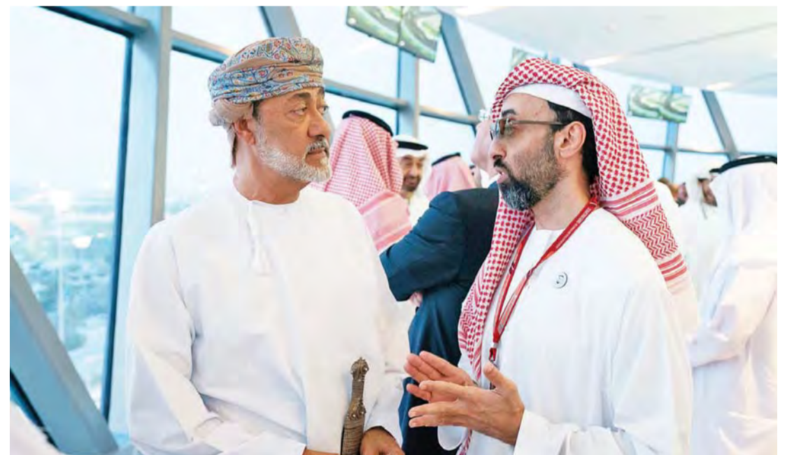
■ طحنون بن زايد وهيثم بن طارق