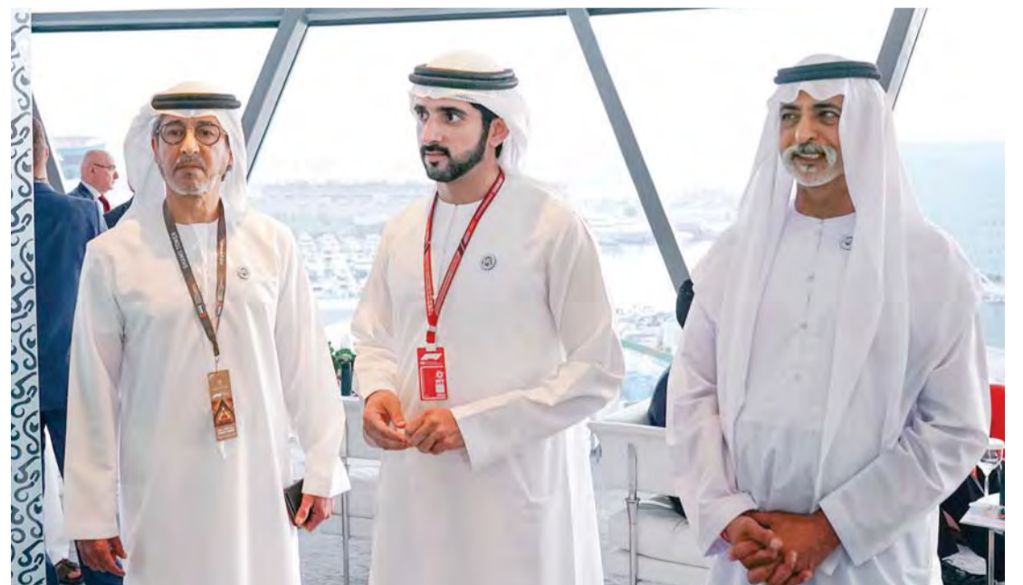
■ حمدان بن محمد ونهيان بن مبارك وراشد بن حمدان آل نهيان