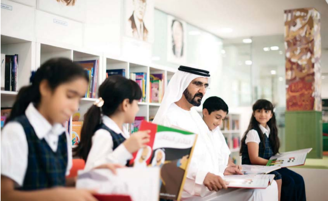
■ محمد بن راشد حريص على تشجيع القراءة لدى الأجيال

المتبحر في سياسة صاحب السمو الشيخ محمد بن راشد يدرك أنه صاحب أفعال وليس أقوالاً فقط، وإيمان سموه بقدرته الثقافة على التغيير استطاع أن يترجمه على أرض الواقع، عبر العديد من المبادرات، يقف على رأسها تحدي القراءة العربي، ذاك المشروع الذي استطاع، خلال سنوات ثلاث فقط، تحقيق قفزات نوعية، ليصبح بارقة أمل في عيون الطلبة