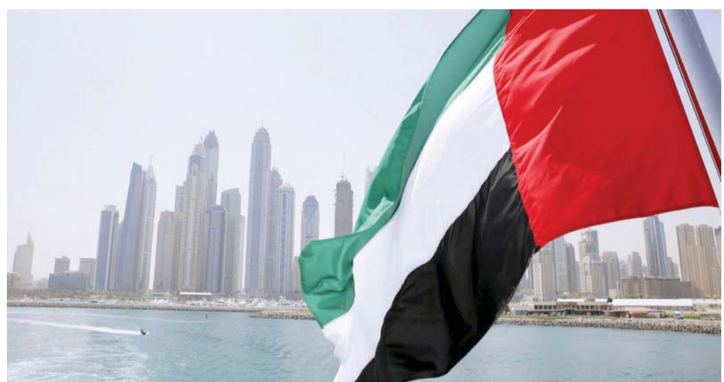
■ القيادة الرشيدة تسير على نهج الآباء المؤسسين | أرشيفية

حدث آخر متميز شهدته الدولة في أكتوبر، وجاء في سياق البرنامج الفضائي الإماراتي، حيث أطلقت الإمارات القمر الصناعي خليفة سات من اليابان، في ما يعتبر الأول الذي صنع بأيد إماراتية. استغرق تصنيع القمر الصناعي أربعة أعوام من التجهيز والاستعداد والتدريب لفريق مركز محمد بن راشد للفضاء، ويمتلك القمر خمس براءات اختراع، وسيقدم صوراً فضائية عالية الجودة والوضوح، وقد كانت «نخلة جيمرا»، أول صورة يلتقطها «خليفة سات»، وذلك عند مروره فوق الإمارات على ارتفاع 613 كيلومتراً تقريباً، حيث يدور بسرعة تبلغ سبعة كيلومترات في الثانية.