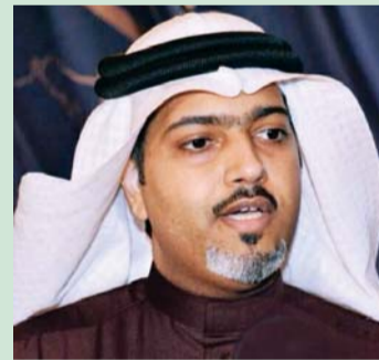
■ راشد الغائب

أه شاعر وأدب ومفكر وسياسي من الطراز الأول. وتابع: «لقد كنا نذهب بالسابق لزيارة الغرب، والاطلاع على تجاربهم وحقولهم المعرفية المختلفة، لكنه، بفضل من سموه، أصبح الغربيون من أتون إلينا، ليروا بأعينهم كيف هي إمارة دبي العالمية في كل شيء التي أضحت نافذة يطل من خلالها شعوب العالم المتحضرة، لمعرفة إلى أين وصلت النهضة