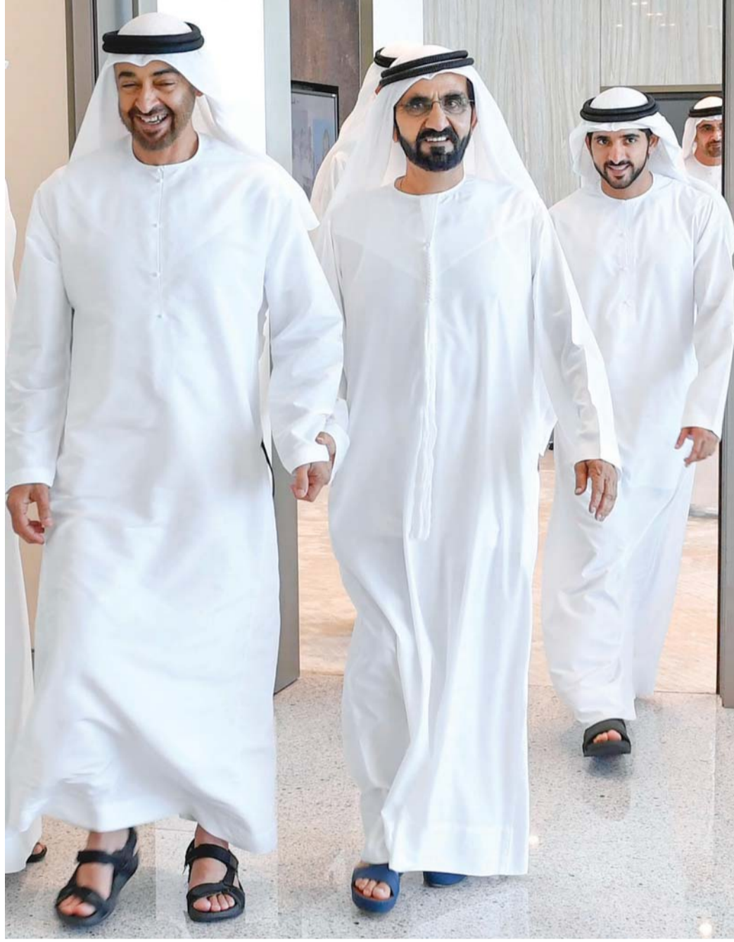
محمد بن راشد ومحمد بن زايد وحمدان بن محمد... الهدف مجد وعرّة الإمارات | البيان