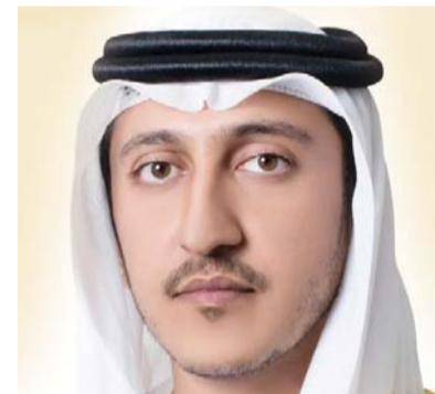
■ فيصل القاسمي

وتابع: «حرص سموه على متابعة ودعم مختلف المؤسسات الرياضية في مختلف الألعاب، ما أدى إلى تحقيق إنجازات أوصلتنا إلى