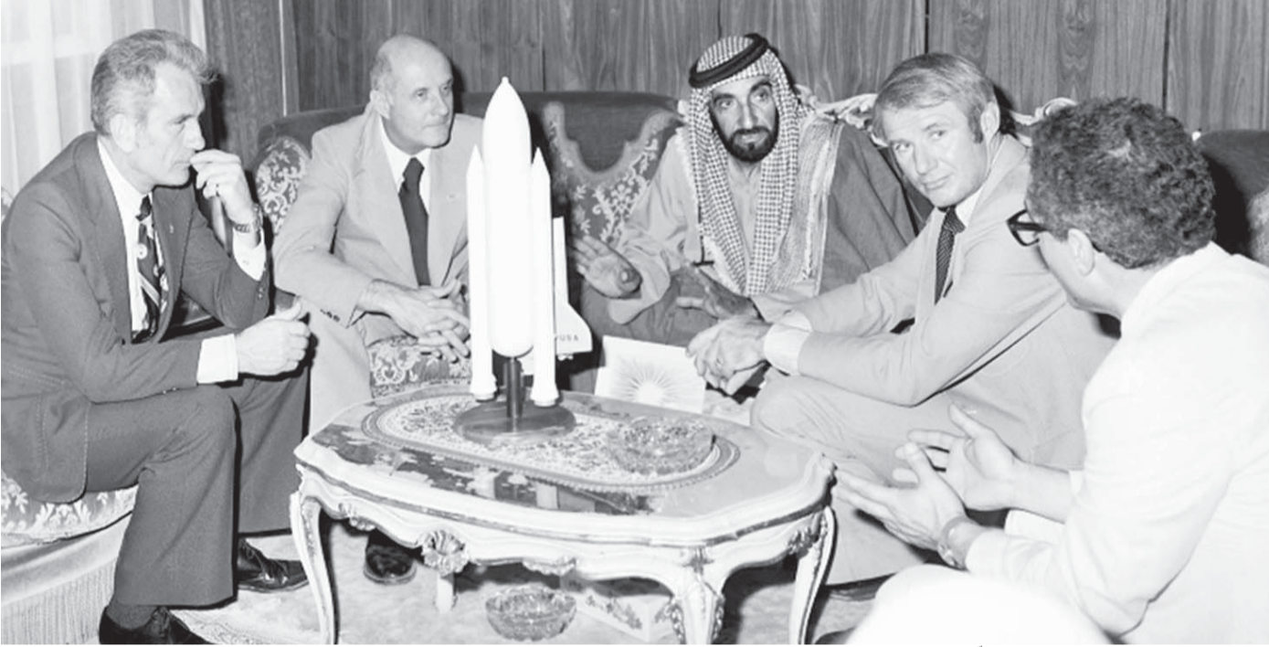
دولة الاتحاد بدأت منذ انطلاقتها بتطلعات لا تعرف المستحيل | أوشيفية