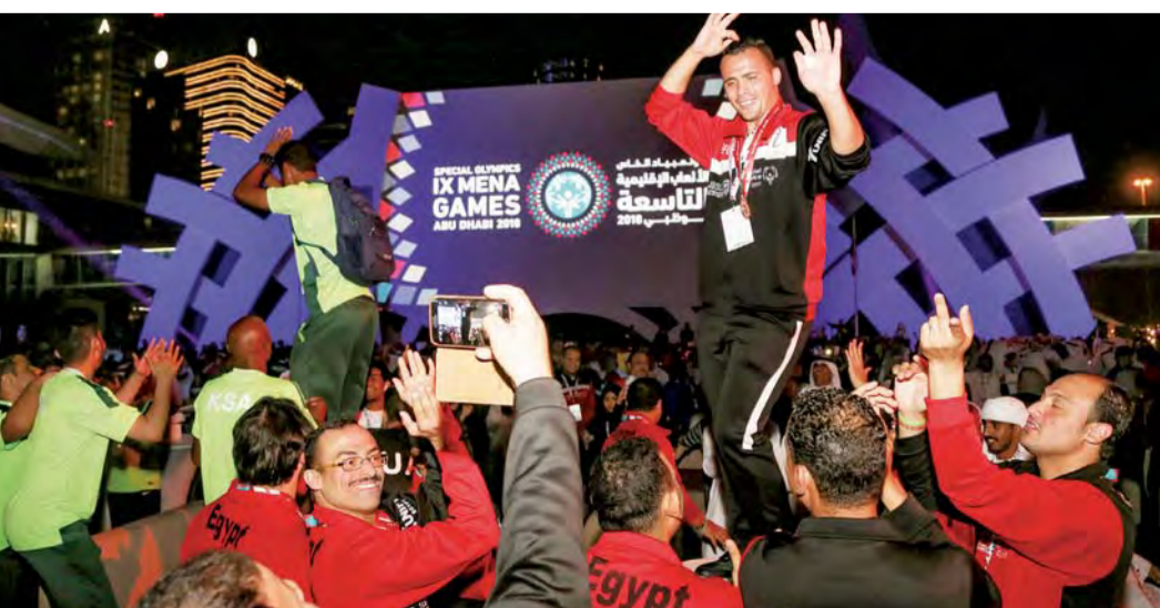
■ جانب من حفل الختام

وشدد عبدالوهاب، أن الجميع رسم صورة مضيئة لأصحاب الهمم، فهم أهل العزيمة والتحدى، والذين تباروا على مدار 3 أيام منافسات، قدموا فيها إمكانياتهم إلى الشارع الرياضي، ومضيفاً ليس لدينا فائز وخاسر والهدف هو تحقيق اللاعب لذاته، وأن معايير المكسب في حد ذاتها ليست قاعدة تبنى عليها المنظومة، مشيراً إلى الميدالية هي مقياس ومدى حصول اللاعب على الجرعات التدريبية الكافية، والتي نحاول باستمرار التشديد على ضرورة حصول اللاعب على ثلاثة أيام تدريب وهذه القواعد التي يطلبها الأولمبياد الخاص، ولذلك فهو نشاط مرتبط طيلة الحياة، ومؤكداً على ضرورة وجود تباين بين المسابقات بعضها، مع زيادة أعداد اللاعبين.