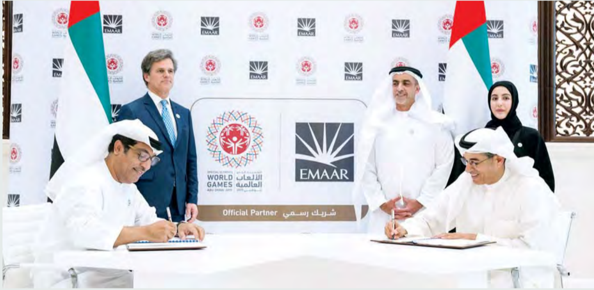
■ سيف بن زايد يشهد توقيع الاتفاقية بحضور شما المزروعى والجنيبى والعبار وشرافىفر

المسؤولية المجتمعية لخدمة أصحاب الهمم من ذوي الإعاقة الذهنية ومساندة حركة الأولمبياد الخاص الأمر الذي يمثل دفعة قوية للجهود المبذولة في إطار دمج أصحاب الهمم في المجتمع وتغيير النظرة السائدة حول ذوي الإعاقة الذهنية.