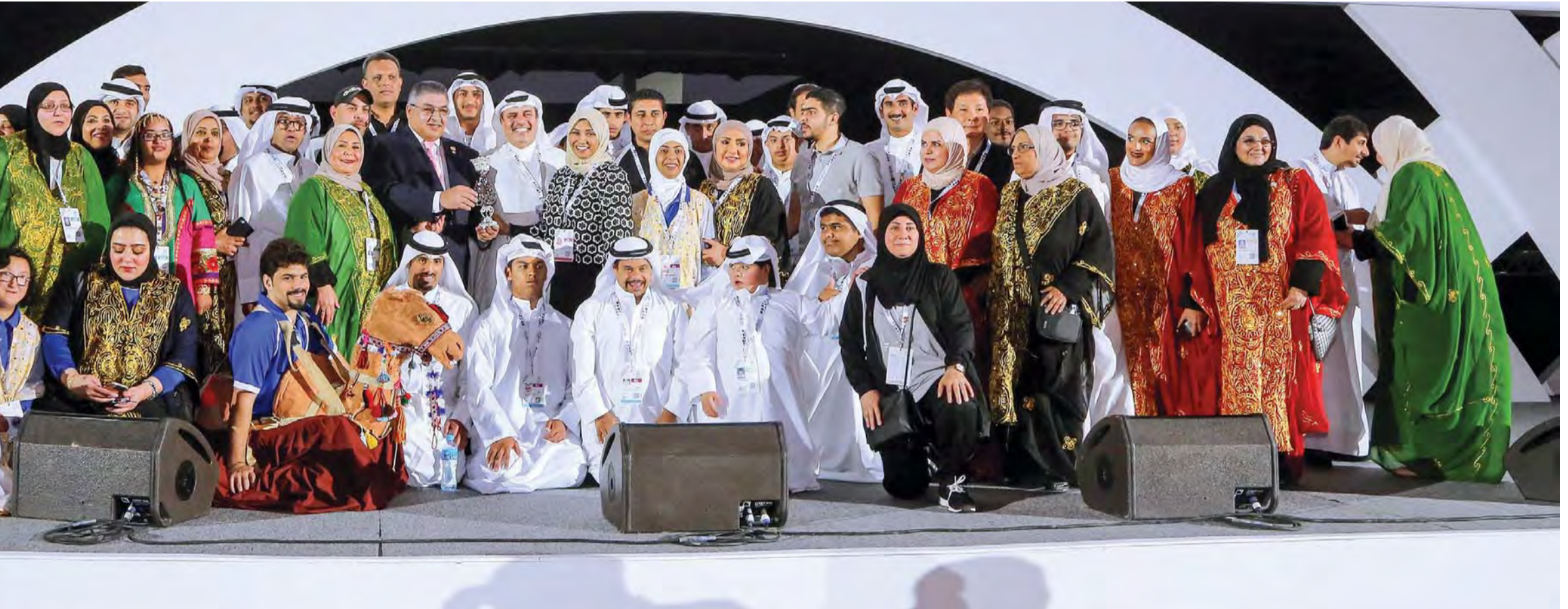
■ اللجنة المنظمة واللاعبون والمتطوعون في حفل الختام