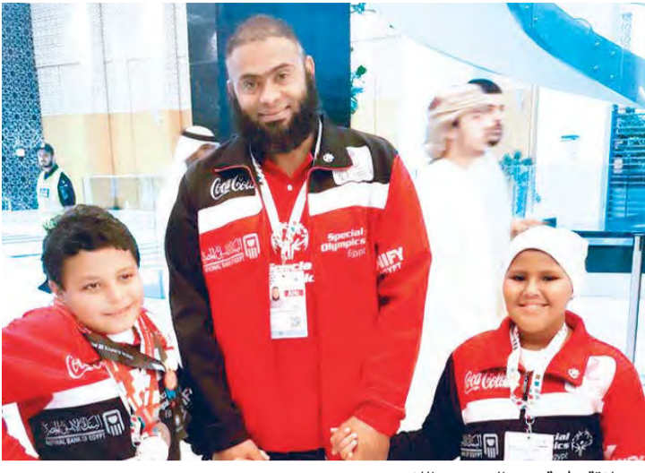
■ علاقة طيبة بين المدرب واللاعبين