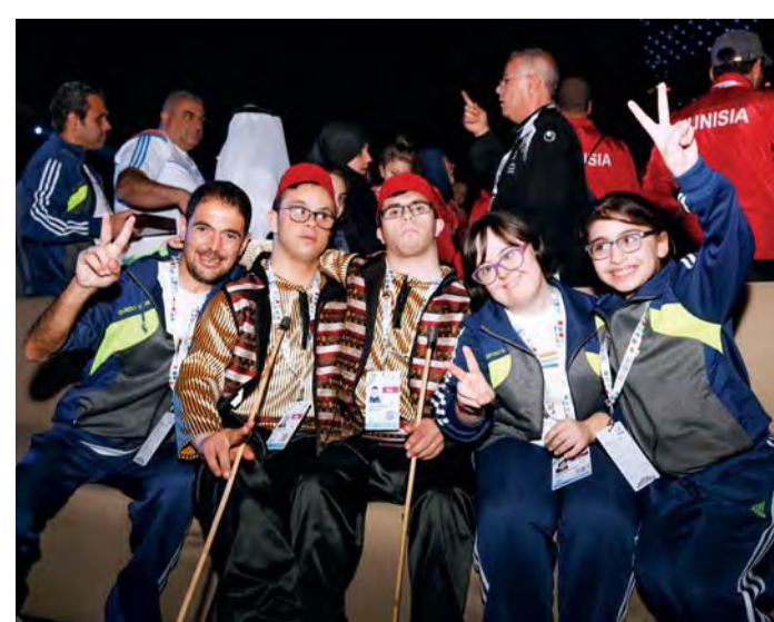
■ مشاعر طيبة متبادلة بين جميع اللاعبين