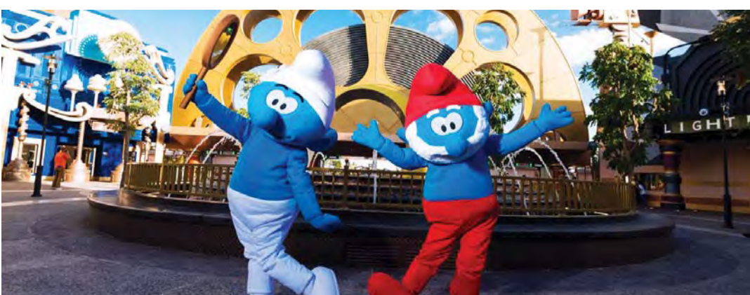
■ عروض خاصة في موشنيت دبي بمناسبة اليوم الوطني السعودي | من المصدر

في هوليوود. يتصدر منتزه ليغولاند دبي الوجهة المثالية على مدار العام لمغامرات عالم ألعاب «ليغو» للعائلات والأطفال بين 2 و12 سنة. يقدم ليغولاند دبي ما يزيد على 40 لعبة تفاعلية، وعروض ومغامر جذب ترفيهية، وما يزيد عن 15,000 مجسم لنماذج ليجو تشمل ما يزيد على 60 مليون قطعة من مكعبات ليجو. هذا إلى جانب ست مناطق ترفيهية تنفرد كل منها بالعروض والتجارب الترفيهية والتعليمية التي تقدمها. ليغولاند ووتربارك هي الحديقة المائية الأولى في المنطقة والمصممة خصيصاً