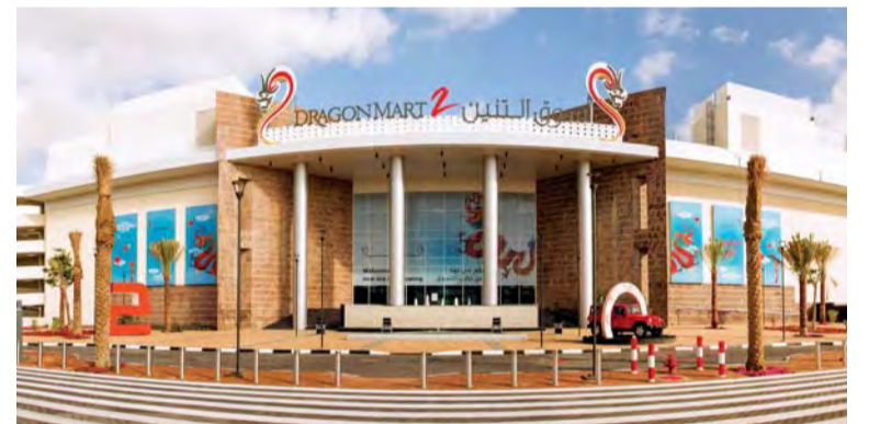
■ دراغون مول يستقبل الزوار السعوديين بعروض خاصة | من المصدر

فيها المؤدون في صفيين متقابلين يحملون العصي والخناجر ويتميلون على دقائق الطبول والقصائد. ويقدم جدول الفعاليات العديد من الأنشطة الشيقة التي تعكس تقاليد الشعب السعودي وتشمل رقصة السيوف التي تقام اليوم، كما ستجوب مسيرة الرقصات الشعبية العربية بصحبة موسيقيين في أرجاء المركز التجاري غداً السبت. وسيستمع الزوار أيضاً بتناول القهوة العربية والتمور مجاناً في ردهة الهند اليوم وغداً، كما سيتم توزيع أعلام دولة الإمارات والسعودية على الضيوف عند مكتب خدمة العملاء في الفترة من اليوم حتى الأحد.