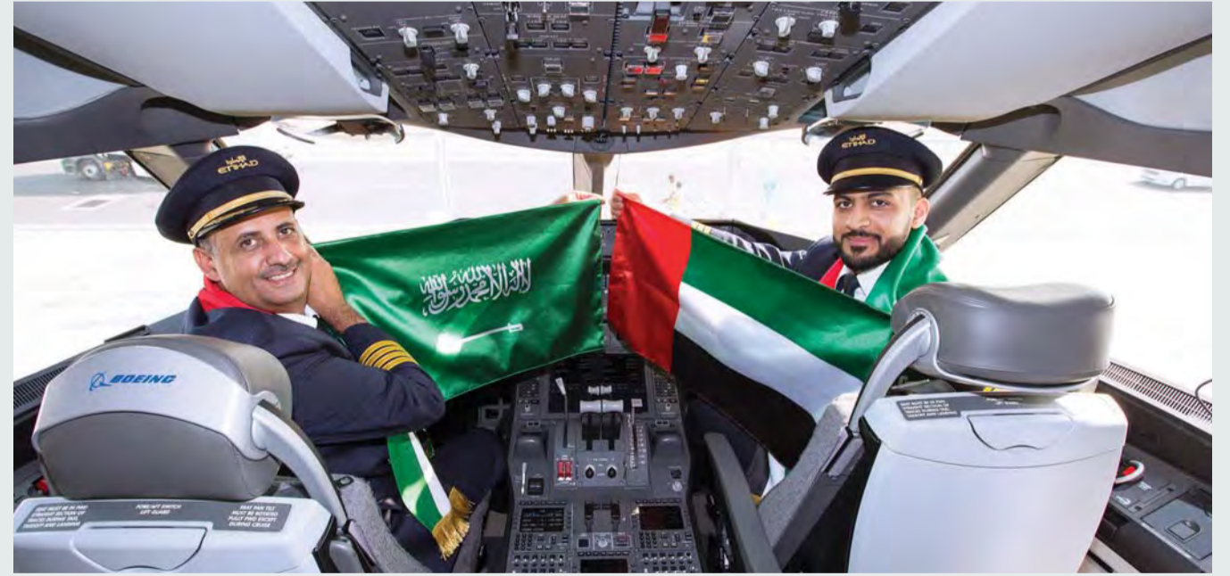
عروض خاصة من الاتحاد للطيران للمسافرين السعوديين