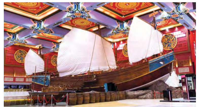
■ ابن بطوطة مول يحتفي بالحدث | من المصدر

يستعد سوق التنين وابن بطوطة مول للاحتفال باليوم الوطني السعودي الثامن والثمانين خلال عطلة نهاية الأسبوع، عبر إحياء أنشطة تراثية متنوعة وعروض مباشرة في الفترة ما بين 21 حتى 23 سبتمبر. وتشمل الفعاليات تقديم عروض رقصة الفلكلور التراثية «العرضة» التي ستؤديها فرقة «السريع» السعودية الشعبية يوم السبت الموافق 22 سبتمبر في سوق التنين 2 من الساعة 8 مساءً حتى 11 مساءً. تعتبر رقصة العرضة من أهم الرقصات الشعبية في السعودية يقف