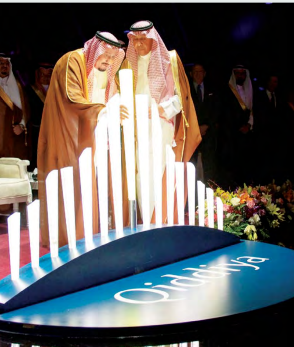
■ دعم كبير من القيادة السعودية لإنجاح «رؤية 2030» | أرشفية