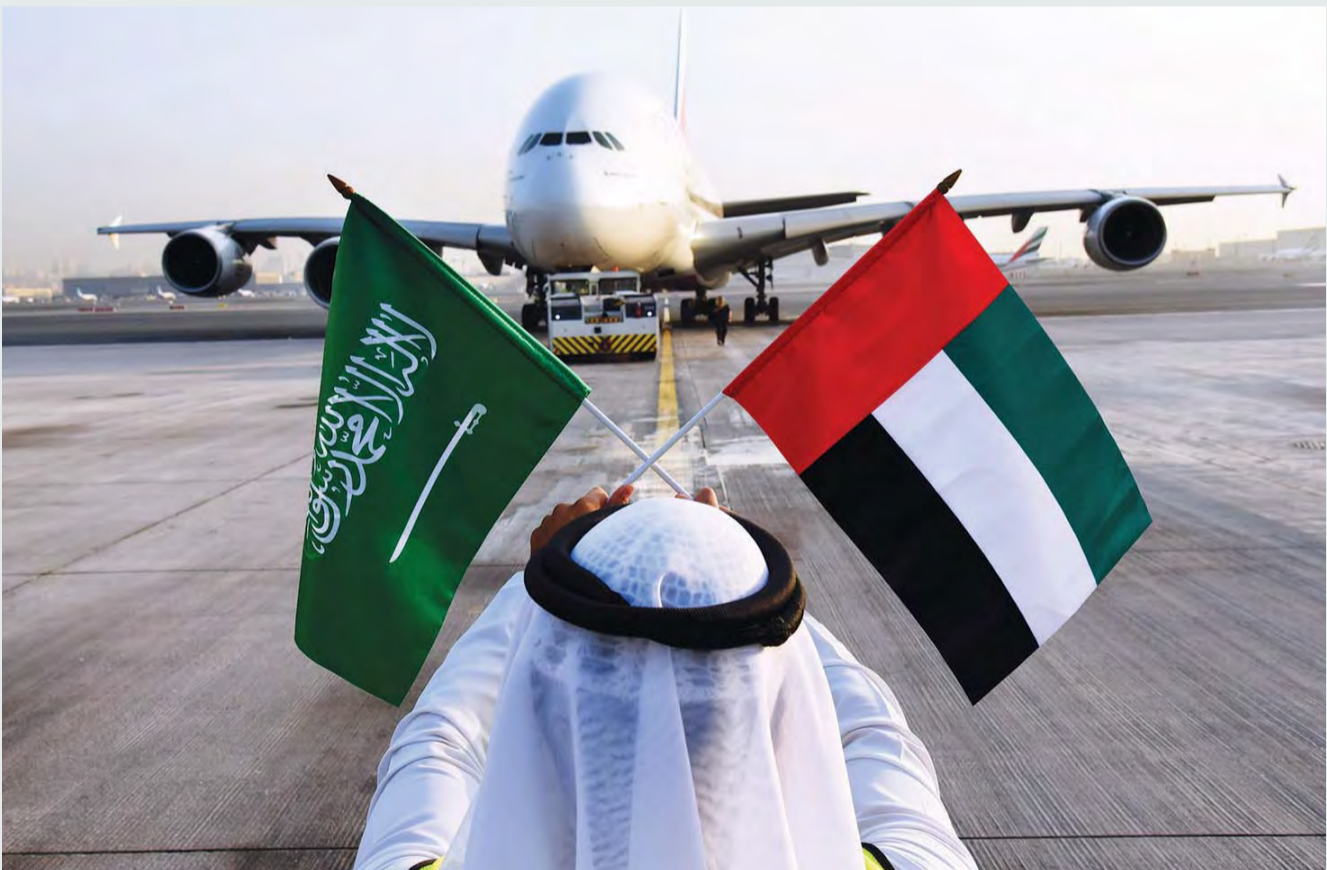
■ «طيران الإمارات» تشغل A380 إلى الرياض للمرة واحدة | من المصدر

وتضم الطائرة المذكورة 14 جناحاً في الدرجة الأولى و76 مقعداً يتحول إلى سرير شبه مستو في درجة رجال الأعمال، و429 مقعداً في الدرجة السياحية. ويتاح لركاب الدرجة الأولى ودرجة رجال الأعمال إمكانية اختيار الصالون الجوي والاستمتاع بأفخر المرطبات والمأكولات الخفيفة، والتواصل وتجاذب أطراف الحديث مع رجال أعمال ومسافرين آخرين من مختلف دول العالم. ويستمتع الركاب في جميع الدرجات بنظام طيران الإمارات الفريد للمعلومات والاتصالات والترفيه الجوي ice الحائز جوائز عالمية، ويضم أكثر من 3500 قناة متنوعة منها 300 قناة باللغة العربية.