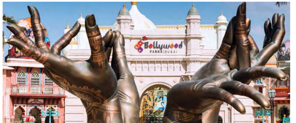
بوليوود باركس دبي

ويعتبر بوليوود باركس دبي وجهة لمحبي بوليوود، فهو أول منتزه ترفيهي مستوحى من أفلام بوليوود في المنطقة، ويقدم تجارب نابضة بالحياة ومغامرات مفعمة بالتشويق والرومانسية والفكاهة والموسيقى والرقص.