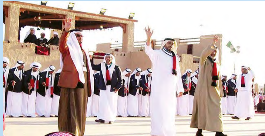
تراث مشترك وتمازج ثقافي يغني العلاقات الأخوية | أرسيفية