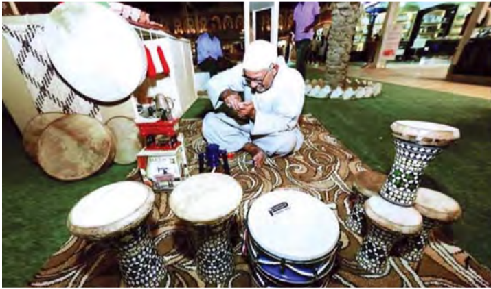
معروضات تراثية تزين الجناح السعودي