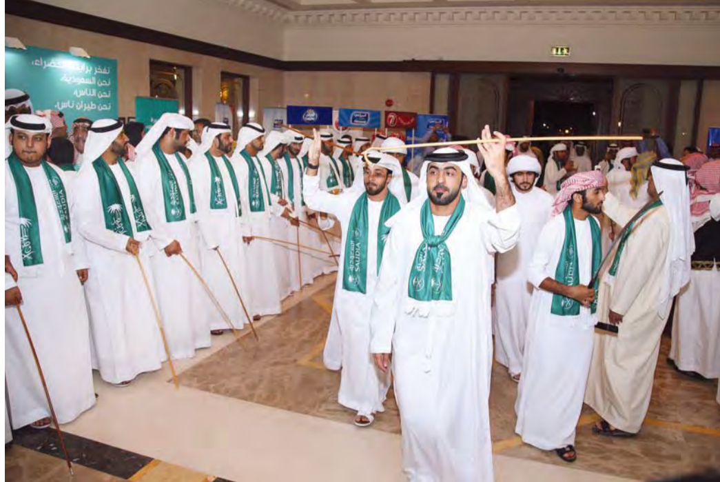
برامج ومتابعات تواكب احتفالات الأشقاء السعوديين باليوم الوطني أرسيفية

قنوات المؤسسة التلفزيونية، تحت عنوان (#معاً أبداً)، والفواصل التلفزيونية التي تحتفي بهذه المناسبة، قائلاً: إنها تكسب مدى اهتمام مؤسسة دبي للإعلام بهذه المناسبة العزيرة على قلوبنا جميعاً. وذلك بعد أن تم تسخير جميع الإمكانيات الفنية والتحريرية في مركز الأخبار، لمواكبة احتفالات المملكة العربية