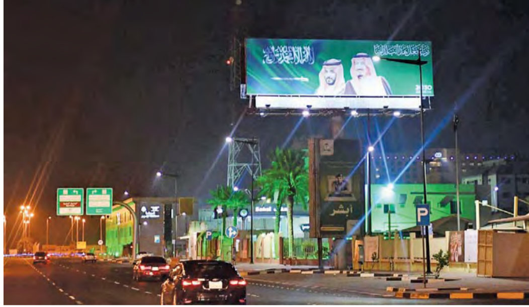
■ جانب من احتفاء المنطقة الشرقية باليوم الوطني للمملكة العربية السعودية

وأوضح(المركز الاستشاري الاستراتيجي) في تقريره، أنه، وعلى مستوى التفاعلات الإيجابية أضحت المملكة مركزاً للدبلوماسية الإقليمية، نشير هنا إلى الوساطة السعودية بين دول القرن الإفريقي، التي تطل على المحيط الهندي وتحكم في المدخل الجنوبي للبحر الأحمر، حيث مضيق باب المندب. وهي منطقة حيوية لإمدادات الطاقة وحركة التجارة العالمية ولاقتصادات دول