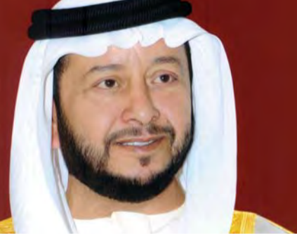
سلطان بن زايد

بعث سمو الشيخ سلطان بن زايد آل نهيان ممثل صاحب السمو رئيس الدولة، برقية تهنئة إلى خادم الحرمين الشريفين الملك سلمان بن عبدالعزيز آل سعود، ملك المملكة العربية السعودية، بمناسبة اليوم الوطني الـ 88 للمملكة. وأعرب سموه، في البرقية عن تهنئه الحارة، سائلاً الله عز وجل أن يعيد هذه المناسبة الوطنية الغالية على خادم الحرمين الشريفين والشعب السعودي الكريم بالخير واليمن والبركات، وأن يديم على خادم الحرمين وعلى المملكة الشقيقة وشعبها الخير والعزة والرفعة. وتضمن سمو الشيخ سلطان بن زايد آل نهيان، في برقيته، مواقف وجهود خادم الحرمين الشريفين الملك سلمان بن عبدالعزيز آل سعود، في خدمة وطنه والمنطقة والأمتين العربية والإسلامية في شتى المجالات. كما بعث سمو الشيخ سلطان بن زايد آل نهيان، برقية تهنئة مماثلة إلى الأمير محمد بن سلمان بن عبدالعزيز آل سعود، ولي العهد وزير الدفاع السعودي بهذه المناسبة. وبعث سمو الشيخ حمدان بن زايد آل نهيان ممثل حاكم أبوظبي في منطقة الظفرة برقية تهنئة إلى خادم الحرمين الشريفين الملك سلمان بن عبدالعزيز آل سعود ملك المملكة العربية السعودية بمناسبة اليوم الوطني الـ 88 للمملكة. وأعرب سموه في البرقية عن تهنئه الحارة بهذه المناسبة سائلاً الله عز وجل أن يعيد هذه المناسبة