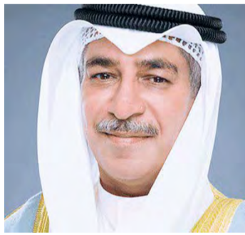
■ عادل الخرافي