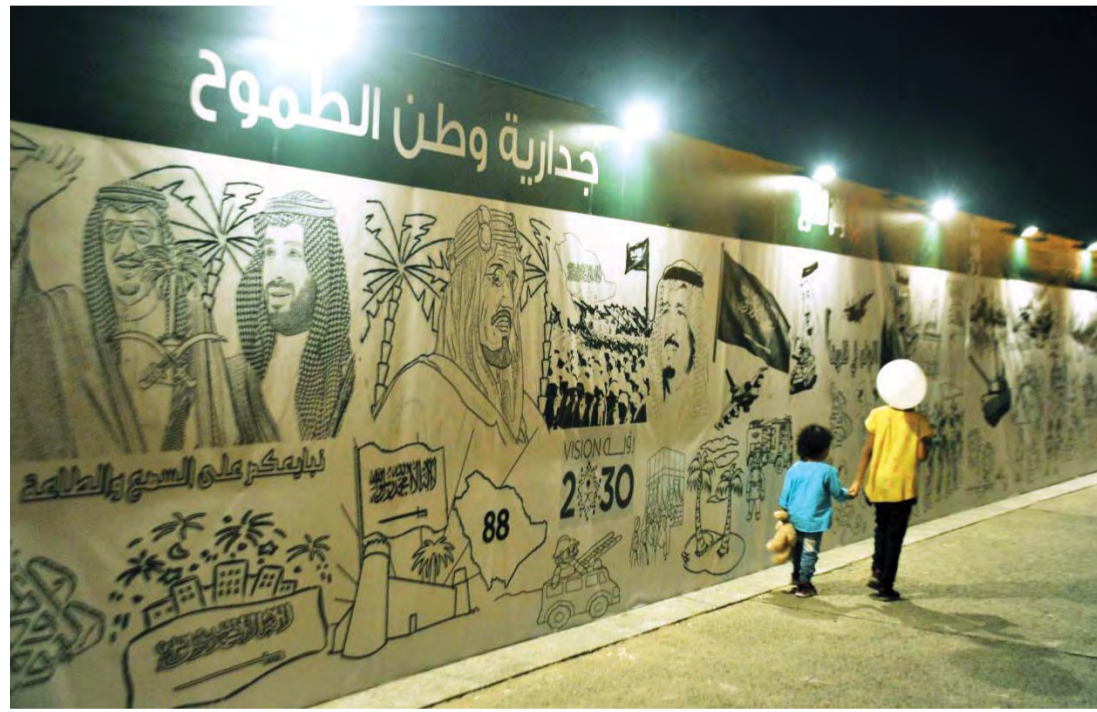
■ جدارية تحمل صوراً لمؤسس المملكة وخادم الحرمين ومحمد بن سلمان في جدة

من جهتها، قالت الوكيل المساعد لقطاع الإسناد الإداري والمعلومات في الإدارة