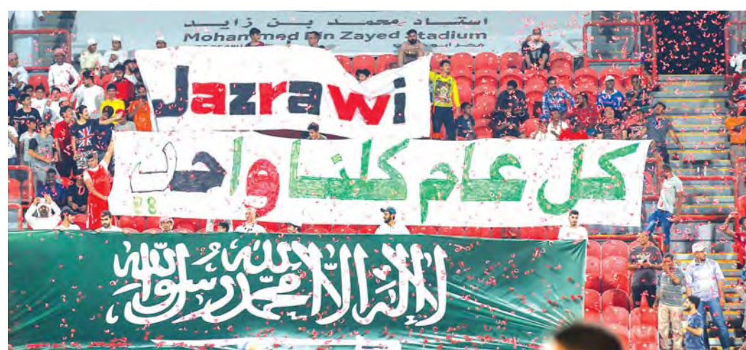
جماهير الجزيرة تشارك السعودية فرحة اليوم الوطني