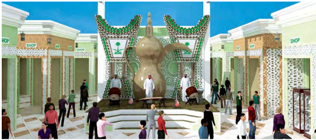
جانب من الجناح السعودي بالقرية العالمية