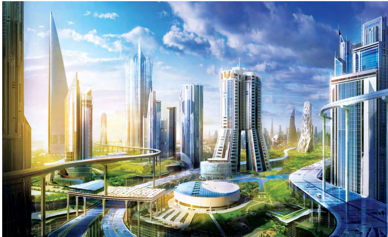
■ مجسم لمشروع نيوم

ويتطلع مشروع نيوم كلك، لتحقيق أحد أهم أهدافه الطموحة بأن تكون المنطقة من الأكثر أمناً في العالم إن لم تكن الأكثر، وذلك عبر توظيف أحدث التقنيات العلمية في مجال الأمن والسلامة، وتعزيز كفاءات أنشطة الحياة العامة، من أجل حماية السكان والمرتابين والمستثمرين.