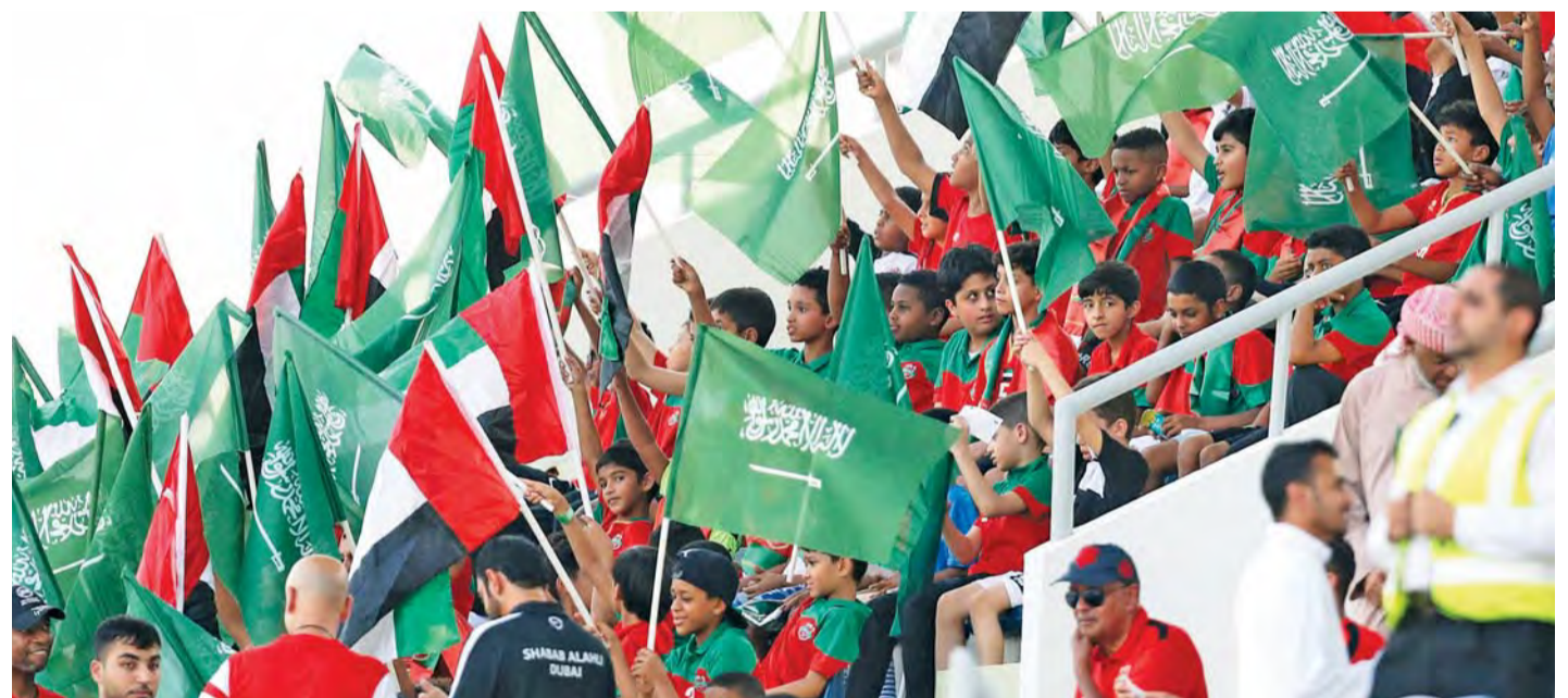
جمهور شباب الأهلي يشارك المملكة العربية السعودية الفرحة | تصوير: سالم خميس