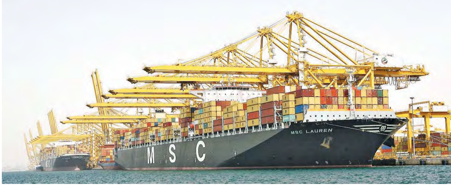
زخم كبير في الحركة التجارية بين البلدين | البيان

بينما تتركز استثمارات الشركات السعودية في الإمارات على قطاعات: التعدين واستغلال المحاجر والأنشطة العقارية وتجارة الجملة والتجزئة وإصلاح المركبات ذات المحركات والدراجات النارية والصناعة التحويلية والأنشطة المالية وأنشطة التأمين والتشييد والبناء والأنشطة في مجال صحة الإنسان والعمل الاجتماعي والزراعة والحراجة وصيد الأسماك وأنشطة الخدمات الإدارية وخدمات الدعم والتعليم والأنشطة المهنية والعلمية والتقنية والنقل والتخزين وأنشطة خدمات الإقامة والطعام والمعلومات والاتصالات.