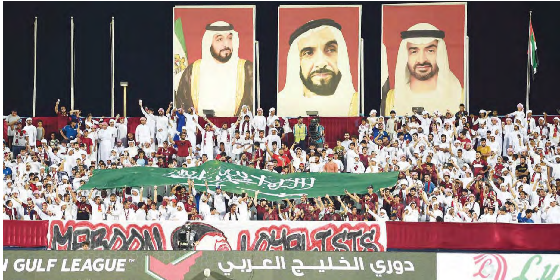
ملعب كرة الإمارات تحفل باليوم الوطني السعودي

■ أبو ظبي - محمد صادق دبي - البيان الرياضي