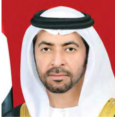
حمدان بن زايد