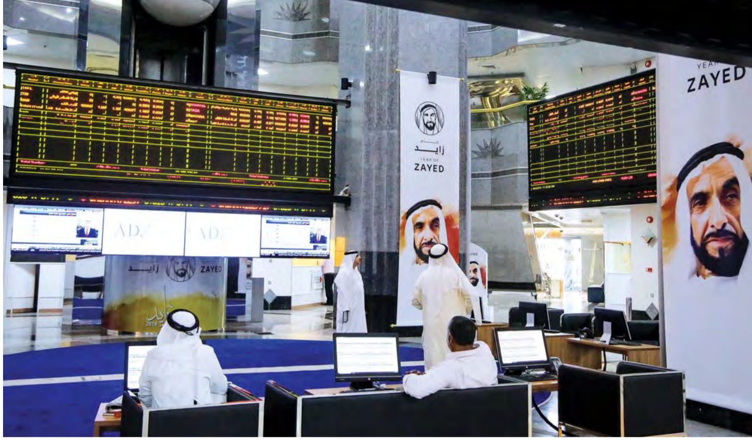
■ سوق الإمارات للأوراق المالية في أبو ظبي

وتداول السعوديون خلال تلك الفترة على نحو 4,65 مليارات سهم من أسهم سوق أبوظبي توزعت بواقع 2,5 مليار سهم مبيعات و2,12 مليار سهم مشتريات، وذلك من خلال تنفيذ أكثر من 52,17 ألف عملية. وأضاف الخبراء والمحللون لـ«البيان الاقتصادي»، أن الأرقام والإحصائيات تشير إلى تزايد وتيرة استثمار السعوديين في الأسهم المحلية خلال السنوات الأخيرة الماضية في ظل جاذبيتها الاستثمارية استناداً إلى مؤشر مركز الرخية ومضاعف القيمة الدفترية إلى السوقية التي طالما اعتمد عليها مدرءا محافظ الاستثمار في