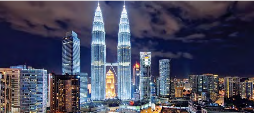
السعودية أكبر شريك تجاري للإمارات خليجياً وعربياً | البيان

25 ألف مستثمر سعودي في دبي يملكون 6400 رخصة أعمال