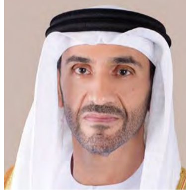
نهيان بن زايد

الوزراء وزير الدفاع في المملكة العربية السعودية.