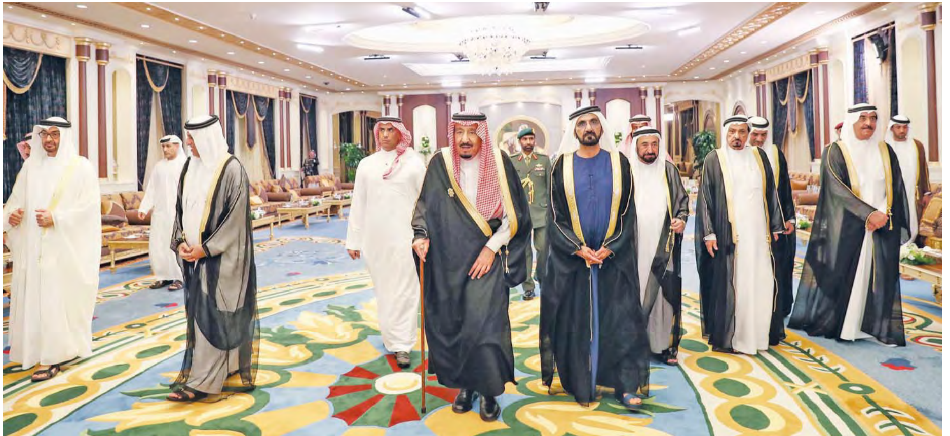
قيادة السعودية والإمارات تحرس على تطابق الرؤى ومأسسة العلاقات بما يكفل ازدهار البلدين | أرشيفية

وأضاف سموه: «إن التاريخ العربي سوف يتذكر على الدوام المواقف التاريخية لخدام الحرمين الشريفين الملك سلمان بن عبدالعزيز، وقراراته الحاسمة والحازمة في مواجهة محاولات التدخل في المنطقة العربية، من قبل أطراف خارجية لها أطماعها فيها». وشهدت العلاقات الثنائية نقلة نوعية تمثلت في حرص القيادة في كلا البلدين الشقيقين على تأسيس هذه العلاقات من خلال تأسيس لجنة عليا مشتركة في مايو 2014 برئاسة وزيري الخارجية في البلدين، وقد عملت هذه اللجنة على تنفيذ الرؤية الاستراتيجية لقيادتي البلدين للوقوف على آفاق أرحب وأكثر أمناً واستقراراً لمواجهة التحديات في المنطقة وذلك في إطار كيان قوي متماسك بما يعود بالخير على الشعبين الشقيقين ويدعم مسيرة العمل الخليجي المشترك.