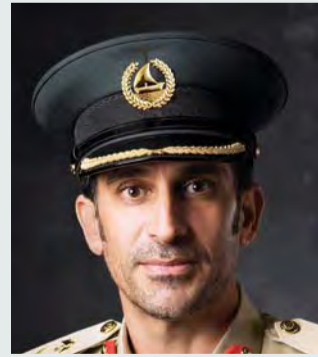
عبد الله المري

وتضمن القائد العام لشرطة دبي دور المملكة العربية السعودية ورؤية قيادتها الثاقبة في مختلف المواقف والقضايا العربية، والتي لا تلبث أن تؤكد من خلالها عمق انتمائها العربي، وحرصها على صون مقدرات الأمة