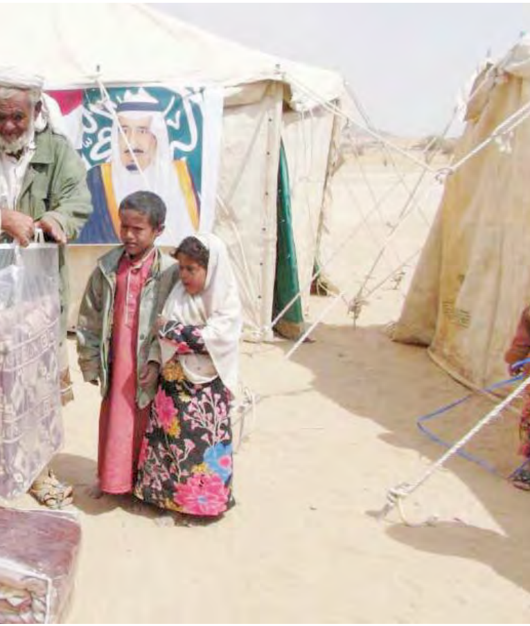
■ مساعدات مكثفة من المملكة لكافة القطاعات في اليمن | أريشيفية

العمليات العسكرية للتحالف الذي تقوده المملكة سارت باتجاهات مختلفة، فمن جهة دعمت وساندت قوات الشرعية من أجل تحرير المناطق من سيطرة الميليشيا، ومن جهة أعادت بناء قوات الجيش والأمن، وفي اتجاه آخر واجهت عناصر الإرهاب لتنظيمي القاعدة وداعش الإرهابيين، وتولت أيضاً حماية منافذ اليمن من تهريب الأسلحة الإيرانية إلى عناصر الميليشيا.