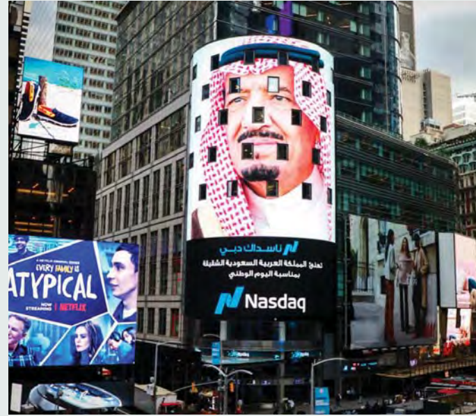
صورة سلمان بن عبدالعزيز تزّين ساحة تايمز سكوير