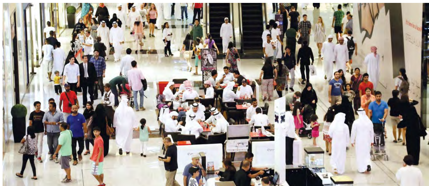
ازدحام المتسوقين في دبي مول

أكد محمد عوض الله الرئيس التنفيذي لمجموعة تايمز للفنادق، أن الفنادق في دبي تعول بشكل كبير على العائلات المحلية والخليجية وخاصة السعودية، التي باتت تفضل قضاء فترة الأعياد والإجازات القصيرة في دبي؛ لتنوع المنتج السياحي ووجود الفنادق بمختلف نجومها، إضافة إلى الفنادق الاقتصادية. وأضاف إن نسب إقبال السياح الخليجيين بشكل عام والسعوديين بشكل خاص شهدت تطوراً ملحوظاً مقارنة مع العام الماضي. وأوضح أن دبي وما تقدمه عن أي وجهة عالمية أخرى تتميز بقرتها من السعودية جغرافياً وثقافياً وترافياً.