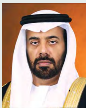
سالم بن ركاض

وراسخة تتجلى واضحة في المحافل العالمية كافة، وفي التعامل مع القضايا المصرية في الخليج والوطن العربي». وأكد بن ركاض، فرحة الشعب الإماراتي بمناسبة اليوم الوطني للمملكة، ما يعكس ترابط الشعبين وعمق العلاقات المترسخة بين البلدين.