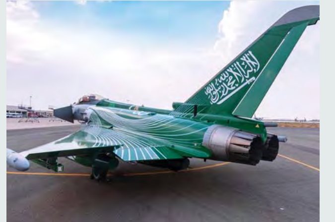
■ استعدادات للعرض الجوي باليوم الوطني