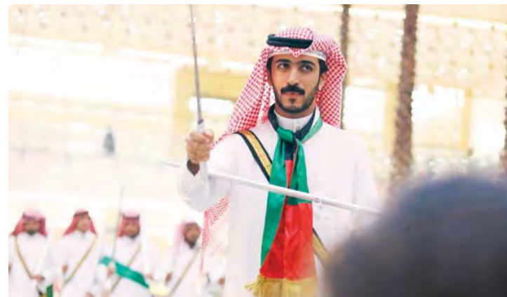
الفعاليات متنوعة في مراكز ماجد الفطيم | من المصدر

ويحضر كل من تسوق بقيمة 500 درهم في متاجر مختارة في «سيتي سنتر مردف» بتذكريتين مجانييتين من «فوكس سينما» ووجهة لخصين في مطعم «سوبر تشيكس».