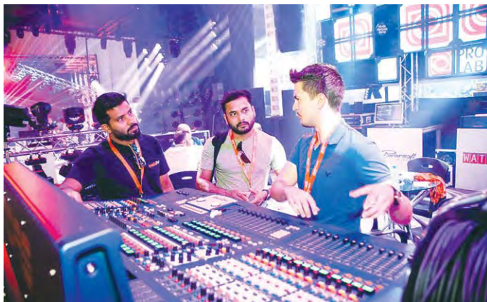
تركيز من الموردين في المعرض على الاستثمار في السعودية | من المصدر

يشهد مركز دبي الدولي للمؤتمرات والمعارض، انطلاق الدورة الثالثة لمعرض الشرق الأوسط للصوتيات والمرئيات 2018 الذي تنظمه ميسي فرانكفورت بمشاركة أكثر من 40 شركة من 10 دول تقدم أكثر من 100 علامة في المعرض التجاري المتخصص في صناعات الفعاليات، الترفيه والصوتيات والمرئيات بالمنطقة. ينطلق المعرض الأحد 23 من سبتمبر الجاري. وأثارت صناعة الترفيه الناشئة في المملكة العربية السعودية اهتمام اللاعبين العالميين في صناعات تكنولوجيا الفعاليات والصوتيات والمرئيات الاحترافية، حيث يحضر كبار الموردين على جذب الشاركن السعوديين خلال فعاليات الدورة القادمة من المعرض. عند اكتماله، سيكون مشروع القدية