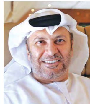
■ أنور قرقاش

لنجاحنا». جاء ذلك في تدوينة لمعاله عبر حسابه في «تويتر». وقال قرقاش: «أطيب التهاني باليوم الوطني السعودي وتمنياتنا بدوام الاستقرار والازدهار والريادة، نعمل معاً وننجز معاً ونرقي معاً ونذكر أن نجاح الرياض أساسي لنجاحنا».