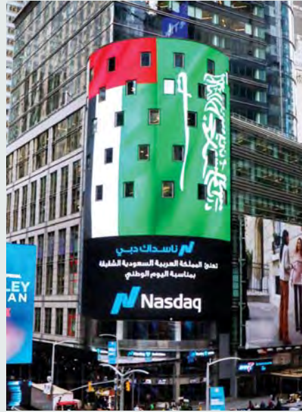
علم السعودية في واجهة تايمز سكوير