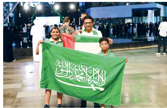
الفعاليات تتميز بالتنوع والشغف