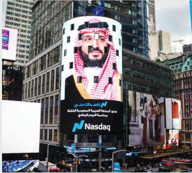
صورة محمد بن سلمان تزّين ميدان تايمز سكوير