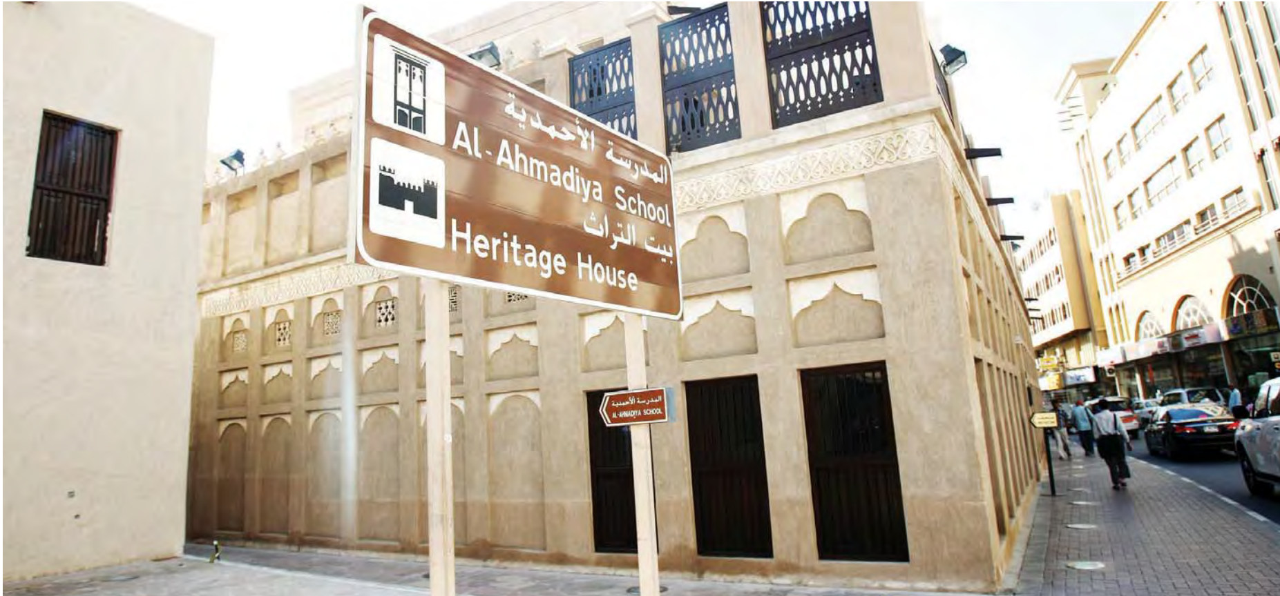
المدرسة الأحمدية بدبي شاهدة على علاقات ثقافية متجددة بين الأشقاء | أرشيفية

جدران المدرسة الأحمدية شاهد حي على جذور التبادل الثقافي بين الأشقاء