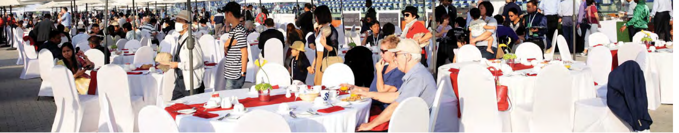
حضور مميز في حفل الإفطار | البيان

تميز حفل إفطار النجوم مع المدربين والفرسان في كأس دبي العالمي بحضور مميز من مختلف الفئات. وتضمن برنامج الحفل فقرات شيقة من