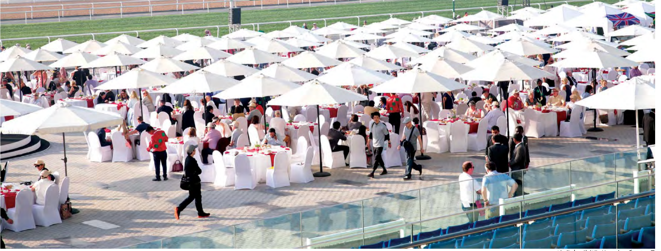
حضور كبير في حفل الإفطار | البيان