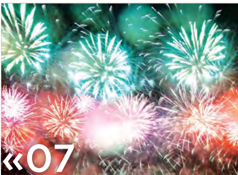
«07» لجنة تأمين كأس دبي العالمي تنهي استعداداتها