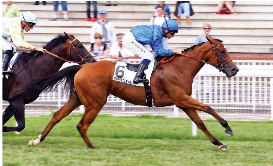
«روزا إمبيريال» خلال مشاركة أوروبية | أرشيفية

كما ارتقت «روزا إمبيريال» للمنافسة في مستوى الفئة الأولى بسباق «بري موريس دو غيست» على مسافة ستة فيرونغ ونصف بمضمار «دوفيل» في أغسطس الماضي، لكنها لم تستطع أبدأ الدخول في المنافسة وتراجعت لتحل المركز التاسع. واستعدت لظهورها الأول في دولة الإمارات، بأن أحرزت المركز الثاني على ذات المسافة بسباق شروط جرى على أرضية «بوليتراك» في «شانتييه» في الك مارس الماضي، حيث خسرت بثلاثة أرباع الطول من «سيتي لايت»، بعد أن انفردت تماماً بالصدارة عن البقية.