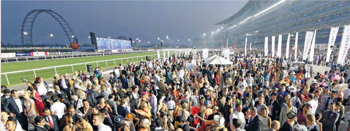
حضور جماهيري كبير في الكأس العالمي

نطاقاتها المفضلة وعلى أرض أجنبية، مبيناً أن الخيول الأميركية السريعة المنافسة في السباقات العشبية على أعلى المستويات لا تجد الكثير من الفرص. وبالسؤال عن أروع لحظات كأس دبي العالمي، قال: «هي لحظات ثلاث، الأولى في أرنلغتون عندما فاز «سيجار» بالنسخة الأولى من كأس دبي العالمي، والثانية عند الانتقال من ند الشبا وافتتاح ميدان، والثالثة الأخيرة