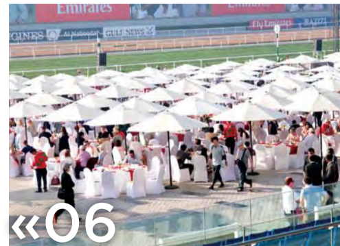
«06» جوائز وفن ومفاجآت في إفطار النجوم