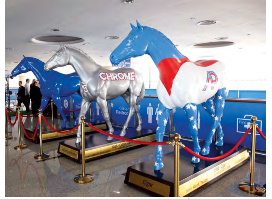
مجسمات للخيل الفائزة بالكأس العالمية | البيان

في كل عام فرصة طيبة للالتقاء في محبة وإخاء وصدافة بما يعكس البعد الإنساني للكأس العالمي. إن هذه الفعالية التي ظل يدوم عليها السباق سنوياً منذ انطلاقة الحدث في 1996، ظلت تلقى الإعجاب والاهتمام من عشاق السباقات.