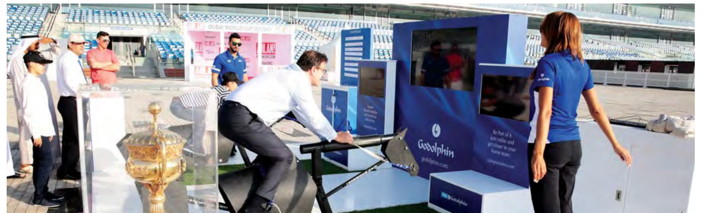
جانب من فعاليات جودلفين