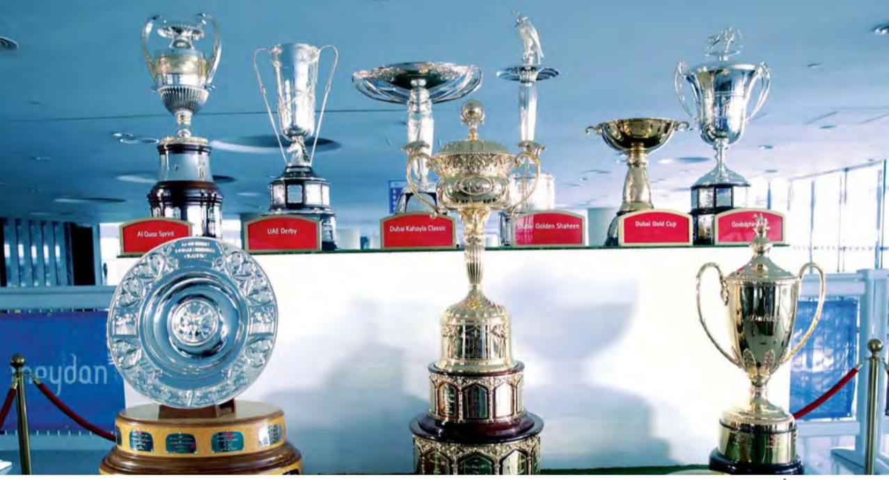
جوائز وكؤوس كأس دبي العالمي | البيان