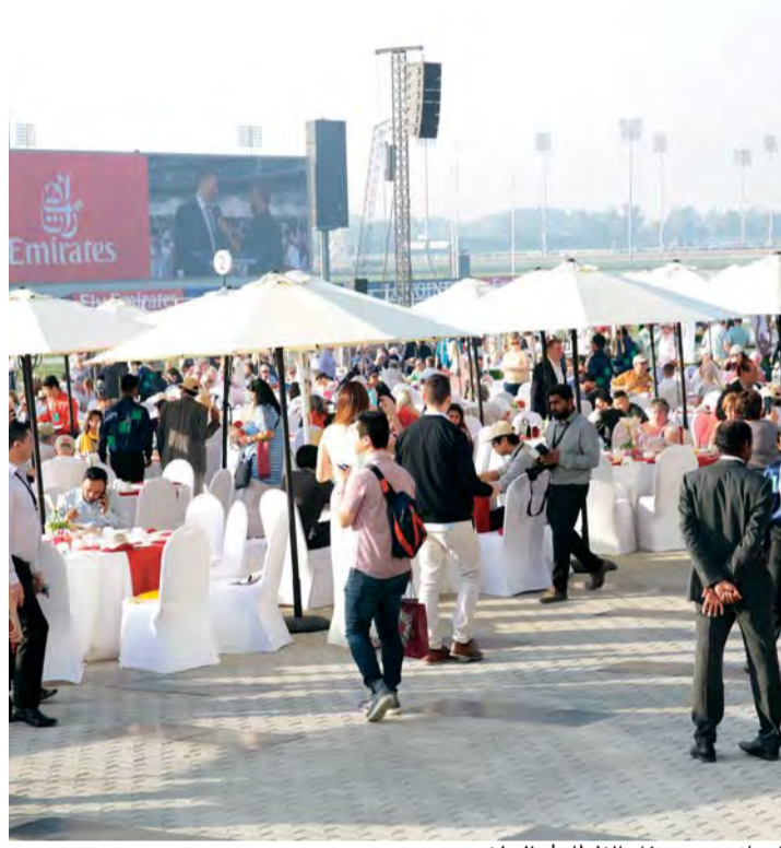
جانب من حفل الإفطار