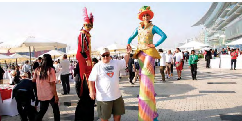
عروض ترفيهية أمتعت الجمهور