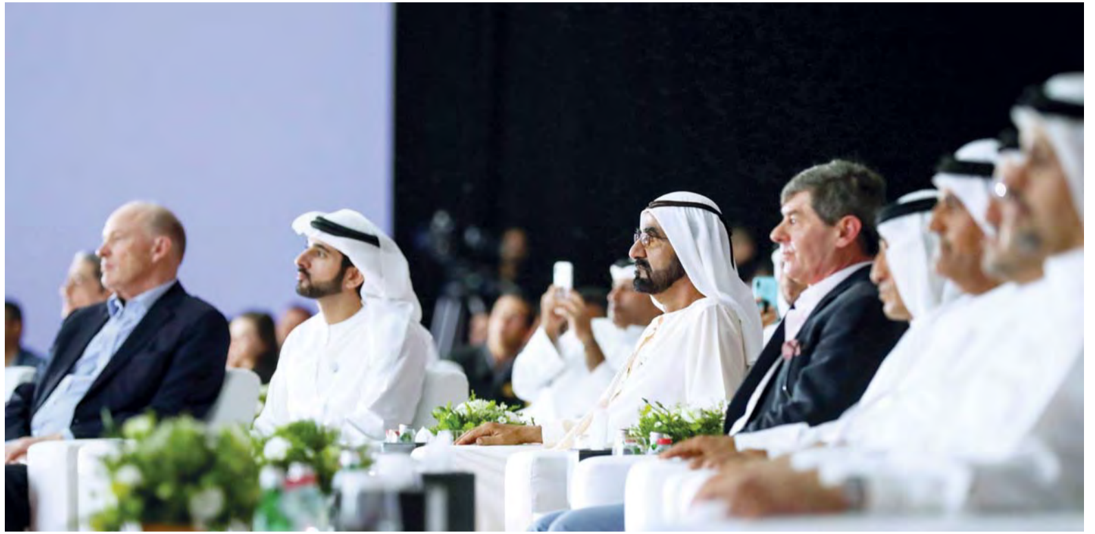
محمد بن راشد يشهد حفل التميز بحضور حمدان بن محمد