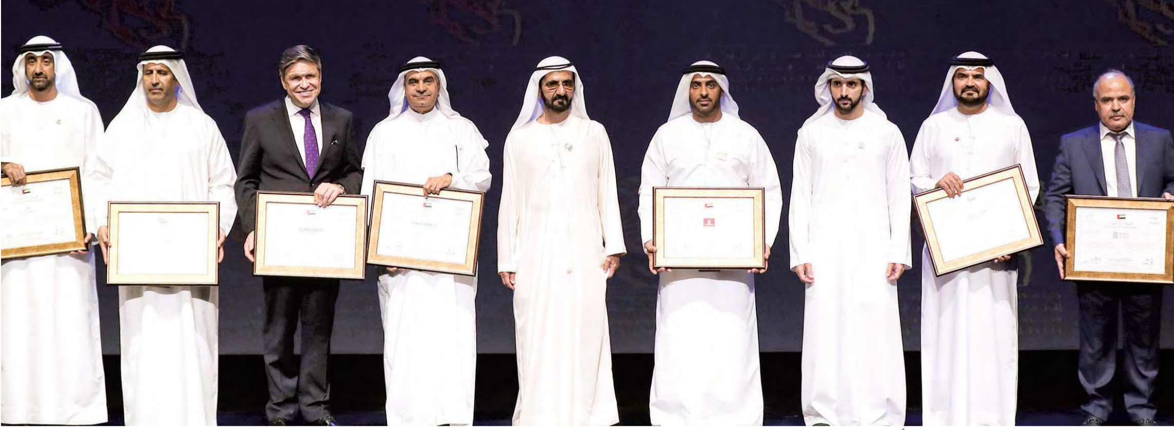
محمد بن راشد وحمدان بن محمد يتوسطان رعاة كأس دبي العالمي