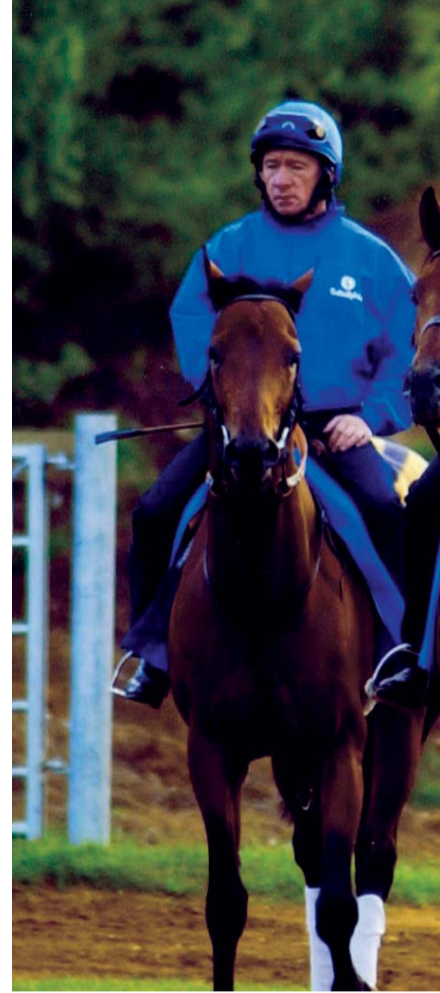
نتائج باهرة حققتها خيول جودلفين في السباقات الإنجليزية | أرشفية