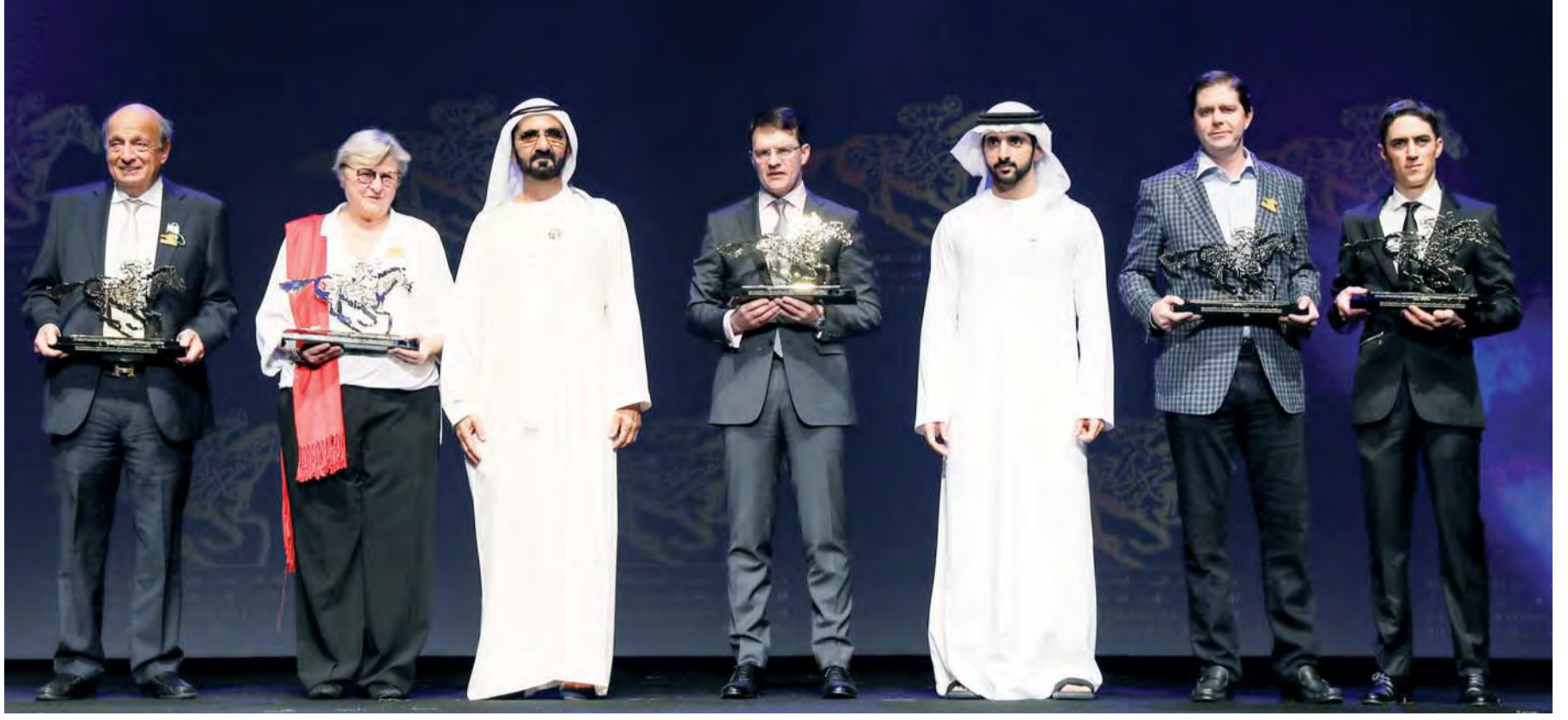
محمد بن راشد وحمدان بن محمد في لقطة جماعية مع الفائزين بجوائز التميز