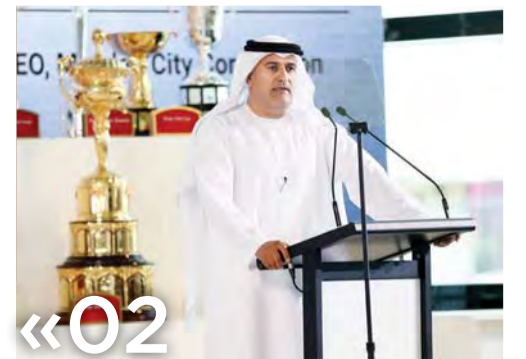
«02» الطائر: لجنة الأمناء التزمت بأعلى معايير الشفافية