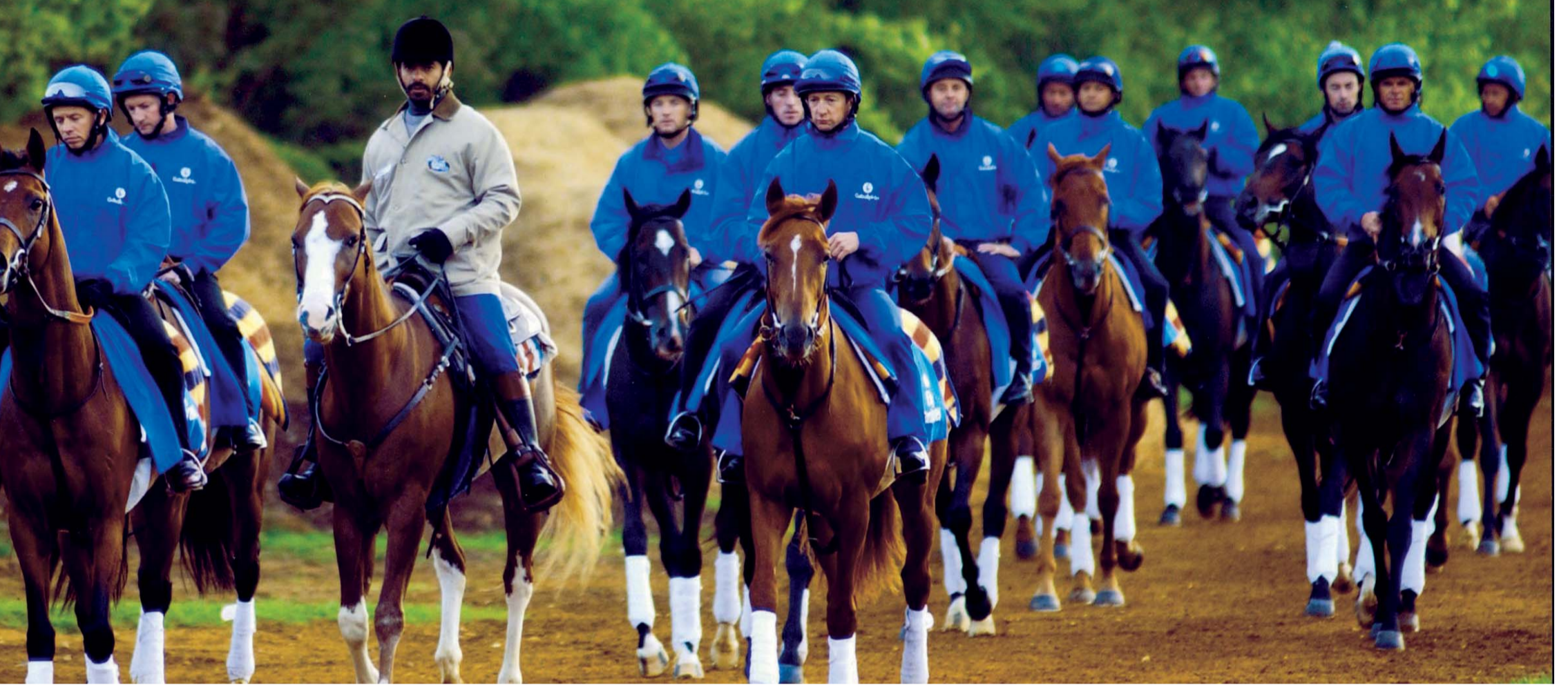
خيول جودلفين جاهزة للسباق العالمي