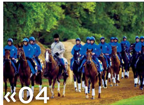
«04» خيول جودلفين تستهدف الألقاب العالمية