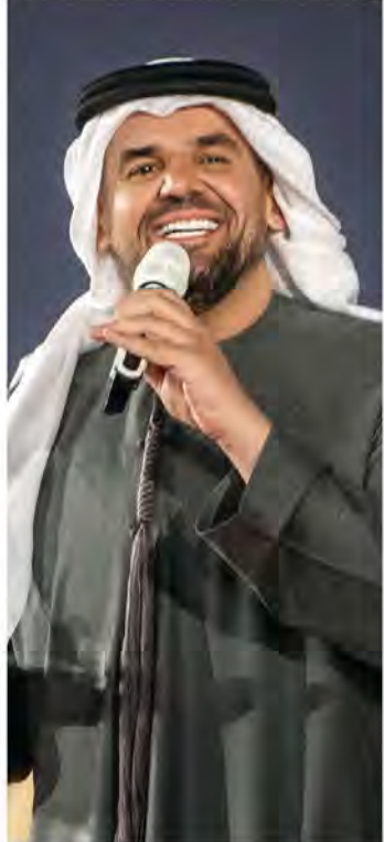
■ حسين الجسمي

مسيرة الجسمي المثقلة بالنجاح، والتي قادته سابقاً لتمثيل بلاده والمنطقة والتمثيل للفنانات.