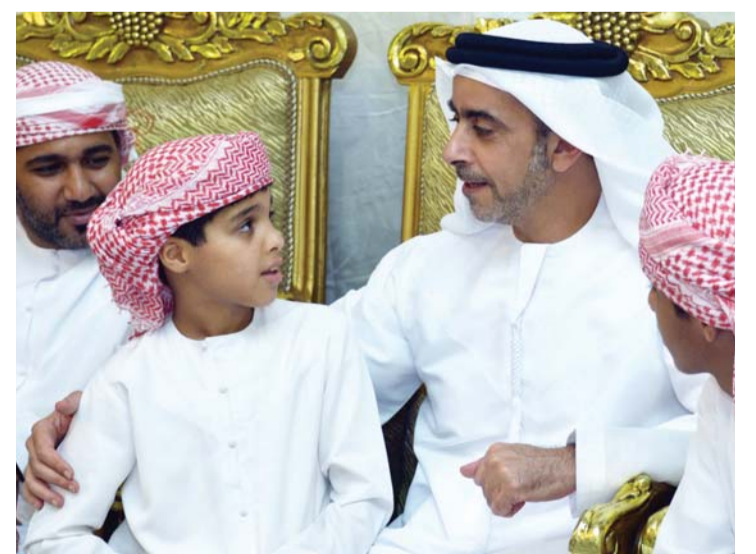
■ سيف بن زايد خلال العزاء في الشهيد محمد السيابي

كما قدم الفريق سمو الشيخ سيف بن زايد آل نهيان يرافقه سمو الشيخ الدكتور سلطان بن خليفة آل نهيان مستشار صاحب السمو رئيس الدولة، مساء أمس،