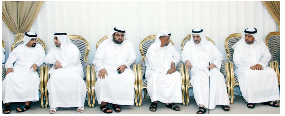
■ حاكم الفجيرة معزياً أسرة الشهيد يوسف الكعبي يرافقه محمد وراشد ومكثوم بن حمد