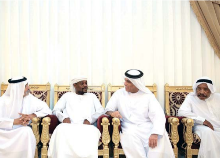
■ سعود بن صقر معزياً أسرة الشهيد أحمد الحمادي

تعاذيه وصادق مواساته لأسر وذوي الشهداء، سائلاً الله العلي القدير أن يتغمدهم بواسع رحمته وأن يسكنهم فسيح جناته وأن يلهم ذويهم جميل الصبر والسلوان.