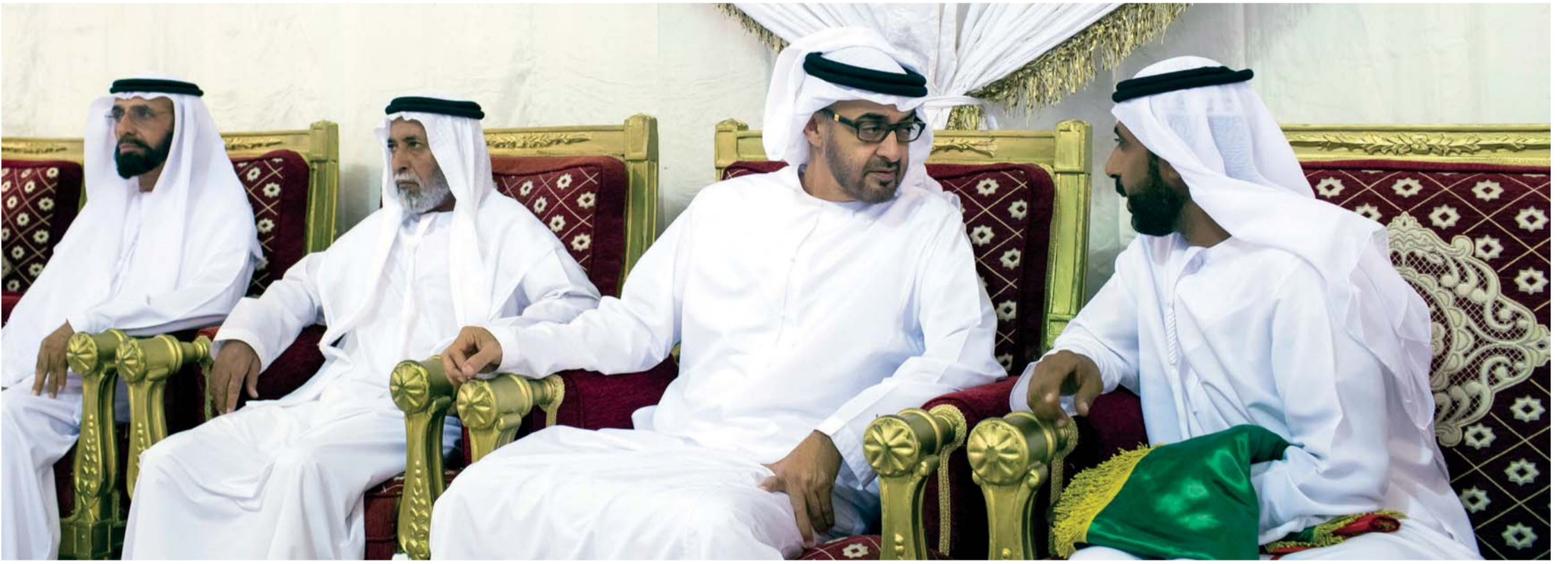
محمد بن زايد يعزي أسرة الشهيد البطل علي الكتبي | وام

ولي عهد أبوظبي: ماضون في ردع المتآمرين على منطقتنا وشعبنا