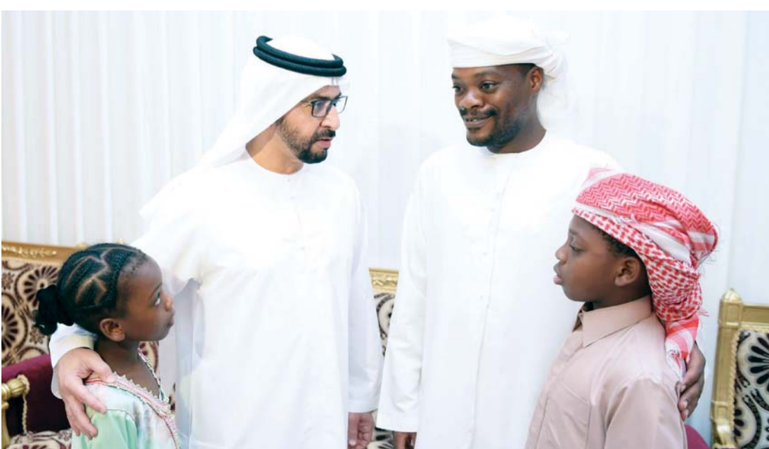
حمدان بن زايد يعزي أسرة الشهيد أحمد الحمادي