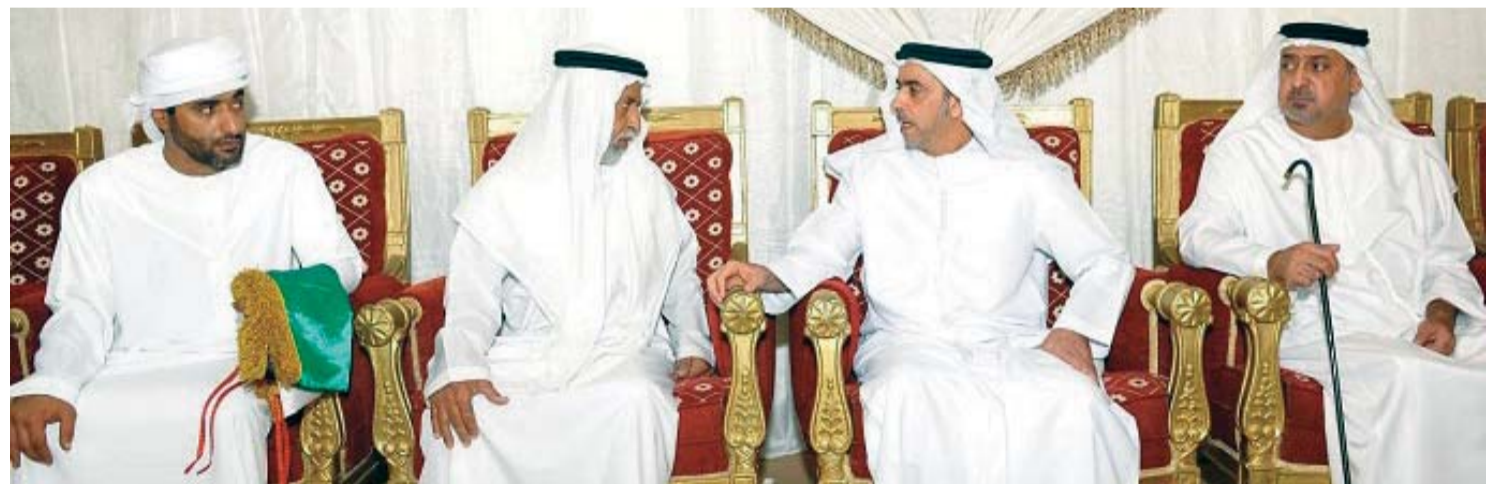
■ سيف بن زايد يعزي أسرة الشهيد علي الكتبي يرافقه سلطان بن خليفة