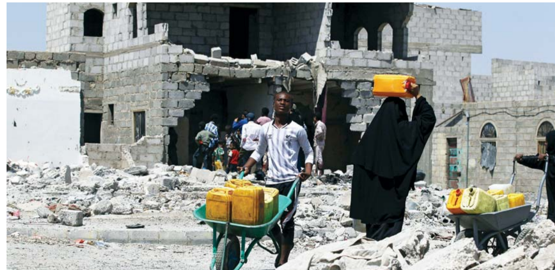
يمنيون يحملون صفايح مياه فارغة لتعبئتها في صنعاء التي تعيش أسيرة الانقلابيين

وبحسب ما أكده رئيس جهاز الاستطلاع الأسبق في القوات المسلحة المصرية اللواء نصر سالم، فإن المعارك الدائرة