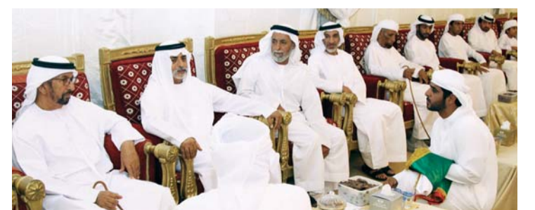
نهيان بن مبارك يعزي أسرة الشهيد علي الكتبي | وام