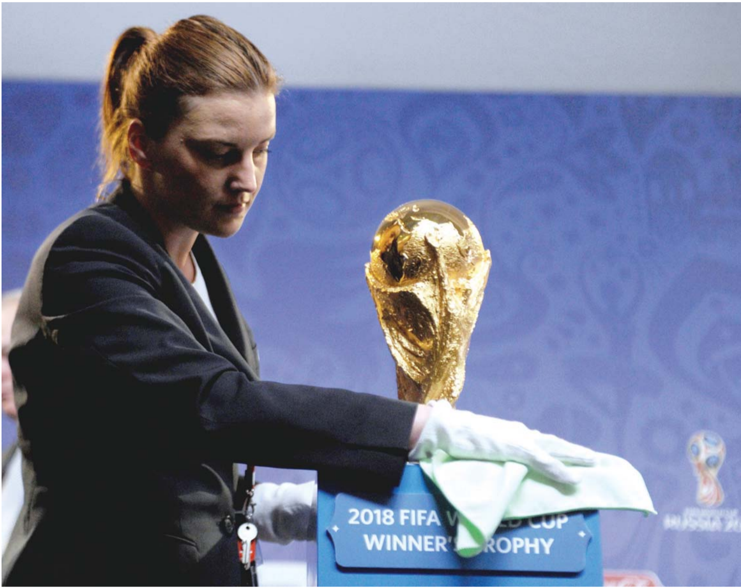
■ متطوعة تجهز أسماء المتحدثين خلال الحدث

وقدم بلاتر استقالته من رئاسة الفيفا بشكل مفاجئ في الثاني من يونيو الماضي بعد أربعة أيام على فوزه بولاية خامسة على التوالي تحت وطأة فضائح الفساد المتتالية، ودعا إلى جمعية