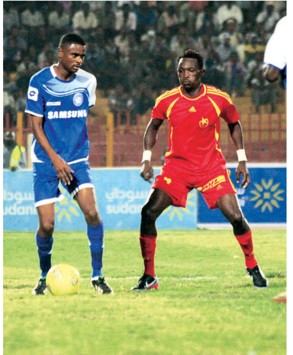
من لقاءات الهلال والمريخ | أرشيفية