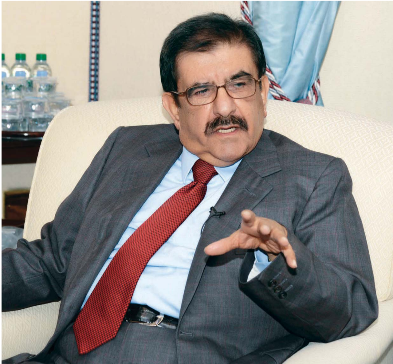
■ حمدان بن راشد تحدث للوفد الإعلامي عن قضايا مهمة