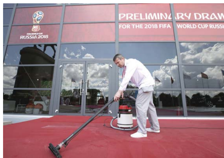
قصر قسطنطين جاهز للعرس المونديالي