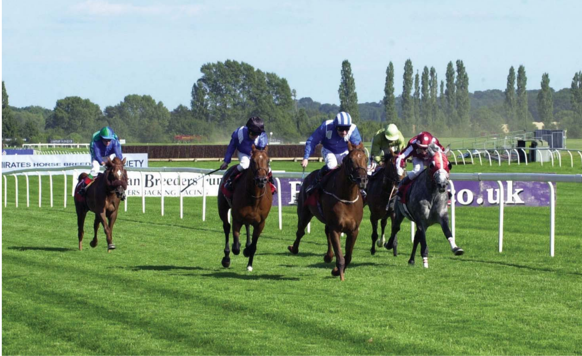
■ تألق كبير لخيول الإمارات في السباقات الكبيرة

أجاب سمو الشيخ حمدان بن راشد آل مكتوم على سؤال حول قرار مشاركة تغرودة في سباق كينغ جورج والملكة إليزابيث ستيكس وأكد انه قرر اشراك المهرة الرائعة في السباق بعد فوزها في الاوكس الانجليزي رغم ان المدرب جون جوسدن كان يرغب في مشاركتها بسباق بري فيرميلي، ويوركشاير او كس، وابدى تخوفه من اشراكها في ذلك السباق. وقال سموه الفارس بول هانيفان اخبره عقب فوزه بسباق الكينغ جورج بان ارضية مضمار اسكوت تناسبها تماماً ولا يجب اشراكها الا في هذه الارضية. ولهذا فان من اسباب خسارتها في يوركشاير او كس والارك الفرنسي عدم التعود على الارضية. هذا الى جانب انها كانت مصابة بفيروس الامعاء.