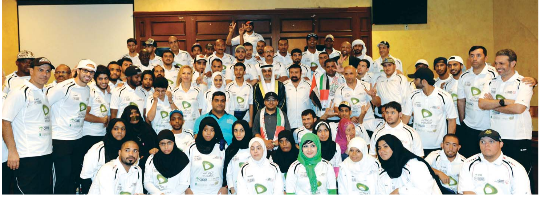
لقطة جماعية لبعثة فرسان الإرادة في لوس أنجليس | البيان

ثقافات وعلم وخبرات إلى الداخل، من أجل الارتقاء بمختلف القطاعات». وألقى ممثل طلاب الدولة بلبوس أنجليس كلمة رحب خلالها بمنتخبنا، مشيداً بالاهتمام الكبير الذي توليه القنصلية بالطلاب المتعثين، فيما ألقى أيضاً أحد الطلاب قصيدة شعرية في حب الوطن، أعقب ذلك تقديم رقصات شعبية من البولة بمشاركة الطلاب ولاعبى منتخبنا.