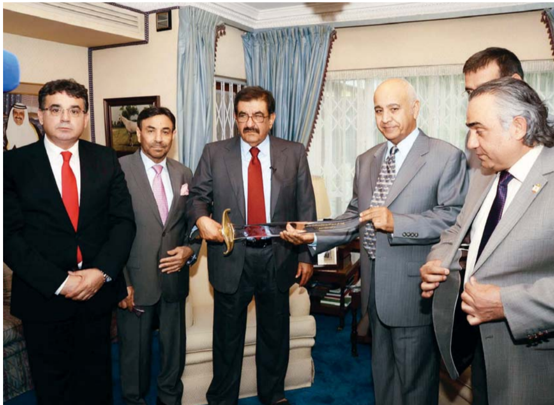
■ حمدان بن راشد يتلقى هدية من اللجنة المنظمة