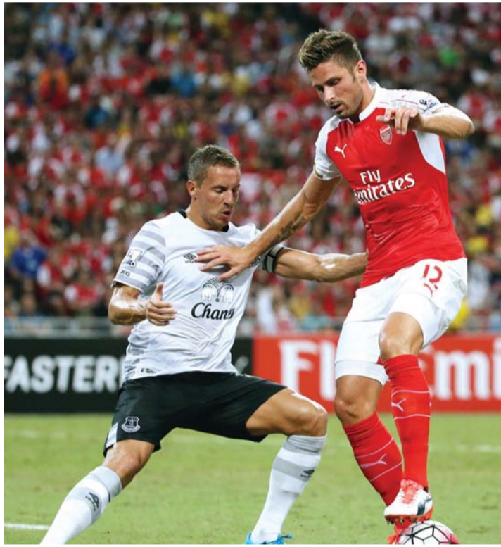
■ جبرو يقود أرسنال أمام ليون اليوم | أقب

وأكد فينغر، في تصريحات نشرتها صحيفة (إيفينج ستاندرد) اللندنية، أن تماسك الفريق أهم لديه من إبرام صفقة