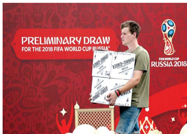
■ آخر الترتيبات قبل مراسم القرعة | أب