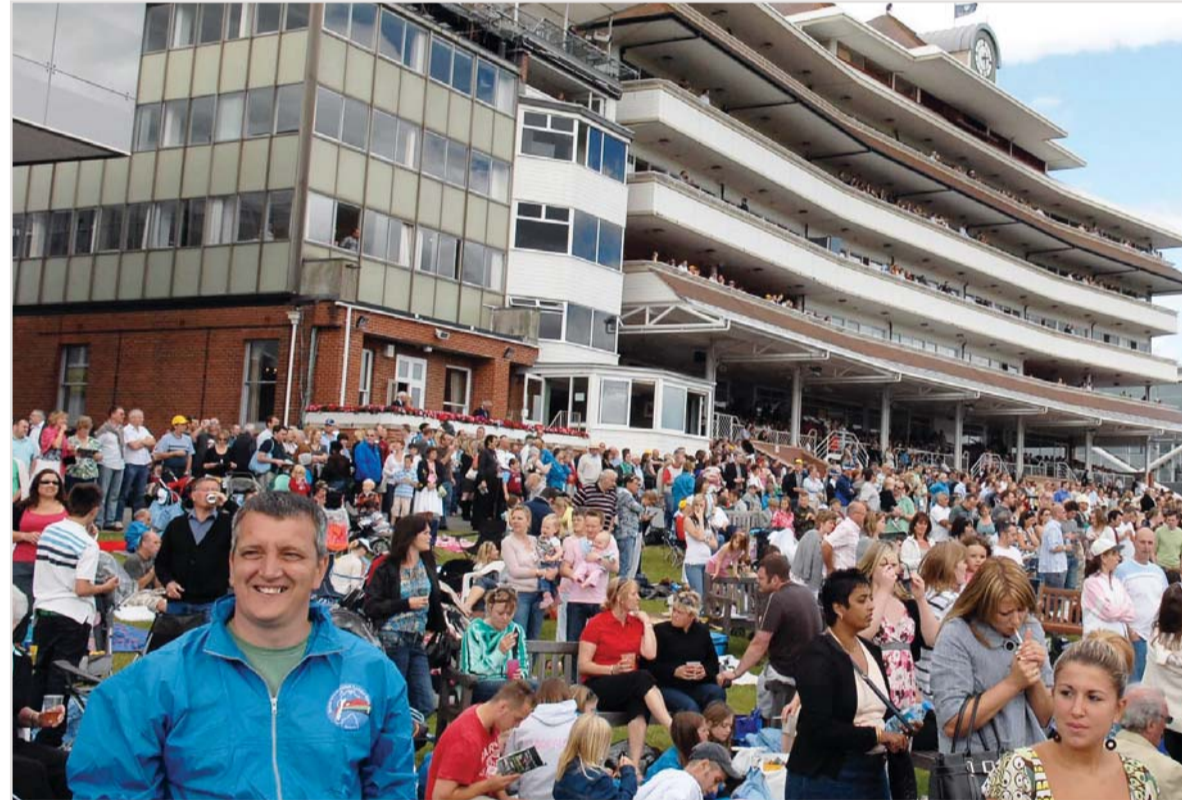
■ حضور جماهيري كبير في سباق يوم دبي بنينوري

وتحسين انسال الخيول مبكراً في هذه السن الصغيرة قال سموه بان «اواسيس دريم» والد «محرر» بدأ يقل انتاجه كما ان آل مكتوم ومزارع دارلي وشادويل لا تملك هذه الدماء والسلالة النادرة. لذا ارتأينا الاستفادة من «محرر» الفائز بسباق جيم كراك وكأس الكمونولث ودارلي جولاي كب.