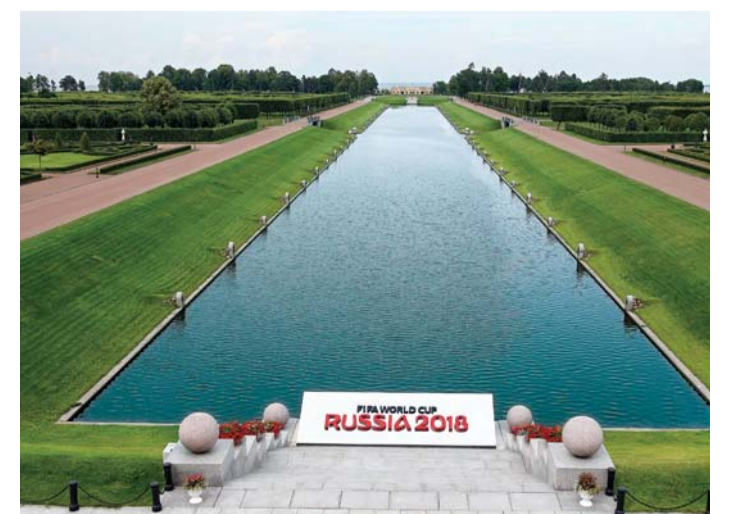
■ روسيا تعيش على وقع القرعة