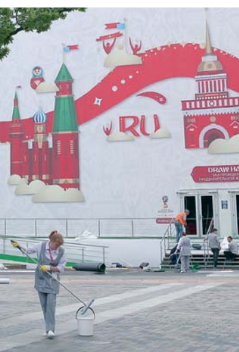
■ متطوعة تحدى المطر متجهة نحو مقر القرعة

عمومية غير عادية لانتخاب رئيس جديد. ويسبق سحب القرعة حفل كبير يشارك فيه مجموعة من أبرز لاعبي كرة القدم السابقين والحاليين يتقدمهم البرازيلي رونالدو والأوروغوياني دييغو فورلان والإيطالي فيابو كانافارو والكاميروني صامويل إيتو والمهاجم