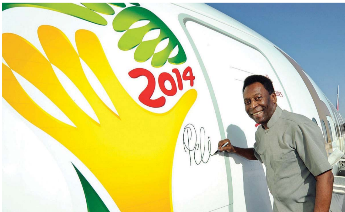
طيران الإمارات راعية بطولات «فيفا» | أرشيفية

وتتملك طيران الإمارات بصفتها راعياً رسمياً للاتحاد الآسيوي لكرة القدم حقوق الدعاية في جميع بطولات الاتحاد الآسيوي لكرة القدم بما فيها دوري أبطال آسيا وكأس الاتحاد الآسيوي وكأس تحدي الاتحاد الآسيوي، إضافة إلى عدد من البطولات على مستوى الأندية ومنتخبات السيدات والشباب. ومن خلال هذه الشراكة، سوف تحظى طيران الإمارات بانتشار إعلامي واسع مع إقامة أكثر من 120 مباراة للاتحاد