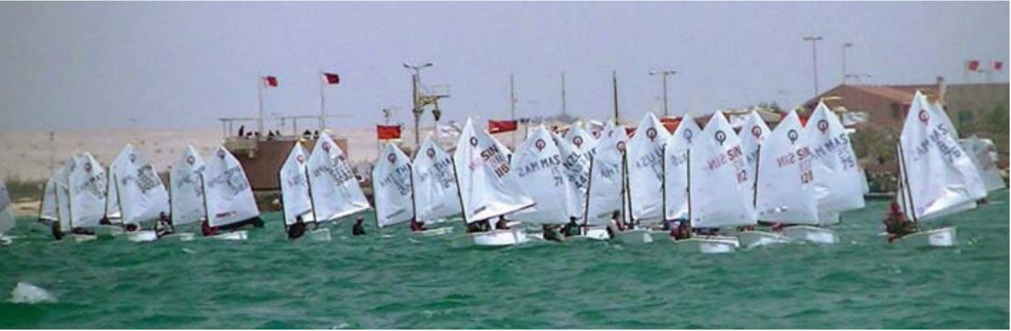
من منافسات الشراع الحديث | البيان

القائمون على المعسكر تحقيق مراكز واستفادة كبيرة أيضاً من بطولة الأسبوع البحري الدولي والمقامة بالمضيق في منطقة أغادير، ومن المتوقع أن يشارك أعضاء الفريق والمختارون للمشاركة مع