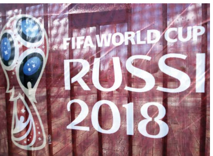
الشوارع تزين بالمونديال | أ ف ب

ملعب الافتتاح والنهائي | أرشفية وسبارتاك في موسكو وكذلك على استادات مدن كازان ونيجني نوفوورود وروستوف وسان بطرسبرج وسامارا وسوتشي. وفي المقابل، تقتصر مدن ييكاترينبيرج وكالينينجراد وسارانسك وفولجوراد على استضافة بعض مباريات الدور الأول (دور المجموعات للبطولة). وتقرر وضع المنتخب الروسي ممثل البلد المضيف على قمة المجموعة الأولى بالدور الأول لكل من بطولتي كأس القارات 2017 ومونديال 2018 كما سيكون الفريق أحد طرفي المباراة النهائية لمونديال 2018. وتشهد قرعة التصفيات المؤهلة لمونديال 2018، والمقررة اليوم في قصر كونستانتين بمدينة سان بطرسبرج، 141 من 206 اتحادات أعضاء في الاتحاد الدولي للعبة (فيفا) وذلك ليتعرف منتخب كل من هذه الدول على موقعه في التصفيات فيما انطلقت فعاليات التصفيات الآسيوية بالفعل حيث تنتظر القارة الآسيوية فقط معرفة مصير المنتخب الذي سينهي التصفيات بالمركز الخامس آسيوياً حيث يلتقي مع منتخب من اتحاد قاري آخر في دور فاصل على بطاقة التأهل للمونديال.