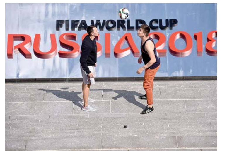
المونديال ينشر كرة القدم في المجتمع الروسي