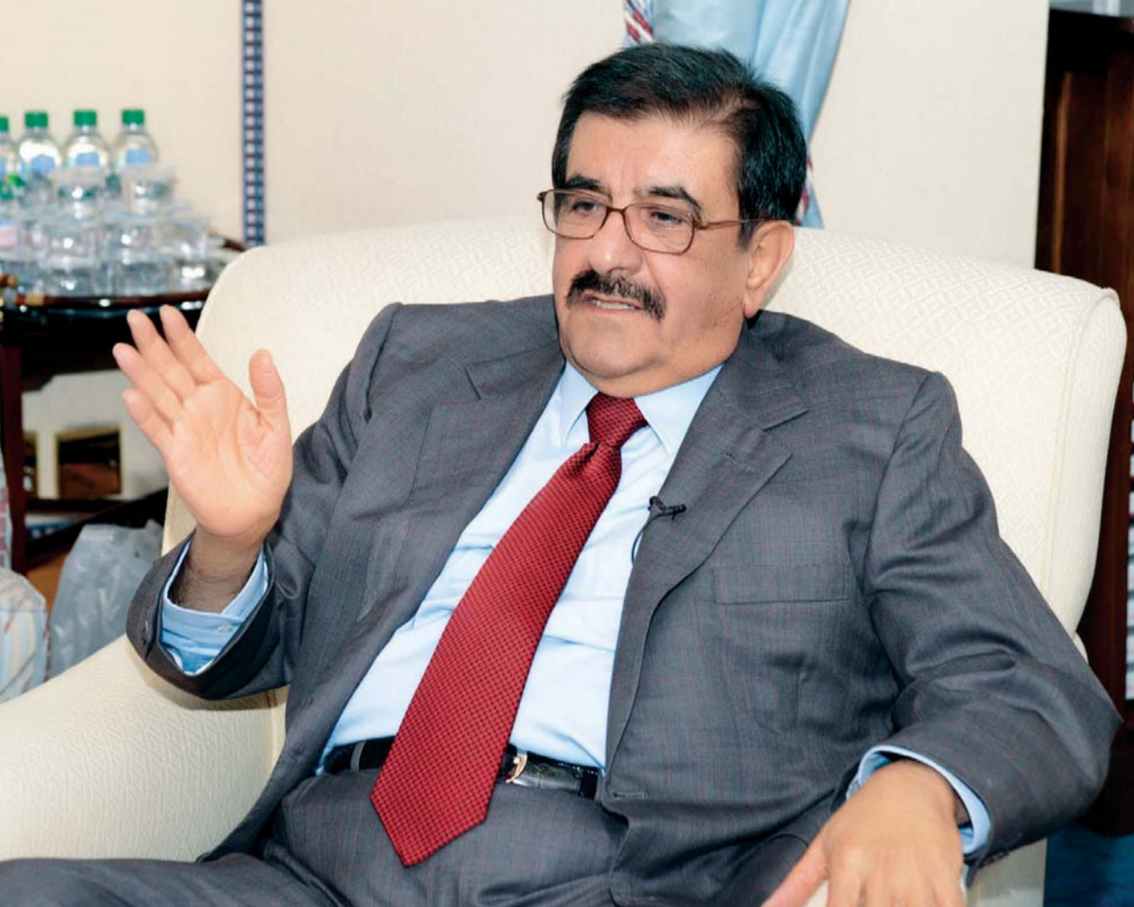
حمدان بن راشد خلال حديثه للوفد الإعلامي

لندن . بهاء الدين عطا أكد سمو الشيخ حمدان بن راشد آل مكتوم نائب حاكم دبي وزير المالية، أن الفضل في تنظيم سباقات الخيول العربية بأوروبا يعود إلى المغفور له الشيخ زايد بن سلطان آل نهيان «يرحمه الله»، وذلك عندما وجه بذلك في أواخر السبعينات. وأضاف سموه قائلاً خلال حديثه إلى قناة دبي ريسينغ والوفد الإعلامي في لندن أمس إن فقيه الوطن الشيخ زايد بن سلطان آل نهيان وجه بضرورة نقل سباقات الخيل العربية إلى أوروبا لتأكيد جدارتها وريادتها، وبعد مرور سنتين من ذلك طالب الفقيه الراحل بتنظيم تلك السباقات وأن تكون البداية في بريطانيا. وأعلن سموه بكل الصراحة أن السباقات التي أقيمت في ألمانيا وفرنسا إضافة إلى سباق دبي الدولي بنوبيري تعتبر الأفضل ومتقدمة على سباقات بريطانيا، وأضاف قائلاً إنه رغم كل السلبيات فإن مشوار تنظيم سباقات الخيول العربية في أوروبا يظل ناجحاً وأنهم يسعون إلى أن تسير على حسب النهج المرسوم وتحقق الأهداف المنشودة. واقترح سموه إقامة بطولة خليجية للخيول العربية يشارك فيها أفضل ثلاثة خيول من السباقات الأوروبية تقام سنة في دبي وأخرى في أبوظبي، وتقام قبل كأس دبي العالمية بحيث تشارك الخيول عقب ختام الموسم الأوروبي المنتهي في أكتوبر، وهذا ما يمنحهم فرصة 5 أشهر للاستعداد للبطولة وتوقيع سموه إقامة البطولة <02 خلال عام أو عامين.