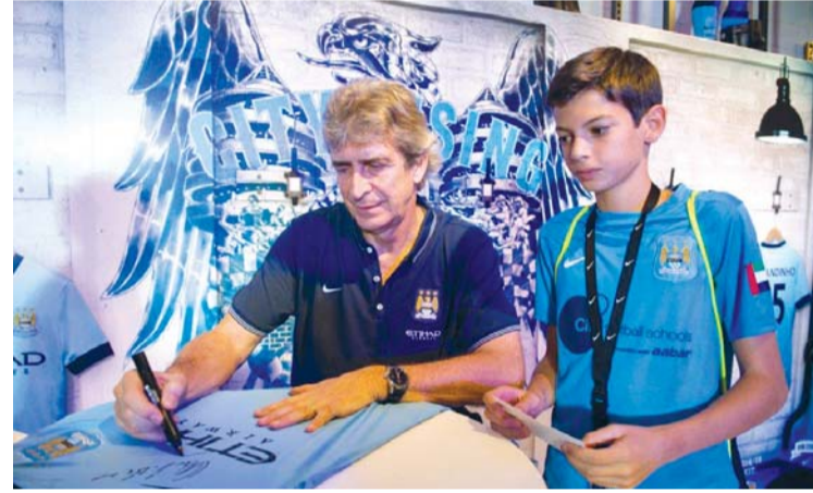
مانويل بليغريني خلال افتتاح معرض «نايكي» بأبوظبي