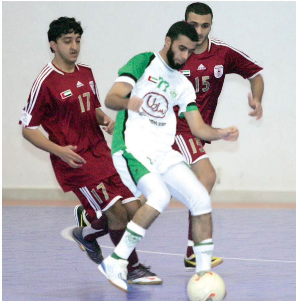
إسدال الستار على مباريات الدور الأول من دوري الصالات