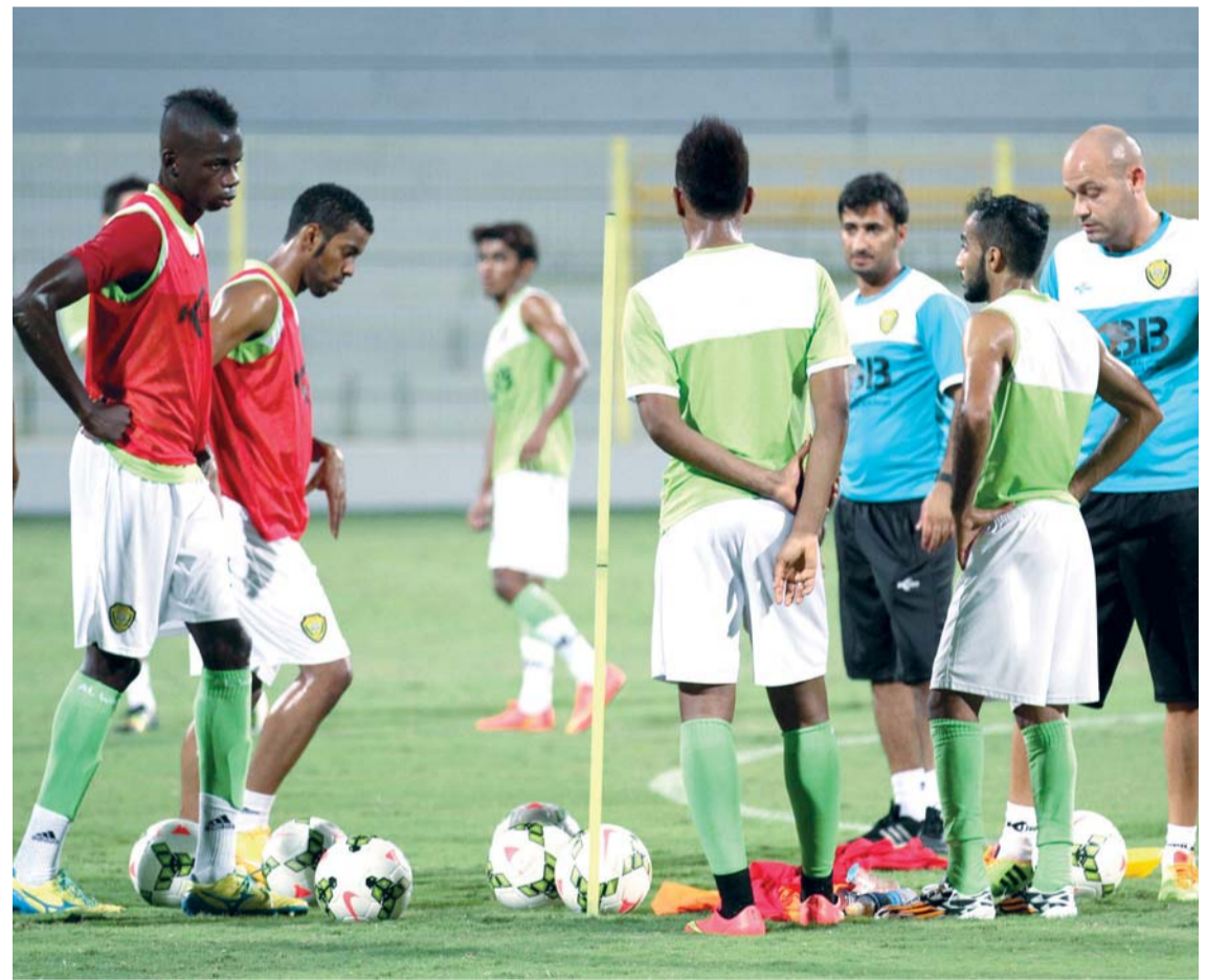
من تحضيرات سابقة لنادي الوصل