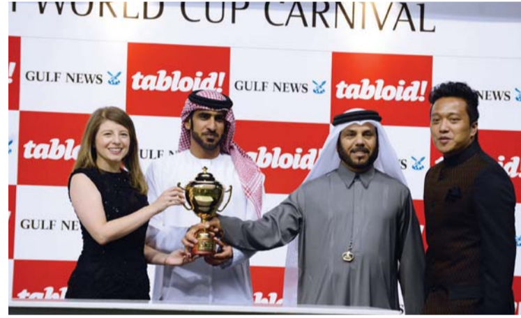
السبوسي والمهيري يتسلمان جائزة فوز «تمركز»