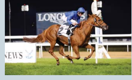
«شيك» وجهته «زعبيل للميل»