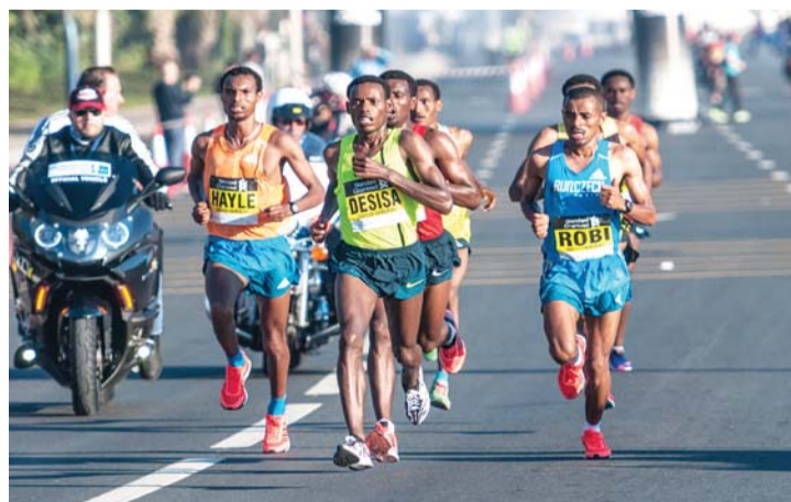
صراع قوي بين المشاركين للفوز باللقب

عن الاتفاقية الأخيرة التي وقعت بين اللجنة الأولمبية الوطنية ونظيرتها البريطانية، قال كو: «مدة اتفاقية التعاون 5 سنوات، وتشمل التعاون في كل المجالات الرياضية سواء مسكرات تدريبية أو تبادل خبرات أو دراسات للمدربين والحكام وغيرهم».