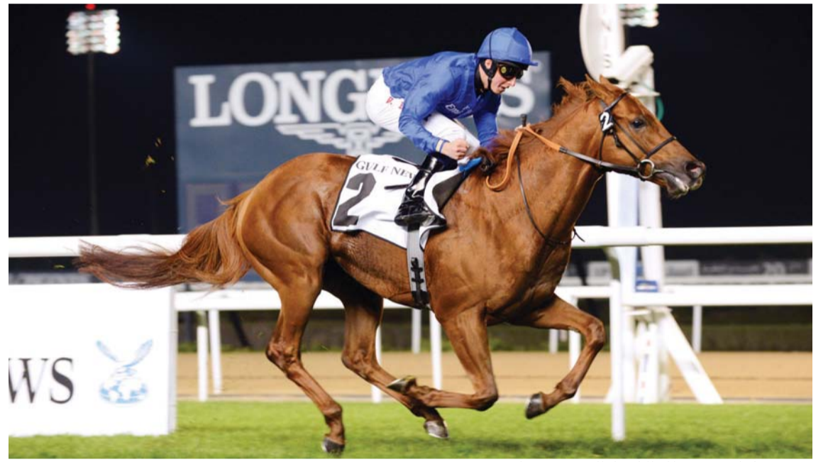
«سيفتي شيك» توج بطل الشوط الرئيسي بجدارة