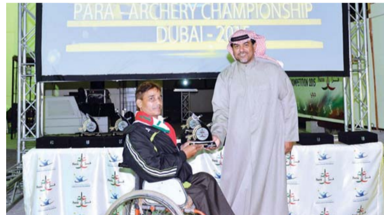
ثاني جمعة يكرم الفائزين في اليوم الأول للمنافسات

قال ثاني جمعة تعد بطولات فزاع لذوي الإعاقة عيداً للرياضيين إذ تشكل حافزاً لدى المشاركين والمشاركات من دولة الإمارات للتطور والتقدم ورفع اسم الدولة في كل مكان. وأسهمت بطولات فزاع لذوي الإعاقة في حصول دولة الإمارات على عضوية اللجنة البارالمبية الدولية. كما لعبت دوراً كبيراً في دعم ترشيح ماجد العصيمي لترؤس اللجنة البارالمبية الآسيوية في ديسمبر الماضي. كما نعزو انتشار بطولات فزاع لذوي الإعاقة دولياً إلى دعم وسائل الإعلام التي لا يخفى دورها في تعزيز مكانة وسمعة دبي حول العالم.