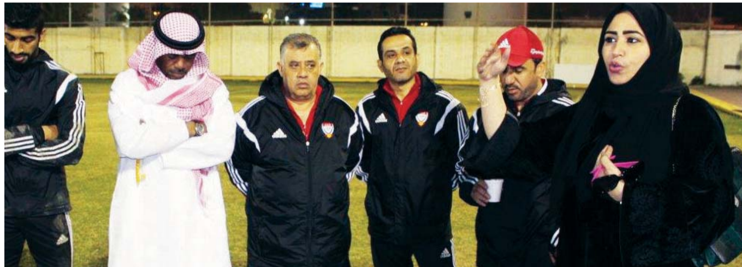
بعثة منتخبنا في حالة حزن على وفاة عاهل السعودية

أعلنت اللجنة التنظيمية لكرة القدم بمجلس التعاون لدول الخليج العربي، يوم أمس، عن تأجيل مباريات الدور نصف النهائي للنسخة السادسة لبطولة هواوي للمنتخبات الأولمبية المقامة حالياً في العاصمة البحرينية المنامة، وذلك حداداً على روح المغفور له بإذن الله تعالى، عبد الله بن عبد العزيز آل سعود عاهل المملكة العربية السعودية. وتقرر أن تلعب مباريات المربع الذهبي يوم غد (الأحد)، حيث سيخوض منتخبنا الأولمبي مواجهة من العيار الثقيل حينما يواجه شقيقه السعودي في الرابعة والنصف عصراً على ملعب البحرين الوطني، في حين ستلتقي الكويت مع عُمان في السابعة والنصف من مساء ذات اليوم وعلى نفس الملعب. وستقام المباراة النهائية في الساعة 11 صباحاً يوم (الثلاثاء) المقبل على ملعب البحرين الوطني يسبقها لقاء تحديد المركزين الثالث والرابع الذي سينطلق في الرابعة إلا بعضراً على ذات الملعب.