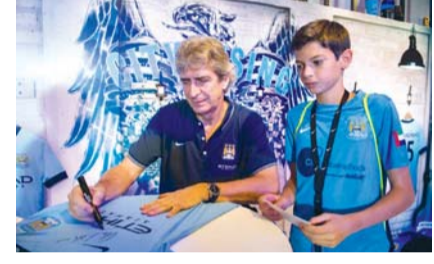
بليغريني: رونالدو الأفضل