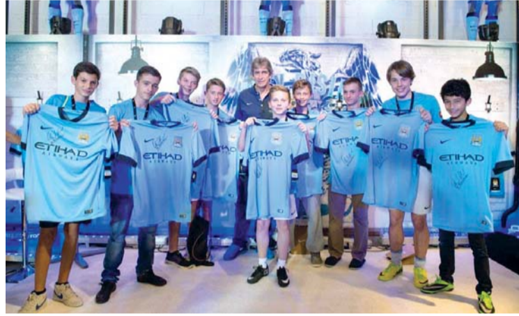
ناشئو مدرسة مانشستر سيتي لكرة القدم يستعرضون قميص النادي

التحدي الأكبر أكد مانويل بليغريني أن التحدي الأكبر بالنسبة له هو الفوز بدوري الأبطال. مؤكداً أن الفريق سوف يستعد جيداً لخوض مباراة برشلونة الشهير القادم في دور الـ 16 وأنه واثق من أن الفريق سيقدّم أداءً قوياً وبإمكانه العبور إلى دور الثمانية.