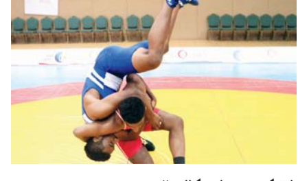
نتائج منطقية في دوري المصارعة