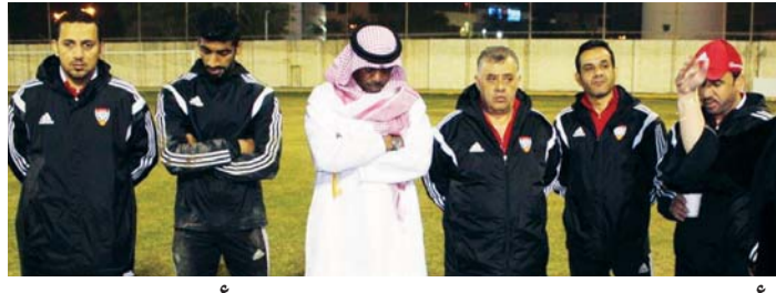
تأجيل بطولة الخليج للمنتخبات الأولمبية 48 ساعة