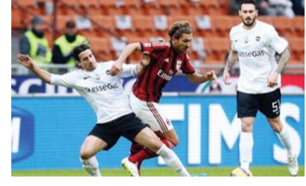
قمة بين ميلان ولاتسيو