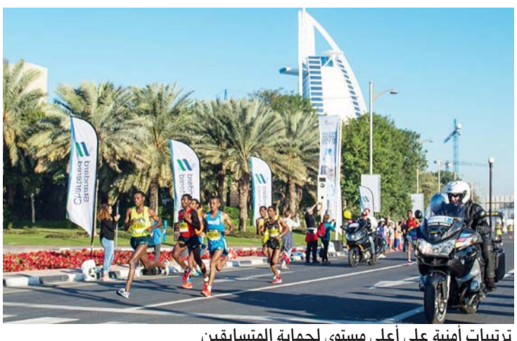
ترتيبات أمنية على أعلى مستوى لحماية المتسابقين