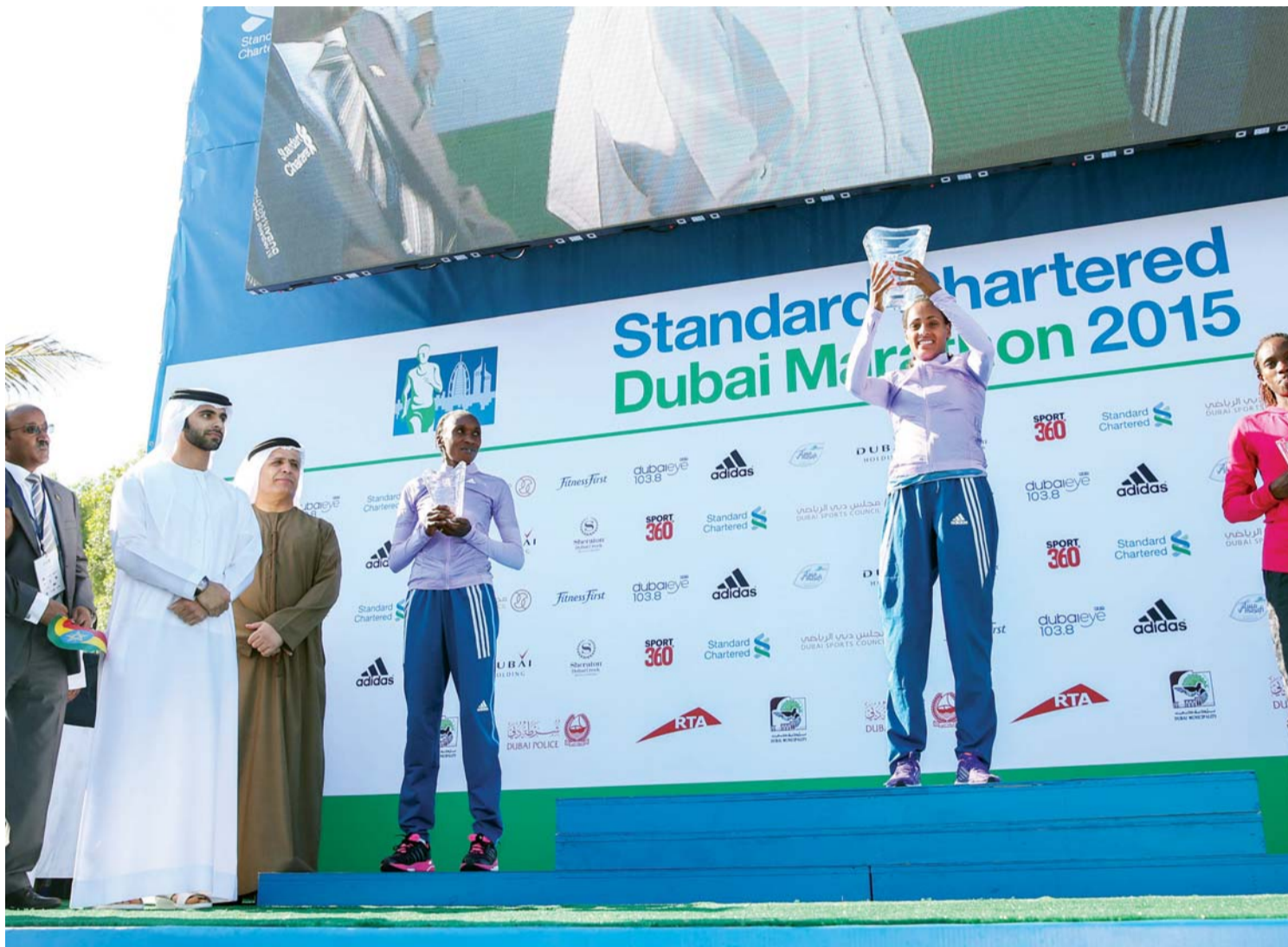
منصور بن محمد خلال تتويج بطلات السباق

أكد المستشار أحمد الكمالي عضو مجلس إدارة الاتحاد الدولي لألعاب القوى رئيس الاتحاد الإماراتي المنسق العام لماراثون دبي، أن حضور 17 رئيساً لاتحادات ألعاب القوى حول العالم لماراثون دبي، بما يشكلون نحو 10% من الجمعية العمومية للاتحاد الدولي، إضافة لتواجد 11 أمين سر من دول الخليج وبقية دول العالم، يعتبر شهادة على نجاح الحدث. وأوضح، أن مجموع جوائز الماراثون بلغ 4 ملايين و900 ألف درهم، منها مليون دولار مقدمه من مجلس دبي الرياضي، لافتاً إلى أن الماراثون لم يخسر أحد من الرعاة منذ تأسيسه وحتى نسخة أمس، وأكد أنه من علامات النجاح أيضاً، حضور سبستيان كو رئيس اللجنة الأولمبية البريطانية، ودحلان الحمد نائب رئيس الاتحاد الدولي لألعاب القوى، لمتابعة السباق لأول مرة، والإشادة بالتنظيم الرائع والناحية الأمنية، بعد وصول عدد المتسابقين لأكثر من 33 ألف شخص، ما يمثل قمة الانضباط.