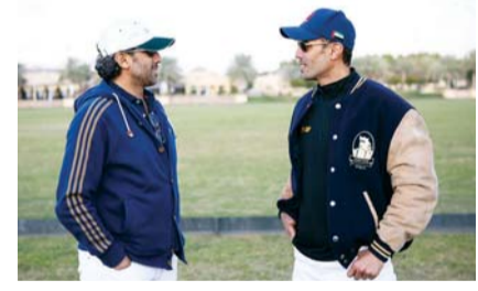
الشقيقان في كأس دبي الفضية للبولو