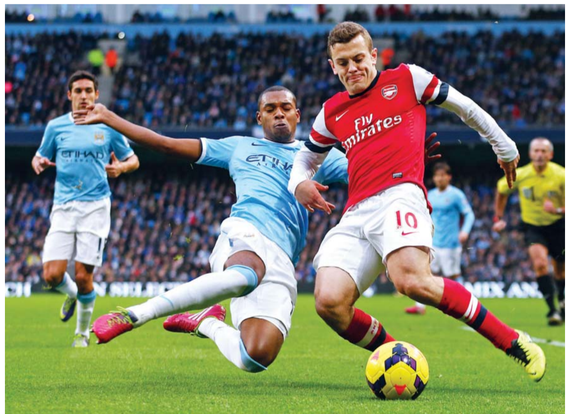
الصراع يتجدد بين أرسنال وسيتي (أرشيفية)