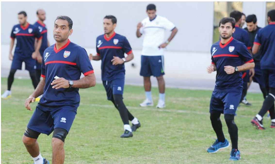
حكام الكرة يجرون اختبار اللياقة اليوم قبل انطلاق الموسم الجديد

تأهيل الحكام بشكل جيد قبل انطلاق منافسات الموسم الجديد، كما شمل برنامج المعسكر المحلي إقامة محاضرات عملية عن قانون اللعبة والتدريب على كيفية مواجهة العديد من حالات اللعب وكيفية التعامل معها، ونظرية عن كيفية