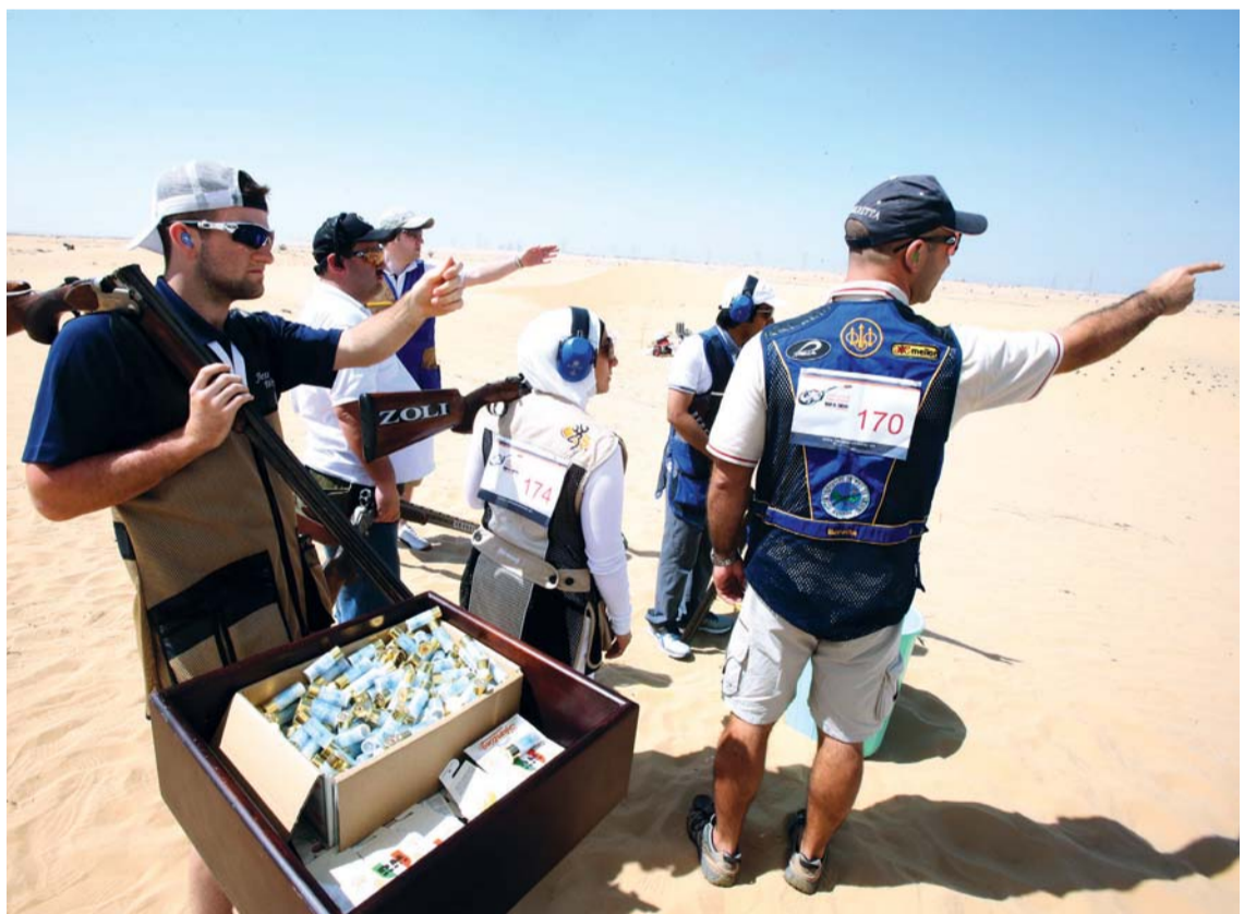
إنهاء مشاركتها في بطولة ند الشبا للرماية

وعن أهمية هذه الخطوة، تقول آل ثاني إن خطوة كانت بمثابة فتح باب مشاركة المرأة في الرماية على مصراعيه وإغلاق كافة الشكوك والعقبات في قدرات المرأة على ممارسة هذا النوع من الرياضة، وتصحيح بعض الأفكار والمعتقدات الخاطئة أن الرماية لعبة شاقة لا قدرة للمرأة في التعامل معها، ولذا، عندما كانت تشعر بقوة التحديات والمتاريس والعقبات، سواء كان في نوع السلاح المسموح لها بممارسة الرياضة عليه أو البيئة أو طبيعة المشاركات ونوع البطولات، فإنها تضع نصب عينها أنها إن فشلت، فهذا يعني إغلاق الباب نهائياً أمام المرأة الإماراتية في ممارسة هذا النشاط الذي هو من صميم تراثنا العربي والإسلامي، ولا يعقل أن تكون الإماراتية بعيدة عن هذا المضمار التراثي المعاصر، لا سيما أنها صارت لعبة أولمبية فخر بما حقق لنا الشيخ البطل أحمد بن حشر من إنجاز في هذا المجال بأن تكون أول ميدالية أولمبية للدولة في الرماية.