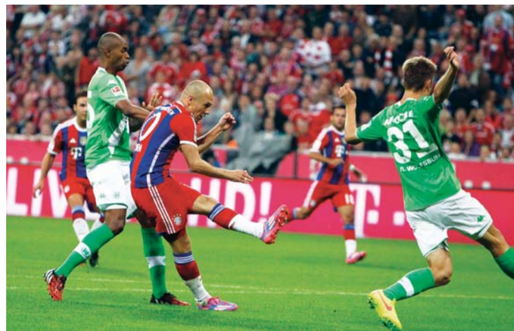
بايرن يواجه شتوتغارت (أرشيفية)

مرتفعة من مشاركته مع منتخب بلاده في تصفيات كأس أوروبا 2016 حيث سجل رباعية في مرمرى منتخب جبل طارق (7-0) في الوقت الإضافي إلى عائلة الاتحاد الأوروبي للعبة.