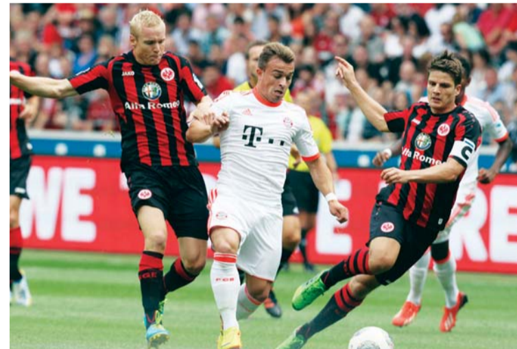
شاكيري مطلوب في الدوري الإيطالي (أرشيفية)