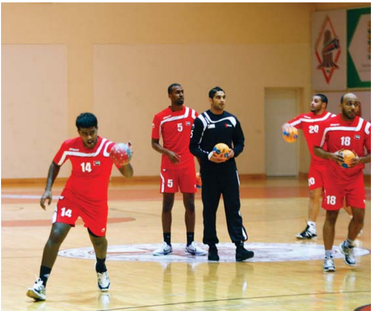
جانب من تدريبات سابقة لمنتخب اليد

توجه د.عيسى النعيمة بالشكر إلى سمو الشيخ أحمد بن محمد بن راشد آل مكتوم رئيس اللجنة الأولمبية الوطنية وأمانتها العامة على سرعة الاستجابة لتوفير الدعم الكافي لمنتخبنا الوطني لكرة اليد، الذي يستعد لدورة الألعاب الآسيوية بمصر، مشيراً إلى أن التحضيرات كانت جيدة وقد خاض المنتخب 4 تجارب ودية ناجحة.