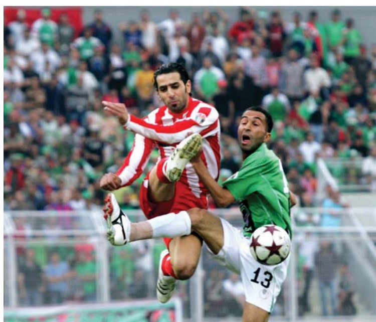
متابعة الدوري الأردني الإلكتروني بعد انحسار وسائل الإعلام الكلاسيكية البيان