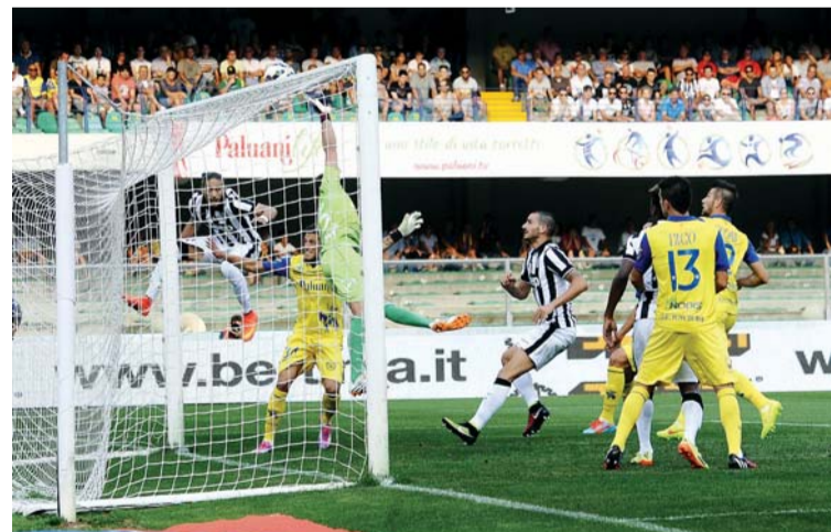
يوفنتوس يخطط للفوز الثاني (أرشيفية)