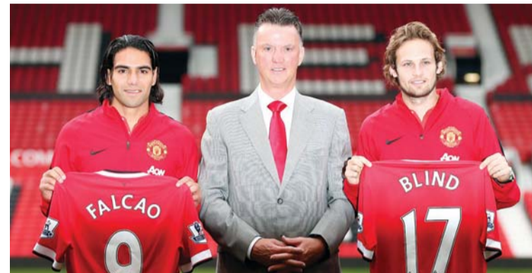
فالكاو عند تقديمه وداني بليد إلى وسائل الإعلام (رويترز)