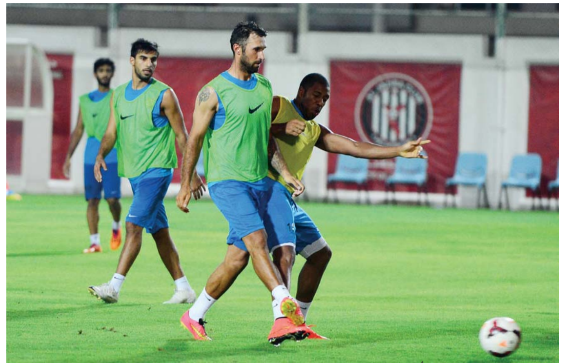
تدريبات قوية للجزيرة استعداداً للموسم المقبل

الآن مستعدون بشكل جيد، وكل لاعب في الفريق سيؤدي واجبه ويزيد عليه في الموسم الجديد».