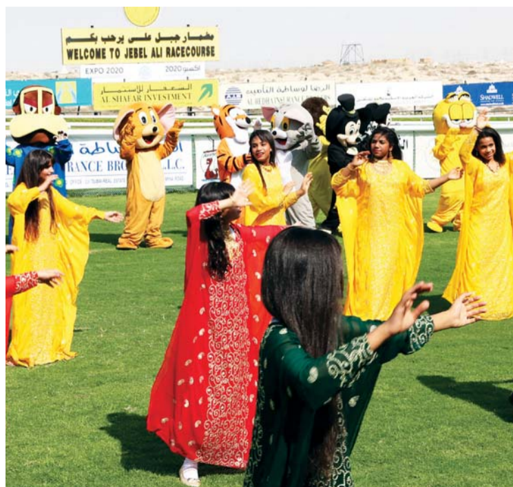
احتفال رابع بمضمار جبل علي

شيقة عديدة تم تنظيمها في المهرجان الأول، بدأت بعروض شعبية لفرق خميس المقابلي التي قدمت فواصل من الرقصات التراثية الخليجية بين أشواط السباق كما قدم مجموعة من الاطفال عروضاً شعبية أخرى في الرقصات الشعبية نالت الرضا