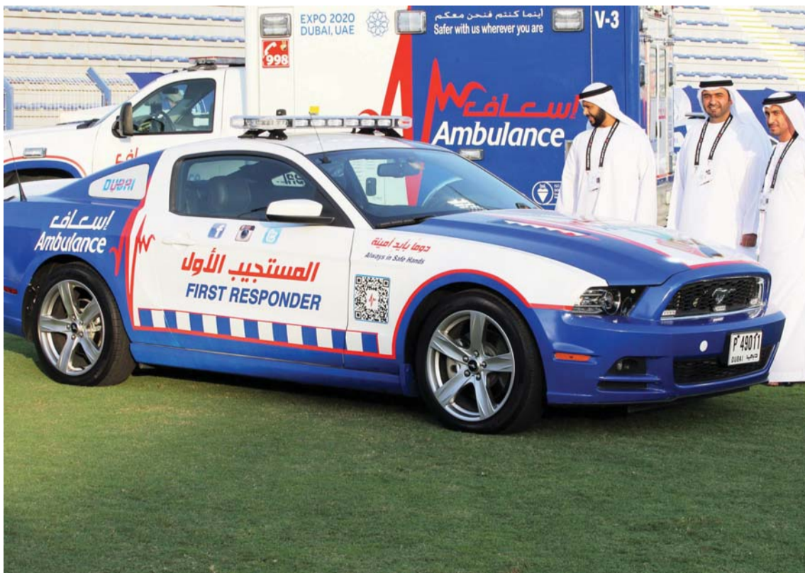
سيارة الاسعاف خطفت الأنظار في استاد آل مكتوم

ان رسالة قسم الشؤون الطبية بنادي و شركة النصر مبنية على ثلاث ركائز وهي: عقل سليم و جسم سليم و خدمات صحية متميزة.