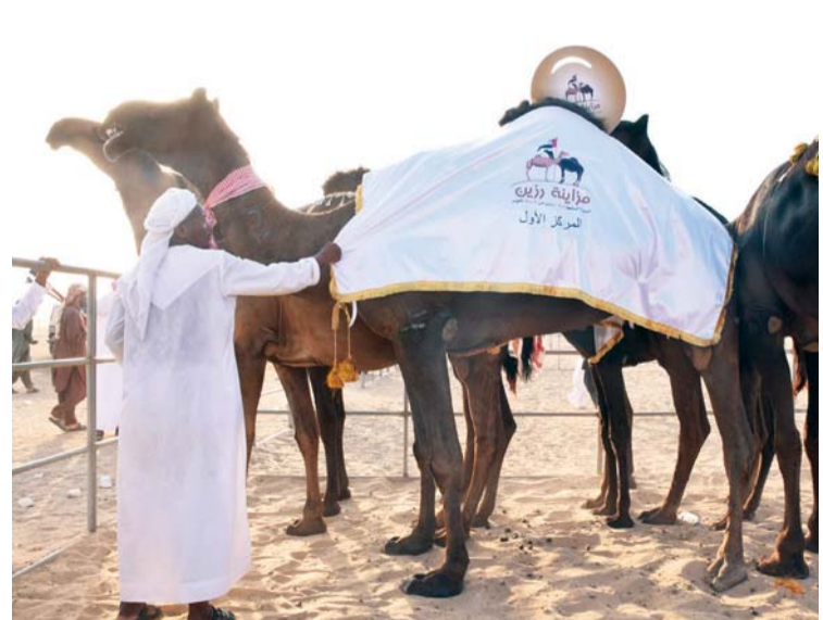
الإبل الفائزة عقب التتويج

وتعتبر «مزايينة رزين» من أكبر وأهم المزايينات الفرعية والتأهيلية للمزايينات الكبرى في دولة الإمارات كمزايينة بينونة للإبل ومهرجان مزايينة الظفرة وتنحصر المشاركة فيها على أبناء دولة الإمارات. وحققت المزايينة منذ انطلاقتها نجاحاً وتطوراً كبيرين وأصبحت محطة هامة بالنسبة لملاك الإبل ومحبي التراث. وتهدف المزايينة إلى المحافظة على الإبل كركن أساسي من موروث الإمارات العريق والتأصيل لهذا التراث الغني كجزء من ثقافتنا وهويتنا الوطنية، وذلك ترجمة لحرص واهتمام القيادة الرشيدة بجميع