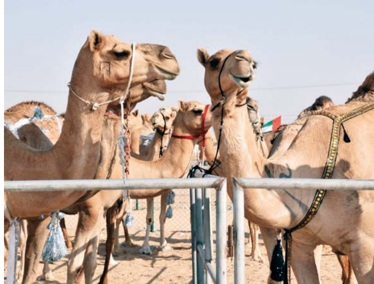
أفضل الأصايل تنافست في المزايينة

بدوره المفاعل في إنجاح فعاليات المزايينة وتحقيق أهدافها. وقال: «إننا نسير على خطى المغفور له الشيخ زايد بن سلطان آل نهيان، طيب الله ثراه، في الحفاظ على موروثنا الذي نفخر به، حيث منح رحمه الله التراث اهتماماً كبيراً خاصة للإبل الأصيلة وشجع على المحافظة عليها وخصص لها مهرجانات لدورها الكبير في حفظ الموروث وتعزيز الهوية الوطنية لأبناء الإمارات من خلال إقامتها ودعمها للعديد من المشاريع الثقافية والتراثية، وكذلك الداعمين للمزايينة من الملاك والمواطنين، وأشاد