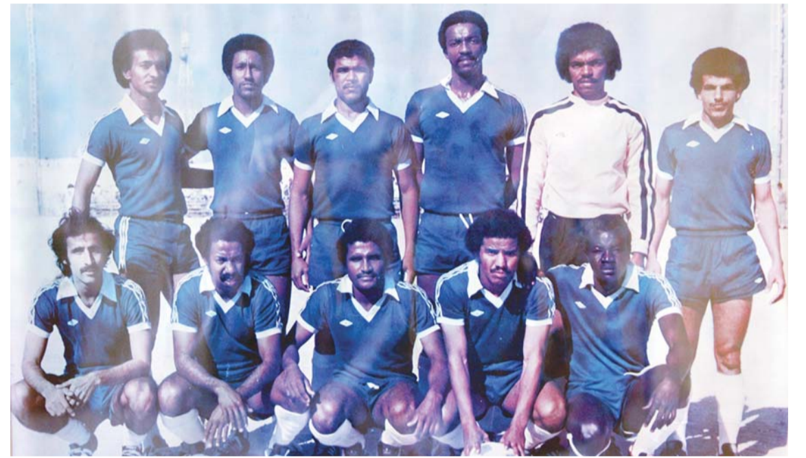
جيل السبعينات في نادي النصر

عندما سعدت إلى الفريق الأول للمرة الأولى، لقد كان على تواصل مستمر معي على أرضية الملعب بحكم أنني أشغل مركز ظهير أيمن فيما كان هو يلعب في مركز الدفاع، لم يبخل عليّ بالتمتع والتوجيه، في الحقيقة أنا أدين له بما قدمه لي وأدعو الله أن يرحمه ويرزق أهله الصبر. وأضاف: اعتبره أحد أفضل المدافعين، الذين لعبوا في النصر ورغم قصر المدة،