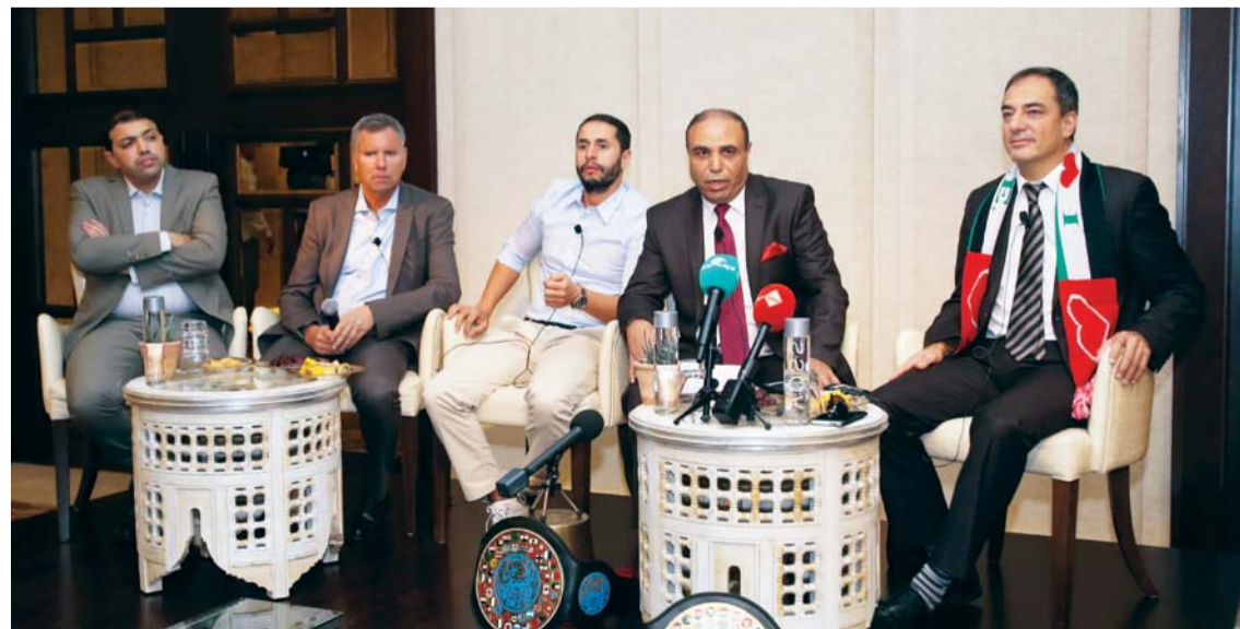
موريس والسديري وكورتوا وخنوس خلال المؤتمر الصحافي

قال السيناتور البلجيكي ألن كورتوا، رئيس اللجنة المنظمة لبطولة أمم أوروبا 2020، إن بطولة السلام للملاكمة العربية، ستشكل منصة قوية لتحقيق الأهداف السامية لها. وإرسال رسالة قوية لأوروبا بأنه هنا يوجد من يؤمن بالسلام. وعبر رئيس اللجنة المنظمة لبطولة أمم أوروبا 2020، عن إعجابه الكبير بالتنظيم الممتاز للبطولة، وحسن الضيافة والاستقبال التي لاقتها. مضيفاً بأن هذا يدل على مدى حرص المنظمين على إظهار الحدث الكبير بالشكل الذي يليق به.