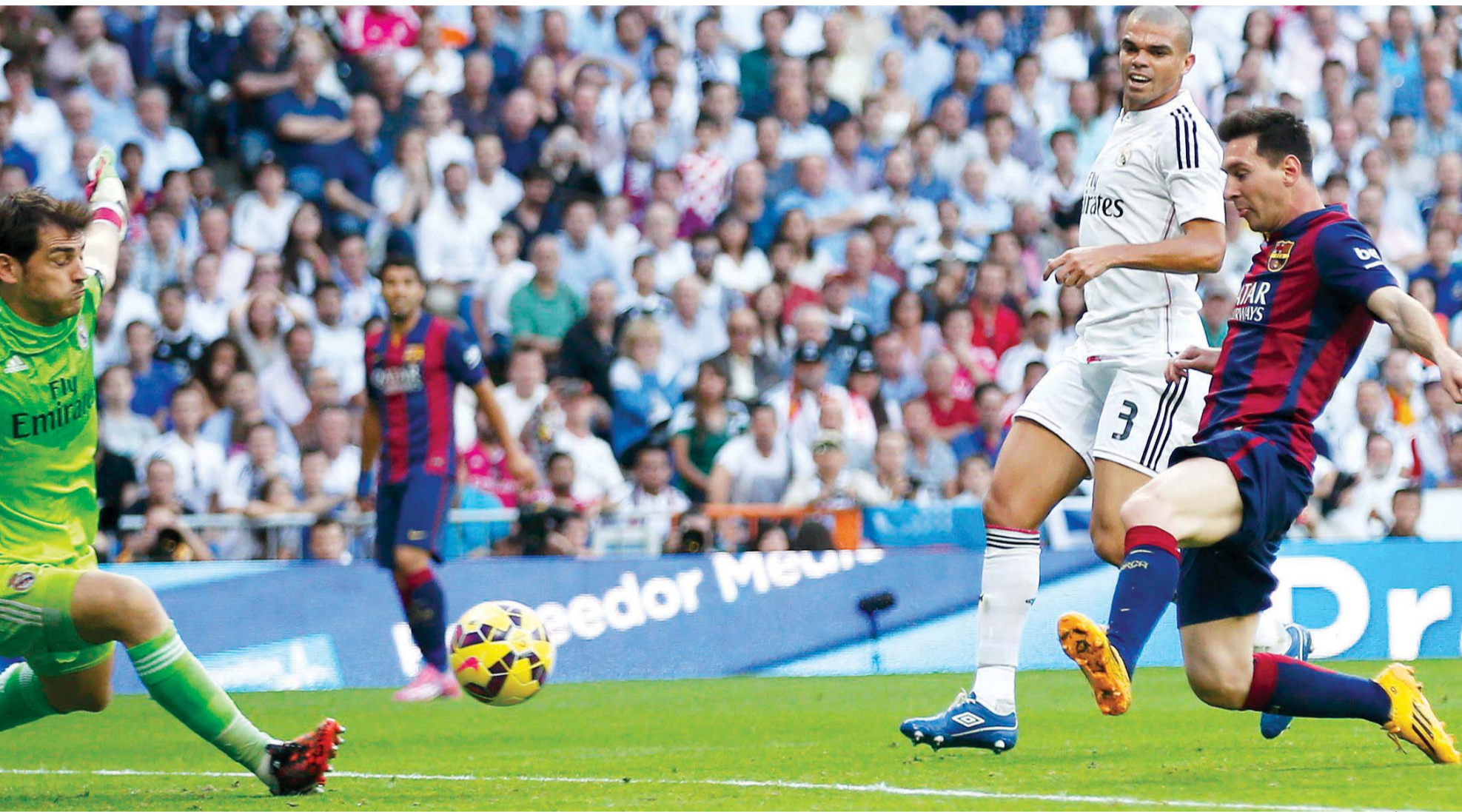
الكلاسيكو أشعل الصراع على قمة الدوري الإسباني