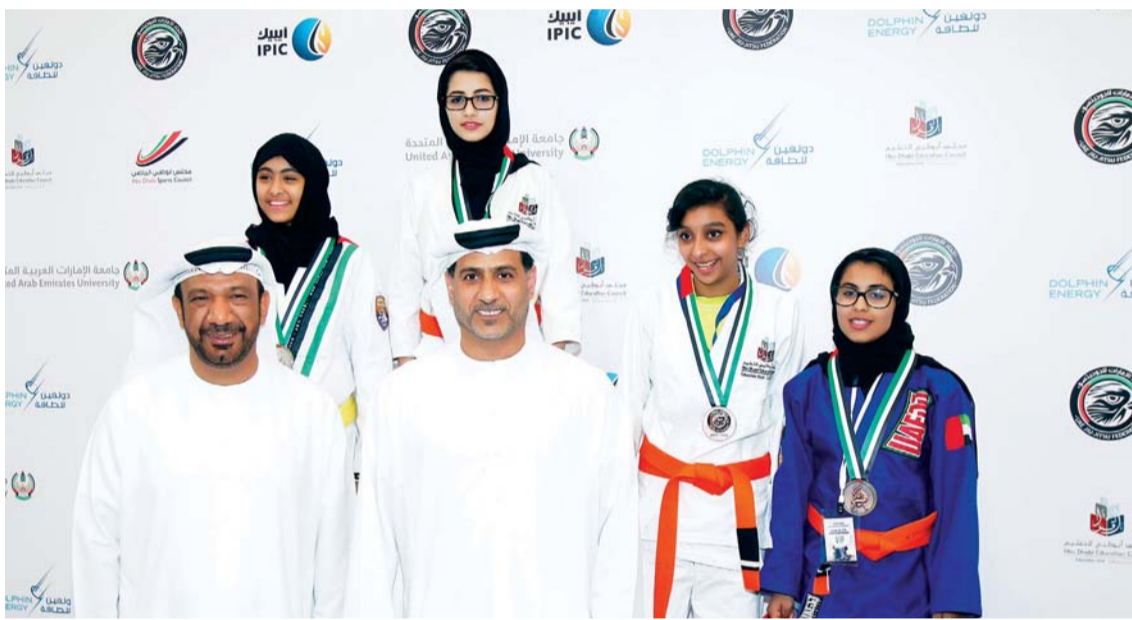
صورة تذكارية مع بطلات المستقبل البيان