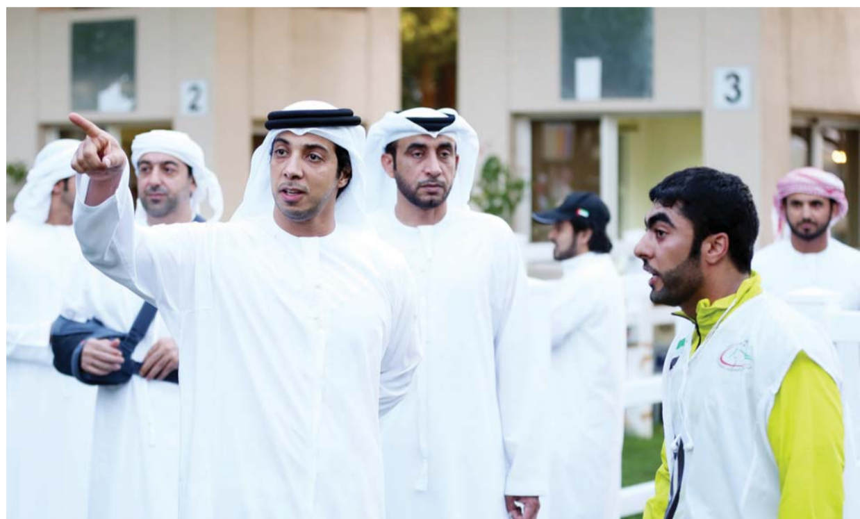
منصور بن زايد يوجه أحد الفرسان