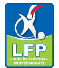
باريس سان جرمان يبحث عن انتصار جديد