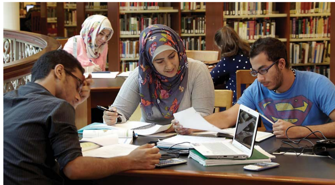
الجامعة تسعى إلى الارتقاء بالروح البحثية لدى الطلبة | البيان

وإيجاد رعاة يتبنون نتائجها لاستثمارها مستقبلاً. وأشار إلى أن إقبال الطلبة يعتبر كبيراً للمشاركة في المسابقات البحثية، التي تقيمها الجامعة والتي تنوع اختصاصاتها بحسب كليات الطلبة، وهذا ما جسدهته الأرقام الكبيرة التي وصلت إليها عدد الأبحاث المقدمة للمشاركة بالجازة، لافتاً إلى أن الطلبة أصبحوا يتنافسون للاشتراك بها، لما يجدونه من دعم كبير مقدم من الشركات الراحية، وهو ما يتمناه أصحاب الأفكار المتميزة التي يريدون تطبيقها بشكل عملي، لما تمثله لهم من انطلاق