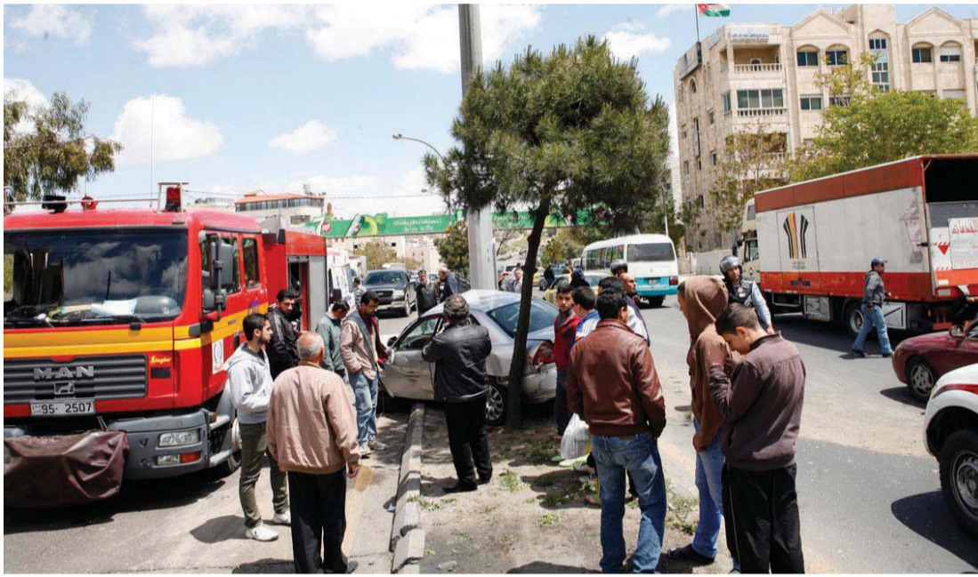
أحد الحوادث القاتلة في العاصمة عمان | أرشيفية

العواقب الوخيمة التي تنتج عن استخدام الهاتف الخليوي أثناء قيادة المركبات وأثرها على حياة الناس وأرواحهم وممتلكاتهم، خصوصاً ان الدراسات أشارت الى تلامي ظاهرة استخدام الهاتف الخليوي أثناء القيادة واستخدام السائقين لأجهزة تقنية تساهم في زيادة هذه الظاهرة. ونوهت الجمعية الى أن السائقين يقومون في كثير من الأحيان باستخدام أجهزة تقنية حديثة مثل سماعة البلوتوث وغيرها، وهذه بطبيعة الحال تساهم في تشتيت ذهن السائق وعدم تركيزه في القيادة ما يشكل نسبة كبيرة لوقوع حادث.