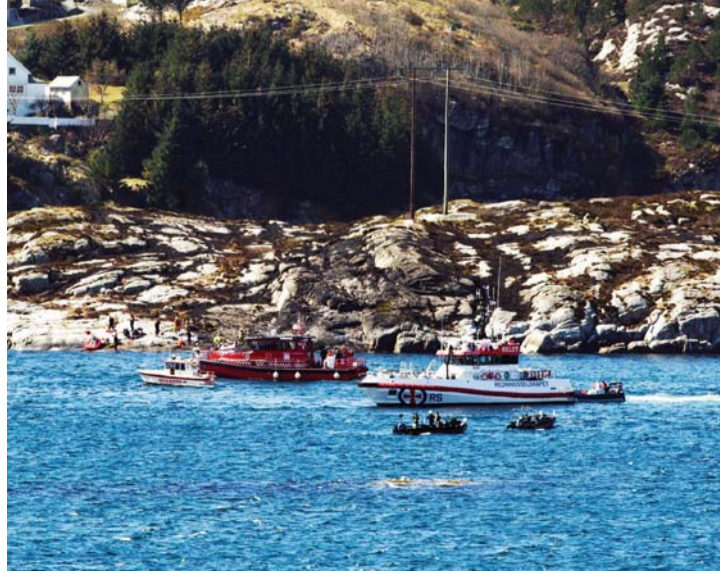
■ عمليات إنقاذ بحرية للبحث عن ناجين

مروحية بهذا نسخة سابقة من سوبر بوما بحراً كذلك. لكن الحوادث القاتلة تبقى نادرة في القطاع النفطي النرويجي الذي يشهد سنوياً تنقلات مكوكية لمئات آلاف العمال بين