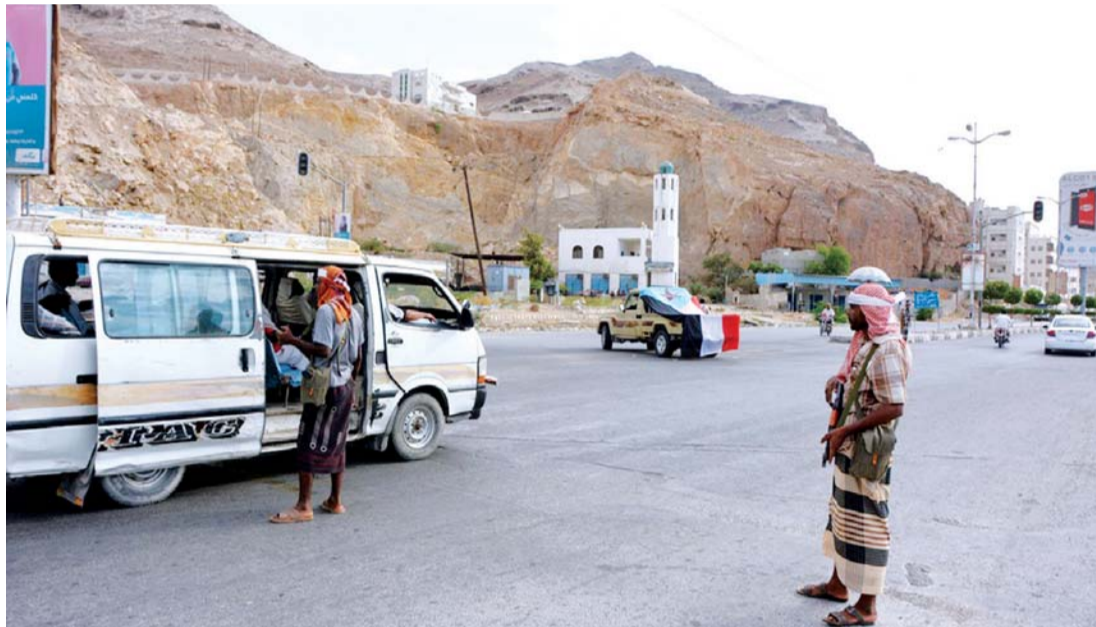
نقطة أمنية للمقاومة اليمنية في مدينة المكلا

وتجهيز السيارات المفخخة. وأتاح طرد الإرهابيين من حضرموت بدء تدفق قوافل المساعدات الإماراتية إلى المحافظة، حيث وصلت قافلة اغاثية ضخمة إلى المكلا بعد يوم من تصريح قائد القوات الإماراتية في حضرموت عن قرب وصول المساعدات، وذكرت صفحة فرسان الامارات على موقع التواصل الاجتماعي تويتر : ان الإمارات ارسلت قافلة مساعدات انسانية ضخمة باتجاه المكلا وذلك بعد يومين من تحريرها من عناصر تنظيم القاعدة. في الاثناء استعرضت قيادة المنطقة العسكرية الأولى في مؤتمر صحافي عقد في مقرها بسيئون التطورات الميدانية وسير المعارك لمواجهة الارهاب بوادي حضرموت.