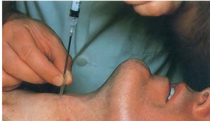
■ اكتشاف الأورام مبكراً يساهم في تسريع العلاج | من المصدر

أحدث العلاجات وقال: إن مستشفى دبي ادخل أحدث العلاجات لأورام الكبد عن طريق حقن العقاقير الكيماوية مباشرة إلى داخل الورم في الكبد، ويتم ذلك بواسطة طبيب الأشعة التداخلية، حيث يقوم بإدخال قسطرة رفيعة عن طريق شريان الفخذ ويتم توجيهها تحت الأشعة حتى تصل إلى الشريان المغذي للورم، حيث يتم حقن الجرعة الكيماوية داخل الورم مباشرة، ولكن حتى مع حقن الجرعة كلها داخل شريان الورم مباشرة فإن وجود هذه الجرعة الكبيرة مرة واحدة داخل النسيج الورمي يؤدي إلى هروب كمية كبيرة منها إلى الدورة الدموية، حيث تصل إلى جميع أعضاء الجسم لذلك كان من الضروري البحث عن وسيلة تضمن بقاء العقار الكيماوي داخل النسيج الورمي دون الهروب إلى الدورة الدموية العامة، لذا يتم حقن حبيبات ذكية يتم خلطها بالعقاقير الكيماوية المستخدمة في علاج سرطان الكبد الأولى لكي تقوم بامتصاص هذه العقاقير وعندما تحقق هذه الحبيبات إلى داخل الشريان المغذي للورم فإنها تقوم بإفراز العلاج الكيماوي داخل النسيج الورمي بمعدلات منتظمة ومحسوبة لا تؤدي إلى هروب الدواء الكيماوي إلى الدورة الدموية العامة، مما