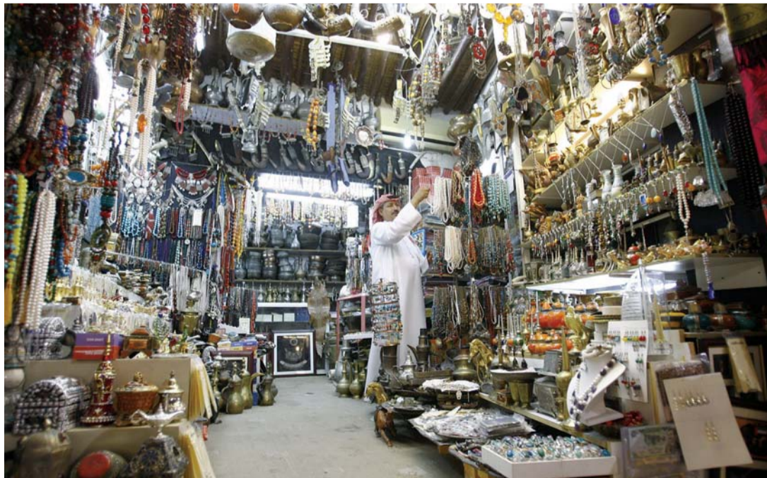
بعض المسافرين يكتفون بهدايا بسيطة ترمز إلى البلد الذي يزورونه