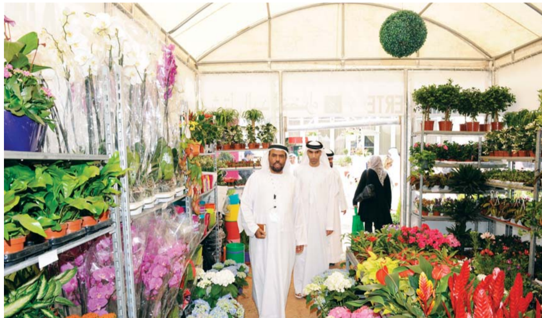
■ ثاني الزيودي وراشد الشريفي خلال جولتهما في أجنحة المعرض أمس | أرشيفية

وزارت جناح الإمارات في المعرض وكان في استقبالها معالي الدكتور ثاني بن أحمد الزيودي وزير التغير المناخي والبيئة وراشد الشريفي مدير عام جهاز