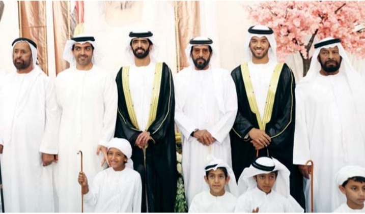
طحنون بن محمد وحامد بن زايد مع العريسين والحضور | وام

وأعرب سمو الشيخ طحنون بن محمد آل نهيان عن تهنئه للعريسين ووالديهما داعياً الله تعالى أن يرزقهما الذرية الصالحة. وتخلل الاحتفال عروض للفنون الشعبية.