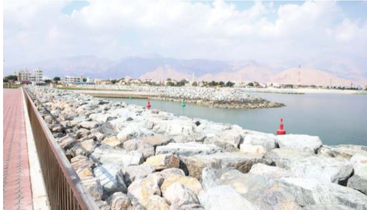
■ مشاريع خدمية بنفذهها المجلس البلدي لمدينة دبا الحصن