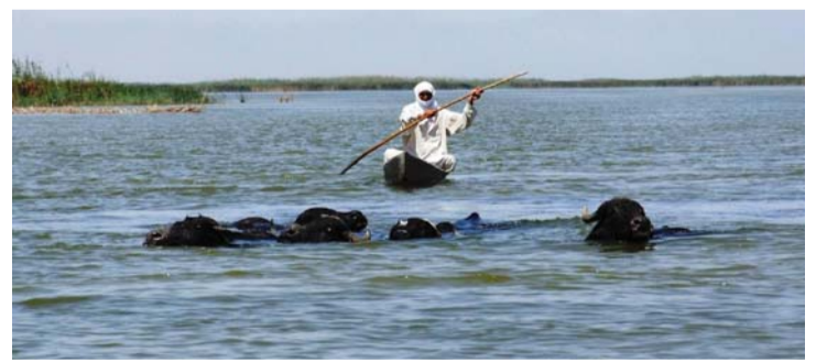
إنشاء سدود إضافية حاجة ملحة في العراق | أرشيفية