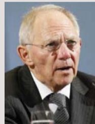
فولفغانغ شوبيله وزير المالية الألماني

انسحاب بريطانيا سيكون كالسهم لاقتصادها ولأوروبا وللاقتصاد العالمي.