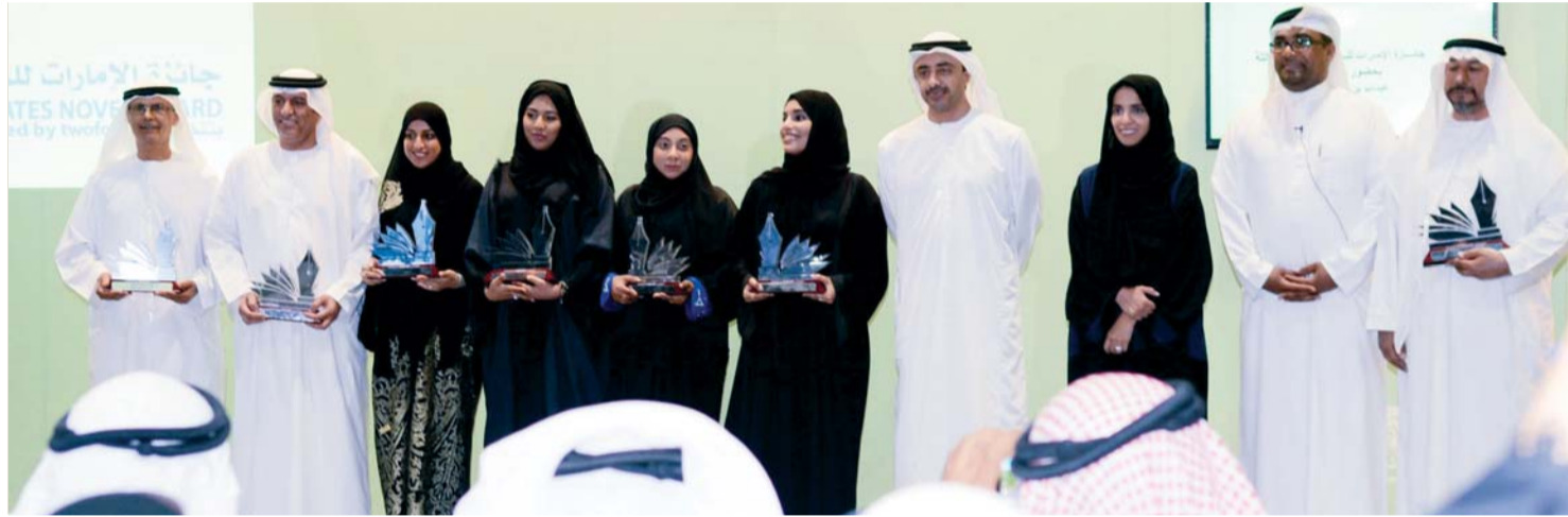
عبدالله بن زايد يتوسط المكرمين في دورة الجائزة الثالثة

«جائزة الإمارات للرواية» انطلقت عام 2014 بتنظيم من «تو فور 54» وتهدف إلى تقدير ودعم المواهب الأدبية الإماراتية وتبليط الضوء على الثقافة الأدبية في المجتمع الإماراتي وتثقيف بشأن أهمية الكتابة الروائية.