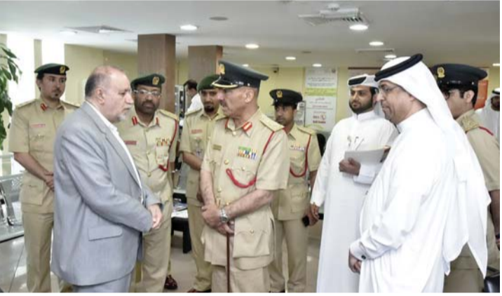
■ محمد بن فهد يطلع على إجراءات خدمة المتعالين | من المصدر

كما افتتح اللواء محمد خلفان الرميثي، قبيل الاحتفالية الرئيسية لشرطة أبوظبي باليوم العالمي للصحة والسلامة المهنية، الموقع الإلكتروني للإبلاغ عن حالات وحوادث الصحة والسلامة المهنية لمنتسبي شرطة أبوظبي. ويهدف الموقع الذي أطلقته إدارة الاستراتيجية وتطوير الأداء، تحت عنوان «لا تدع ضغوطات العمل تؤثر بك»، إلى الإبلاغ عن الحوادث والإصابات المهنية، وكل ما يتعلق ببيئة العمل.