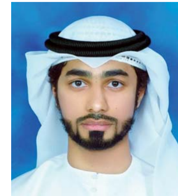
■ سعيد يعرف