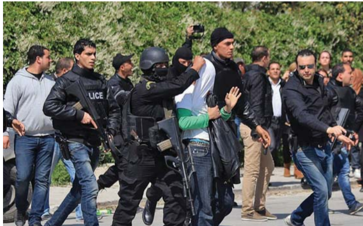
إحدى الحملات الأمنية في العاصمة تونس | أرشيفية