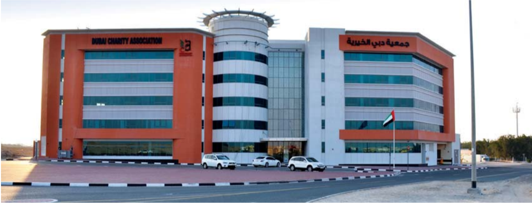
■ المبنى الوقفي الجديد لجمعية دبي الخيرية

على مساعدات من الجمعية، منوها إلى أن المبنى الوقفي يحتوي على صالات انتظار للرجال وأخرى للنساء ومصلى ودور حضانة وكافتيريا.