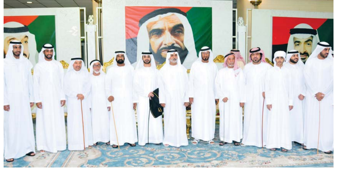
■ نهيان بن مبارك خلال حضوره أفراح الظاهري والراشدي

حضر معالي الشيخ نهيان بن مبارك آل نهيان وزير الثقافة وتنمية المعرفة الحفل، الذي أقامه محمد راشد مصبح الظاهري، بمناسبة زفاف نجله عبد الله إلى كريمة المرحوم عبيد محمد بن سلوم الراشدي. كما حضر الحفل، الذي أقيم في قاعة الاحتفالات بمنطقة الهيلي في مدينة العين الشيخ شخبوط بن نهيان بن مبارك آل نهيان، والشيخ محمد بن نهيان بن مبارك آل نهيان، وأعيان ووجهاء القبائل وعدد من المسؤولين وكبار الشخصيات. والعين - وام