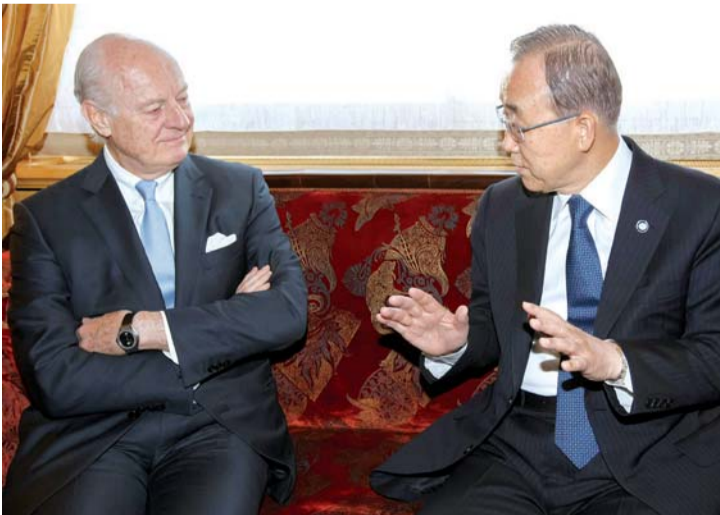
كي مون ودي ميستورا خلال لقائهما في جنيف

للأمم المتحدة بان كي مون بمبعوث المنظمة الدولية الخاص لسوريا ستافان دي ميستورا في جنيف، حيث بحث الطرفان آخر التطورات على الأرض السورية. وتفصيلاً، صرح بن الرعد الحسين أن العنف يتصاعد بسرعة مهولة مندداً بمقتل المدنيين. كما لفت إلى أن جميع ظواهر العنف تشكل إنباتاً جلياً على استخفاف بغير القلق إزاء إحدى ركائز القانون الإنساني الدولي، أي واجب حماية المدنيين. داعياً الأطراف إلى وقف العنف، وتجنب