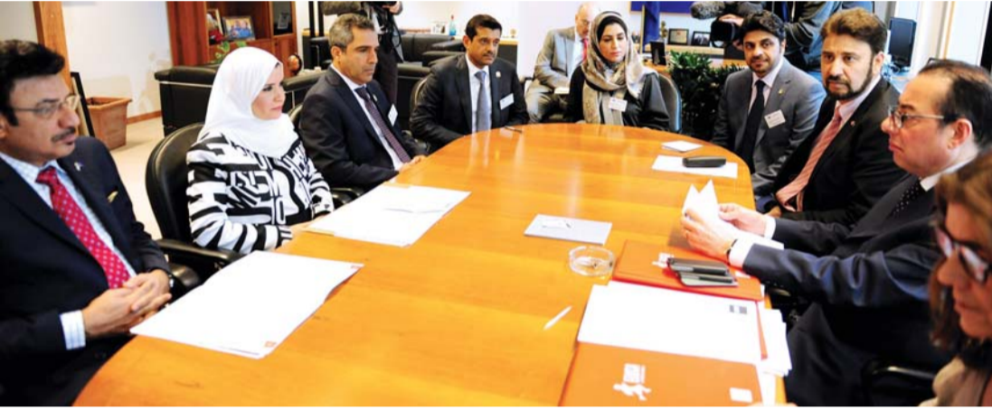
■ خلال لقاء أمل القبيسي والمفوض الأوروبي لشؤون البحث والطاقة

وهو ما يمكن من تنوع مصادر متوازنة، مستدامة لاقتصاد الإمارات خاصة فيما يتعلق بالاعتماد على الطاقة البديلة والمتجددة.