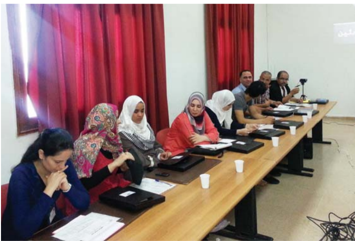
المرشحون لوظائف التعليم على موعد اليوم | أرشيفية

تعهد تم تقديمه، وسيتم الحرص عليه ميدانياً خاصة وأن الشريك الاجتماعي سيكون حاضراً لمراقبة عملية التوظيف بكل تفاصيلها.