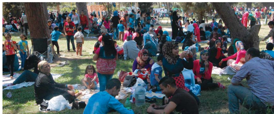
جانب من احتفالات سابقة بأعياد شم النسيم | أرشيفية