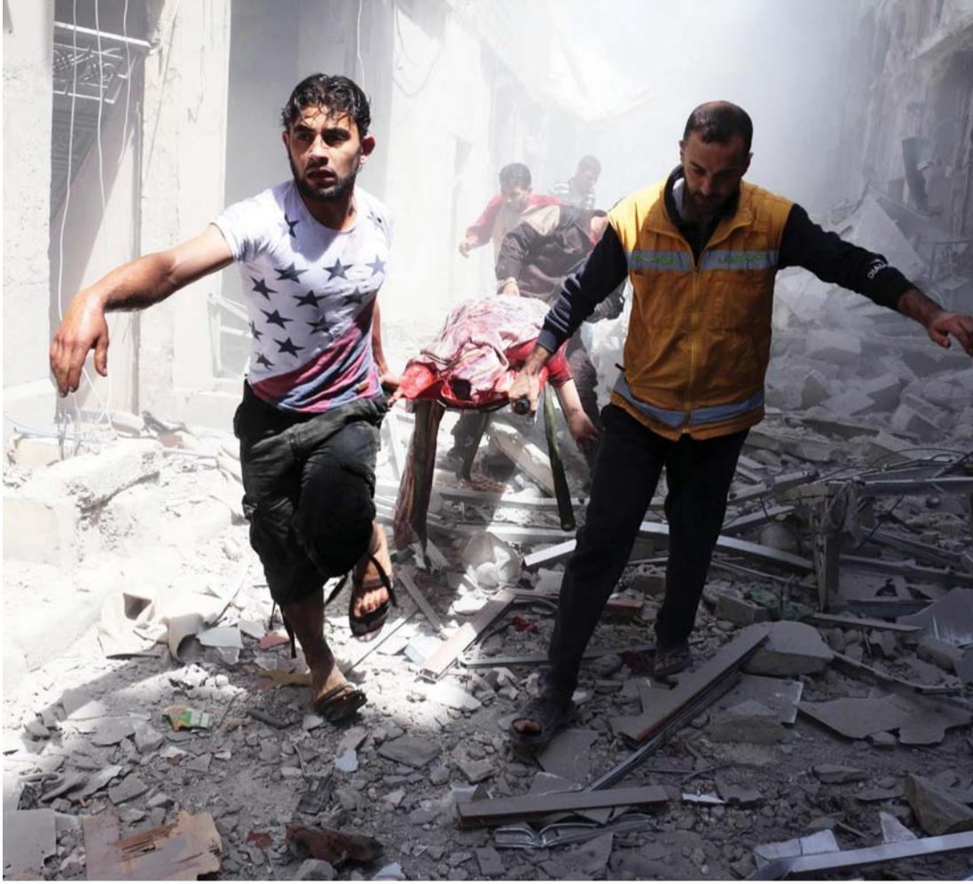
سوريون يحملون جريحاً أصيب بغارة لقوات الأسد في حلب

وقال اللغتناات كولونيل الروسي سيرغي كورالنكو، من قاعدة حميميم الجوية في