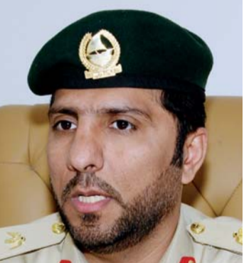
■ سلطان الجمال

وأوضاع العمالّة المؤقتة، ويوضح عدد الشكاوى الكلي، قنوات التواصل بين العمالّة والشرطة، أسباب الشكاوى وأهم البرامج التي يطرحها القسم لمساعدة العمال وتثقيفهم بحقوقهم وواجباتهم قانونياً.