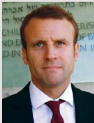
إيمانويل ماكرون وزير الاقتصاد الفرنسي

انسحاب بريطانيا سيدفع بعض الدول الأخرى للسير على نفس الطريق.