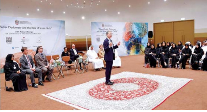
ستينغل خلال المحاضرة بحضور رياض المهيدب

أوضح ستينغل أن الأمرين مختلفان، ففي الدبلوماسية العامة نستخدم حقائق تستند إلى معلومات وإلى تواصل، أما البروباغندا فإنها محاولة إقناع الناس والتأثير فيهم باستخدام معلومات زائفة أو مغلوبة. وقال إن وسائل التواصل الاجتماعي «الميديا الاجتماعية» هي إحدى الدعامات الرئيسية للدبلوماسية العامة، وأنه هو ذاته أحد الدعوات لها، إذ إنه يحث كل سفير أو دبلوماسي ببلايه على أن يكون دائماً في تفاعل مباشر معها.. بل إنها يمكن أن تجعل من كل شخص دبلوماسياً عاماً.