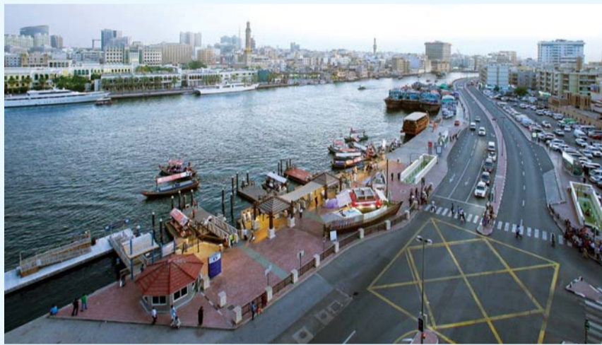
■ محطات وحركة عبور بين الضفتين في خور دبي

على مدى التاريخ، كلما هبت نذور التحدي على مياه الخور، كلما كبر عطاؤه. فبينما اعتبرت دبي الميناء الخليجي الأول للمنطقة