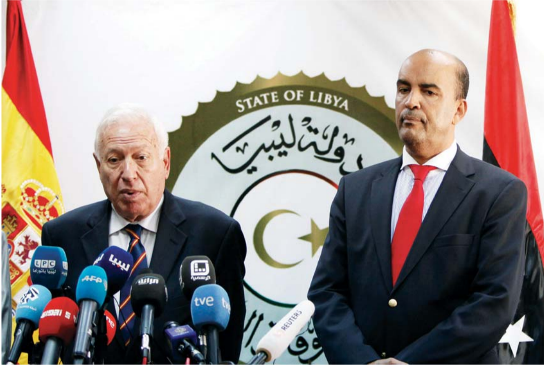
عضو المجلس الرئاسي موسى الكوني والوزير الإسباني مانويل غارثيا خلال مؤتمر صحفي في طرابلس

مجلس النواب عن عقد جلسة في مقره بمدينة طبرق.