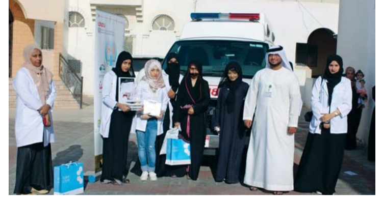
■ جانب من زيارة الطالبات أحد المنازل في العين