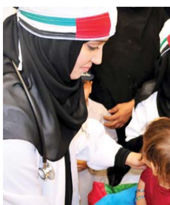
■ علاج مجاني للمحتاجين