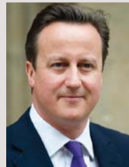
ديفيد كامبرون رئيس وزراء بريطانيا

الانسحاب من الاتحاد الأوروبي قفزة إلى المجهول، وسيهدد اقتصادنا وأمننا القومي.