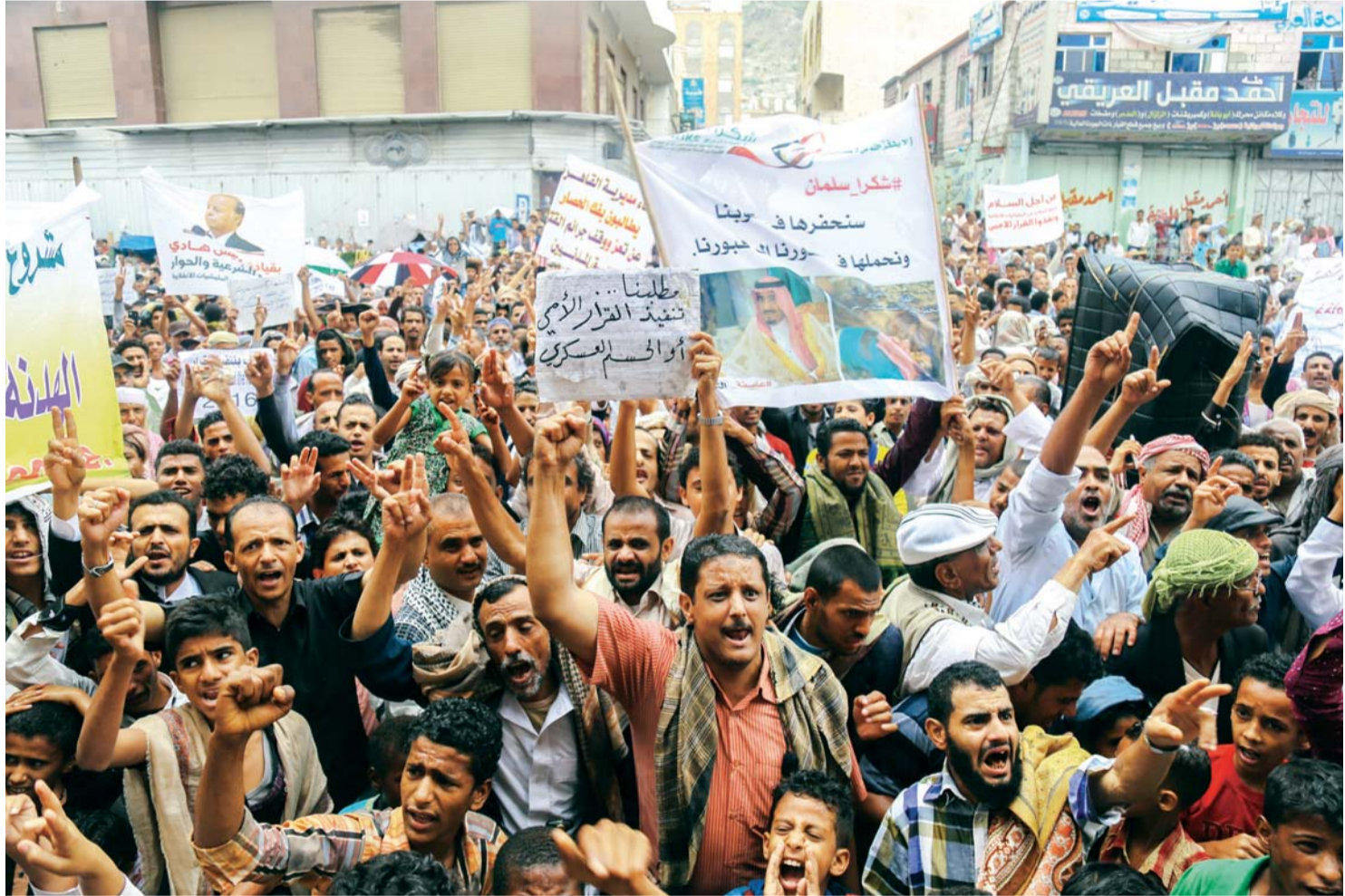
حشود شعبية في تعز ضد مراوغات الانقلابيين في محادثات الكويت | تصوير: أحمد الباشا