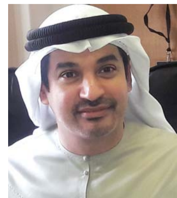
■ صقر المعلا

وأضاف المعلا أن قسم التجميل في مستشفى القاسمي يستخدم الآن أجهزة الليزر، حيث تم خلال الفترة الماضية علاج حالتين به من خلال إزالة الوحمات، إضافة إلى أنه يمكن استخدامه في