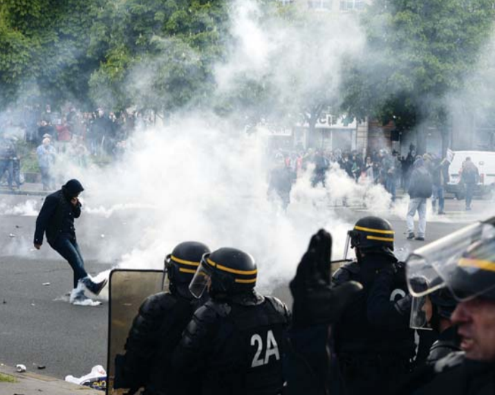
■ الشرطة الفرنسية تشتبك مع المحتجين