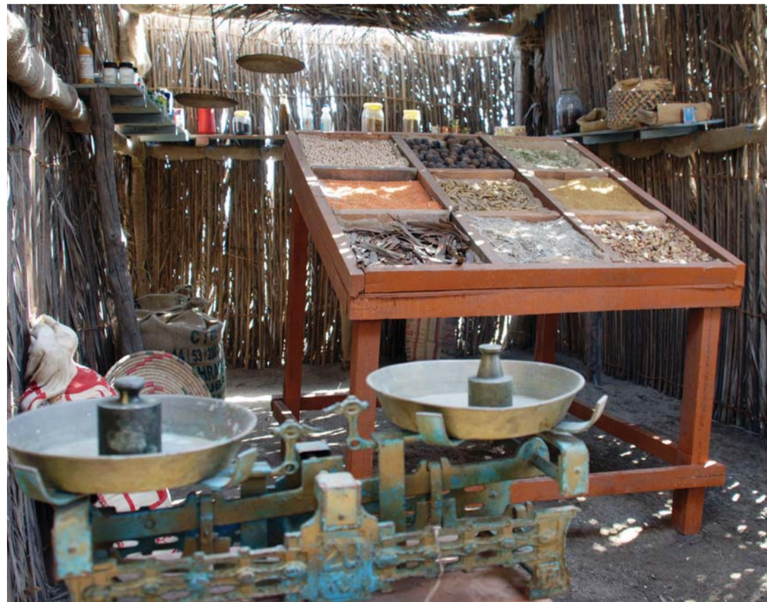
الدكان مصدر الاحتياجات الأساسية واليومية لأفراد «الفريج»