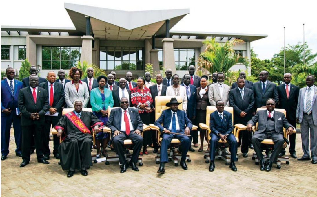
■ سيلفا كير ومشار مع وزراء الحكومة الجديدة

وزير المالية مهمة إعادة بناء اقتصاد منهار بعد نزاع دام سنتين. أما حقيبة النفط الذي يعد المصدر الوحيد لإيرادات البلاد، فعهد بها إلى دك دوپ بيوشو المتعدد السابق. وأسندت حقيبة الخارجية إلى ديق الور، الذي كان تولى هذا المنصب في السودان الموحد. والور أحد «السجناء السابقين»، وهي مجموعة متمردين نافذين أوقفوا لدى اندلاع النزاع ثم أفرج عنهم تحت الضغوط الدولية. وأصبح لام أكوول زعيم المعارضة المستقل عن التمرد، وزير الزراعة والأمن الغذائي وهو منصب مهم في حين أن خمسة ملايين من سكان جنوب السودان بحاجة إلى مساعدة غذائية وأن بعض المناطق في البلاد على شفير المجاعة.