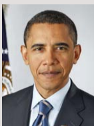
باراك أوباما الرئيس الأميركي

بقاء لندن عضواً في الاتحاد الأوروبي يتماشى مع مصالح الولايات المتحدة.