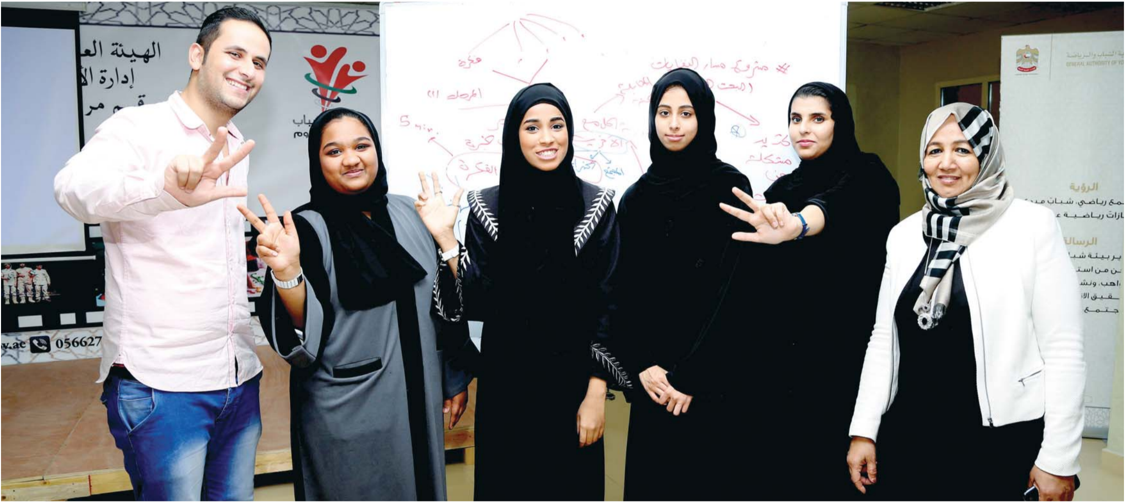
■ الطالبات المبتكرات للمشروع

ويبين أن المرحلة الثانية من الابتكار سيتم خلالها طرح المنتج في السوق وتحويل فكرة المشروع إلى منتجات يتم تداولها سواء عبر إنشاء شركة خاصة تمتلكها الطالبات صاحبات الابتكار لضمان استمراريته ونجاحها ونشرها في المستقبل على المستوى العالمي، أو عن طريق تبني الفكرة من قبل جهات أخرى لتطويرها ووضعها موضع التنفيذ.