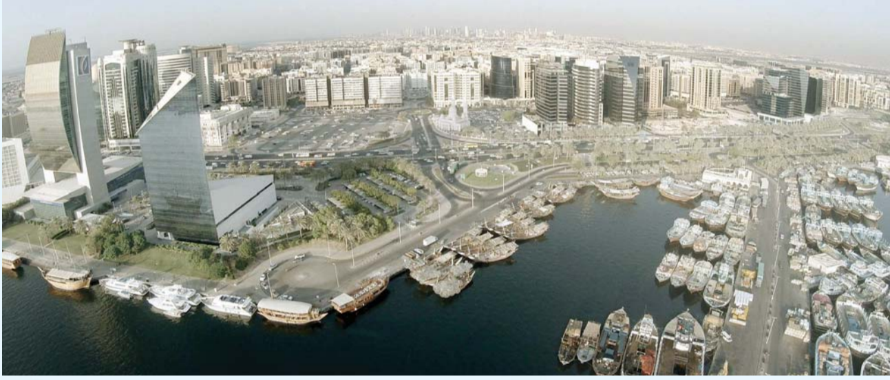
■ خور دبي المكان الملهم للعديد من الناس الذين تجذبهم فنون العيش والتطور | تصوير- عماد علاء الدين

في كتابه «دليل الخليج» الصادر عام 1908، يصف ضابط البحرية الإنجليزي ج.ج. لوريمر، المنطقة المحيطة به بأنها «دروب سيك مظلمة، تكسد فيها البضائع، ويحتاج المرء إلى أن يحمل قناديل الزيت المشتعل لكي يثبت خطواته فيها». يضحك سالم معلقاً: «علينا أن نرسل تذاكر طائرات مجانية إلى أحفاد السيد لوريمر اليوم، ليأتوا إلى هنا ويكتبوا نسخة جديدة من الكتاب، حول معجزة الخور التي تشرق كل يوم على ضفافه أضخم إنجازات البشر وأحلامهم».