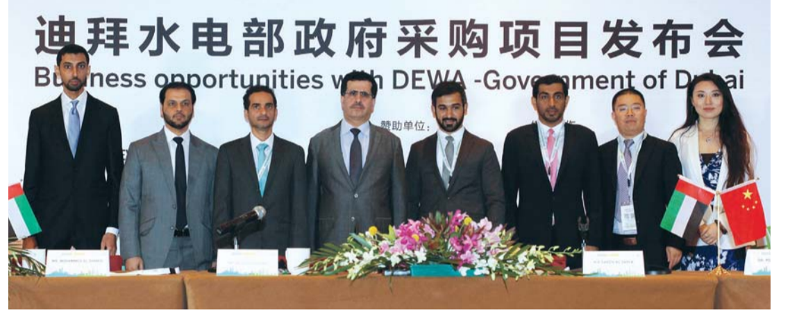
■ سعيد الطاير وعدد من المسؤولين في شنغهاي | من المصدر