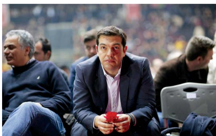
رئيس الوزراء اليوناني أليكسيس تسيبراس | البيان

اليوناني التي تجاوزها تلك المؤسسات، أي ما يعادل 107 مليارات يورو عن 2012 الحزمة الثانية لإنقاذ اليونان، وتضمنت جملة إجراءات خصصت لها 130 مليار يورو، فضلاً عن اتفاق لتبادل سندات ديون أثينا مع دائنيها من القطاع الخاص ينص على شطب 107 مليارات يورو، من خلال اتفاق مبادرة مع المؤسسات المالية الخاصة ينص على شطب 53,5% من قيمة سندات الدين