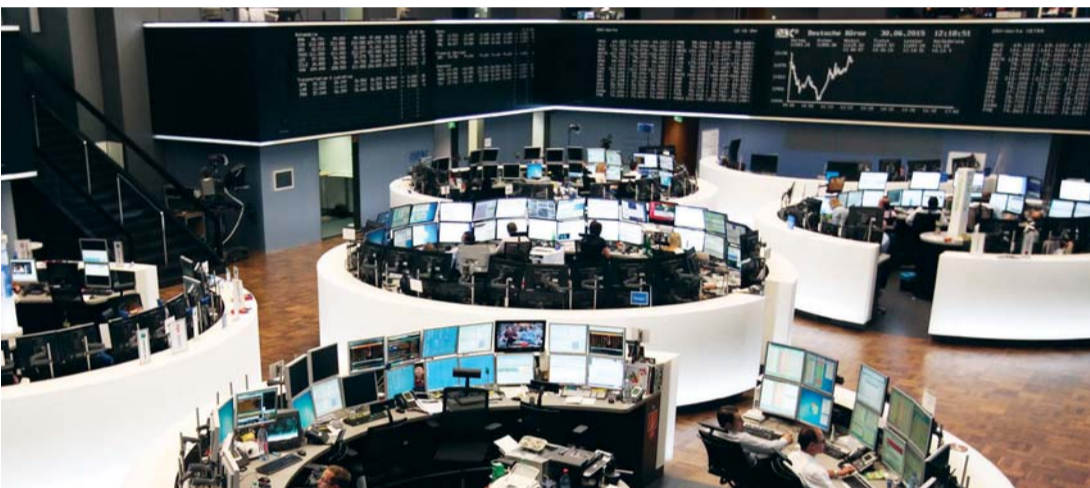
متعاملون في بورصة فرانكفورت حيث عانت أسواق أوروبا من أوقات عصيبة