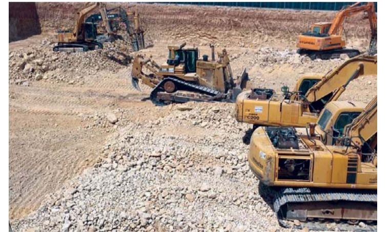
■ برج الشقق السكنية يتكون من 43 طابقاً تضم 418 شقة

أحمد الحاطي: ملتزمون بتطوير مشاريع نوعية