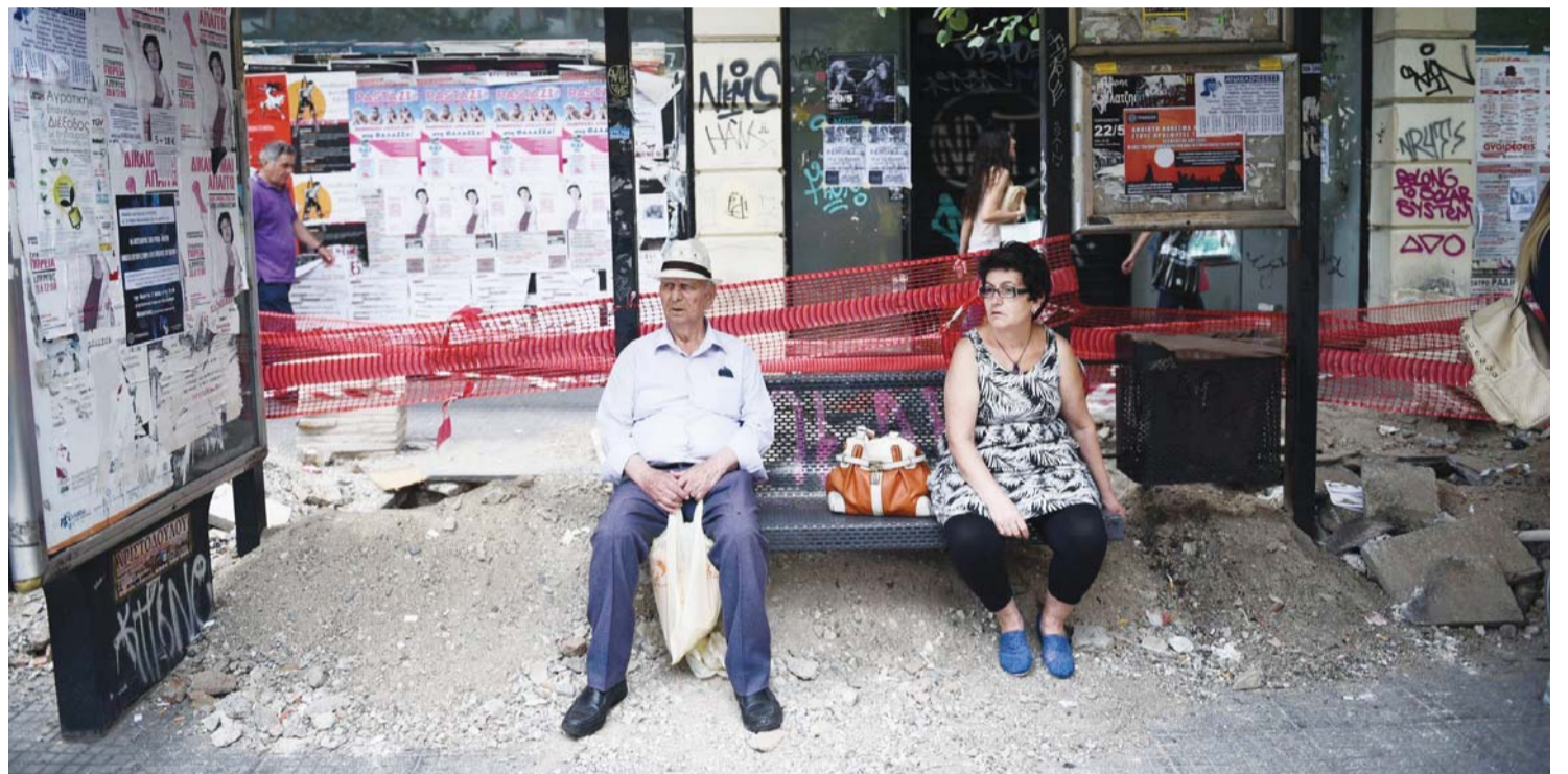
الشعب اليوناني وجد نفسه في أزمة بعدما اعتادت حكوماته حل مشاكله بالاقتراض | البيان

من جهة أخرى، تحب اليونان أن تضع نفسها في موقف الضحية، لكن الواقع يقول إن حكومات اليونان أدبت على حل مشاكلها وإرضاء شعوبها عن طريق القروض وتحويل دفعها إلى الحكومات اللاحقة، واليوم نرى ان المواطن اليوناني يتم استفتاءه على رغبته في الحصول على قروض جديدة أم لا.. والحقيقة أن الاستفتاء يجب أن يكون للشعب الألماني وليس اليوناني... فهو الذي سيدفع!