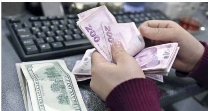
العملة الأميركية تتضرر من البيانات الضعيفة | أرشيفية

ولرأي أظهر تقدم معسكر المؤيدين لشروط إنقاذ اليونان بفارق طفيف على معسكر الراضين المدعوم من الحكومة اليسارية. وقال الفين تان خبير العملة في سوسيتيه جنرال «بالنسبة لليورو قد يؤدي التصويت بنعم في الاستفتاء اليوناني مطلع الأسبوع إلى تعافيه لكن ما زلنا نفضل بيعه عند صعوده».