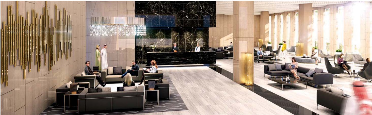
■ يتكون برج الشقق الفندقية من 36 طابقاً، تضم 314 شقة