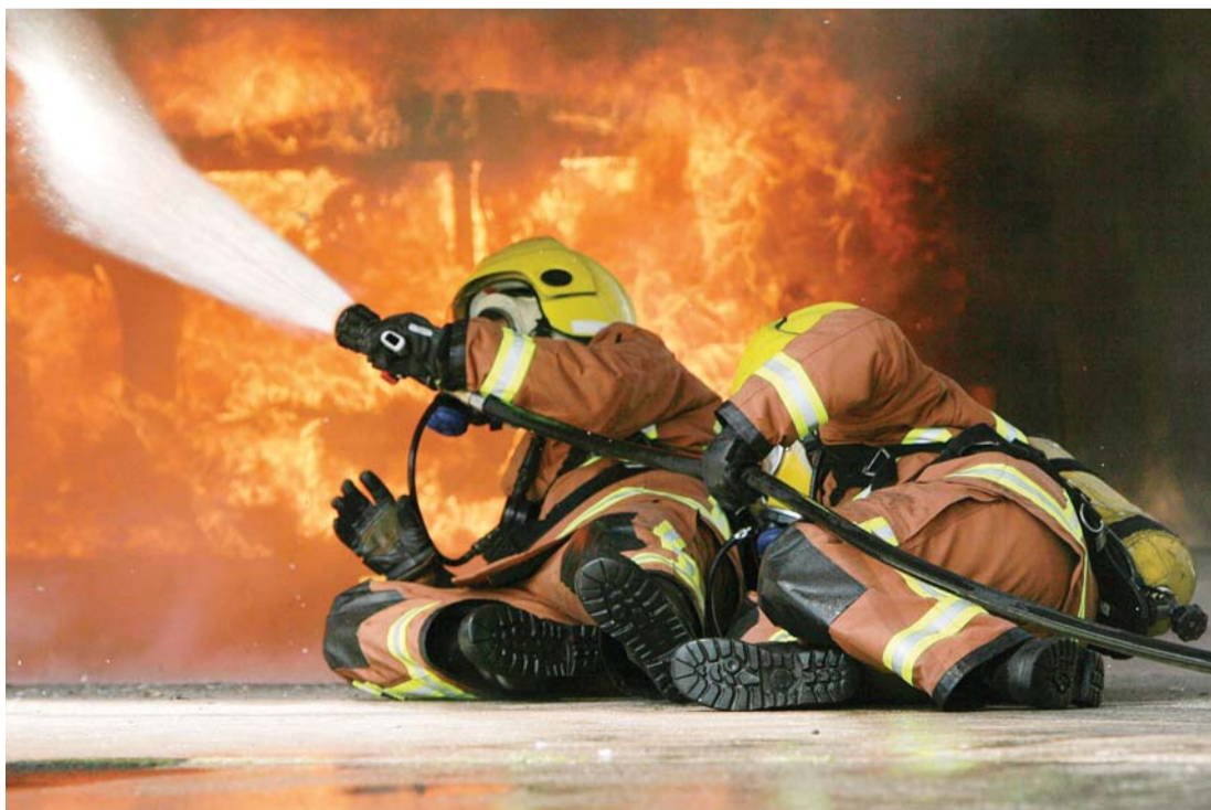
■ نسج «دوبونت نومكس» للعزل الحراري منتشر حول العالم

وأفراد القوات المسلحة على الحماية التي يوفرها هذا النسج من أجل تأمين سلامتهم، وبفضل النسج تتمتع ملابس الحماية بأخف وزن وأعلى حماية، بالإضافة إلى التهوية لتخفيض الإجهاد الحراري فضلاً عن القدرة العالية على التخلص من الرطوبة. وبالإضافة إلى استخدامه لأغراض الحماية الشخصية، يتم استعمال نسج «نومكس» أيضاً في أنظمة النقل الجماعي وتوليد الطاقة من الرياح والمحولات وأجهزة الفلترة والخراطيم والطائرات.