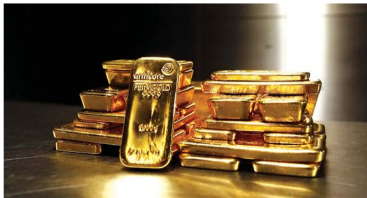
نمو الإقبال على الذهب مع اضطراب الأسهم | أرشيفية

إلى تحقيق ثاني مكاسبها الأسبوعية على التوالي مع تضرر اليورو من أزمة ديون اليونان وهو ما حد من مكاسب المعدن الأصفر. ومن بين المعادن النفيسة الأخرى تراجع سعر الفضة 0.25% إلى 15.65 دولاراً للأوقية. وانخفض البلاتين 0.2% إلى 1079 دولاراً بينما نزل البلاديوم 0.4% إلى 689.65 دولاراً للأوقية.