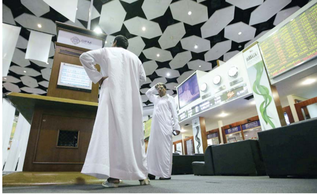
متداولان يتابعان حركة الأسهم في سوق دبي المالي

واوضح ان استقرار الازواج الجيوسياسية في المنطقة خلال الاسبوع المقبل سينعكس ايجابيا على تعاملات الاسواق