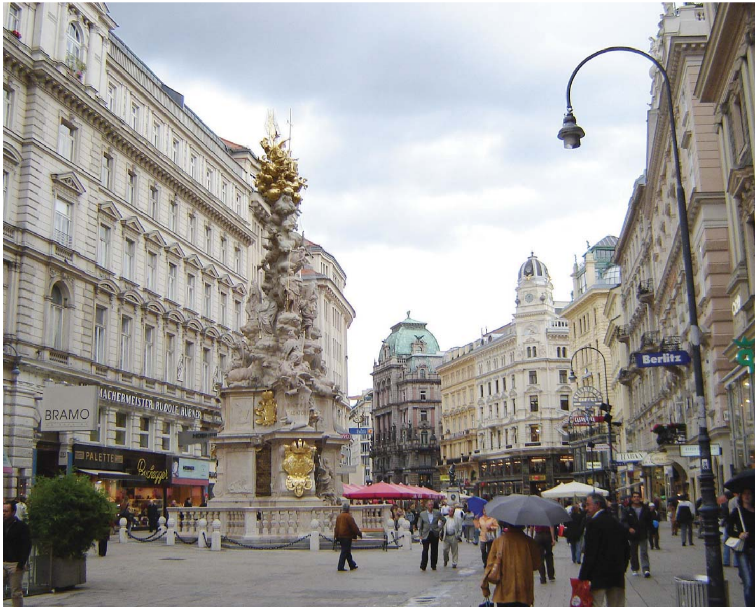
■ فيينا السحر في كل مكان

الفياكا لم تعد مركبة قاسية المقاعد بل تطورت وأصبحت أكثر نعومة ورفاهية مع تطور الزمان. واليوم لا يتم التصديق بتصريح لقيادتها إلا بعد اجتياز امتحان خاص، وبعد الالتزام بقواعد صارمة في مقدمتها الالتزام بزي معين كأزياء القصور الإمبراطورية، عبارة عن بدلة سوداء وقميص أبيض إضافة إلى قبعة حتى لمن يقدها من النساء وهن قلة. أضف إلى ذلك ضرورة أن تحشى مقاعدها بفراش وثير، تصاف إليها الحفة وأغطية خفيفة تستخدم في حال احتاجها الركاب بسبب برودة الطقس، لكنها أكثر انتشاراً أثناء فصلي الربيع والصيف عندما يكون الطقس مشمساً. وللفيكا مواقف معروفة منها على سبيل المثال موقع سينت بيترز، بالقرب من كنيسة القديس استيفان، وموقع ثان بميدان هيلدن أمام قصر الهوفبورغ، وثالث أمام مسرح البورغ تيترتس مواجها لمبنى البلدية، الرات هاسوس، ورابع بالقرب من متحف اللابريتينا بالقرب من مبنى الأوبرا.