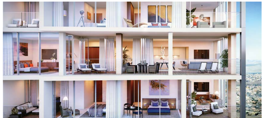
■ بناء البرجين يجري في منطقة سكنية استراتيجية وصديقة للبيئة