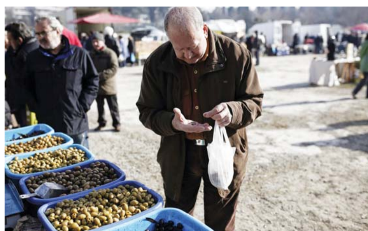
معدلات التضخم ارتفعت مع ارتفاع الأسعار | البيان

طلبت اليونان في مطلع العام الجاري الدائنين من أوروبا بتمديد العمل ببرنامح الإنقاذ المالي الحالي، والذي انتهى فعلياً بنهاية يونيو، حيث رفضت الدول الأوروبية ذلك دون تقديم اليونان بتنفيذ إجراءات جديدة نحو إصلاح المنظومة المالية، وعلى رأسها خفض العجز وخفض الإنفاق الحكومي. هذه الشروط، اعتبرتها اليونان قاسية جداً و«مُدلة للشعب اليوناني»، ولا تؤمن الحد الأدنى من التمويل المطلوب، ليقرر رئيس الوزراء الحالي أليكسيس تسيبراس، إطلاق استفتاء شعبي تقدمت به الحكومة، حيث سيكون على الناخبين اليونانيين التصويت بـ«نعم» أو «لا» غداً الأحد، على حزمة الإجراءات التي قدمها الدائنون، أي الاتحاد الأوروبي وصندوق النقد الدولي. مع العلم أن تاريخ 30 يونيو يصادف أول تاريخ تخلف فيه اليونان رسمياً على سداد دفعة من ديونها، ما يعرضها لخطر وصفها بـ«غير قادر مالياً»، وهو ما سيتبعه الخروج من الاتحاد الأوروبي.