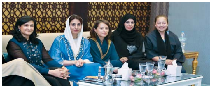
خلال الملتقى الرمضاني لمجلس سيدات أعمال الشارقة

بذل كل ما بوسعنا من أجل دعم رائدات الأعمال والمهنيات، ونستثمر سنويا الفرصة الكبيرة التي يوفرها لنا شهر رمضان الكريم وما يحمله من معان جميلة لجمع أكبر عدد ممكن من سيدات الأعمال والمهنيات للالتقاء والتعارف».