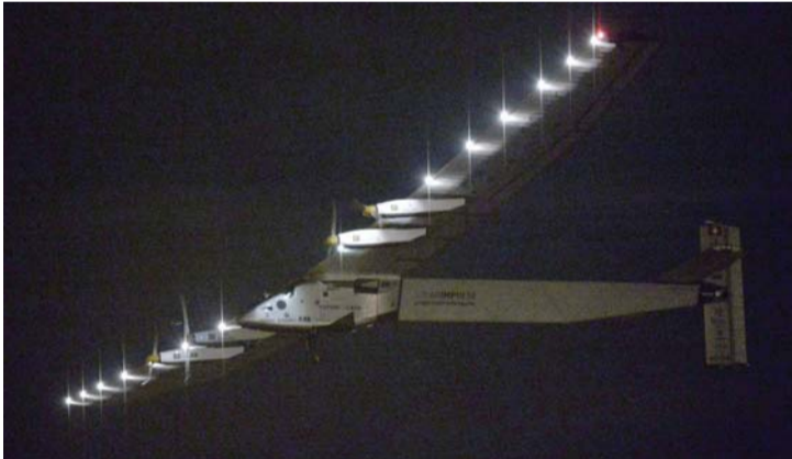
الطائرة سولار إمبرس 2 في طريقها من اليابان إلى هاواي

على طول جناحيها. ومن المتوقع ان تستغرق الرحلة الاجمالية حول العالم نحو 25 يوم سفر وكانت الطائرة قد أفلتت من نانجينغ