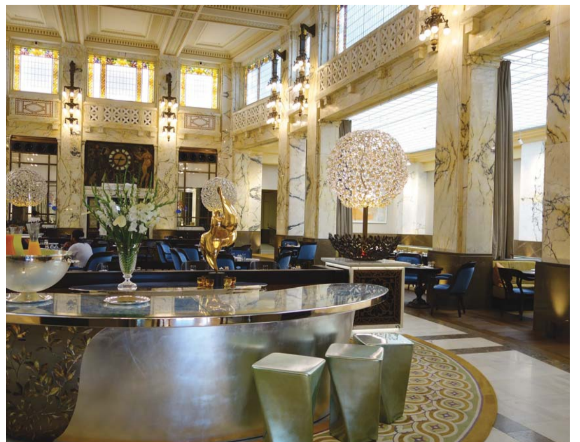
■ قاعة الطعام الرئيسية في الفندق التاريخي

ويذكر أن مدينة فيينا أضحت وعلى نحو متنام الوجهة السياحية المفضلة عالمياً، حيث أشارت هيئة السياحة في فيينا إلى أن 12,7 مليون زائر من مختلف أنحاء العالم أقاموا ليلة في المدينة التاريخية خلال العام 2013، وأظهرت هذه الأرقام زيادة قدرها 15% في عدد الزوار المقيمين ليلة من دولة الإمارات العربية المتحدة، و6% للمسافرين القادمين من المملكة العربية السعودية. كما شهدت الفترة بين شهري يناير