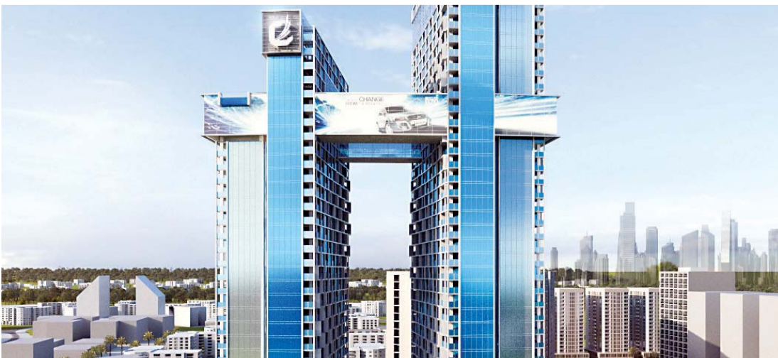
■ جسر يربط مختلف المرافق ضمن المشروع