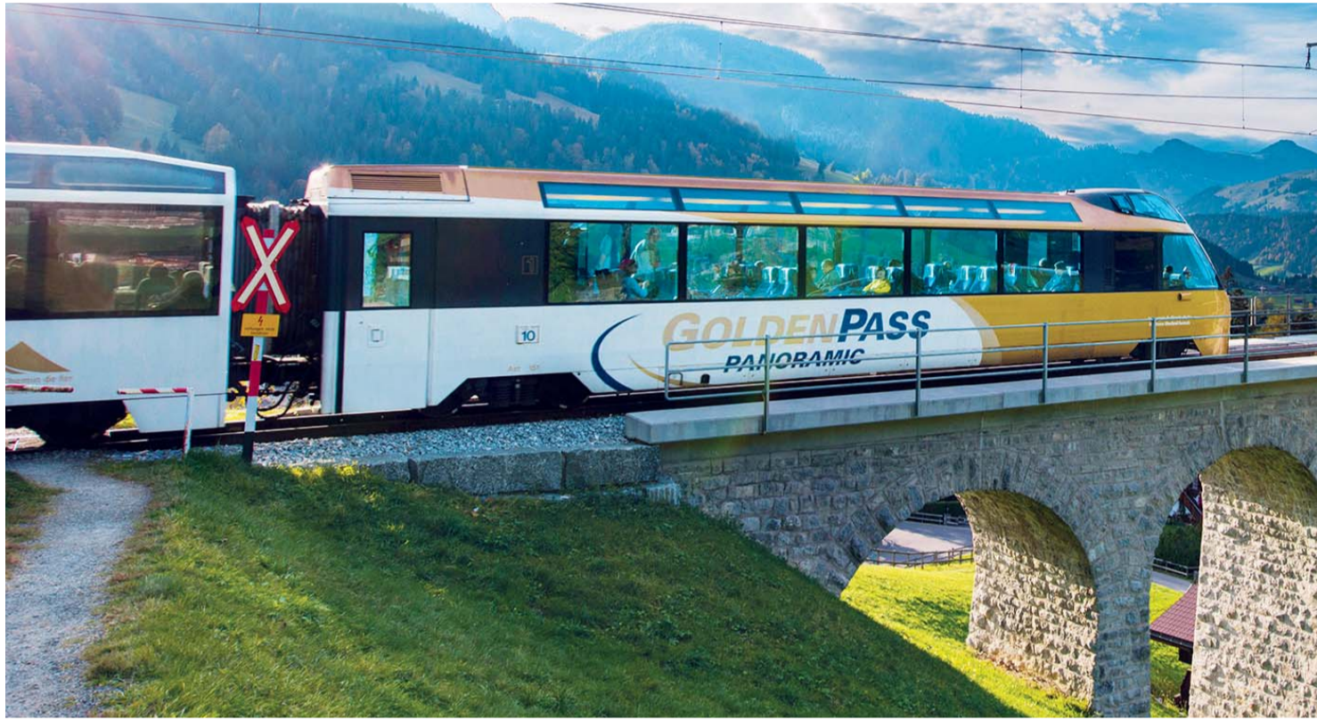
■ المزيد من الخليجيين يستخدمون القطارات البانورامية السويسرية كل عام

الفنادق الجميلة في مدينة دافوس السويسرية كثيرة، لكن قد يكون فندق «غريشا» أكثرها تميزاً، بموقعه في الشارع الرئيسي وتاريخه العريق وضيافته وتسهيلات المتيممة ذات الخمس نجوم، على الرغم من أن نجومه لا تزيد عن أربع. ولعل ذلك هو أحد أهم الأسباب التي حاز من خلالها الفندق على شعبية خاصة من سائحي دول الخليج، كما لا يبعد الفندق سوى بضع دقائق مشياً على الأقدام من مركز المؤتمرات الذي يستضيف سنوياً منتدى الاقتصاد العالمي.