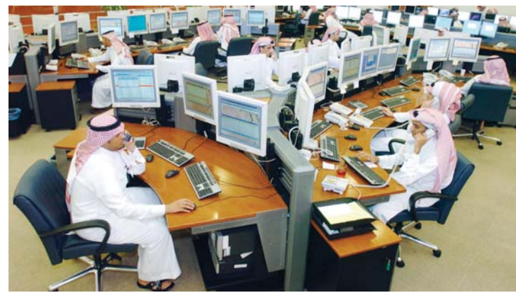
إقبال أقل من المتوقع للأجانب على السوق السعودي | أرشيفية

للمشاركة في السوق التي يبلغ حجمها 575 مليار دولار. وقال آدم كوتاس مدير قسم الأسواق الناشئة لأوروبا والشرق الأوسط وأفريقيا في فيدلتني، المستثمرون الآن في مرحلة التعلم والتخطيط لا مرحلة الاستثمار. والرسالة التي يعثون بها هي أن فتح السوق كان مجرد تطور وليس ثورة. وأضاف كوتاس قوله إن مرحلة الاستثمار ستاتي في الأشهر القليلة المقبلة.