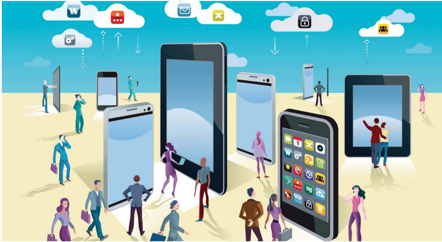
■ العمل من خارج المكتب يدعمه انتشار الأجهزة المحمولة

توفر إمكانية استخدام الأجهزة الخاصة بالموظفين للوصول إلى البيانات والتطبيقات والشبكات العامة