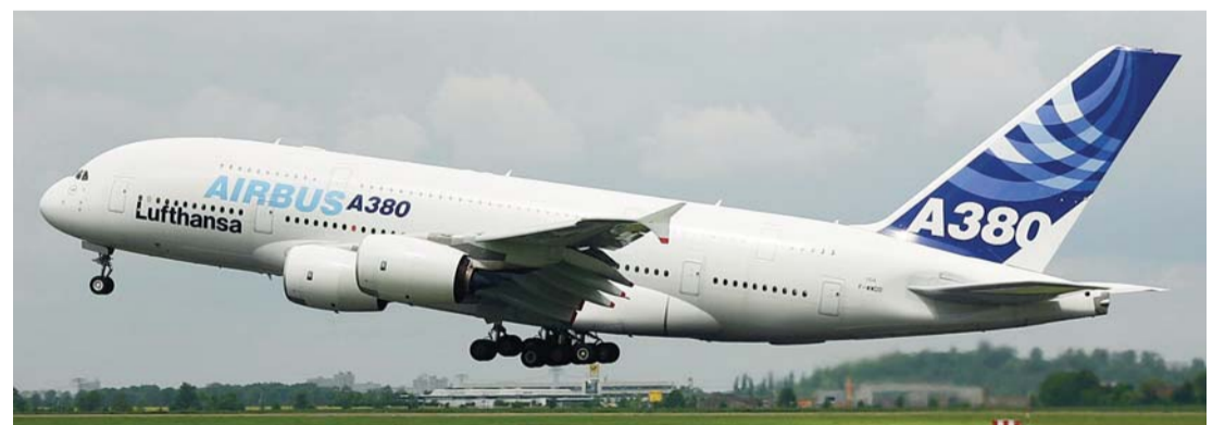
الإصدار يساهم في تحسين التمويل