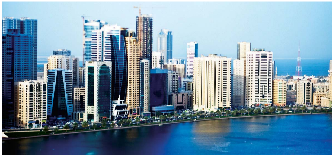
الشارقة تتمتع بمقومات جذب استثماري وسياحي | من المصدر