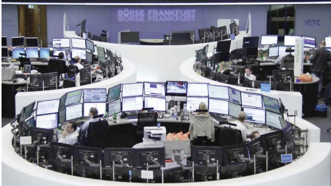
متعاملون في بورصة فرانكفورت حيث تراجعت المؤشرات

تدفع المستثمرين إلى العزوف عن المخاطرة مع نهاية الأسبوع. وفي أنحاء أوروبا تراجع المؤشر فايننشال تايمز 100 البريطاني 0.4% عند الفتح بينما نزل كاك 40 الفرنسي 0.7% وداكس الألماني 0.6%.