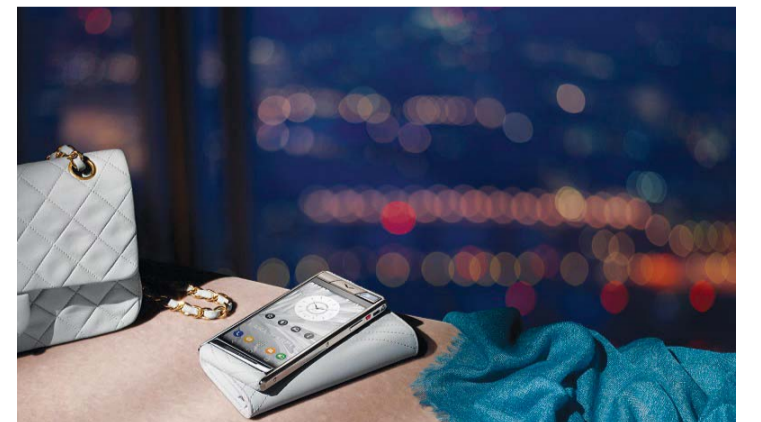
■ آستر هواتف نسائية مصنوعة يدوياً | من المصدر