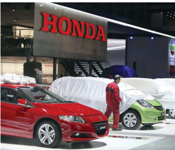
نتائج الشركة اليابانية تأثرت بعمليات الاستدعاء المتتالية