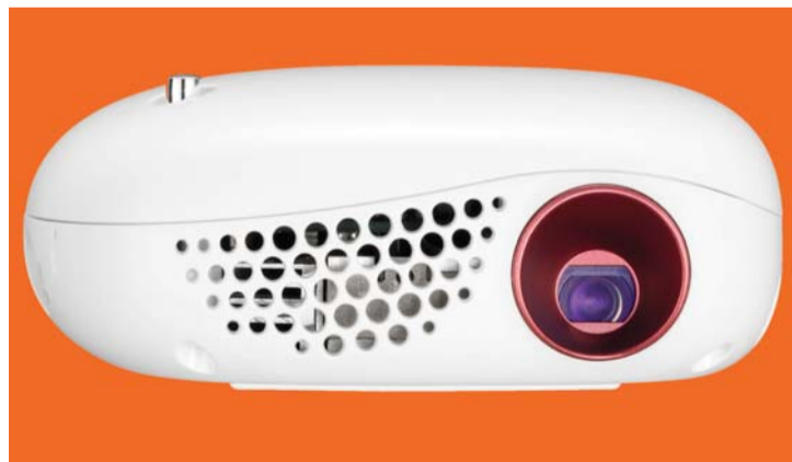
■ PV150G المحمول وزن 270 غراماً | من المصدر