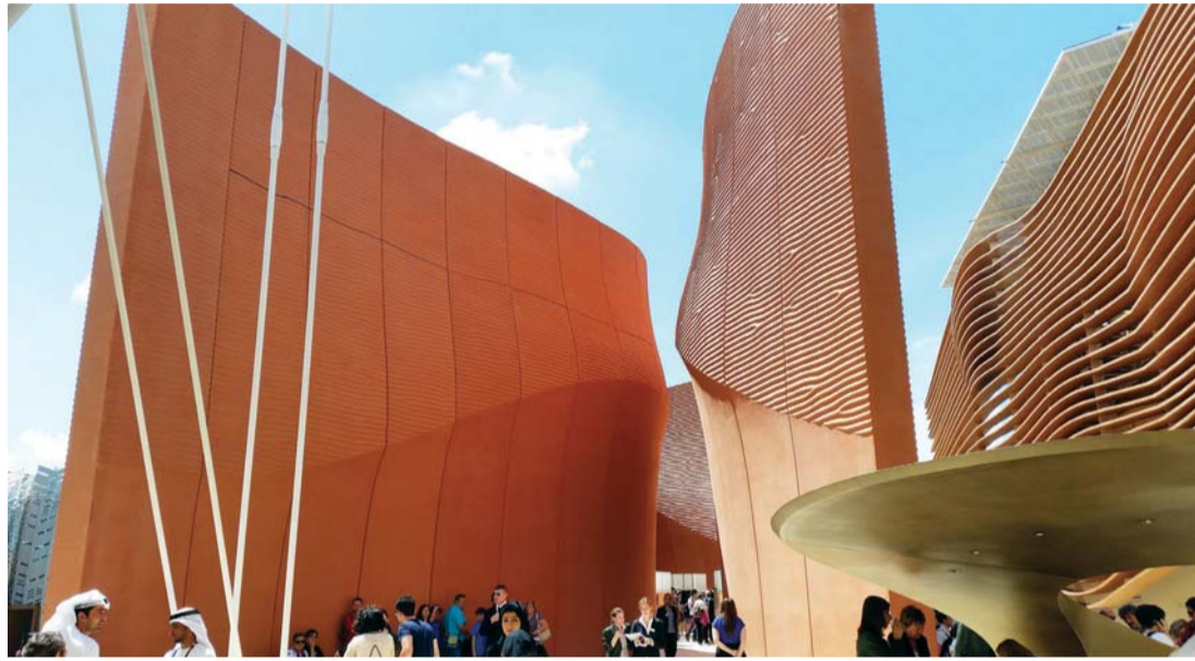
تصميم مميز لجناح الإمارات في المعرض

وقال نورمان فوستر، كبير التنفيذيين والشريك في فوستر وشركاه، «إن التصميم يعكس تقصينا لأشكال المدن القديمة، وتقييمنا لأفق الصحراء». كما أنه يحقق الحد الأقصى من الفرض التي يوفرها «الموقع الموسع طويلاً»، فالمدخل المصمم على شكل أخدود يستقبل الناس في داخله، فيما توفر الممرات الموزعة بين الجدران جرياناً بديهيّاً، يقود الزوار تلقائياً إلى المدرج، والمعرض، ومساحات الأفنية. ومن جهة أخرى قال موقع «مدايستر» إن جناح الإمارات في إكسبو ميلانو 2015 استقبل 100 ألف زائر خلال الشهر الأول. مضيفاً إن معدل زائر في الساعة برهن على أنه وجهة للنشاط. ومن بين الوجهات الرئيسية في جناح الإمارات هو معرض إكسبو دبي 2020 الذي أعدته «أكشن امباكت» في دبي، وصمم خصيصاً لإعطاء الزوار فكرة عما خطط له لعام 2020.