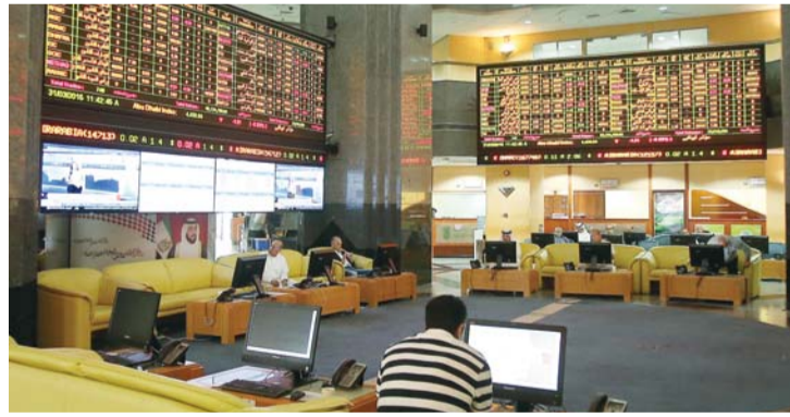
مكاسب جيدة لمؤشر الإمارات | البيان

بلغت نسبة الارتفاع في مؤشر سوق الإمارات المالي 8,6% منذ بداية العام الجاري وبلغ إجمالي قيمة التداول 130,26 مليار درهم. ووصل عدد الشركات التي حققت ارتفاعاً سريعاً 56 من أصل 126 وعدد الشركات المتراجعة 57 شركة. ويتصدر مؤشر قطاع «الاتصالات» المرتبة الأولى مقارنة بالمؤشرات الأخرى ومحققاً نسبة ارتفاع عن نهاية العام الماضي بلغت 33% ليستقر على مستوى 2865,75 نقطة مقارنة مع 2150,42. نقطة تلاه مؤشر قطاع