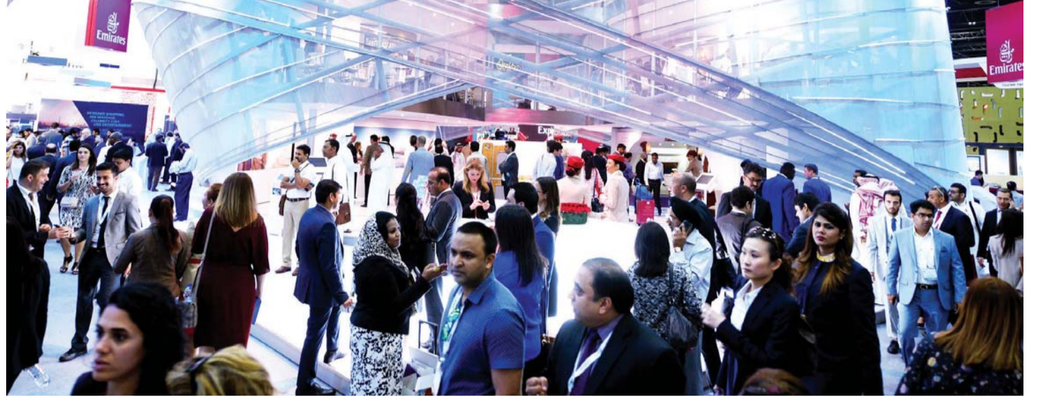
تدفق الزوار على جناح الناقل في المعرض | البيان