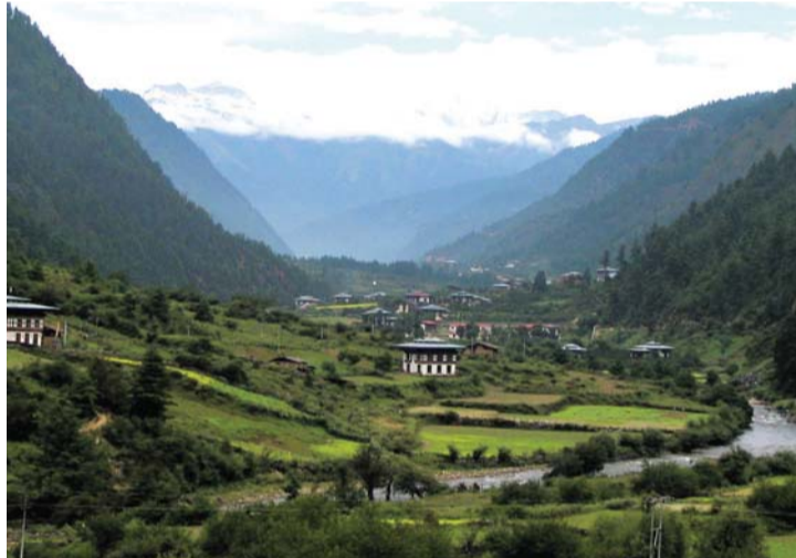
■ طبيعة بكر وجمال ساحر