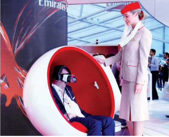
تدفق الزوار على جناح الناقل في المعرض | البيان