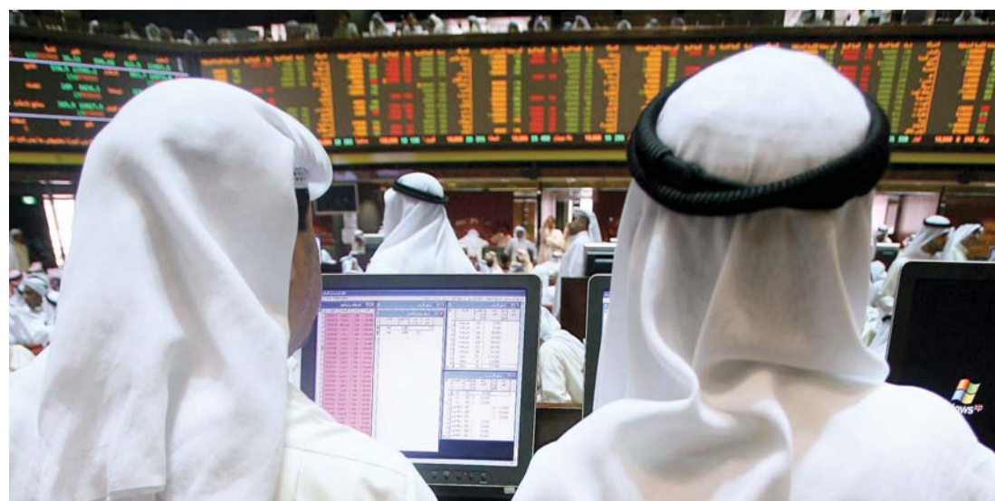
أداء جيد للبورصة الكويتية | البيان

وارتفع المؤشر السعري للبورصة الكويتية بنهاية أبريل 3,12% إلى النقطة 5391,81 لتبلغ مكاسبه أكثر من 163 نقطة، حيث أفلح المؤشر في مارس الماضي عند مستوى 5228,75 نقطة. كما ارتفع المؤشر الوزني في نهاية أبريل 1,8% صعوداً إلى مستوى 366,28 نقطة مقارنة بإقفاله في مارس الماضي عند النقطة 359,82، لتبلغ مكاسبه