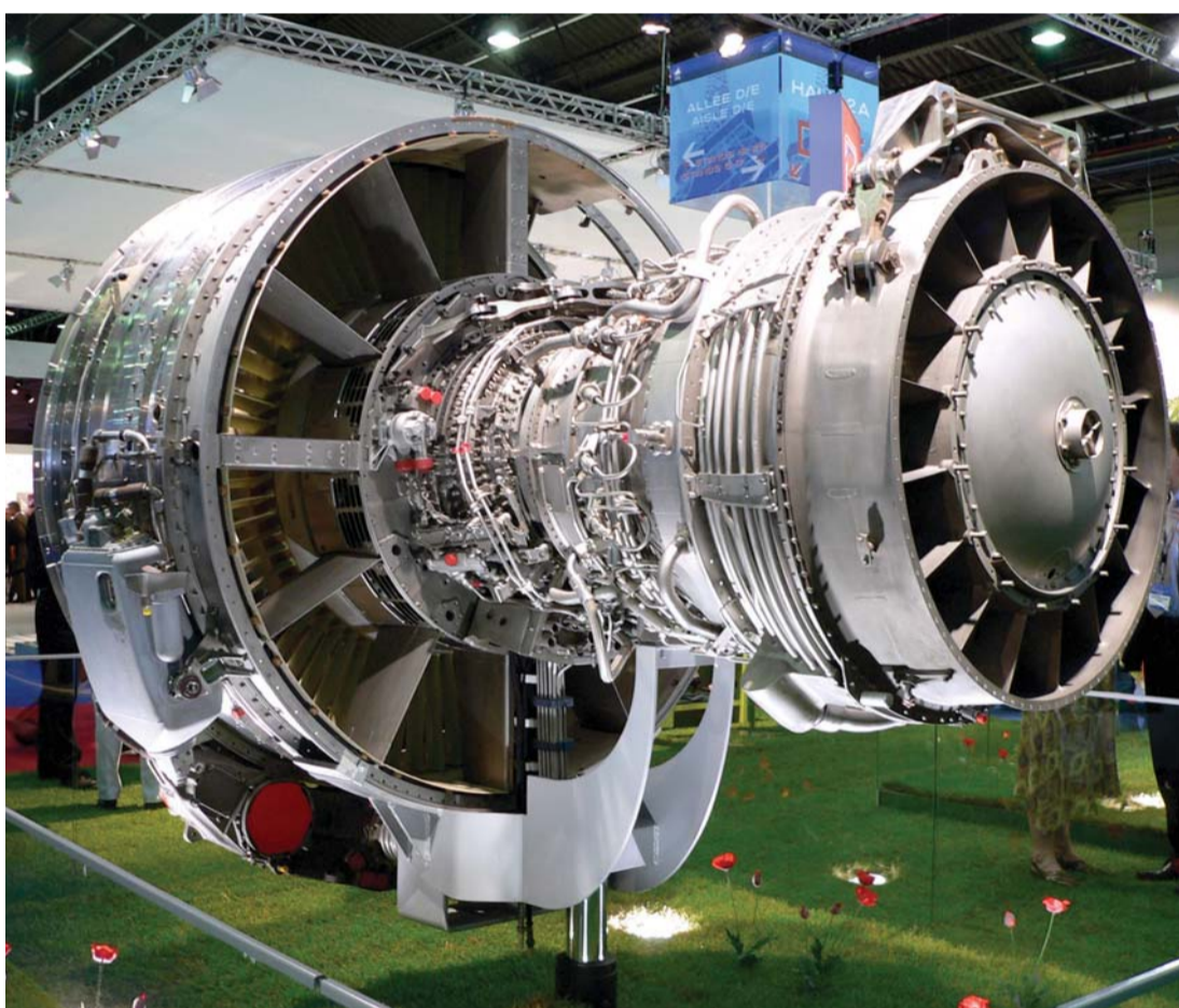
■ محركات سي إف إم