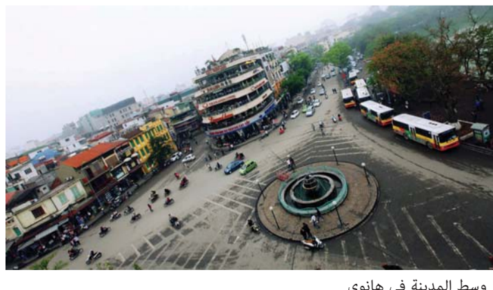
■ وسط المدينة في هانوي

الاستمتاع برحلة سياحية لا تنسى في مدينة هانوي في سحر الطبيعة وجمال الشواطئ مع الإقامة الفاخرة في أفخم وأهم فنادق ومنتجعات العالم بهانوي. هي نموذج مصغر من القارة الكبيرة تجمع بين أطرافها كل عناصر السحر، من البحيرات الطبيعية الجميلة والنهر الأحمر وغيرها. للسحر موطن معروف يسمى قارة آسيا، يتمثل في توليفة عجيبة، تجمع بين الطبيعة الرائعة، وعبق الأساطير التي تملأ المكان، وأضاف إليهما الآسيويون معالم الحضارة الحديثة ومميزاتها.