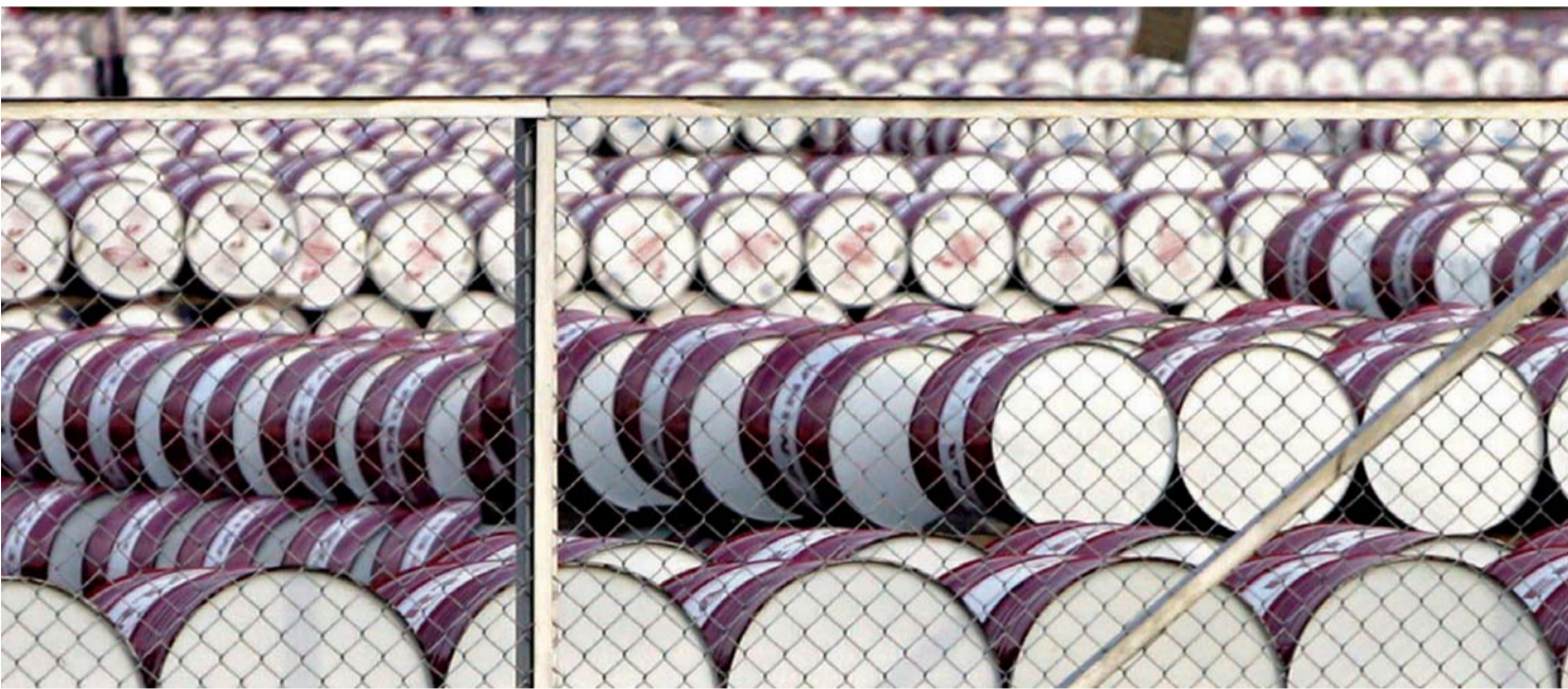
■ أسعار النفط الخام تصعد مجدداً | اي بي ايه

عقود مزيج برنت ترتفع إلى 48.30 دولارا والخام الأميركي عند 46.27