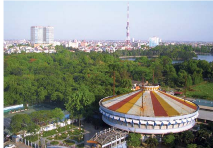
■ منتزه الوحدة

مع غرفة معالجة هادئة وساونا وغرف بخار وحمامات الحجر، وقاعة لليوغا ذات جدران زجاجية، كما أن الأجنحة تحتوي على صالة مدمجة بغرفة نوم، مع موقد تقليدي في الزاوية لحرق الخشب وحمام موزاييك إضافة إلى مناظر خلابة.