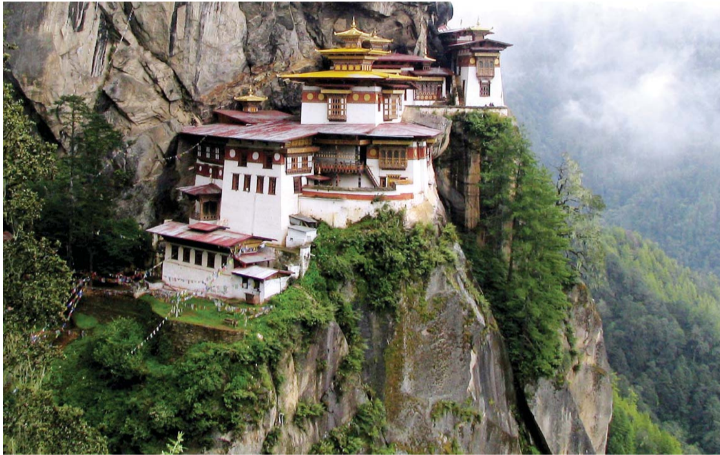
■ سياحة من نوع آخر في بوتان

يعد منتجع «أمانكورا» أفضل الخيارات الفاخرة للسياح، مع خصائص ذات مستوى عالمي تنتشر في جميع أنحاء بوتان، ويمكن للضيوف اجتياز المناطق بسهولة. كما أن منتجع «أمانكورا» في بارو هو الأقرب إلى المطار، ويضم 24 جناحاً، ويمزج العناصر الريفية مع العمارة المعاصرة ما يوفر تأثيراً مذهلاً. أما مطعم الفندق فيقدم المأكولات المحلية والهنديّة، وكذلك الغريبة، كما أنه من المؤكد أن النادي الصحي الفاخر ذي الطابقين سيغري الضيوف