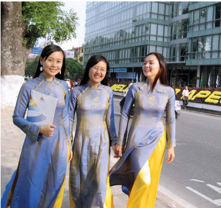
■ حياة و ثقافة

تضم هانوي العديد من المتاحف الشهيرة، مثل: متحف التاريخ الوطني الفيتنامي والمتحف الوطني للسلالات (الأعراق) والمتحف الوطني للفنون الجميلة ومتحف الثورة ويشتهر الحي