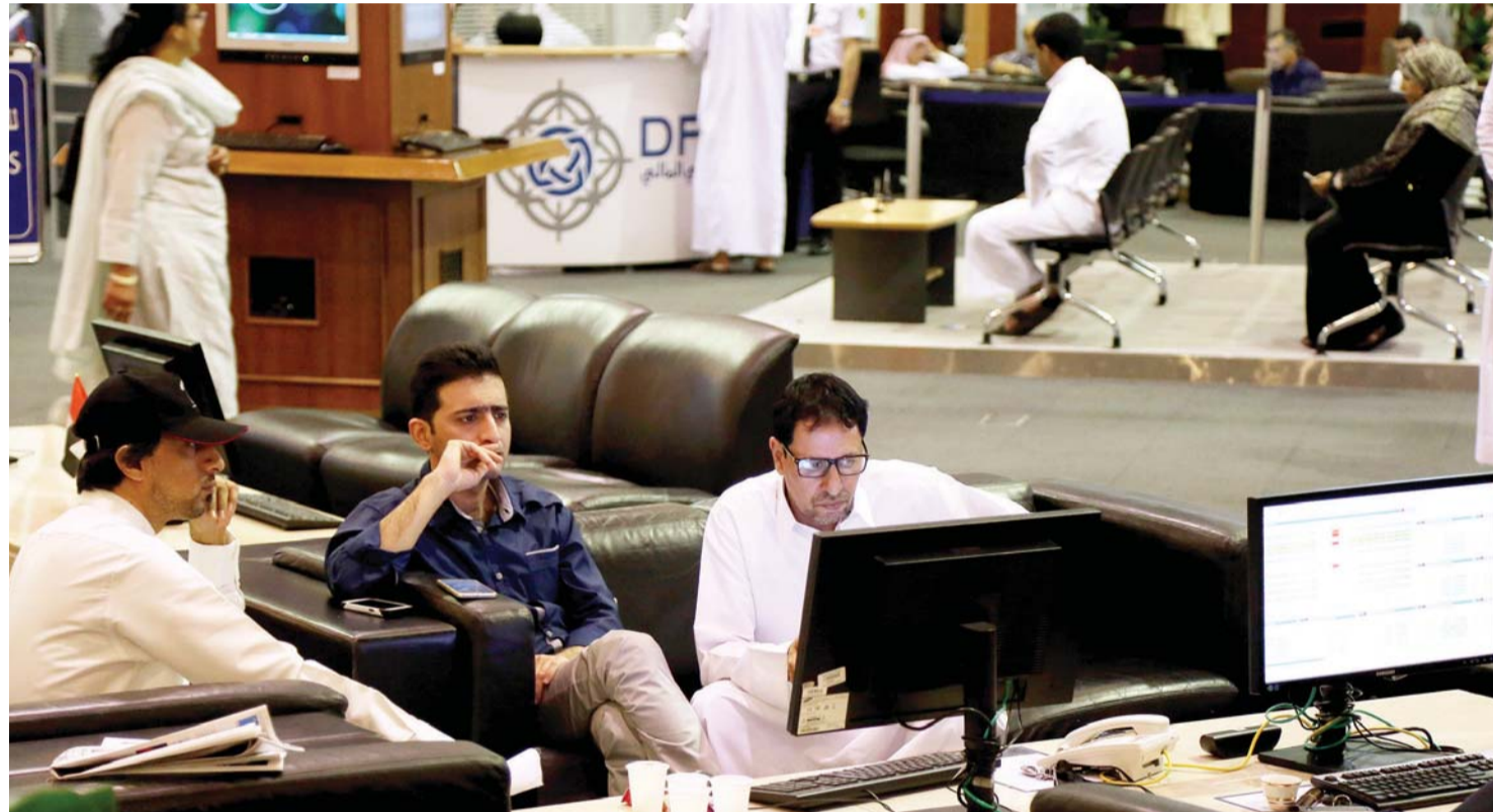
توجهات متباينة للمتداولين وعمليات شراء انتقائية في الأسواق المحلية | البيان

وبلغ إجمالي قيمة مشتريات الأجانب (الخليجيين والعرب ومختلف الجنسيات الأخرى) من الأسهم بسوق أبو ظبي للأوراق المالية خلال الشهور الستة