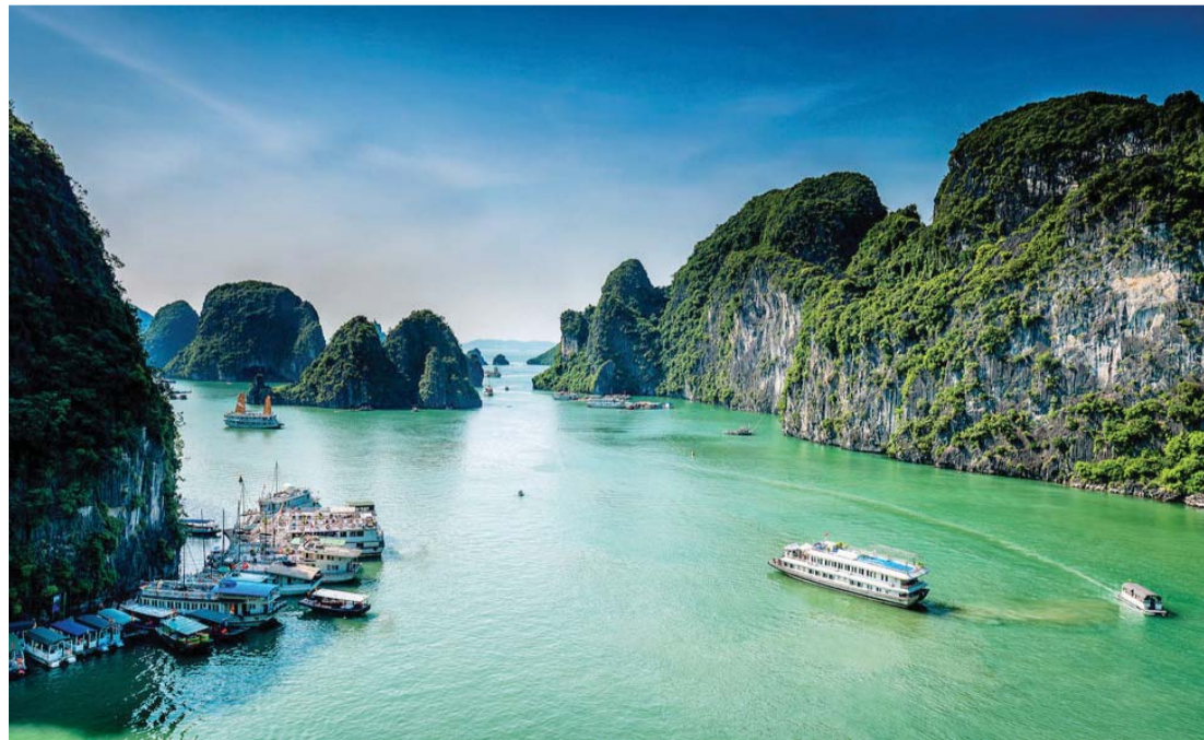
■ سحر الطبيعة

الاستمتاع برحلة سياحية لا تنسى في مدينة هانوي في سحر الطبيعة وجمال الشواطئ مع الإقامة الفاخرة في أفخم وأهم فنادق ومنتجعات العالم بهانوي. هي نموذج مصغر من القارة الكبيرة تجمع بين أطرافها كل عناصر السحر، من البحيرات الطبيعية الجميلة، والنهر الأحمر، الذي تقع على ضفته، إلى أسطورة السلحفاة التي خرجت من إحدى البحيرات لتمنح الإمبراطور «لو» لوي، السيف الذي سيحارب به الغزاة، وصولاً لناطقات السحاب والمناطق الصناعية والتكنولوجية الكبيرة، ما جعلها على قائمة أهم الوجهات السياحية في العالم، وثاني الوجهات الآسيوية بعد بكين.