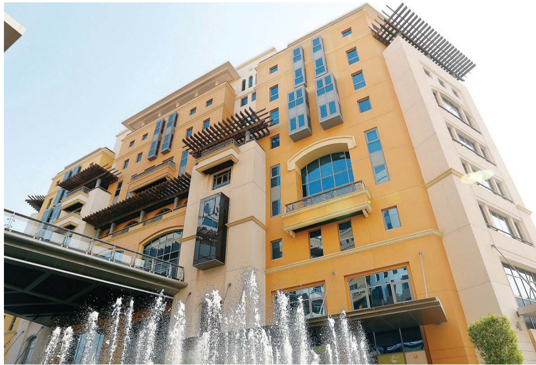
المؤشر الربع السنوي تقوم بإعداده دائرة التنمية الاقتصادية في دبي | البيان

وأشارت الشركات إلى انخفاض التوقعات بالنسبة لأسعار البيع مقارنة بالربع الرابع من عام 2015، حيث بلغ صافي الرصيد واحداً في المئة للربع الثاني من 2016، مما يتسق مع الانخفاض في معدل التضخم المسجلة في دبي بواقع 0,22% في شهر