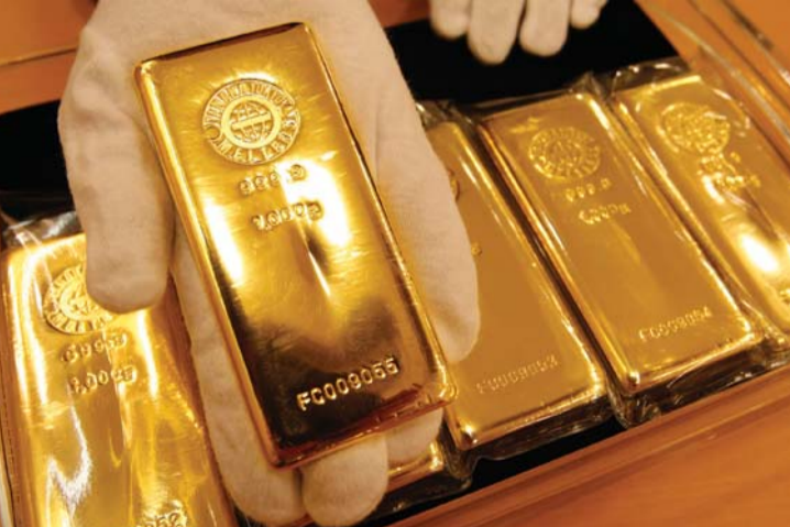
■ المعدن الأصفر يحقق المزيد من الارتفاع | أرشيفية

النقدية للمركزي الأميركي الذي صدر يوم الأربعاء بعد إبقائه على أسعار الفائدة دون تغيير. وأبقى البنك الباب مفتوحا أمام رفع الفائدة في يونيو حزيران لكنه لم يبد علامات تذكر على تحجله في تشديد السياسة النقدية. وصعدت الفضة 1.7% إلى 17.82 دولارا للأوقية بعدما لامست أعلى مستوياتها منذ يناير 2015 عند 17.92 دولارا للأوقية. وارتفع