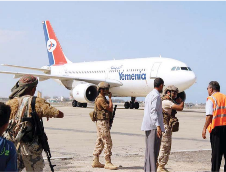
■ قوات أمنية لحماية المطار