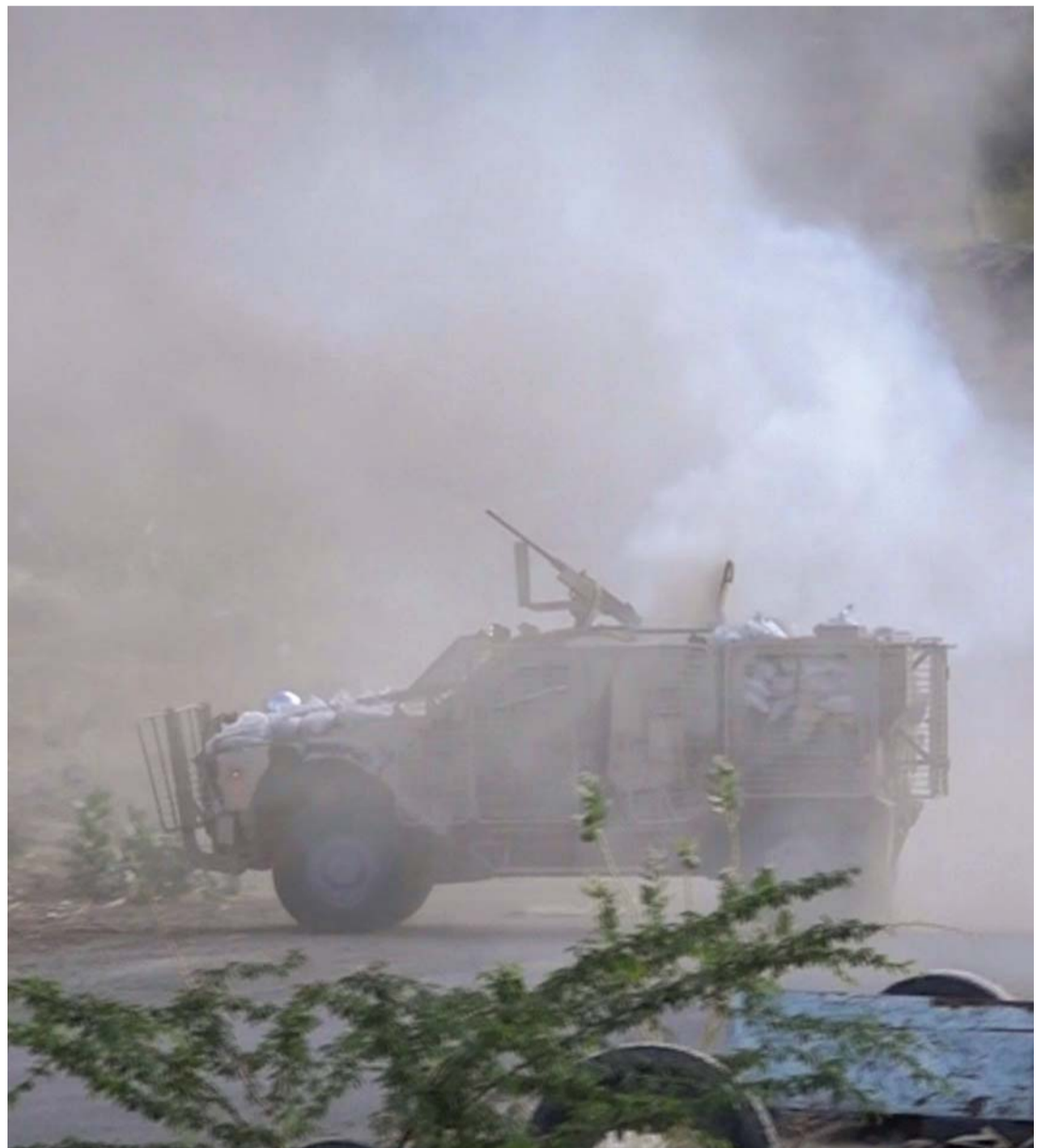
عربة عسكرية للشرطة قرب خط الجبهة التي ينتهك الانقلابيون فيها الهدنة في تعز

قصفها للأحياء السكنية في تعز بمختلف أنواع الأسلحة المتوسطة والثقيلة، وأوضح الناطق الرسمي باسم المجلس الأعلى للمقاومة الشعبية بمحافظة العقيد الركن منصور الحساني، لـ«البيان»، أن حالة من الرعب والهلع أصابت الأطفال والنساء جراء استمرار إطلاق الميليشيات لعشرات القذائف من الأسلحة الثقيلة وقذائف المدفعية على الأحياء السكنية. وسقط عدد من صواريخ الكاتيوشا التي أطلقتها الميليشيات من موقعها في المدينة، وحي البريد وسط المدينة، وتلة الأخوة، ومكتبة السعيد وأحياء مجاورة، كما قصفت بمدافع الهاورز حي الغرفة التجارية وسط المدينة بعدد من القذائف.