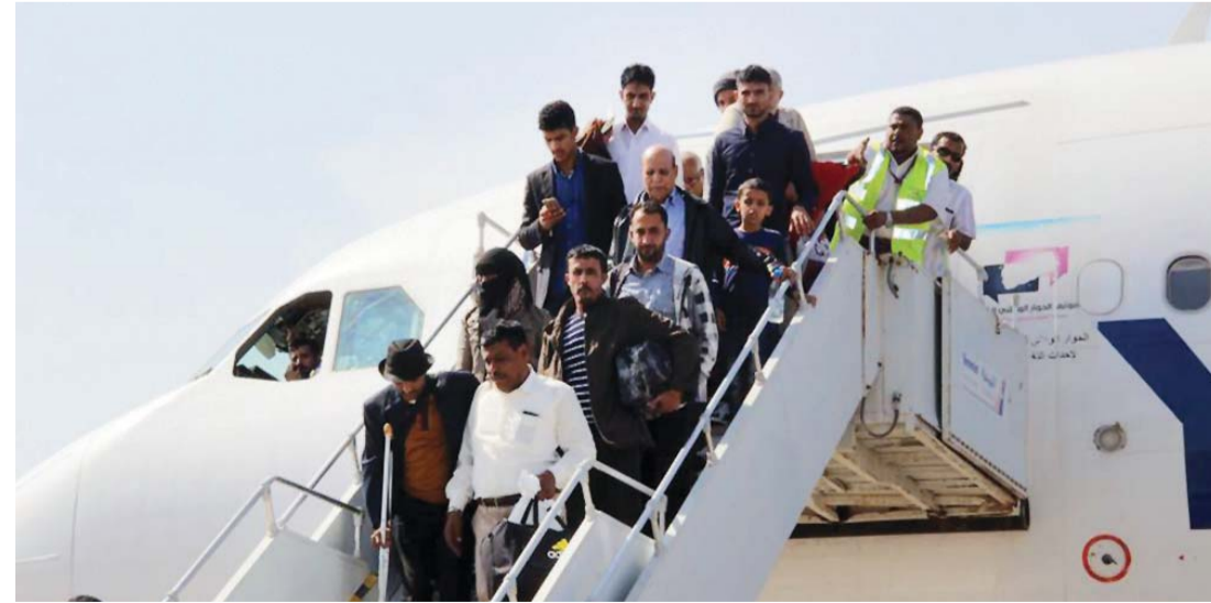
■ وصول الركاب إلى مطار عدن في أولى الرحلات أمس | البيان