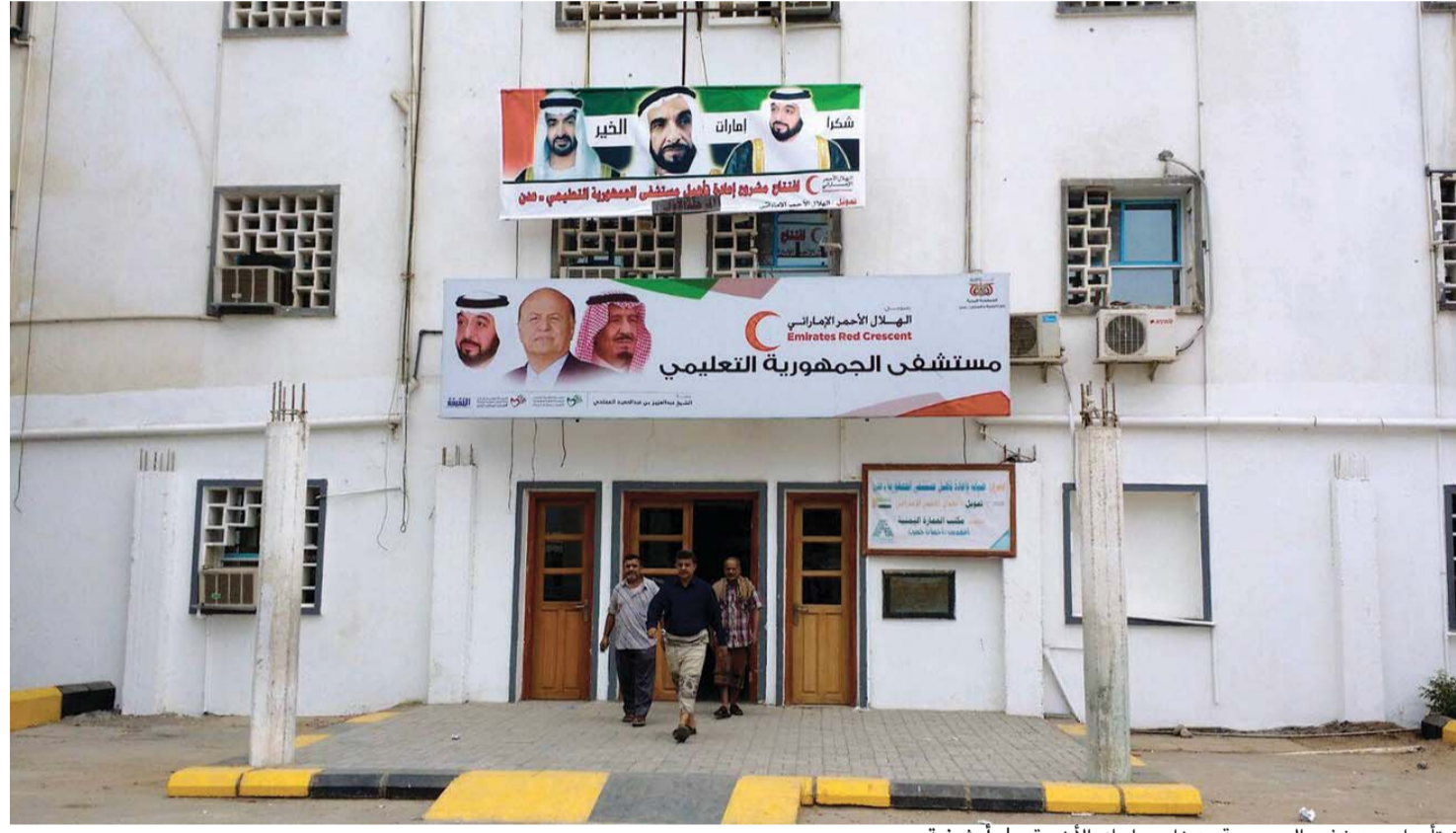
■ تأهيل مستشفى الجمهورية يدخل مراحله الأخيرة | أرشيفية

وأشارت الهيئة إلى أن الساحة الصحية في اليمن تشهد شحاً في الأدوية والمواد الطبية المنقذة للحياة، محذرة من تفاقم الأوضاع الصحية في حال تعذر الحصول على الرعاية الطبية اللازمة لمحتاجيها في مختلف المحافظات اليمنية. وقالت إنها تدرك المخاطر الناجمة عن هذا الوضع، لذلك تدرس فرق الهيئة الموجودة حالياً على الساحة اليمنية بعناية أولويات واحتياجات هذا القطاع الحيوي والهام، ورفعها في شكل تقارير عاجلة للهيئة لتوفيرها، وأكدت أن خططها في هذا الصدد، التي تستهدف تأهيل وتجهيز 14 مرفقاً صحياً منها خمس مستشفيات كبرى و9 عيادات ومراكز صحية، تسير على قدم وساق بفضل تضافر الجهود وتعاون الجميع مع الهيئة في تحقيق رسالتها الإنسانية على الساحة اليمنية.