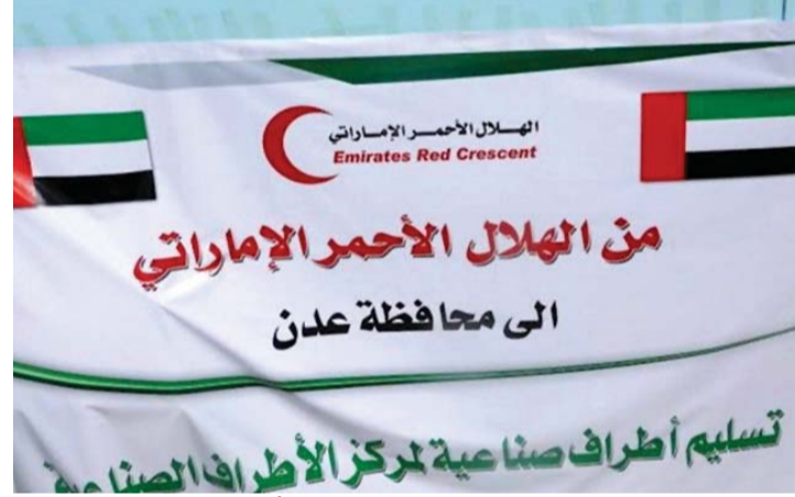
■ جانب من المستلزمات الطبية التي سلمتها الهلال الأحمر الإماراتي إلى المستشفى