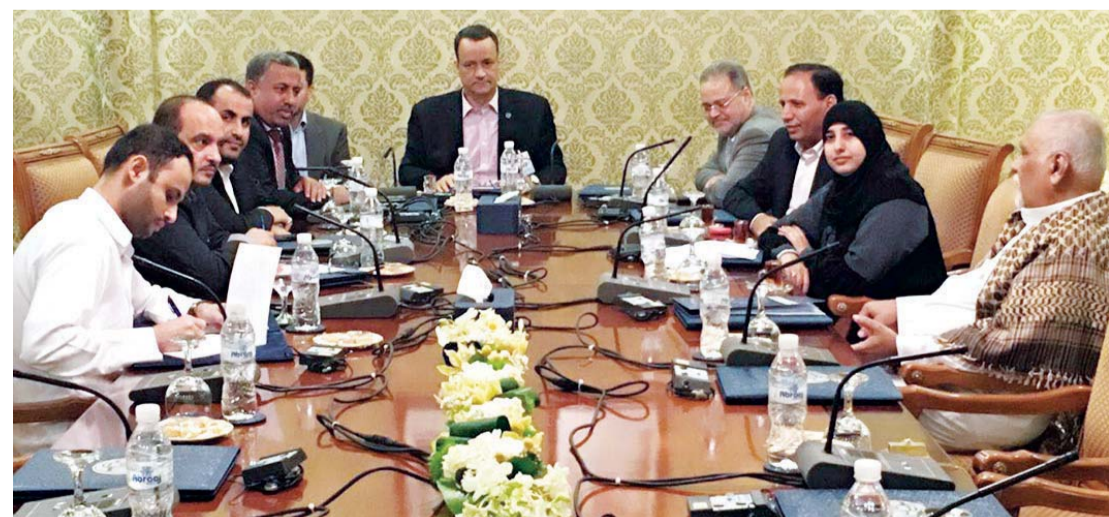
خلال جلسة المشاورات المشتركة في الكويت أمس

وقالت المصادر إن ولد الشيخ ومساعديه عقدوا اجتماعات منفصلة مع الجانبين الحكومي والحوثيين واتباع الرئيس السابق، حيث جددت الحكومة مطالباتها بالبدء بتسليم الأسلحة والانسحاب من المدن قبل مناقشة الجانب السياسي، كما يطالب بذلك الانقلازيون. وقال مفاوض من اللجنة السياسية وآخر من اللجنة العسكرية التابعين للشرعية لـ«البيان» إن وفد الحكومة سلم الأمم المتحدة خطة تسليم