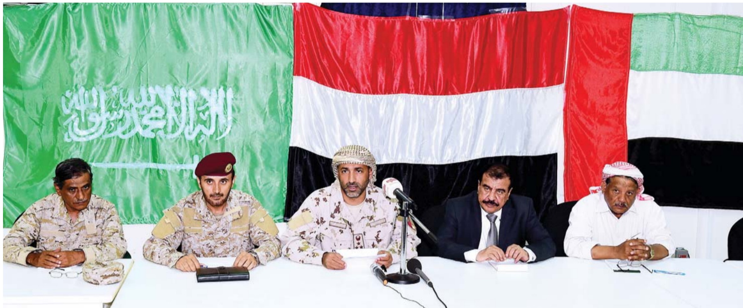
قائد القوات الإماراتية في حضرموت (وسط) خلال المؤتمر الصحفي

وصرح الراشدي بأن القوات الإماراتية تدرب القوات اليمنية التي أُنشئت جدارتها في معارك بالمكلا، منوها إلى أن أطناناً من المساعدات الإنسانية تنطلق باتجاه المكلا من الإمارات.