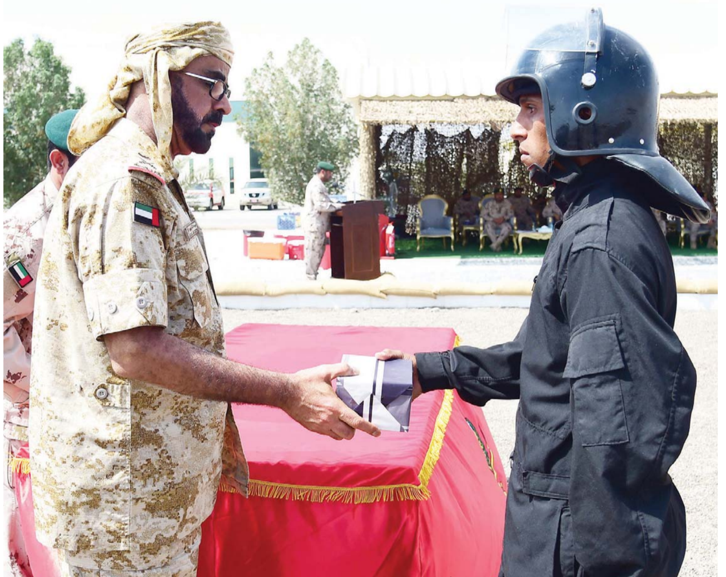
■ جانب من تخريج الدفعة الجديدة من أفراد الجيش اليمني على أيدي مدربين إمارتيين

واضح على تحمل دولة الإمارات العربية المتحدة لواجبها تجاه الأشقاء في اليمن وإعانتهم على استرداد الشرعية وإعادة الأمل إلى الشعب اليمني».