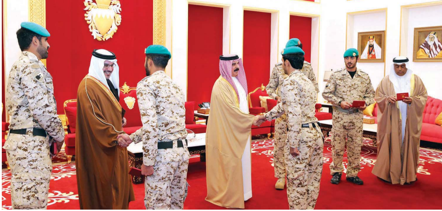
حمد بن عيسى خلال استقباله عدداً من الضباط والأفراد القادمين من اليمن | بنا

التحالف العربي المشترك. ومنح الملك حمد بن عيسى آل خليفة الأوسمة التقديرية للضباط والأفراد البواسل تقديراً لهم على قيامهم بواجباتهم الوطنية على أكمل وجه بعزيمة وإرادة صادقة في هذه المهمة السامية، مشيداً بما يقومون به مع أشقائهم من رجال قوة دفاع البحرين البواسل في مختلف مواقع عملهم وما حققوه من بطولات ونجاحات مميزة في المهام التي أوكلت لهم بروح معنوية صلبة وكفاءة عالية، وحرصهم بأن تظل راية البحرين شامخة عزيزة دائماً، حيث قدموا الصورة المشرفة الرفيعة لوطنهم. وأضاف العاهل البحريني أنهم دائماً موضع الاعتزاز والفخر من الجميع، مقدراً المشاركة المهمة والمتواصلة لقوة دفاع البحرين في عملياتهم «عاصفة الحزم» و«إعادة الأمل»، متكاتفين مع الأشقاء يداً واحدة ضمن قوات التحالف العربي المشترك بقيادة المملكة العربية السعودية الشقيقة دعماً للحق والشرعية و«حماية لأوطاننا وأمتنا العربية ولكل ما فيه خير اليمن الشقيق وشعبها العزيز».