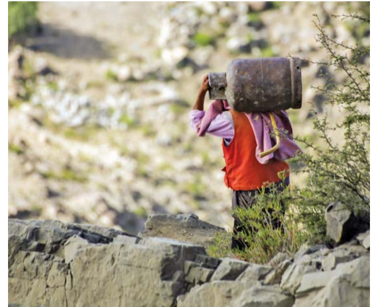
رجل يحمل اسطوانة غاز الطهي على ظهره في طريقه إلى تعز عبر الجبال الوعرة

صمدت مدينة تعز أمام جحافل مليشيات الحوثي وصالح الانقلابية، صمدت برجالها وكانت قاسية على المتمردين وصدت كل محاولاتهم لإسقاطها. امعن الحوثيون بكل الطرق في محاولة ادلال سكان المدينة الصامدة التي رفضت الوقوف مع الانقلاب، وصارت المليشيات، تقصف المدينة ليلاً ونهاراً مستهدفة المدنيين من النساء والأطفال بشكل ممنهج. احد فصول الإجرام الحوثي هو الحصار حيث حاصر المتمررون مدينة تعز منذ ستة شهور ويقومون بمنع دخول الأدوية