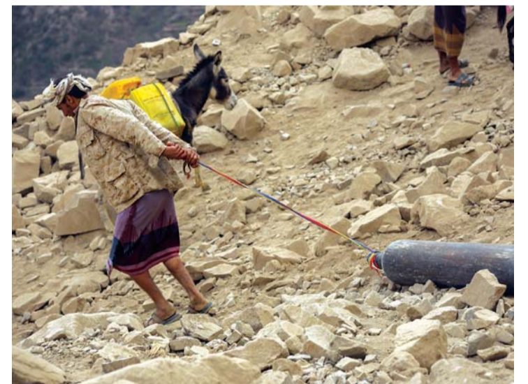
يمني يجر أنبوب اكسجين لتهريبه عبر الجبال إلى مستشفيات تعز