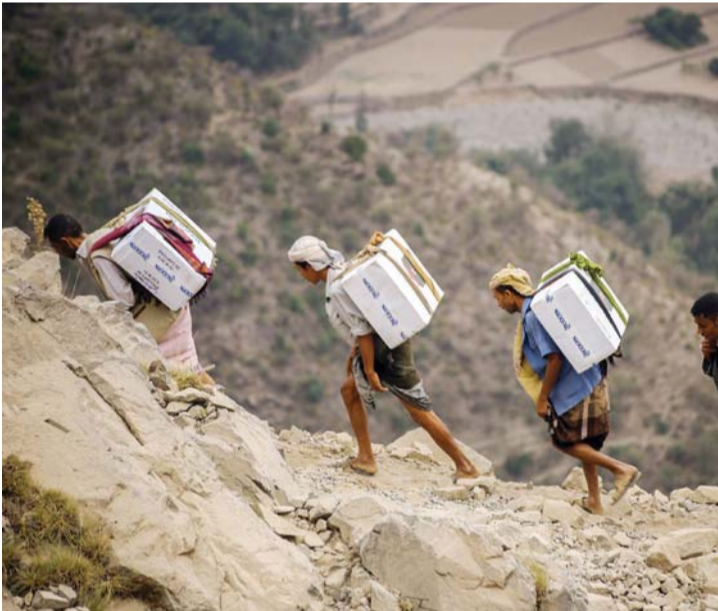
شبان يحملون مواد غذائية وأدوية يشقون طريقهم عبر الجبال إلى تعز

والغذاء وأي مقومات الحياة، إلا ان مدينة تعز صمدت أمام هذا الحصار وذلك عبر طرق تهريب جبلية وعرة وذلك من أجل تهريب الغذاء وكسر الحصار الذي نفذته مليشيا الحوثي. يشترك الآلاف من أبناء مدينة تعز في عملية تهريب الحياة من رجال وأطفال ونساء من أجل ادخال كل ما يمكن إلى مدينة تعز حملاً على ظهورهم أو ظهر الحمير والجمال عبر الجبال والطرق الوعرة كون السيارات لا تستطيع العبور، وتشكل بهذا مشهد إنساني يكشف مدى زيف وقبح مليشيا الحوثي التي حاولت تريع المدينة عبر الحصار إلا أن أبناءها صمدوا امام كل محاولاتهم البائسة لانقاذ انفسهم.