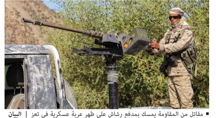
مقاتل من المقاومة يمسك بمدفع رشاش على ظهر عربة عسكرية في تعز

الرياض - الوكالات أعلن الجيش الوطني اكتمال الاستعدادات الرامية لاستعادة العاصمة، مشيراً إلى أن الانطلاق الفعلي لمعركة التحرير الفاصلة سيكون قريباً جداً. وقال الناطق باسم الجيش الوطني سمير الحاج إن كافة القوات الموالية للشرعية،