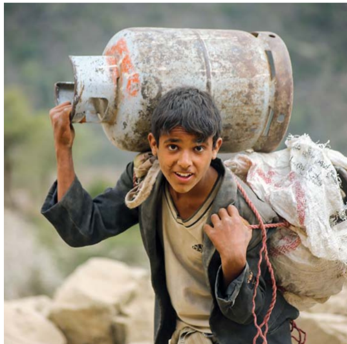
طفل يرفع على ظهره اسطوانة لغاز الطهي لتجربها إلى تعز عبر الجبال