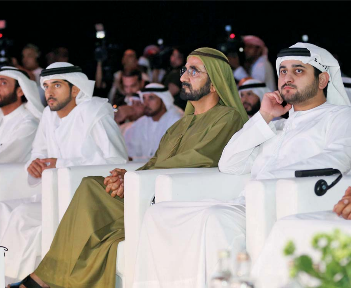
محمد بن راشد وحمدان ومكتوم بن محمد يتابعون الحفل بحضور سلطان بن طحون و سلطان الجابر ومحمد الشيباني وحسين لوتاه