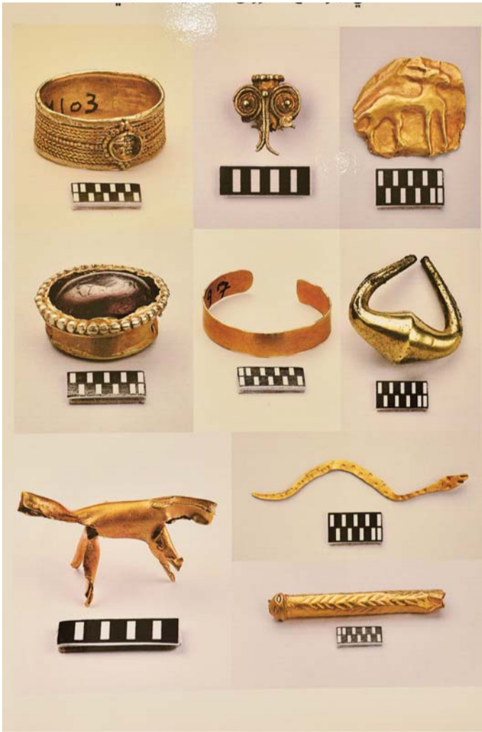
■ مجموعة من القطع الذهبية المكتشفة في الموقع