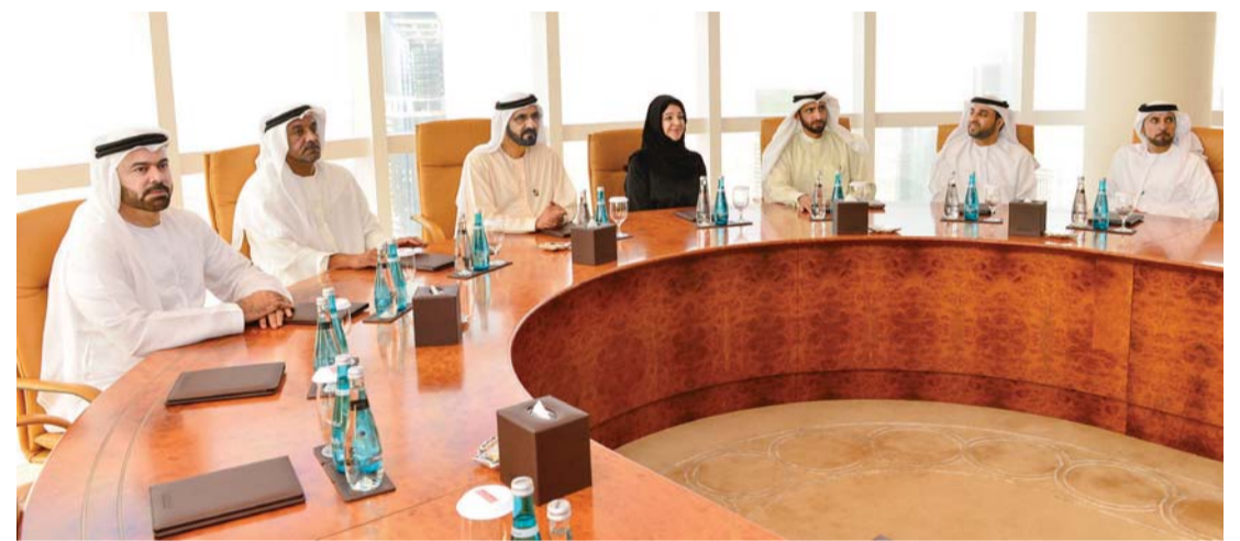
سموه خلال اعتماده الشعار بحضور أحمد بن سعيد ومحمد القرقاوي وريم الهاشمي ومحمد الشيباني وخليفة سليمان و سلطان السبوسي