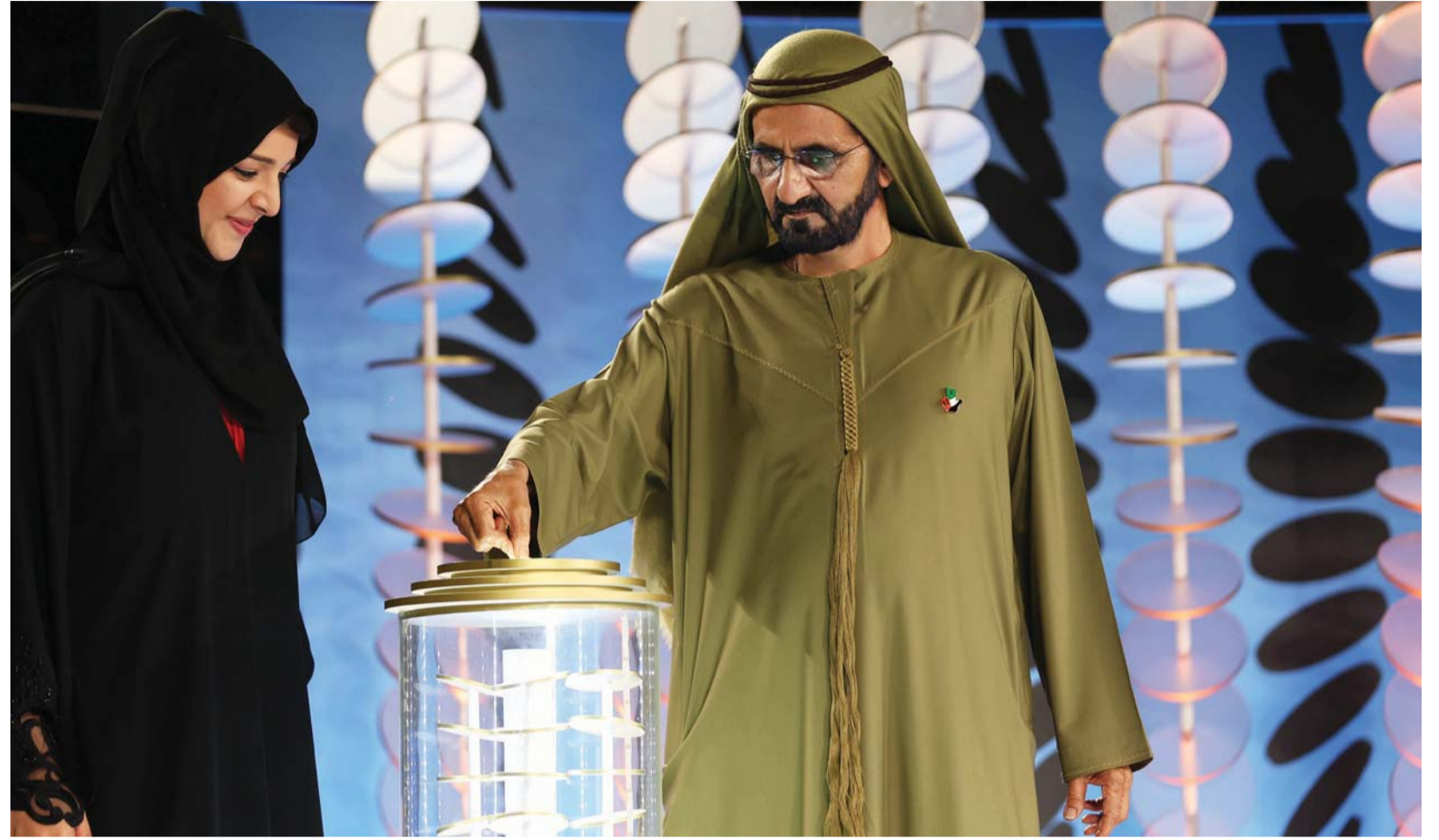
■ محمد بن راشد خلال الكشف عن شعار إكسبو 2020 بحضور ريم الهاشمي

■ اسموه: دبي مدينة للذهب كانت وستبقى.. وأثمن من الذهب عقول وأفكار وسواعد أبنائنا وبناتنا