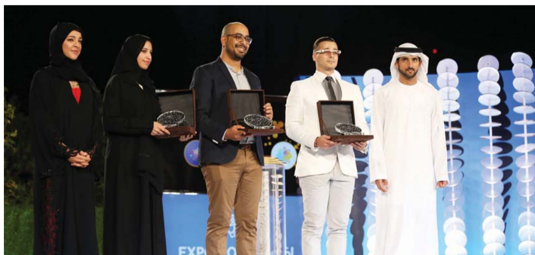
■ حمدان بن محمد يتوسط المرشحين النهائيين الثلاثة خلال حفل التكريم

وكانت دبي قد تسلمت رسمياً في نوفمبر من العام الماضي لقب «المدينة المضيفة» للنسخة المقبلة من معرض «إكسبو الدولي»، أكبر معارض العالم وأعرقها تاريخاً، وذلك من «المكتب الدولي للمعارض». وقد انطلق العمل في موقع استضافة الحدث، حيث تم حتى اليوم إنجاز نحو مليون ساعة عمل، كما تم اختيار الشركات الفائزة بتصميم أجنحة إكسبو 2020 دبي الثلاثة التي تجسد موضوعاته الفرعية «الفرص» و«التنقل» و«الاستدامة».