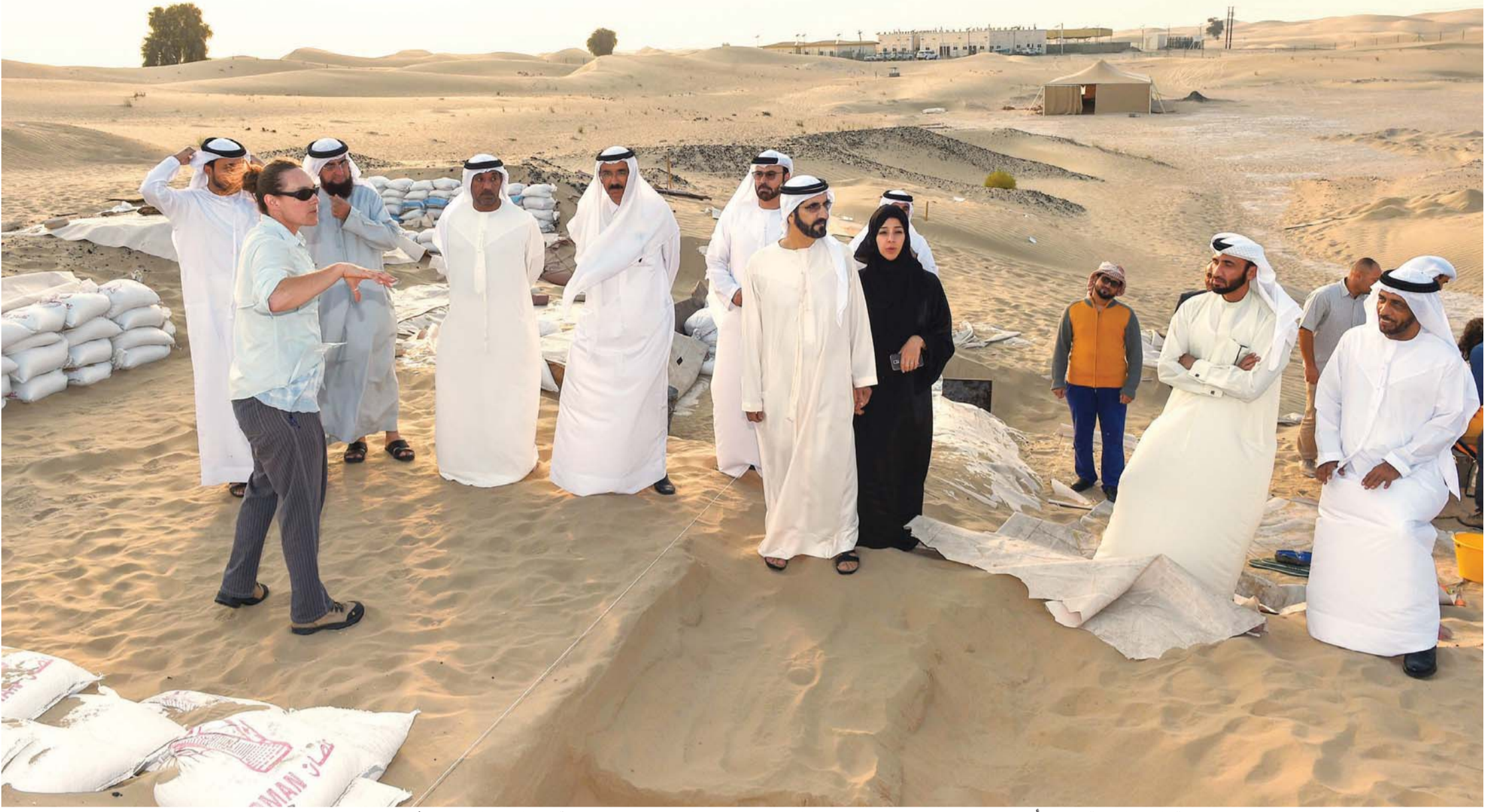
■ محمد بن راشد يستمع إلى شرح حول التنقيب في «صاروج الحديد» بحضور أحمد بن سعيد ومحمد القرقاوي وريم الهاشمي ومحمد الشيباني ومحمد المر وخليفة سليمان ورشاد بوخش