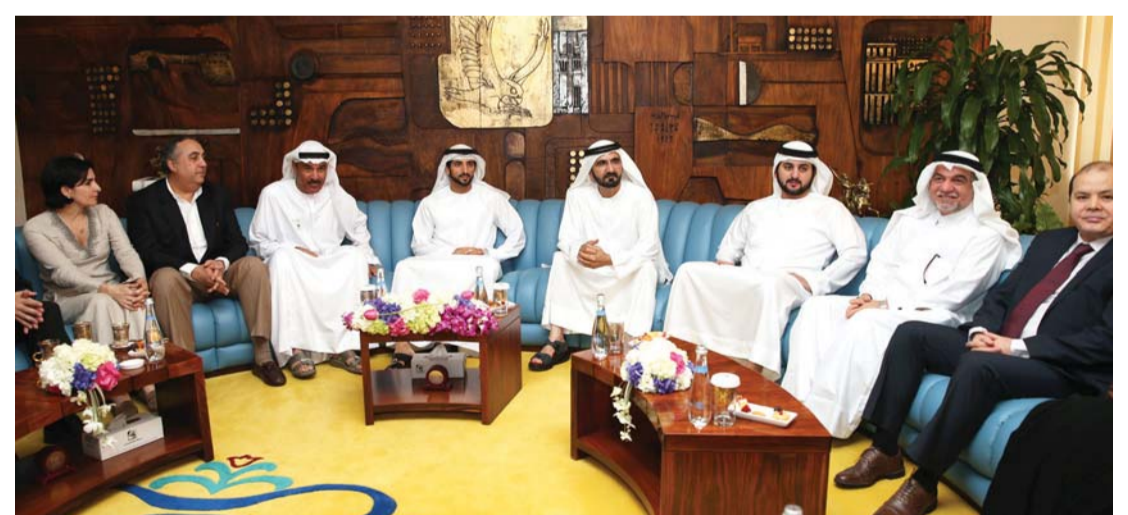
محمد بن راشد خلال لقائه أعضاء اليونسكو بحضور حمدان ومكتوم بن محمد وحسين لوتاه ضمن عمليات تسجيل مواقع إماراتية أثرية في قائمة التراث العالمي