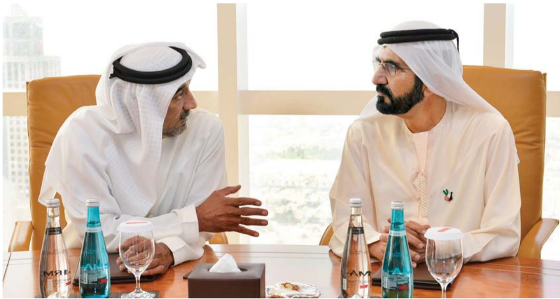
■ محمد بن راشد في حديث مع أحمد بن سعيد خلال اعتماد الشعار

■ حمدان بن محمد يكرم المرشحين النهائيين في مسابقة تصميم الشعار الجديد