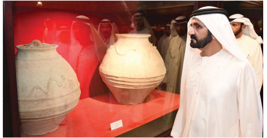
■ وسموه مطلعاً على بعض الأواني الفخارية المكتشفة