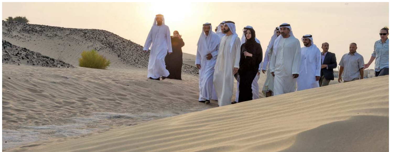
■ وسموه لدى زيارته موقع صاروج الحديد الأثري