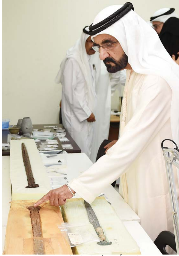
■ نائب رئيس الدولة متفقداً بعض الأسلحة المكتشفة

■ التنقيبات كشفت آلاف القطع الأثرية التي تتضمن عدداً من القطع النادرة التي لا مثيل لها في الإمارات