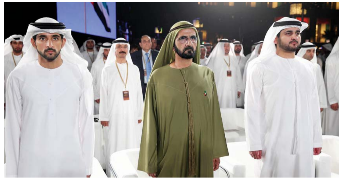
■ محمد بن راشد خلال الحفل بحضور حمدان ومكتوم بن محمد