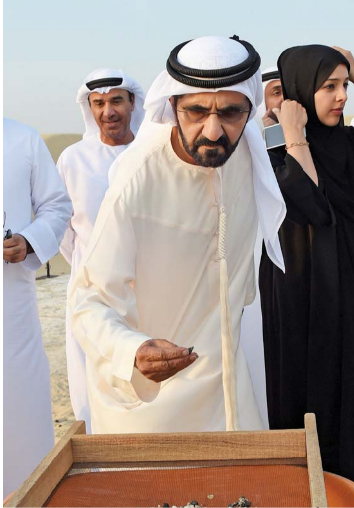
■ ومتفقداً بعض الاكتشافات

وأكد لوتاه أن من بين القطع الأثرية التي تم العثور عليها في الموقع كان خاتماً ذهبياً على شكل دائرة تضم عدة دوائر، حيث أعجب بتصميمه الغلاب صاحب السمو الشيخ محمد بن راشد آل مكتوم نائب رئيس الدولة رئيس مجلس الوزراء حاكم دبي، رعاه الله، ليقتع الاختيار على الخاتم ليكون مصدر الإلهام