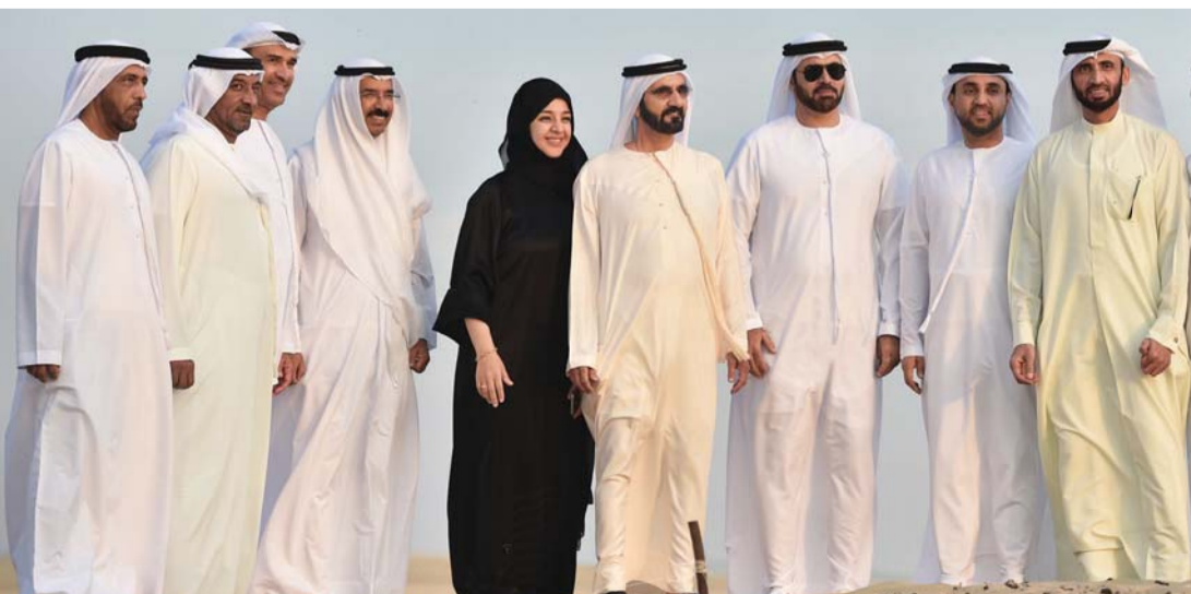
■ محمد بن راشد في صورة تذكارية بالموقع الأثري بحضور أحمد بن سعيد ومحمد القرقاوي وريم الهاشمي ومحمد الشيباني ومحمد المر وحسين لوتاه وخليفة سليمان