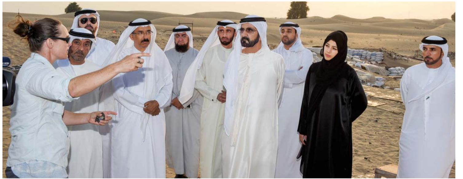
■ محمد بن راشد يستمع إلى شرح حول عمليات التنقيب في الموقع الأثري