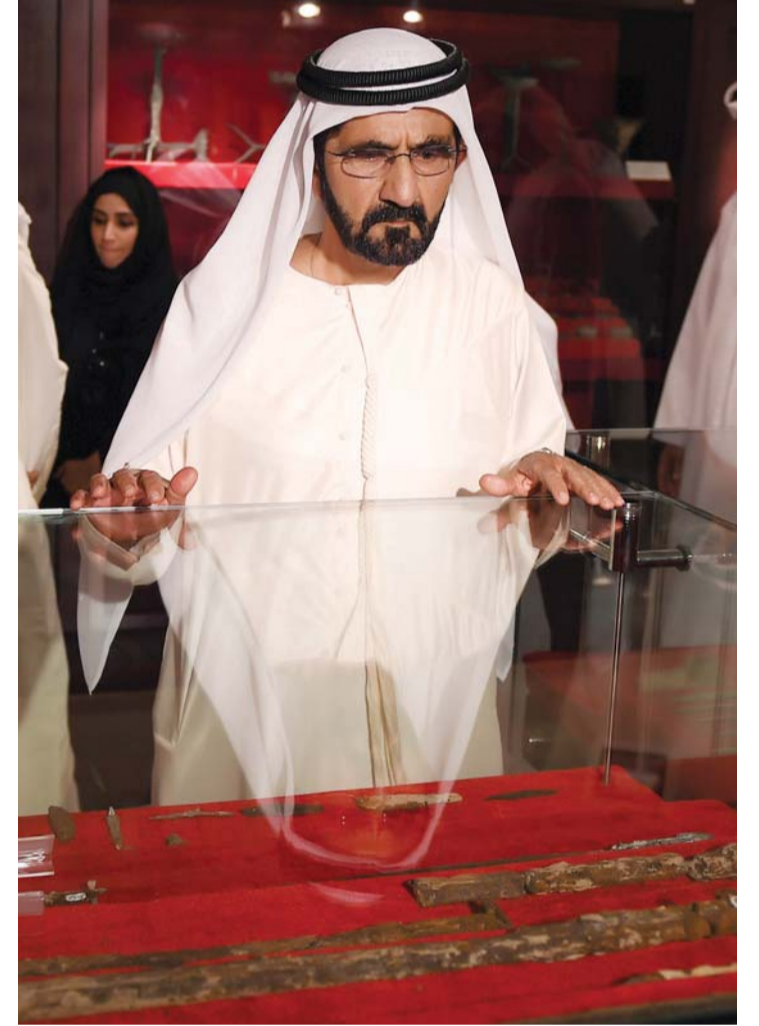
■ ويطالع بعض الاكتشافات الأثرية