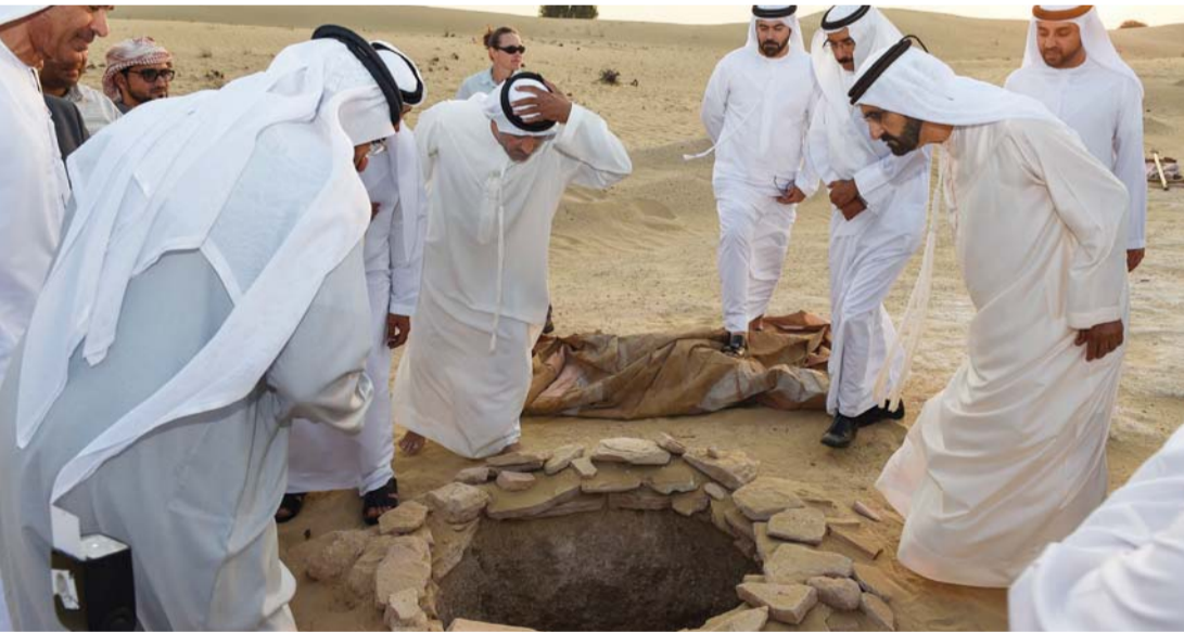
■ وسموه متفقداً الموقع