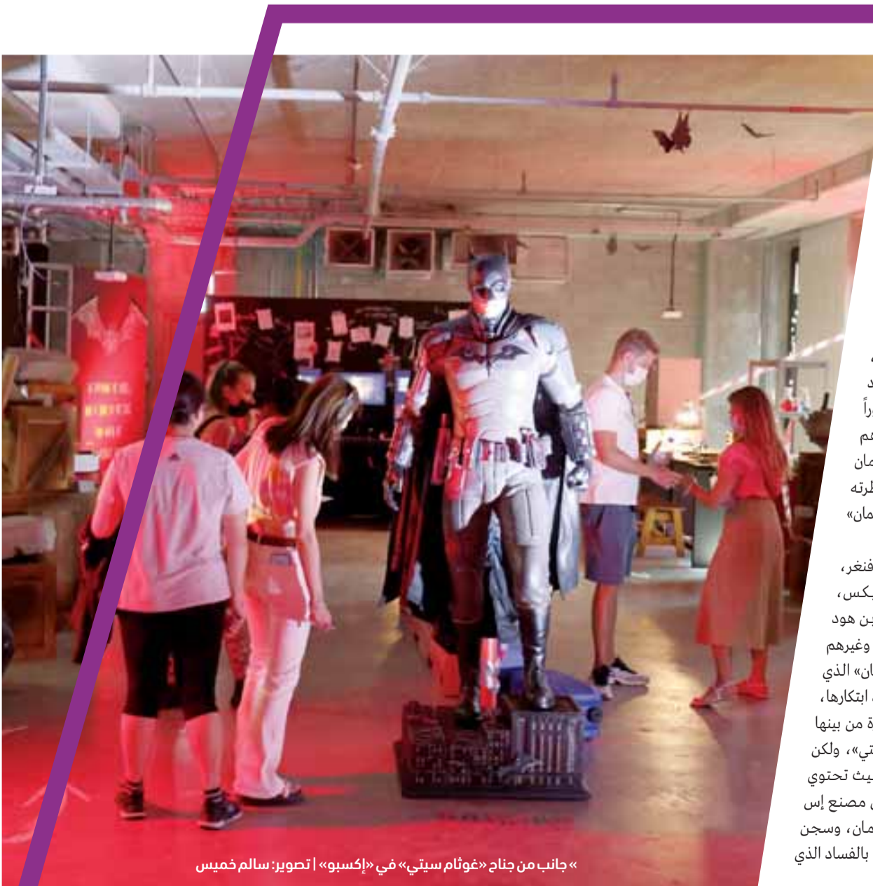
«جانب من جناح «غوتم سيني» في «إكسبو»

بليز هي الدولة الوحيدة في أمريكا الوسطى التي تعد اللغة الإنجليزية لغتها الرسمية، لكونها مستعمرة بريطانية سابقة، يتحدث شعبها الإسبانية والكريول ولغة المايا، تقع على الساحل الشرقي لأمريكا الوسطى وعاصمتها بلموبان، ويبلغ عدد سكانها قرابة 410 آلاف نسمة، وتعد همزة وصل بين الأسواق النامية، وضعها موقعها الاستراتيجي لتكون بوابة مهمة تصل بين أسواق أمريكا الوسطى وأسواق منطقة البحر الكاريبي، تستقطب أنظمتها المحلية واقتصادها المستقر والمفتوح العديد من المستثمرين الأجانب من حول العالم، وتتيح للمقيمين وغير المقيمين الاستثمار في كافة القطاعات من الزراعة إلى السياحة والعقارات وغيرها، وتقدم بليز حوافز استثمارية تشكل في العديد من البرامج المميزة والمحفزة للاستثمار وتوجه تلك البرامج نحو تعزيز الاستثمار في القطاعات المهمة ذات الأولوية. تعد بليز أحد أكثر دول أمريكا الوسطى ديمقراطية واستقراراً من حيث نظامها السياسي والاقتصادي، وتجمع ثقافتها ما بين أسلوب الحياة الكاريبية الهادئ والحماس للابتكار، وتتمتع بثروة من القوى العاملة والشابة الماهرة، فشعبها الشاب والمتعدد بثقافته ومهاراته هو بلا شك أحد ثرائها، وتحضن أرضها أكثر