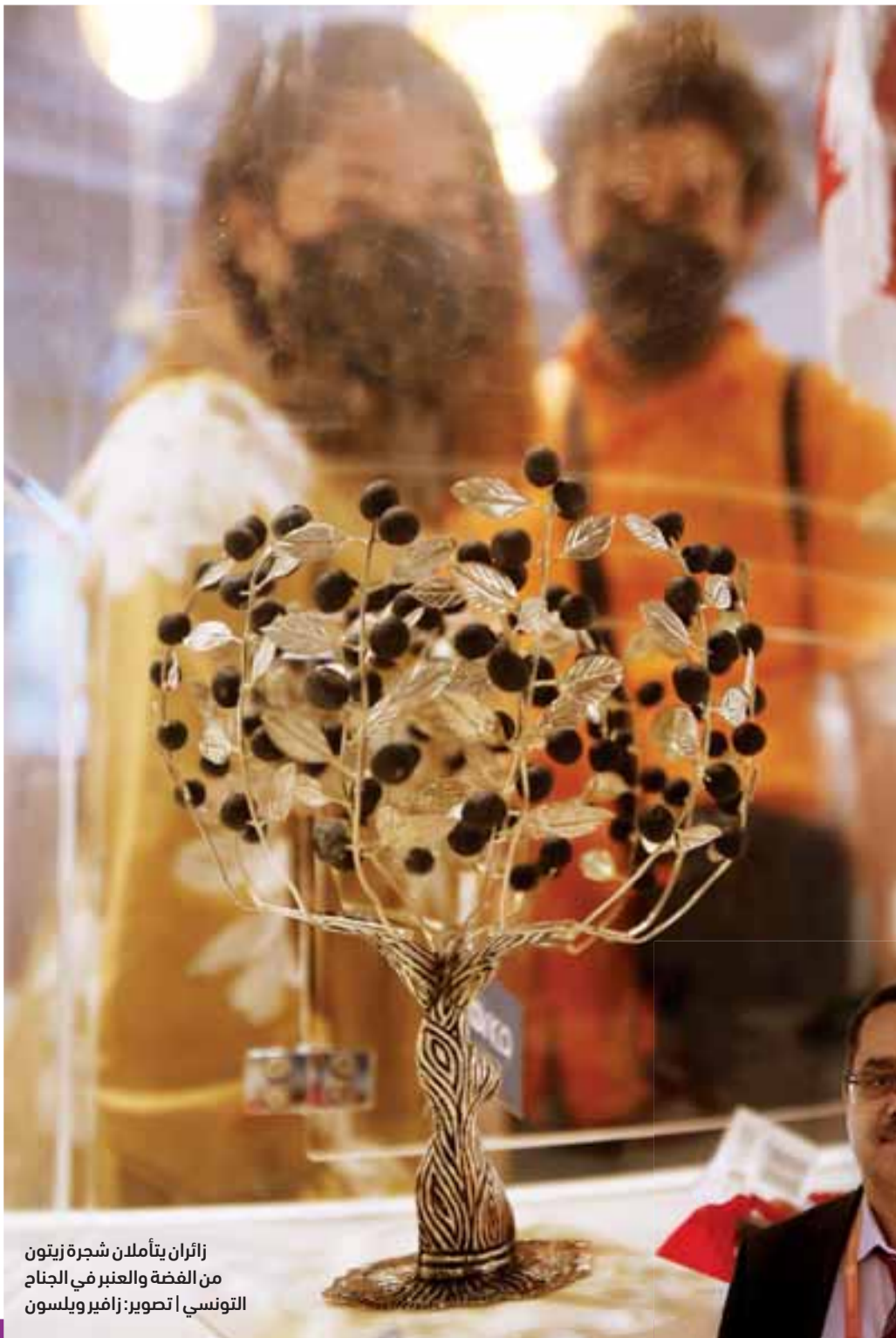
زائران يتأملان شجرة زيتون من الفضة والعنبر في الجناح التونسي

كما تشير أرقام وزارة الزراعة التونسية إلى أن حجم الصادرات بلغ حدود 178 ألف طن بقيمة مالية لا تقل عن 1.45 مليار دينار تونسي (نحو 537 مليون دولار) من بينها 22 ألف طن زيت زيتون معلب مكثت من توفير قرابة 258 مليون دينار (نحو 95.5 مليون دولار)، وذلك خلال الفترة بين شهري نوفمبر 2020 ونهاية شهر يوليو 2021.