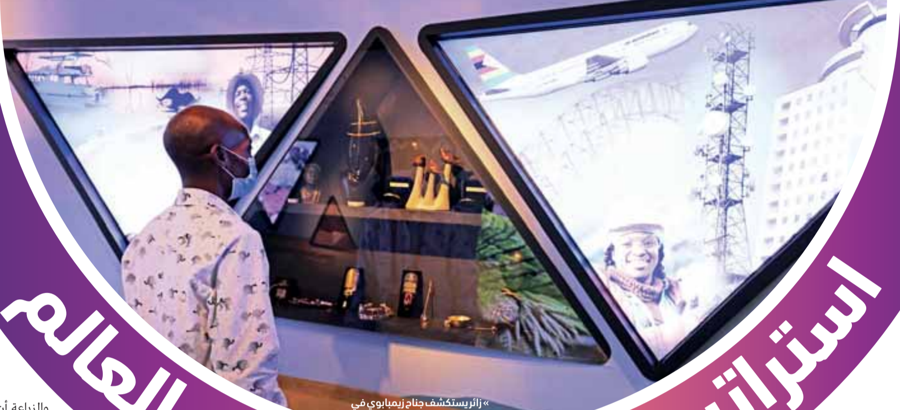
« زائريستكشف جناح زيمبابوي في إكسبو.