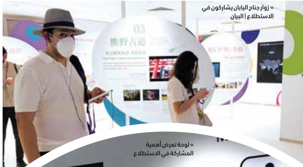
« زوار جناح اليابان يشاركون في الاستطلاع | البيان

وبمجرد أن يختار الزائر عنواناً لأحد الموضوعات المطروحة يخبره التطبيق الهاتفي أن الشخص المعني أصبح معنياً بالموضوع الذي اختاره للمناقشة، بحيث يوسع معلوماته أكثر عنه ويحاول أن يتواصل مع محيطه ليخبرهم عن هذا الموضوع وتحدياته وغيرها من الأمور والمعلومات المتعلقة به، وتأتي هذه التجربة التفاعلية لاستطلاع آراء الزوار، كنوع من تعزيز مشاركة الجمهور لما يواجهه عالمنا من تحديات ولفت الأنظار إليها، خاصة أن عالمنا أصبح كما لو أنه قرية صغيرة يتأثر الجميع فيها بما يحدث هنا أو هناك، ولذلك كان من الأهمية بمكان الارتقاء بوعي الأفراد والمجتمعات، وصولاً لمجتمع أفضل في المستقبل، نستحق أن نعيشه دونما مخاطر تؤثر على حياة البشرية.