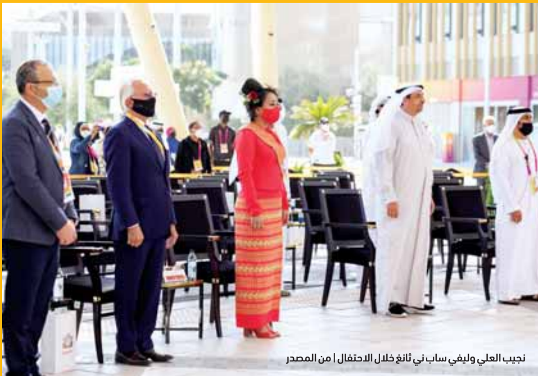
نجيب العلي وليفي ساب ني نانغ خلال الاحتفال

وتفتخر الدولة أيضاً بشبكة رائدة من الأنهار لتوفير النقل والري، وتشمل مواردها الطبيعية بعضاً من أحجار الياقوت والبشم الإمبراطوري الأكثر إثارة للإعجاب في العالم.