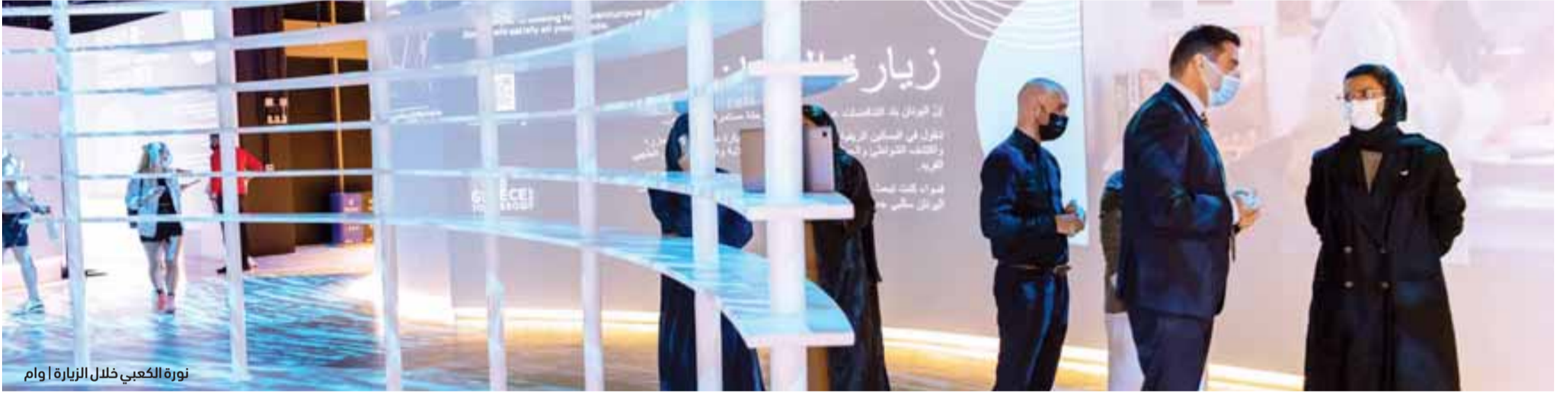
نورة الكعبي خلال الزيارة

وتعد «بادن فورتمبيرغ» ولاية البحث العلمي، فهي الثانية عالمياً، والأولى أوروبياً في الإنفاق على البحث العلمي، وتضم أكثر من 60 مؤسسة خاصة بالبحث العلمي وأربع جامعات اتحادية، وتعد مقصداً لأهم الباحثين عالمياً، وتضم بادن فورتمبورغ أيضاً الوادي السبيراني، والذي يعد الأكبر من نوعه في أوروبا وخاصة في مجال الذكاء الاصطناعي، إذ يتحول العمل مباشرة إلى تطبيقات مبتكرة. واطلعت معاليها على 25 ابتكاراً ومشروعاً علمياً رائداً، إضافة إلى لوحات وصور موزعة على أعمدة خشبية عالية، تشرح التنوع الكبير والتطور الكبير، الذي تشهده تلك الولاية، فهي موطن «دايملر» و«بورشه» و«مرسيدس بنز» أبرز الشركات العالمية في تصنيع السيارات الفخمة، ومكان ولادة أينشتاين، وفيها صنعت أول آلة حاسبة في العالم عام 1623 مع ويلهلم شيكارد، وتسجل 15 ألف اختراع سنوياً، وهي صاحبة العرض العالمي لأول تاكسي طائر ذاتي القيادة في دبي عام 2017.