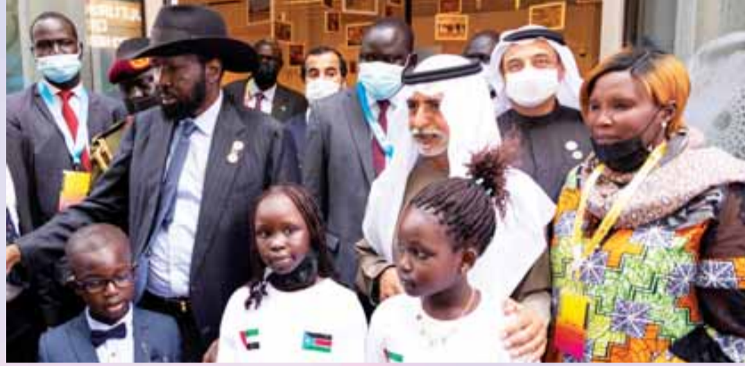
«رئيس جنوب السودان ونهيان بن مبارك خلال الاحتفال»

بعد الحفل قام رئيس جنوب السودان، والوفد المرافق له، بجولة في جناح الإمارات، ثم جناح بلاده الواقع في منطقة الفرص.