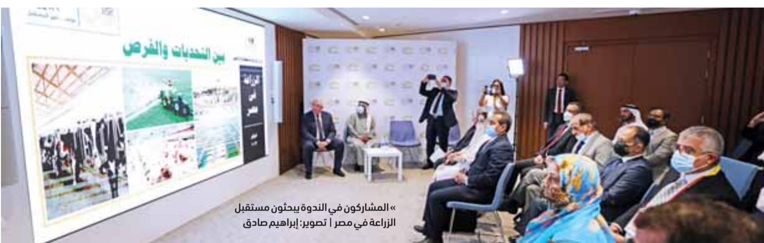
«المشاركون في الندوة يبحثون مستقبل الزراعة في مصر»

ملايين فدان المساحة الإجمالية للأراضي الزراعية 6.3 ملايين منها بالوادي والدلتا