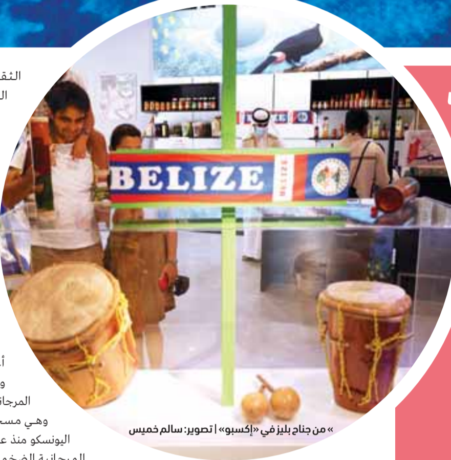
«من جناح بليز في «إكسبو»

وفي السياق ذاته تعتبر محمية الحاجز المرجاني في بليز من العناصر السياحية الجاذبة، وهي مسجلة كموقع للتراث العالمي من قبل اليونسكو منذ عام 1996، وهي جزء من منظومة الشعاب المرجانية الضخمة في أمريكا الوسطى، وهذه المنظومة المرجانية الممتدة هي موطن للعديد من فصائل الحيوانات المهددة بالانقراض، بما فيها السلاحف البحرية وخراف البحر والتمساح البحري الأمريكي، وتم مسح 10% فقط من مساحة المنظومة حتى الآن، لذا من المرجح أنها تحتوي على عدد أكبر بكثير من الفصائل غير المسجلة بعد، كما تضم جزيرة العنبر وهي واحدة من 200 جزر بليز المرجانية وأكبرها، وتمتد الشعاب المرجانية فيها على طول ساحل الجزيرة البالغ 40 كيلو متراً، مما جعلها عاصمة للرياضات والمغامرات المائية في أمريكا الوسطى.