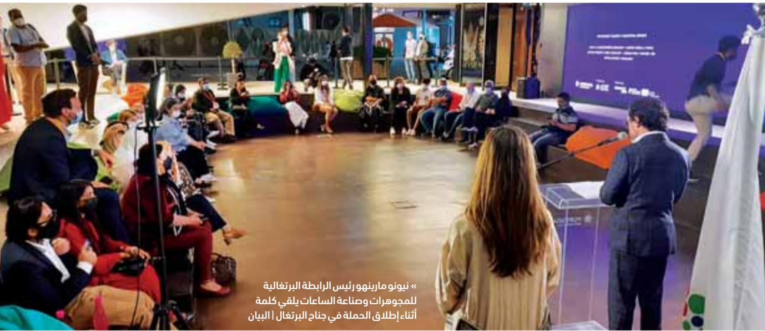
« نيونو مارينهو رئيس الرابطة البرتغالية للمجوهرات وصناعة الساعات يلقي كلمة أثناء إطلاق الحملة في جناح البرتغال | البيان