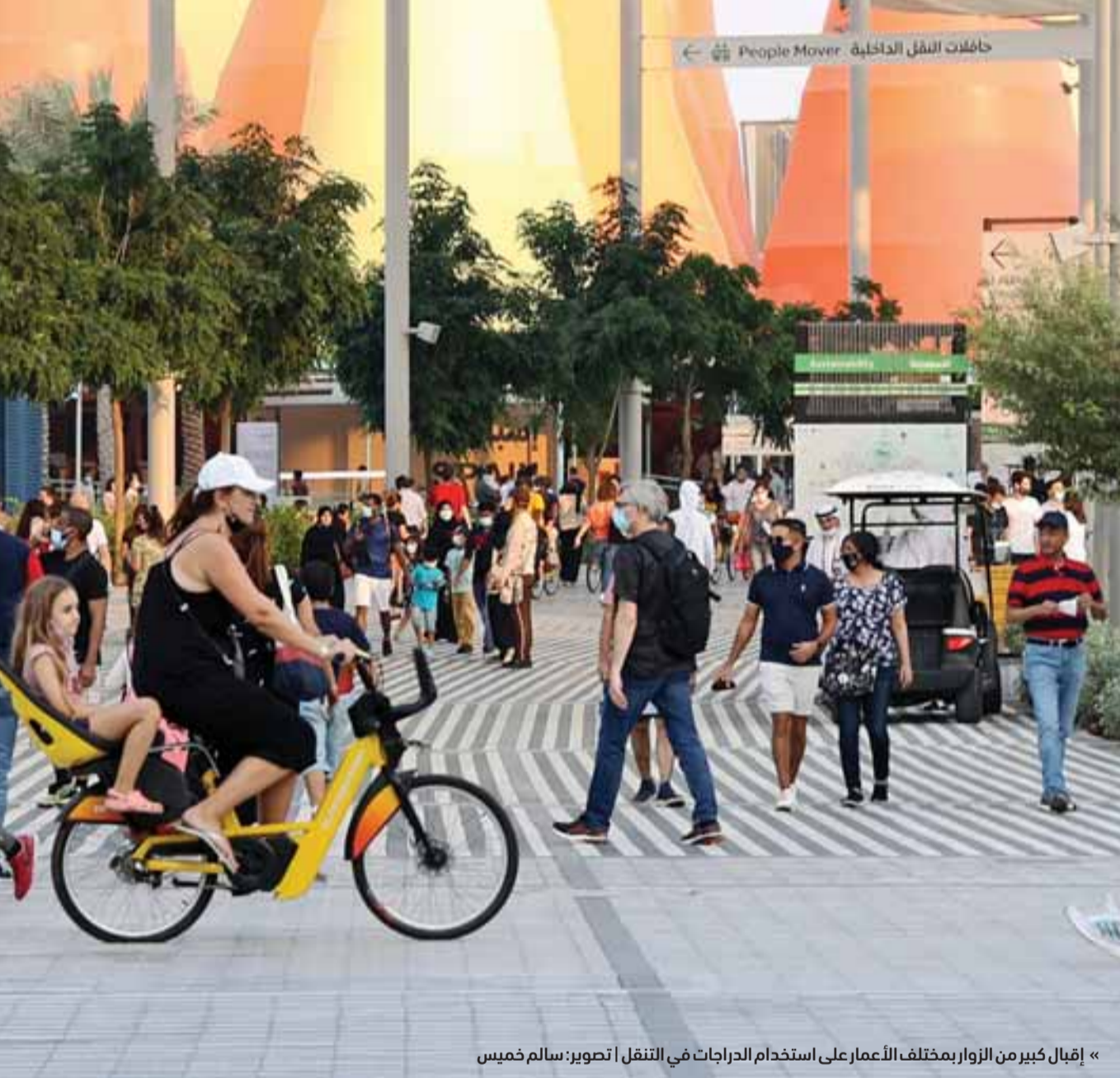
« إقبال كبير من الزوار بمختلف الأعمار على استخدام الدراجات في التنقل