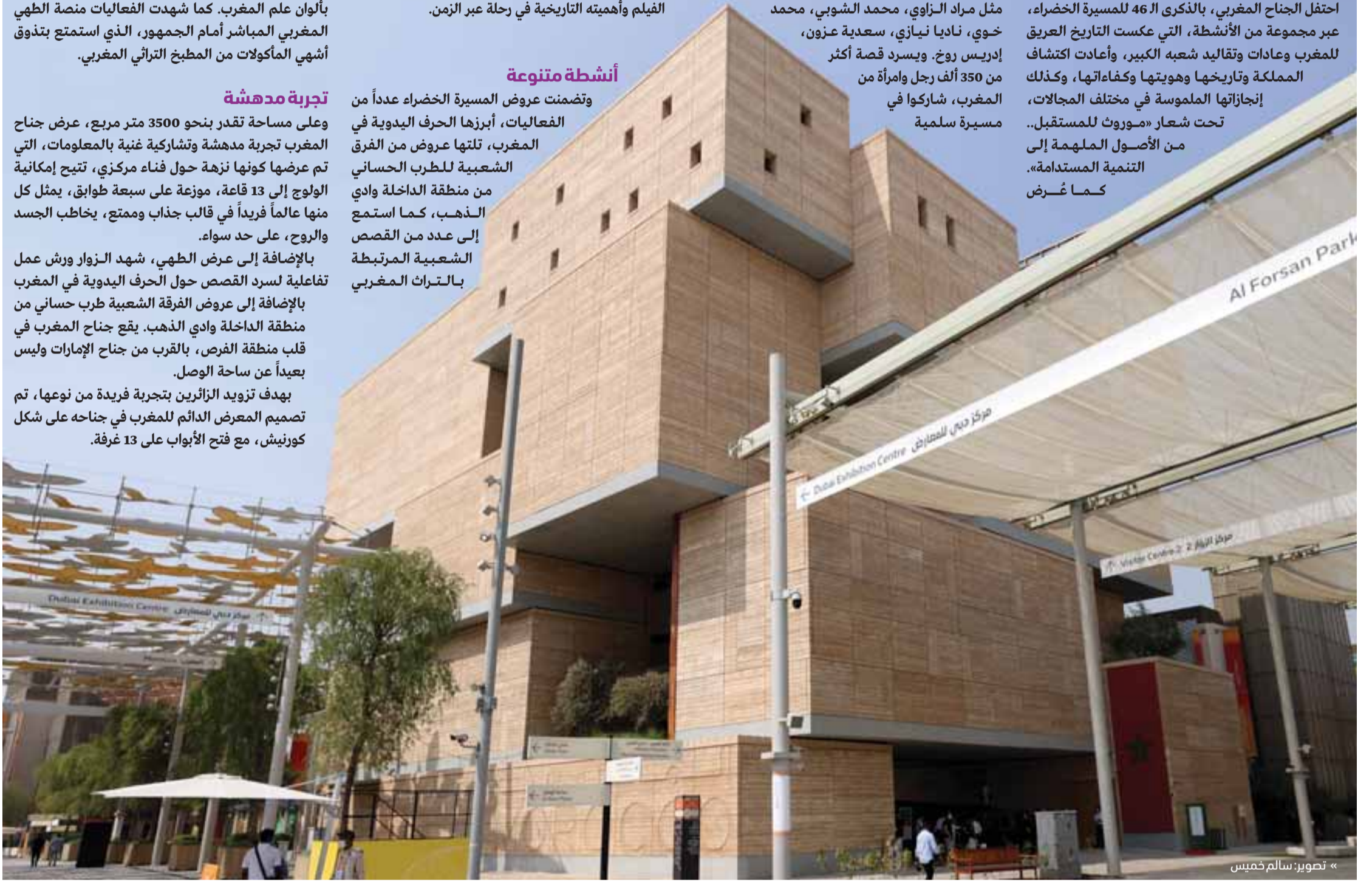
« تصوير: سالم خميس

بهدف تزويد الزائرين بتجربة فريدة من نوعها، تم تصميم المعرض الدائم للمغرب في جناحه على شكل كورنيش، مع فتح الأبواب على 13 غرفة.