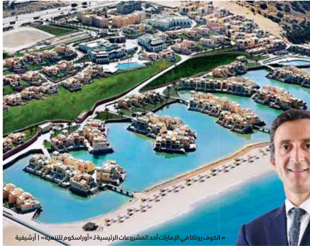
«الكوف روتانا في الإمارات أحد المشروعات الرئيسية لـ «أوراسكوم للتنمية» | أرسيفية

وأضاف إن المشاركة في مثل هذه الفعاليات الدولية تسهم في تنشيط التصدير العقاري في مختلف الدول فعلى سبيل المثال أكثر من 60% من مبيعات مكادي هايتس في 2021 من خارج مصر، وكذلك عدد كبير من عملاء الجونة. وأكد الحمامصي أن «أوراسكوم للتنمية» تضع الدول العربية على قمة أولوياتها، إذ تمتلك مشروع الكوف روتانا في الإمارات والذي تم الانتهاء منه وتسليمه على مساحة 300,000 متر مربع.