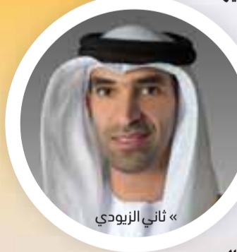
« ثاني الزيودي »

ثاني الزيودي: نحرص على تطوير خارطة طريق لدفع جهود التعاون وتنويع الاستثمارات ومرونة سلاسل التوريد