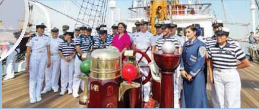
«طاقم السفينة المكسيكية لحظة الوصول إلى دبي