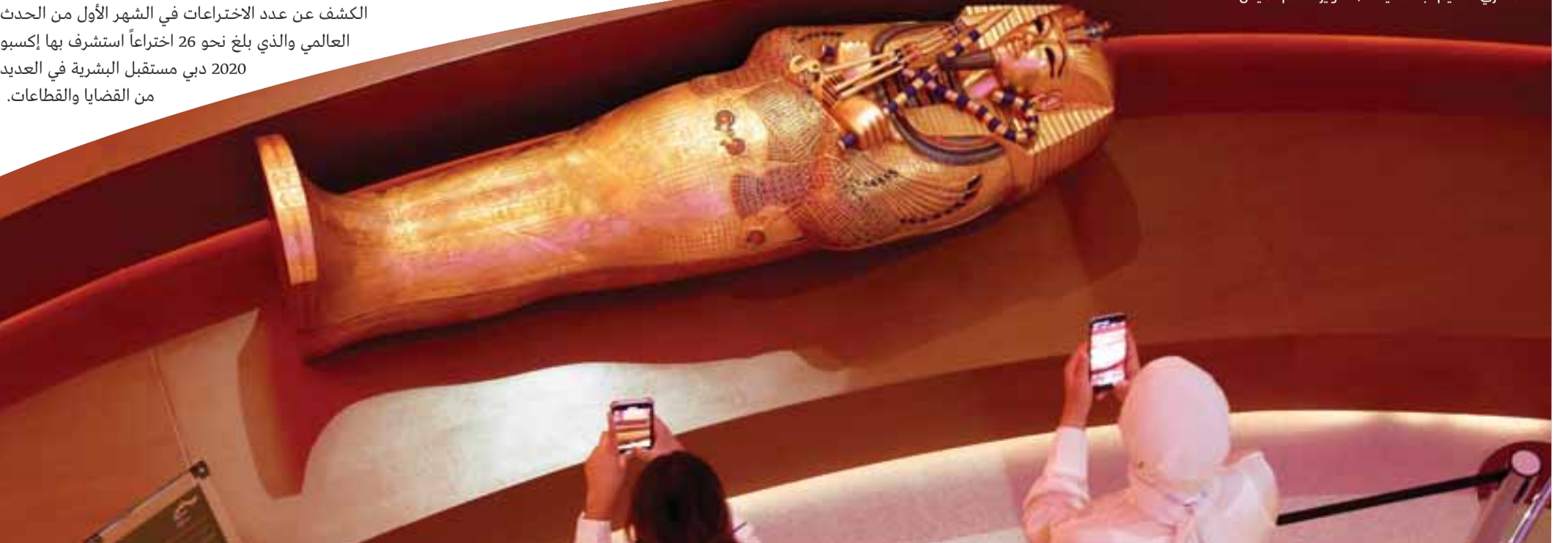
« الجناح المصري يعرض تابوتاً فرعونياً حقيقياً يعود للكاهن المصري القديم «بسماتيك»