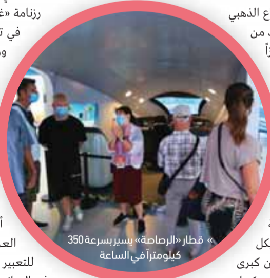
« قطار «الرصاصة» يسير بسرعة 350 كيلومتراً في الساعة

ويعرض الجناح الإيطالي نسخة ثلاثية الأبعاد لمنحوتة «ديفيد» لـ«مايكل أنجلو» أنتجت باستخدام واحدة من كبرى الطابعات ثلاثية الأبعاد في العالم، كما يتسنى للزوار مشاهدة عرض حي مباشر لصنع جسر «إنكا» القديم في جناح بيرو، وصفحات رقمية