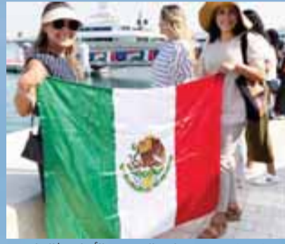
«مكسيكيون يستقبلون السفينة بالأعلام | البيان