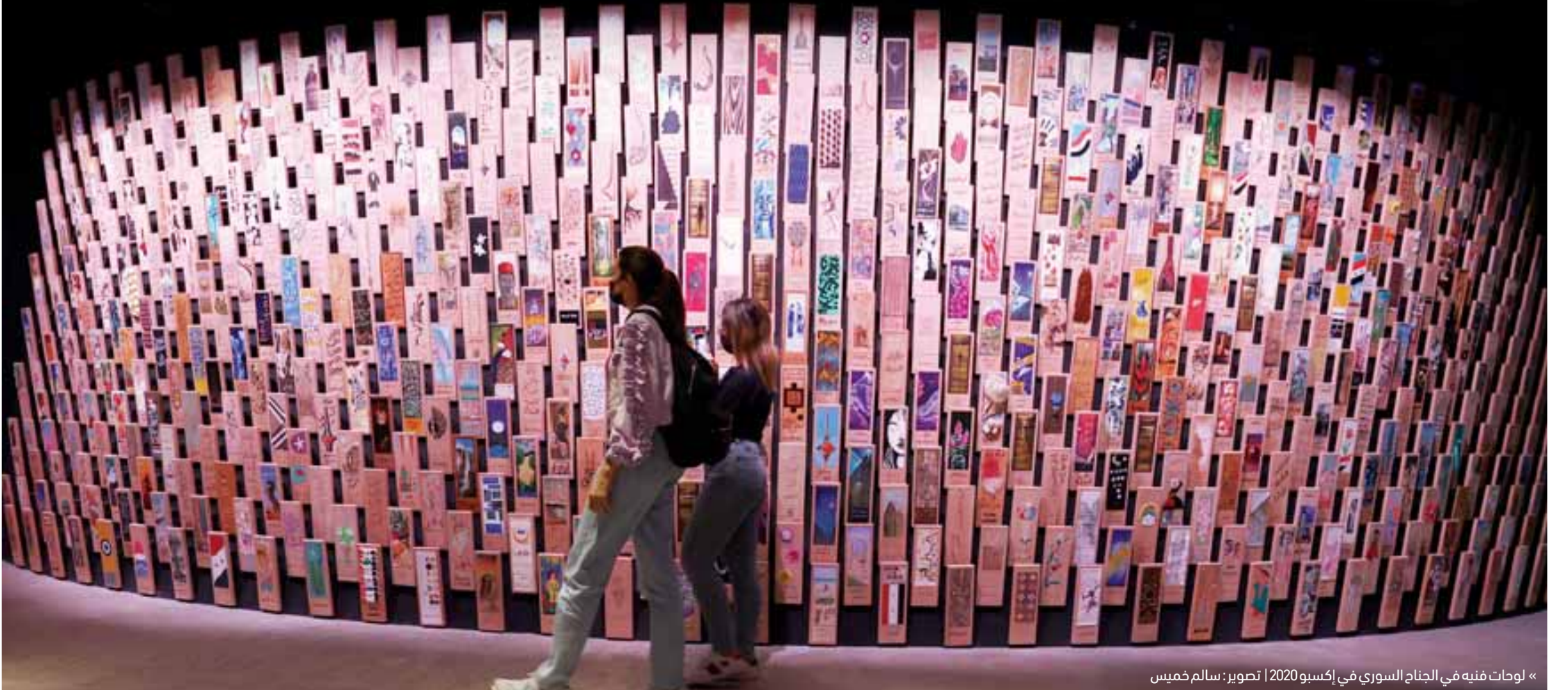
« لوحات فيه في الجناح السوري في إكسبو 2020