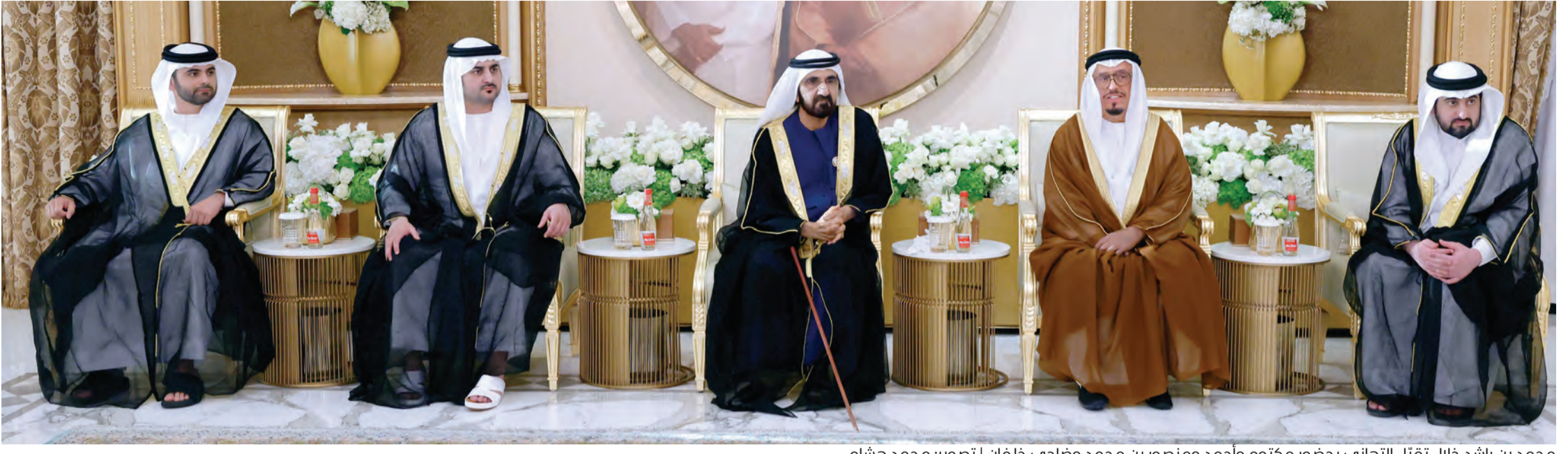
محمد بن راشد خلال تقبّل التهاني بحضور مكتوم وأحمد ومنصور بن محمد وضاحي خلفان