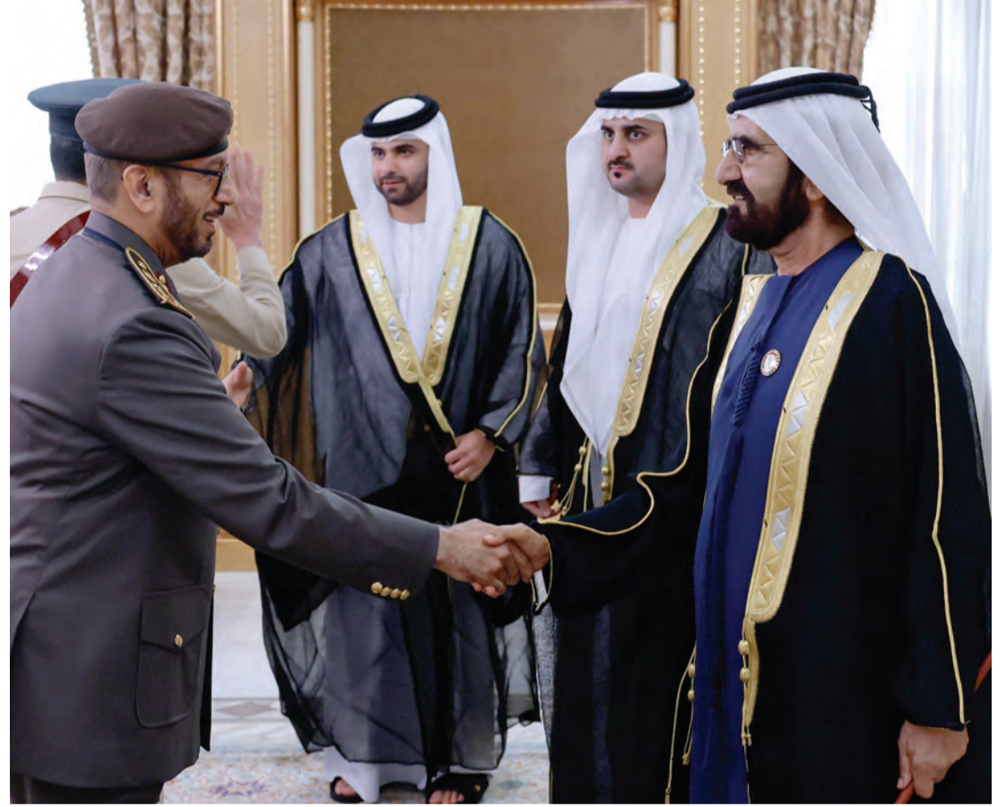
محمد بن راشد يتقبّل تهاني محمد المري