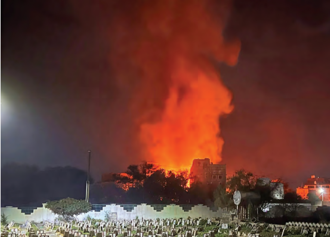
نيران تتصاعد من أحد المواقع فيب صنعاء بعد غارة أمريكية فيب 19 مارس | أرشيفية

وقال خامنئي في خطبة عيد الفطر: «إذا قام الأعداء بالاعتداء على إيران، سبتلقون ضربة شديدة وقوية، وإذا فكروا بالقيام بفتنة في الداخل سيرد عليهم الشعب الإيراني كما رد في الماضي»، وفق ما نقلت عنه وكالة الأنباء الرسمية (إرنا).