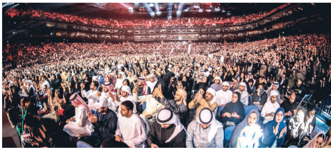
فعاليات ترفيهية توفر لسكان دبي وزوارها قضاء أوقات ممتعة خلال عطلة العيد