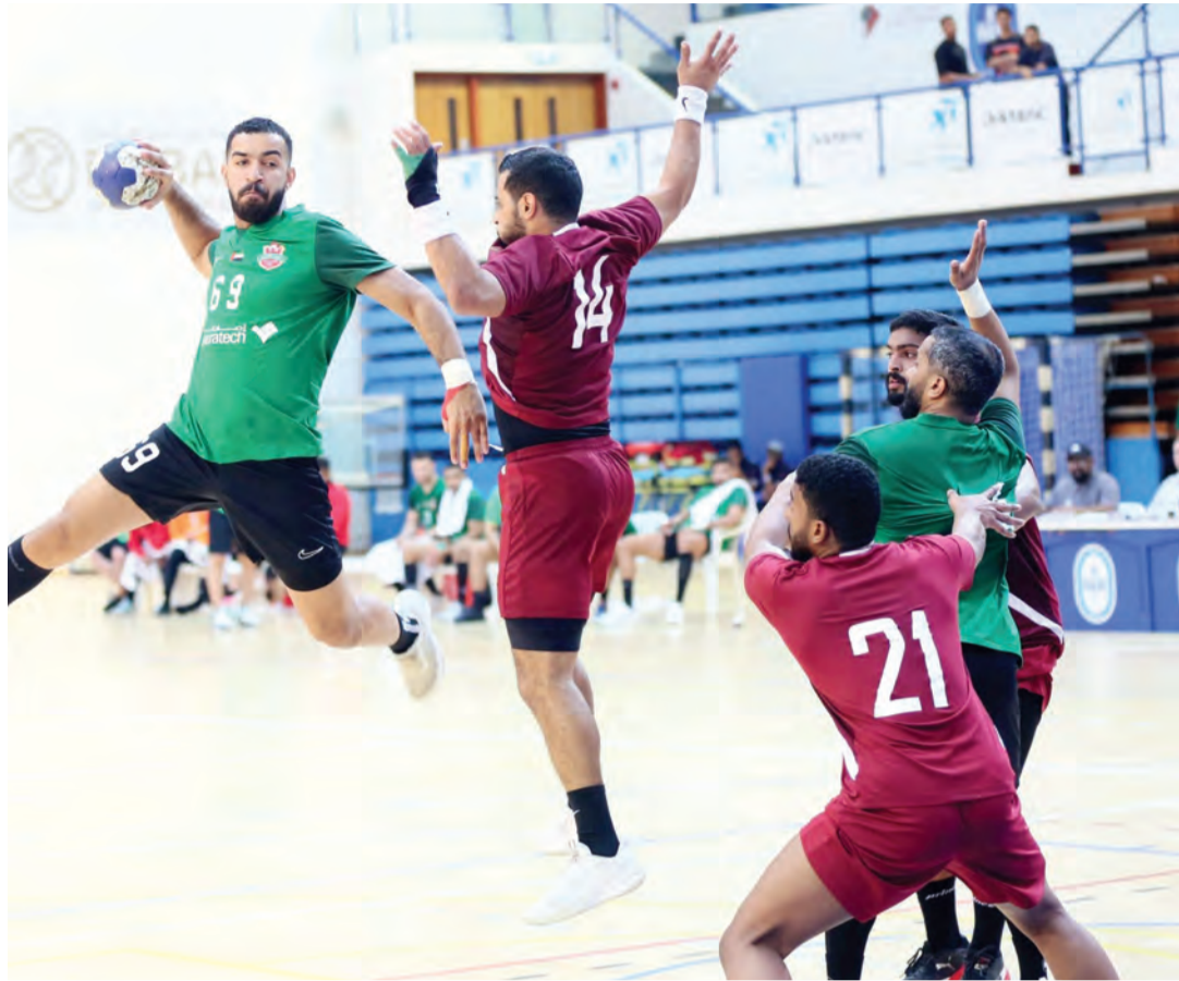
من لقاء شباب الأهلي والوحدة في دوري كرة اليد

المجالات الرياضية. ولفت إلى الجهود الكبيرة التي بذلت من اللجنة الأولمبية الوطنية في دعم هذه الخطوة، والحرص على تنفيذها، ودفع برامج الاتحادات الرياضية، والخطط التي تستهدف التطور، والارتقاء بأداء الاتحادات الرياضية.