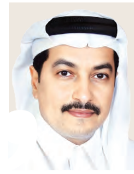
عمر عبيد غباش