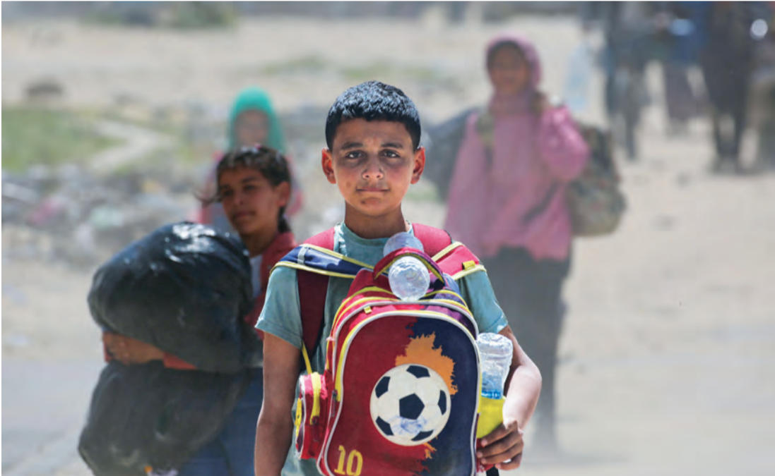
نازحون وصلوا من رفح إلى خان يونس عقب عمليات التهجير الجديدة

وفي خان يونس جنوب القطاع، استهدفت غارة إسرائيلية خيمة للنازحين قرب الكلية التطبيقية في منطقة المواصي، ما أدى إلى مقتل سيدتين وإصابة آخرين، بحسب مصادر طبية محلية. ووفق وزارة الصحة في غزة، فقد قتل القصف الإسرائيلي 80 فلسطينياً في القطاع خلال 48 ساعة الماضية، فيما أصيب 305 آخرون، بينهم 53 قتيلاً و189 مصاباً في أول أيام عيد الفطر. وأشار البيان إلى أنه منذ استئناف العمليات العسكرية الإسرائيلية في 18 مارس الجاري، ارتفع عدد القتلى إلى 1.001 والإصابات