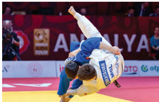
من منافسات منتخب الجودو | وام

عندما تنطلق جولة ذهاب دور الثمانية من دوري أبطال أفريقيا لكرة القدم، يتطلع الأهلي، حامل اللقب، إلى تحقيق فوز مريح أمام ضيفه الهلال السوداني، في مباراتهما اليوم، كي يسهل مهمته في مباراة الإياب، من أجل انتزاع بطاقة التأهل للدور قبل النهائي. ويلتقي الأهلي مع الهلال في استاد القاهرة الدولي، على أن تقام مباراة الإياب بينهما الثلاثاء المقبل في موريتانيا. وكان السويسري مارسيل كولر