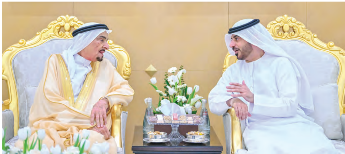
حاكم عجمان خلال تقبل التهاني