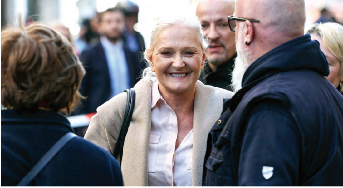
لوبان مبتسمة بعد مغادرتها المحكمة في باريس

فرنسا: «يجب أن يتخذ الشعب قرار عزل المسؤول المُنتخب. لهذا السبب تحديداً، يجب إجراء استفتاء حول العزل (السياسيين المُنتخبين) في الجمهورية السادسة الديمقراطية».