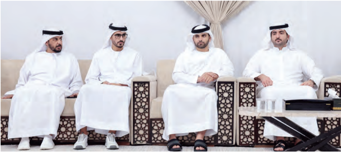
منصور بن محمد خلال تقديم واجب العزاء بحضور محمد بن مكتوم وخالد وجمعة خليفة النابودة

في وفاة عوشه بنت مكتوم حرم خليفة جمعة النابودة، ووالدة خالد خليفة النابودة، وذلك خلال زيارة سموه لمجلس العزاء في دبي. وأعرب سموه عن خالص تعازيه وصادق مواساته لأسرة وذوي الفقيدة، سائلاً المولى عزّ وجلّ، أن يتغمّدها بواسع