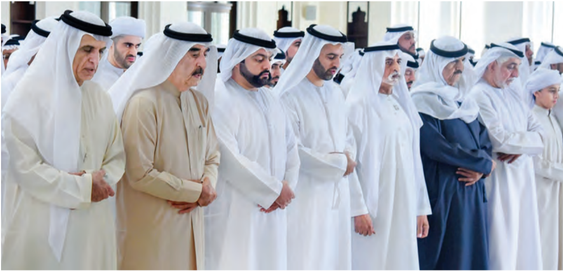
سعود المعلا وسعود بن صقر ومحمد بن حمد ومحمد بن سعود ونهيان بن مبارك وحميد المعلا خلال صلاة الجنائز

حاكما أم القيوين ورأس الخيمة يؤديان صلاة الجنائز على جثمان الفقيدة