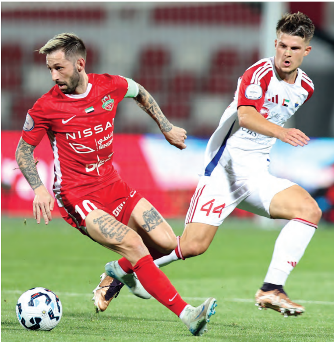
جانب من لقاء شباب الأهلي والشارقة