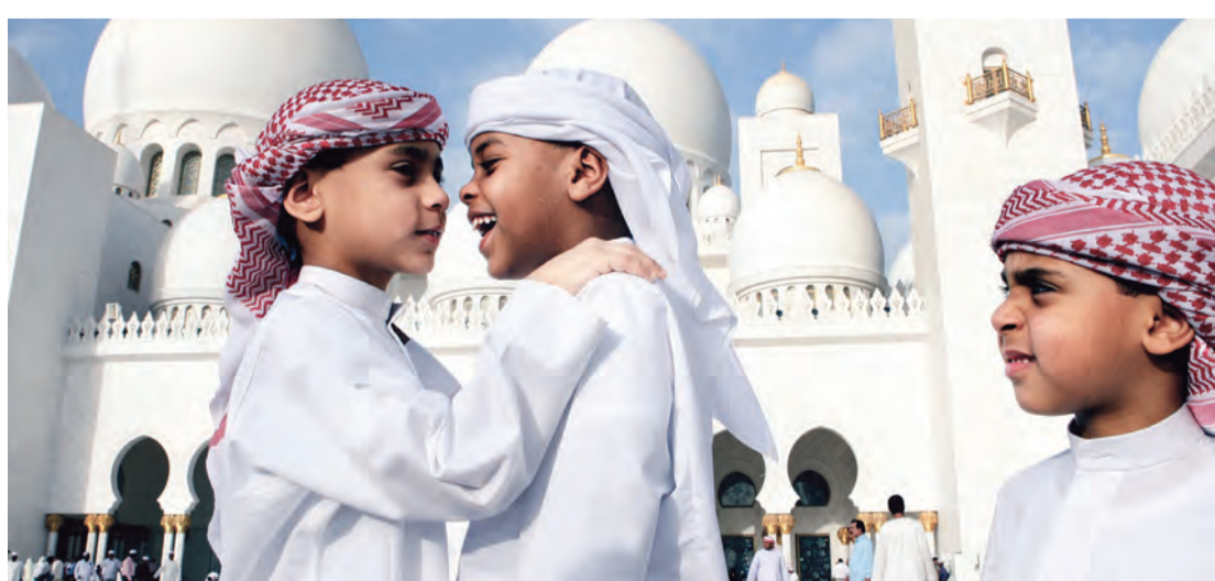
طقوس العيد متوارثة في الإمارات أريضية