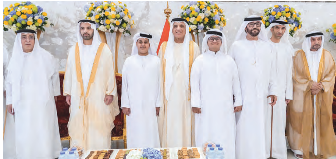
حاكم رأس الخيمة ومحمد بن سعود خلال تقبل التهاني بحضور نائب الزبيدي