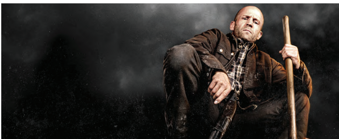
مشهد من فيلم «رجل عامل»

وجاء في المرتبة الخامسة فيلم الرعب الكوميدي «ديت أوف أهي يونيكورن» من بطولة بول رود وجينا أورتيجا في دور أب وابنته يقتلان وحيد قرن صغيراً عن طريق الخطأ. وحقق هذا العمل 5,8 ملايين دولار.