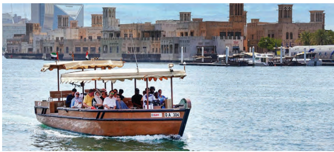
اهتمام متواصل بتطوير خدمات النقل البحري | من المصدر