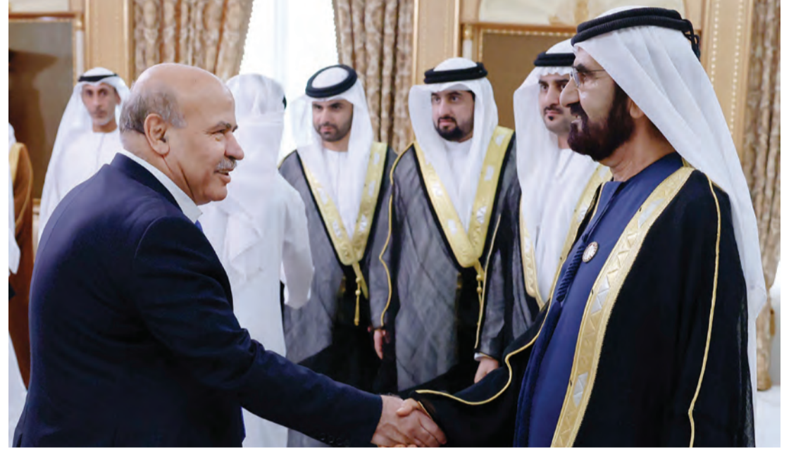
محمد بن راشد يتقبل تهاني مرويس عزيري