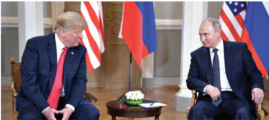
ترامب وبوتين خلال اجتماع القمة الروسية الأمريكية في 2018 | أرشيفية

ضعيفة»، معتبراً أن على العسكريين الفرنسيين التحضير وأن يكونوا على استعداد للأسوأ. وحسب الصحيفة، يدرس مسؤولون أوروبيون مختلف السيناريوهات للمواجهة المحتملة، حيث يعتبرون أن حرباً واسعة النطاق غير مرجحة، ولكنهم يدرسون احتمال «اجتياح محدود» لدولة أوروبية أو عملية عسكرية في منطقة أخرى أو «حرب هجينة» لتقويض الوحدة الأوروبية. وتشير الترحيحات -حسب الصحيفة- إلى أن أي شيء من هذا القبيل قد يحدث بعد 4 أو 5 سنوات، لكن أحد الدبلوماسيين الفرنسيين قال: «إذا استمعنا إلى قادة دول البلطيق، فإن ذلك قد يحدث على نحو أسرع». كما تنقل «لوفينغارو» عن مصدر استخباراتي أوروبي قوله إن «أي حل وسط (في أوكرانيا) سيكون مؤقتاً، وسيكون فترة استراحة (لروسيا) حتى تستعيد قدراتها». وتركز دول الناتو اهتمامها على دول البلطيق بمثابة الأهداف المحتملة لروسيا، وخصوصاً مدينة نارفال الإستونية على الحدود مع روسيا و«ممر سوفالكي» في ليتوانيا وبولندا، الفاصل بين بيلاروس ومقاطعة كالينينغراد الروسية.