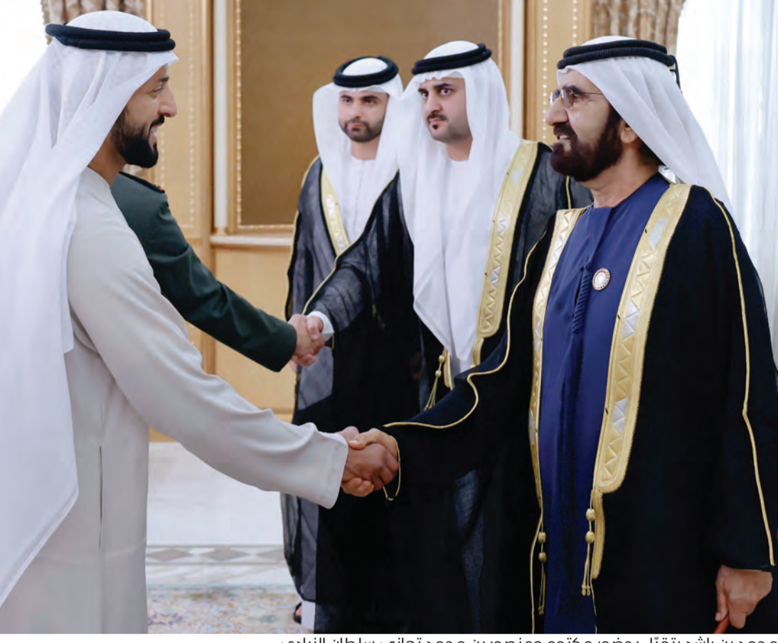
محمد بن راشد يتقبل بحضور مكتوم ومنصور بن محمد تهاني سلطان النيادي