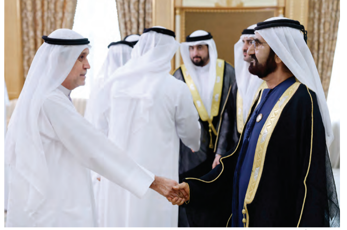
محمد بن راشد خلال تقبل التهاني