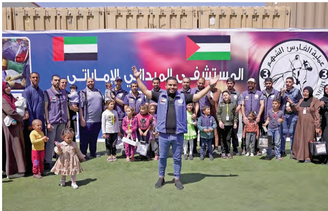
المرضى وذوهم خلال تلقي الهدايا

قدّم سمو الشيخ ذياب بن محمد بن زايد آل نهيان، نائب رئيس ديوان الرئاسة للشؤون التنموية وأسر الشهداء، واجب العزاء في وفاة المغفور لها صباحا حمدان علي الكتبي. وأعرب سموه، خلال زيارته مجلس العزاء في مجلس الفوعة بمنطقة العين، عن صادق تعازيه ومواساته لأسرة الفقيدة، داعياً الله عزّ وجلّ أن يتغمّدها بواسع رحمته، ويُسكنها فسيح جنته، ويلهم أهلها وذويها الصبر والسلوان.