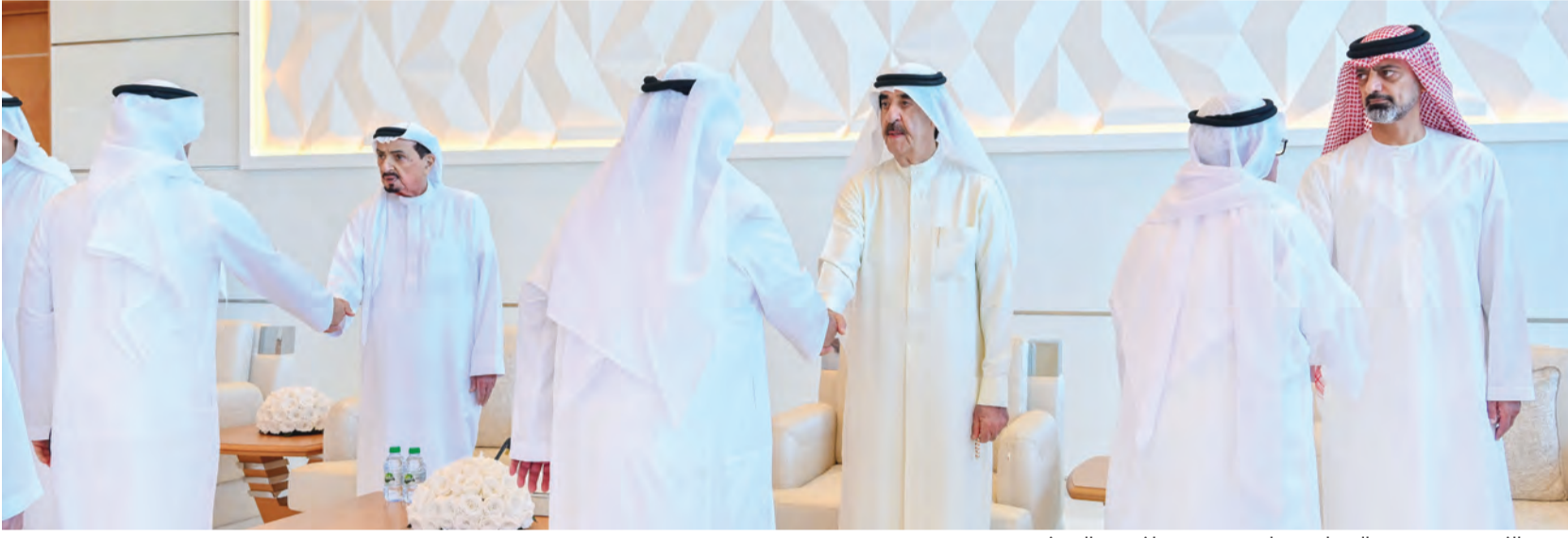
حميد النعيمي وسعود المعلا وعمار بن حميد يصافحون المعزين

حاكما أم القيوين ورأس الخيمة يؤديان صلاة الجنائز على جثمان الفقيدة