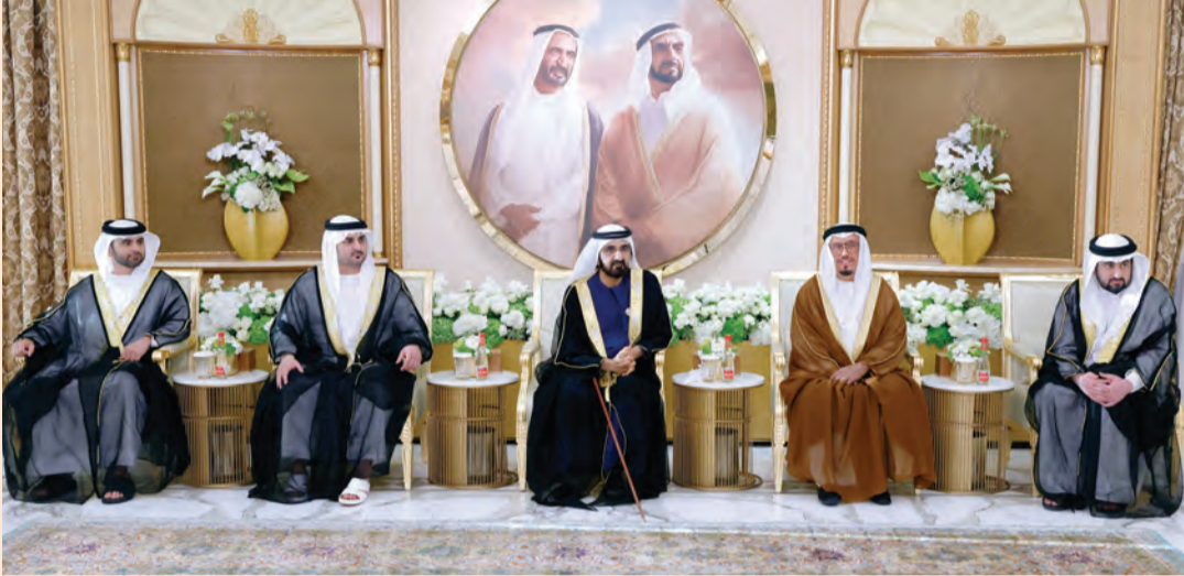
محمد بن راشد مستقبلاً المهنيين بحضور مكتوم وأحمد ومنصور بن محمد وضاحي خلفان

الاتحادي وأعيان البلاد وكبار المسؤولين، الذين هنأوا سموه بهذه المناسبة، سائلين المولى عزّ وجلّ أن يديم على سموه موفور الصحة والعافية، وعلى دولة الإمارات وشعبها الكريم زعم الأمن والأمان والرفعة والرفق. كما تقبل صاحب السمو الشيخ محمد بن راشد آل مكتوم التهاني بالعيد من قيادات وكبار ضباط الشرطة والأمن العام في دبي، وكبار العسكريين السابقين. كذلك تقبل سموه التهاني والتبريكات من رجال الأعمال والتجار الذين تمّنوا لسموه دوام الصحة والعافية، ولشعب الإمارات مزيداً من التقدم والازدهار في ظل القيادة الرشيدة. (دبي - البيان)