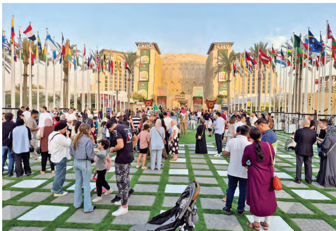
فعاليات رمضانية شهدها الحي لاقت استحساناً كبيراً

ونجح المنظمون في تحقيق أهداف الحدث من خلال التجربة الجديدة في تنظيم وجبتي الإفطار والسحور لأول مرة في ساحة الوصل، والتي لاقت إقبالاً متميزاً واستحساناً كبيراً من جميع الزوار، وشهدت تغطية إعلامية مكثفة وحضوراً لعدد من أشهر المؤثرين على منصات التواصل الاجتماعي، خصوصاً وأنها تحت قبة الوصل الأيقونية، أكبر قبة تفاعلية غامرة في العالم، إضافة إلى العروض الفنية والمسرحية الحية على مسرح ساحة الوصل، والمستوحاة من شهر رمضان الكريم، مثل العرض المسرحي راشد ولطيفة في مهمة البحث عن القمر، والعروض الضوئية لقصص الأنبياء على القبة، وعروض الموسيقى العربية الكلاسيكية على مسرح ساحة الوصل وغيرها الكثير.