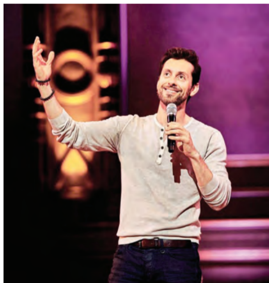
ماكس أميني يقدم عرضاً كوميدياً في «دبي أوبرا» غدًا