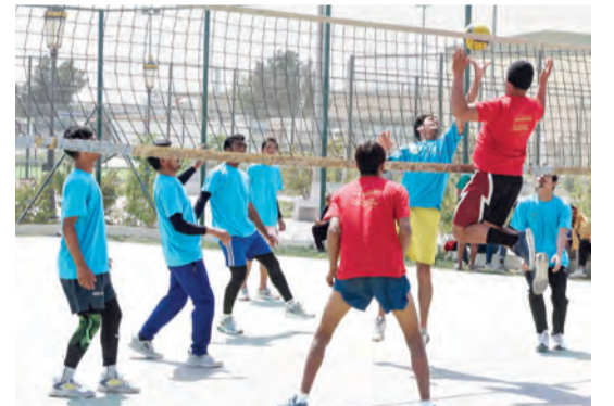
مسابقات ترفيهية في 10 مواقع للعمال

تستهدف المساس بأمن الدولة واستقرارها. وأضاف النائب العام أن دولة الإمارات العربية المتحدة تعتبر نموذجاً عالمياً في التعايش والتسامح، وتحمي قوانينها جميع من يعيشون على أرضها من مختلف الديانات والأعراق، وتضمن أمنهم واستقرارهم.