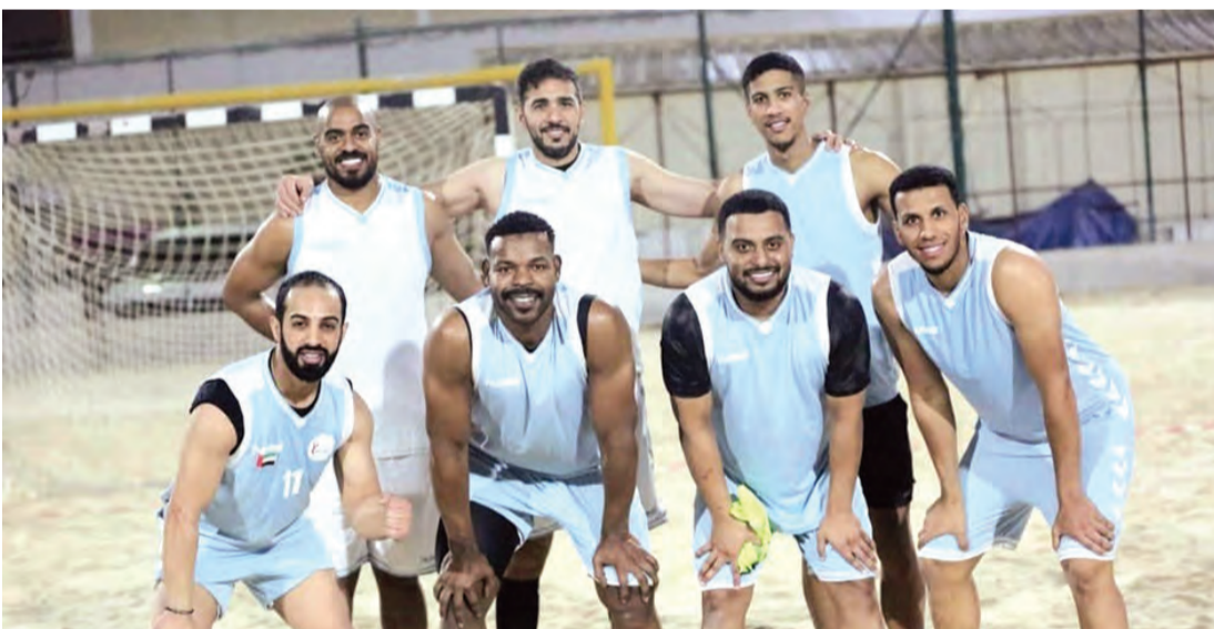
لاعبو منتخب الإمارات خلال المعسكر

بمدينة بتايا التايلندية من 8 إلى 14 مايو 2017، وحصل منتخبنا على المركز السابع، ومن ثم البطولة الآسيوية الدولية الأولى بدبي من 23 لغاية 25 فبراير 2017 على شاطئ كيتي بيتش بالجميرا وحصل منتخبنا على المركز الرابع، وهذا المنتخب الجديد والذي يضم عدداً من اللاعبين أصحاب الخبرات والعناصر الشابة يعود لتمثيل الدولة في المحفل الجديد 2025 بسلطنة عمان الشقيقة.