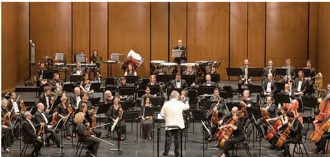
مهرجان «إن كلاسيكا الدولي للموسيقى» يقام في «دبي أوبرا» 6 و 7 أبريل

وتقدم احتفالات «العيد في دبي» مجموعة رائعة ومتنوعة من الفعاليات الترفيهية والثقافية والموسيقية التي تسعد الجميع في مختلف أنحاء المدينة.