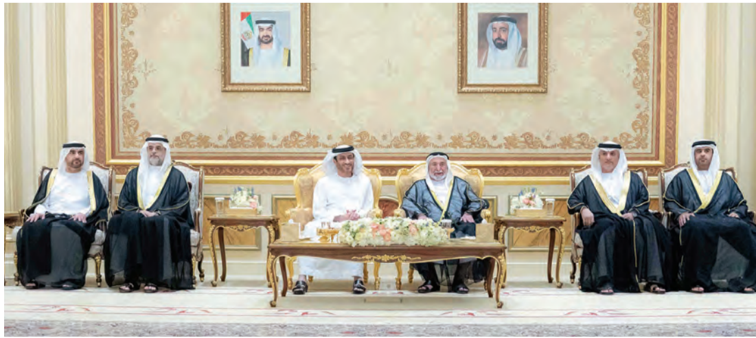
حاكم الشارقة يتقبل بحضور سلطان بن محمد بن سلطان وعبدالله بن سالم تهاني حمد الشامسي | وام