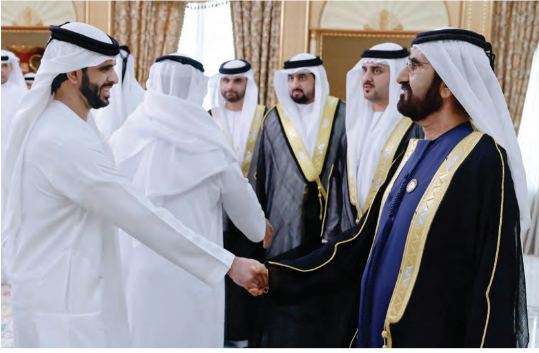
سموه خلال تقبل تهاني محمد بن راشد بن خليفة