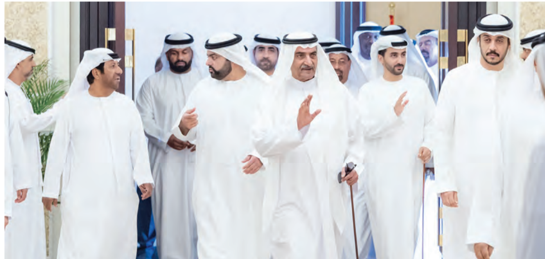
حاكم الفجيرة ومحمد بن حمد خلال تقبل التهاني