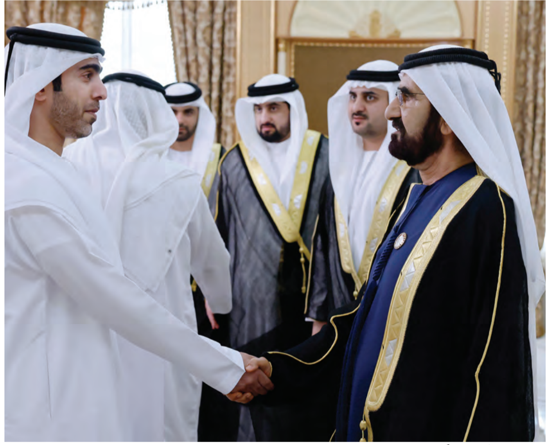
محمد بن راشد متقبلاً التهاني بالعيد