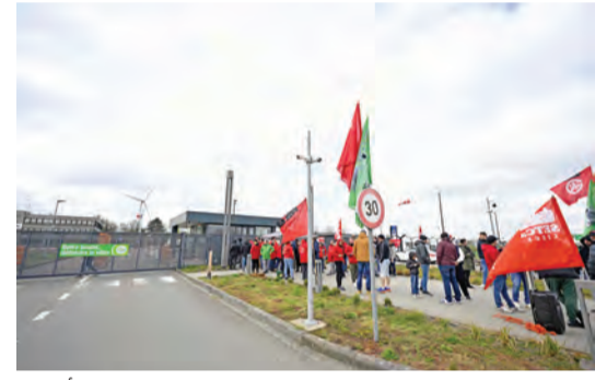
نقابيون يشاركون في الإضراب بمنطقة هيرستال الصناعية