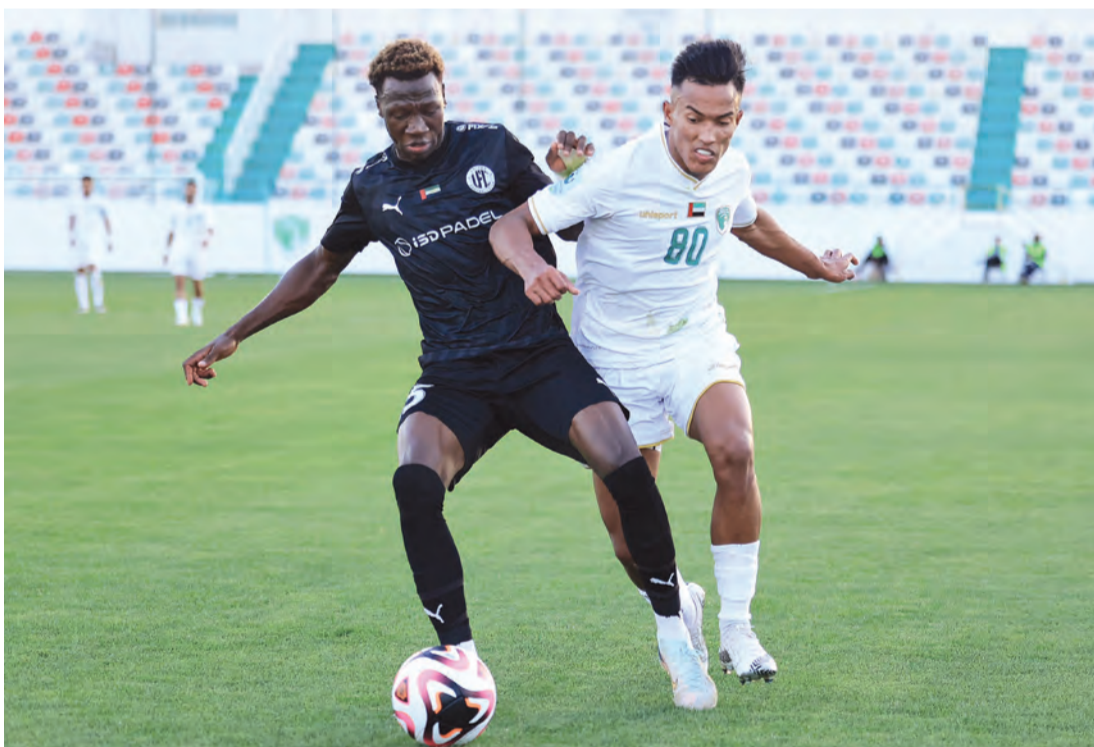
جانب من لقاء فريق الإمارات ويونتايد الجولة الماضية | البيان