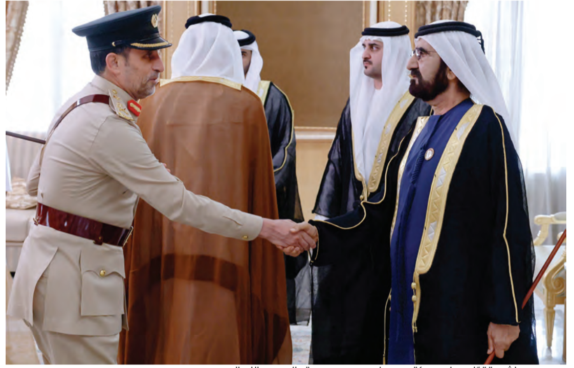
محمد بن راشد يتقبّل بحضور مكتوم ومنصور بن محمد تهاني عبدالله المري

التهاني بالعيد من قيادات وكبار ضباط الشرطة والأمن العام في دبي، وكبار العسكريين السابقين. كذلك تقبّل سموه التهاني والتبريكات من رجال الأعمال والتجار الذين تمتموا لسموه دوام الصحة والعافية، ولشعب الإمارات مزيداً من التقدم والازدهار في ظل القيادة الرشيدة.