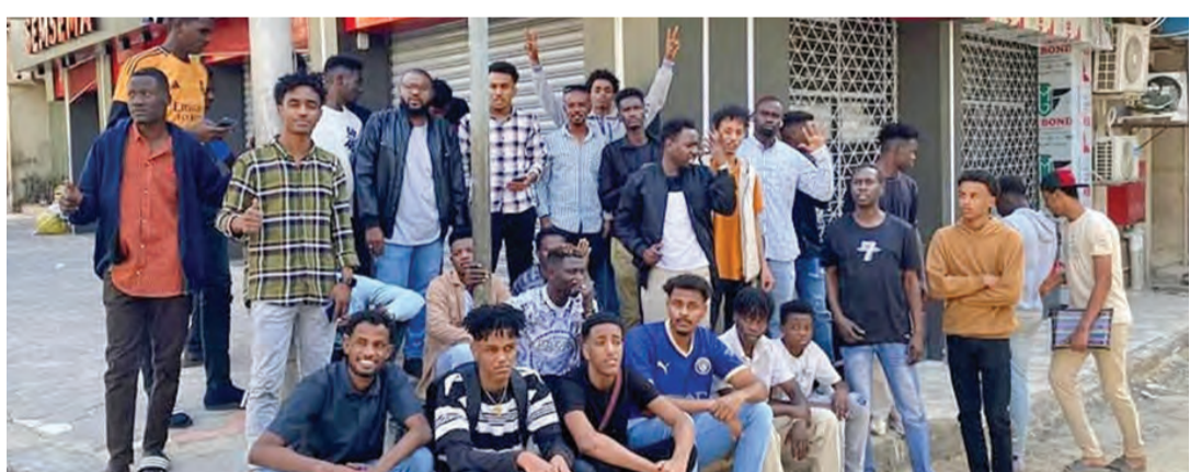
جماهير الهلال تنتظر أمام السفارة السودانية في القاهرة | البيان