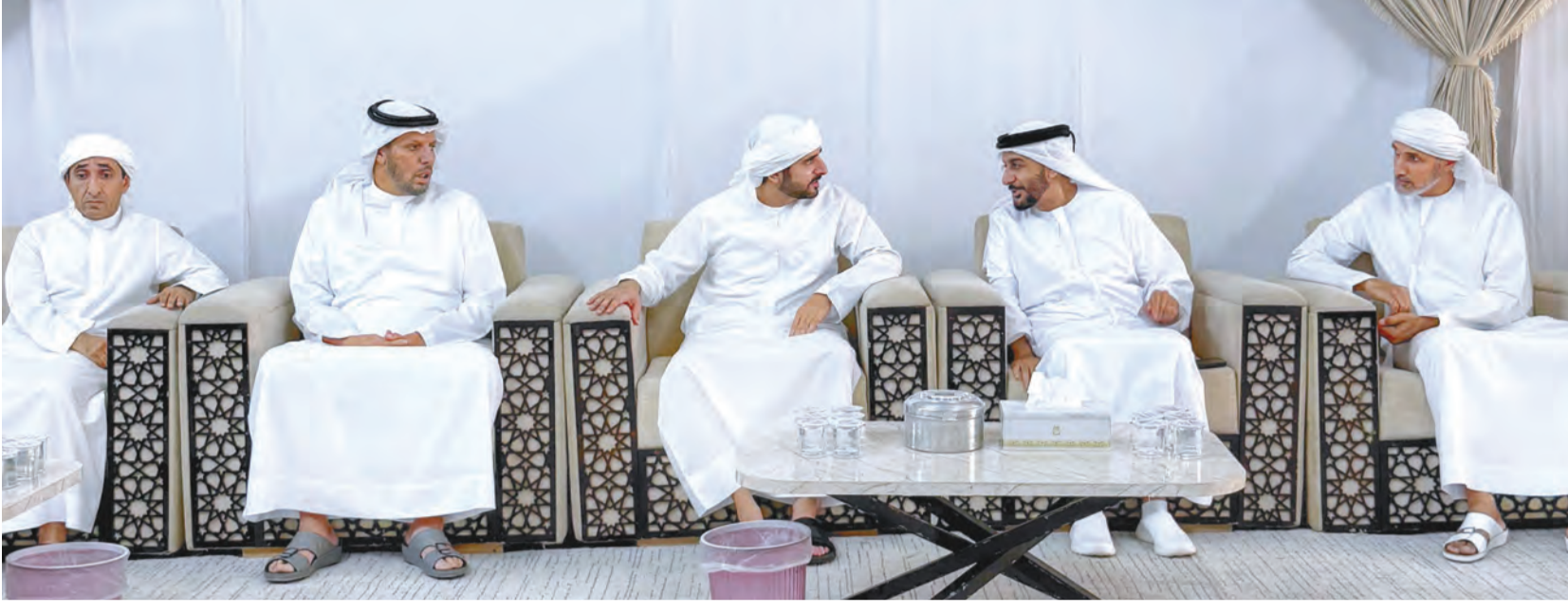
حمدان بن محمد خلال تقديم واجب العزاء بحضور سعيد بن مكتوم وخالد بن مجرن وخالد خليفة النابودة

كما قدم سمو الشيخ أحمد بن محمد بن راشد آل مكتوم، النائب الثاني لحاكم دبي، أمس، برفاقه سمو الشيخ حشر بن مكتوم بن جمعة آل مكتوم، رئيس مؤسسة دبي للإعلام، واجب العزاء