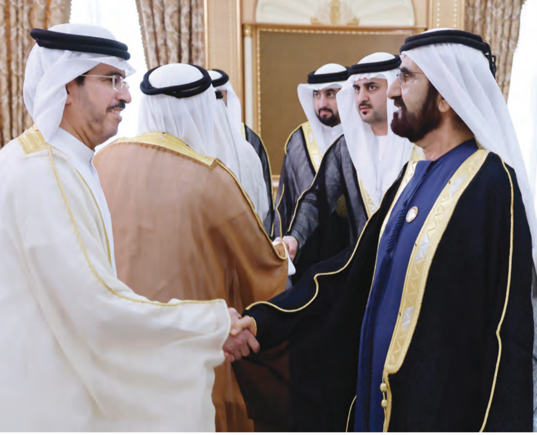
محمد بن راشد يتقبل بحضور مكتوم وأحمد بن محمد تهاني سعيد الطاير