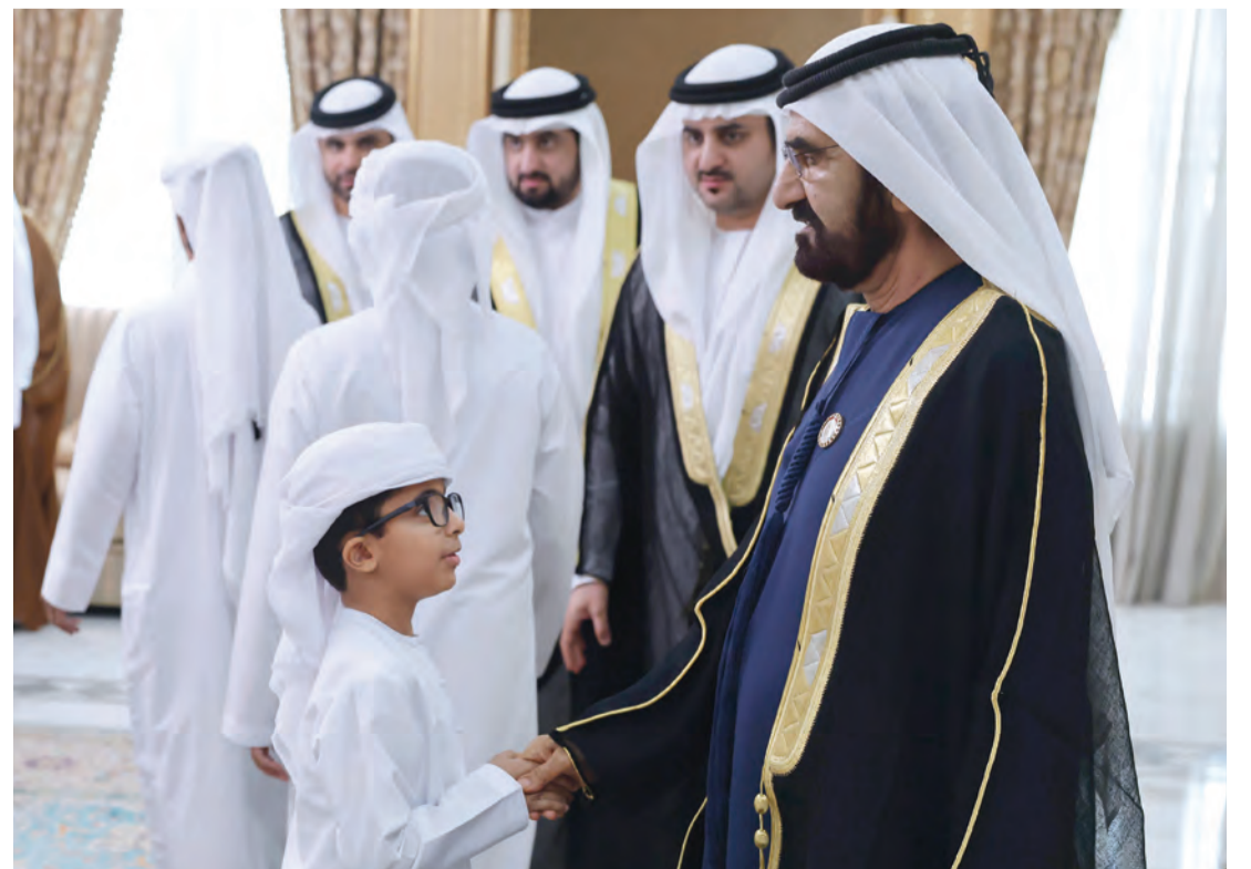
محمد بن راشد يتقبل تهاني أطفال العيد