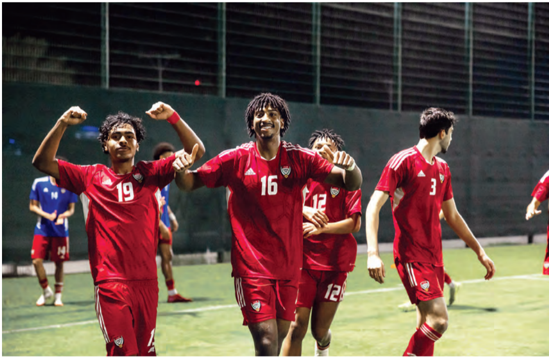
«مستقبل الكرة الإماراتية» وفرحة الفوز | البيان

وقضى منتخبنا الوطني، أيام عيد الفطر المبارك في مدينة الطائف السعودية، والتي وصلتها بعثة «أبيض الناشئين» الخميس الماضي، للمشاركة في النهائيات الآسيوية للمرة الثامنة في تاريخه، والتي تأهل إليها بتصدره لتصفيات المجموعة الثامنة، وبعدها تخلى عن «أبيض الناشئين» التوفيق في الوصول إلى نهائيات 2023، وذلك سعياً لتحقيق اللقب بعدما كان أفضل إنجاز لمنتخبنا وصافة نسخة 1990، والوصول إلى قبل نهائي نسخة 2008، والوصول إلى نهائيات مونديال الناشئين للمرة الرابعة طوال تاريخه.