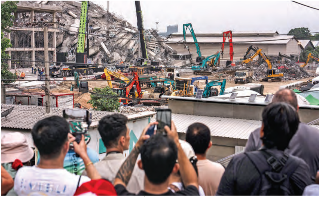
شبان يتابعون عمليات إزالة الأنقاض من موقع منهار في بانكوك

الزلزال تجاوزت 2000 شخص، وقال رجال إنقاذ ومجموعة من نشطاء إن عدة مئات من المسلمين الذين كانوا يصلون في المساجد خلال شهر رمضان المبارك لقوا حتفهم وكذلك 270 راهباً بوذاً قضاوا تحت حطام معبد منهار. وحذرت منظمات الإغاثة والأمم المتحدة من أن الزلزال قد يؤدي إلى تفاقم آثار تفشي الجوع والأمراض في بلد وصف بالفعل بأنه أحد أكثر الأماكن خطورة في العالم فيما يتعلق بعمل المنظمات الإنسانية بسبب الحرب الأهلية.