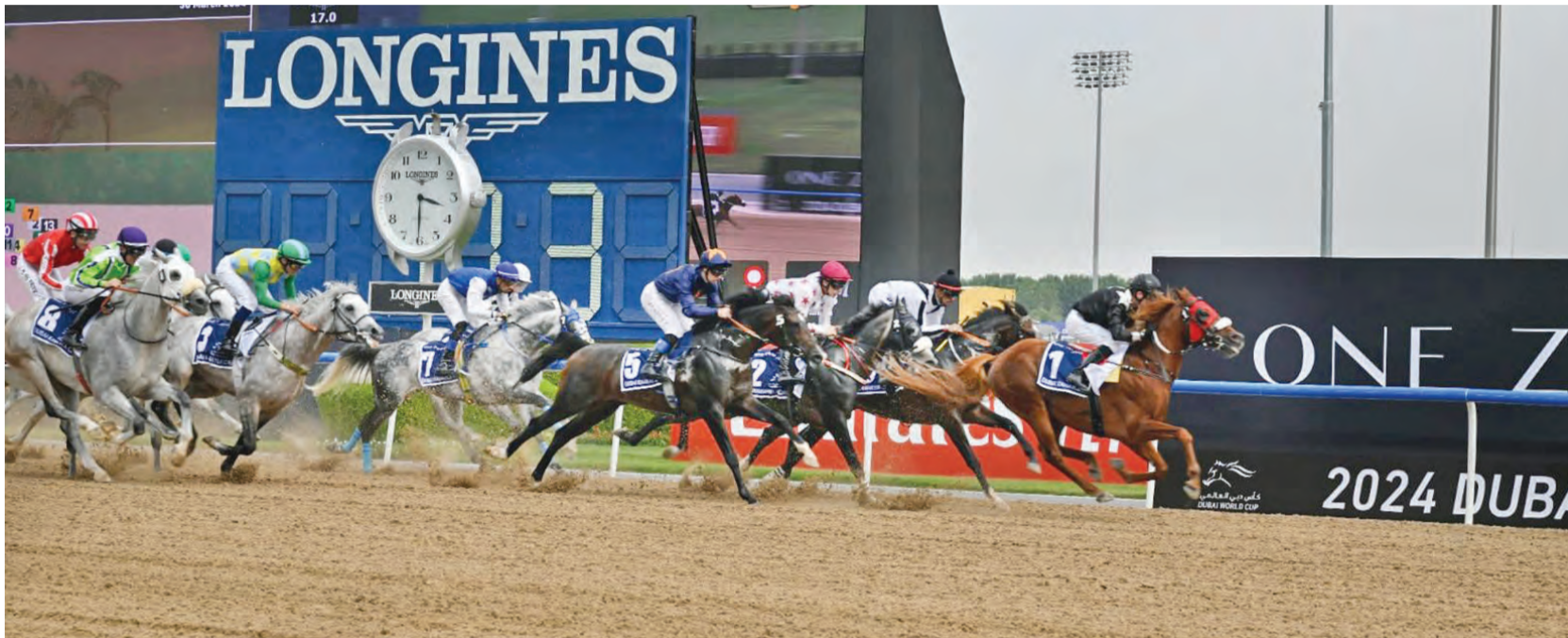
دبي - علي الظاهري

تشهد النسخة 29 من كأس دبي العالمي مشاركة 4 أبطال، يتطلعون إلى الدفاع عن ألقابهم في الأمسية العالمية التي تقام السبت المقبل على مضمار ميدان العالمي، بمشاركة 13 دولة، وهم: «تلال الخالدية» في سباق «دبي كحيلة كلاسيك» للخيل العربية الأصيلة، و«توز» في شوط «دبي جولدن شاهين» و«فاكتور شيفال» في سباق «دبي تيرف» و«ريبلز رومانس» في سباق «دبي شيما كلاسيك». ويشهد الشوط الرئيس كأس دبي العالمي مشاركة الجواد الياباني «أوشيا تيسيرو» الذي يسعى لاستعادة اللقب الأعلى في الأمسية والذي حققه في نسخة 2023.