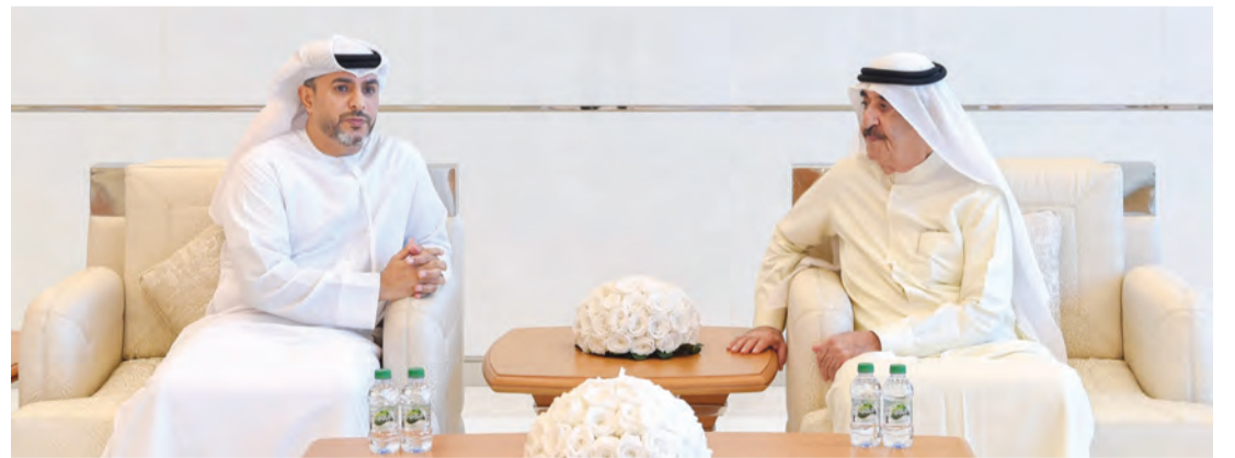
سعود المعلا يتقبل تعازي عبدالله النعيمي

كما تقبل سموه التعازي من عدد من كبار الشخصيات والمواطنين والمقيمين الذين تقدموا إلى سموه بخالص العزاء والمواساة في وفاة والدة سموه الشقيقة حصة بنت حميد بن عبدالرحمن الشامسي، داعين العلي القدير أن يتغمدها برحمته وأن يسكنها فسيح جناته وأن يلهم أهلها وذويها الصبر والسلوان. حضر الاستقبال معالي الشيخ حميد بن أحمد المعلا، والشيخ خالد بن راشد المعلا رئيس الديوان الأميري، والشيخ مكتوم بن راشد المعلا، والشيخ محمد بن راشد المعلا، والشيخ سيف راشد المعلا رئيس دائرة التنمية الاقتصادية، والشيخ أحمد بن سعود بن راشد المعلا نائب رئيس المجلس التنفيذي لإمارة أم القيوين، والشيخ محمد بن سعود بن راشد المعلا رئيس دائرة الرقابة المالية، والشيخ ماجد بن راشد المعلا رئيس دائرة السياحة والآثار، والشيخ عبدالله بن سعود بن راشد المعلا رئيس دائرة المالية، والشيخ علي بن سعود بن راشد