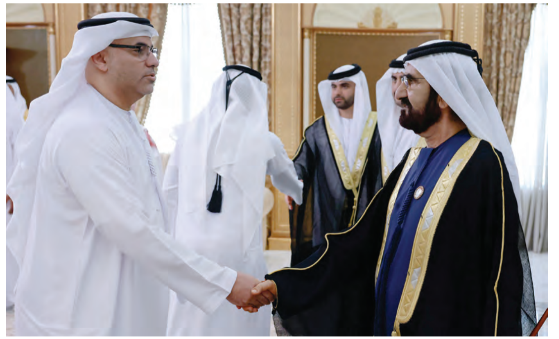
محمد بن راشد يصافح المهنيين