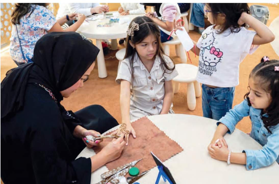
فرحة الصغار وإقبال كبير على المراكز التجارية خلال العيد