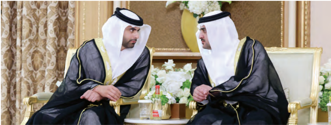
مكتوم بن محمد ومنصور بن محمد خلال الاستقبال