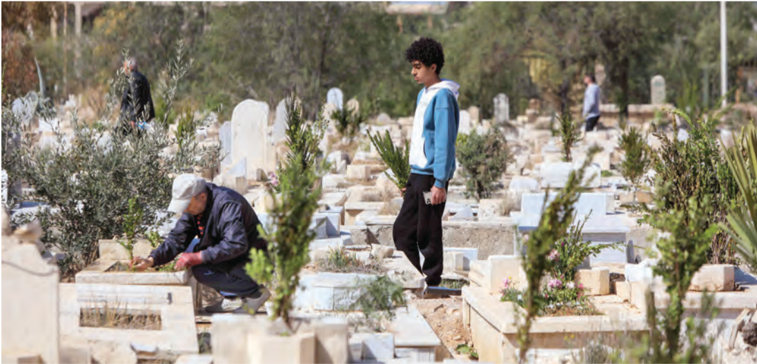
سوريون يزورون أحبائهم في مقبرة لمناسبة العيد

مُقرأ في الوقت ذاته بصعوبة «إرضاء الجميع»، في رد ضمنى على انتقادات طالت تركيبة الحكومة التي تولى مقرّبون منه أبرز حقائبها. وأعلن الشرع ليل السبت تشكيل حكومة من 23 وزيراً، من دون رئيس للوزراء. ورغم أنها جاءت أكثر شمولاً من حكومة تصريف الأعمال التي سبّرت البلاد منذ إطاحة حكم الأسد قبل أكثر من ثلاثة أشهر، إلا أن تشكيلها أثار انتقادات أبرزها من الإدارة الذاتية الكردية، التي انتقدت «مواصلة إحكام طرف واحد السيطرة» على الحكومة، وقالت إنها لن تكون «معنية» بتنفيذ قراراتها. وفي كلمة ألقاها عقب أدائه صلاة عيد الفطر في قصر الشعب، قال الشرع «سعيينا قدر المستطاع أن نختار الأكفاء.. وراعينا التوسع والانتشار والمحافظات وراعينا أيضاً تنوع المجتمع السوري، رفضنا المحاصصة ولكن ذهبنا إلى المشاركة» في تشكيل الحكومة واختيار