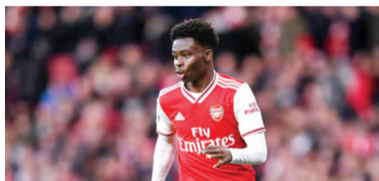
بوكايو ساكا لاعب أرسنال

6 ملايين دولار، حيث يأمل المدرب شارلي أبلبي أن يكون «ريبلز رومانس» في قمة جاهزيته لكسب الرهان والتحدي على ثاني أعلى ألقاب الأمسية بعد الشوط الرئيس كأس دبي العالمي والذي حققه العام الماضي بقيادة الفارس وليام بيوك. وحقق «ريبلز رومانس» نتائج مميزة في الفترة الماضية أبرزها المحافظة على لقب كأس أمير قطر في الدوحة للعام الثاني على التوالي في ظهوره الأول بعمر السبع سنوات، حيث يملك ابن «دباوي» مسيرة من الانتصارات العالمية في مضمار ميدان، بجانب إحراز لقب سباق شامبيونس آند شارتر كب للفئة الأولى في هونغ كونغ، إضافة إلى الإنجاز المميز على المستوى الأعلى للسباقات الفئوية بعد أن تفوق ببسالة على «روشام بارك» في سباق بريدز كب تيرف للفئة الأولى، ليصبح أول جواد يحقق اللقب في نسختين غير متتاليتين. كما حصل النجم «ريبلز رومانس» على جائزة أفضل جواد مسن على العشب خلال حفل جوائز إكلبيس كما شغل المركز الثاني في قائمة أكثر خيول جودلفين تحقياً للفوز بسباقات الفئة الأولى، بفارق فوز واحد فقط خلف «أتامو».