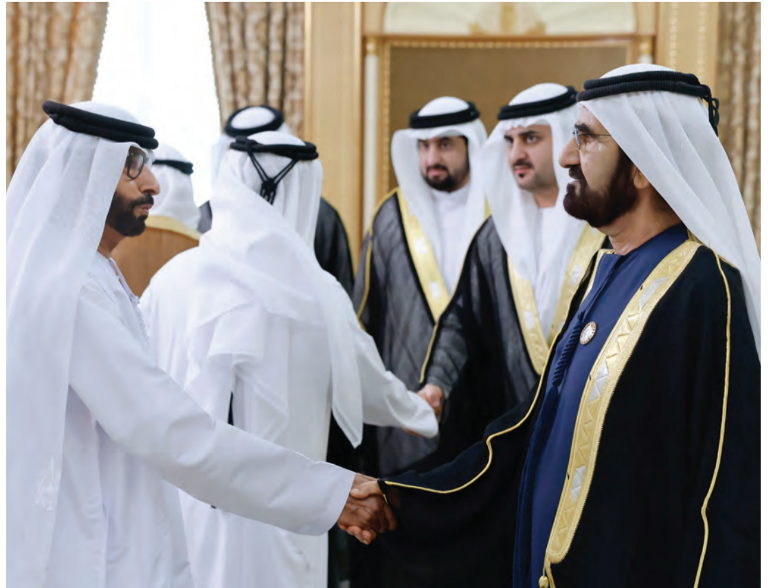
محمد بن راشد متقبلاً التهاني بحضور مكتوم وأحمد بن محمد