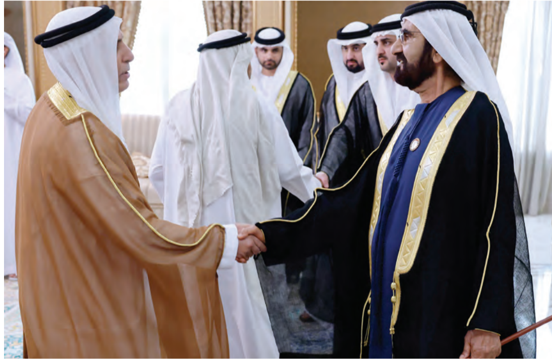
.. وسموه يتقبّل تهاني مطر الطاير