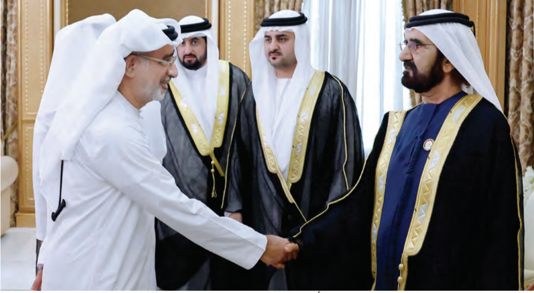
محمد بن راشد يصافح المهنيين بحضور مكتوم وأحمد بن محمد