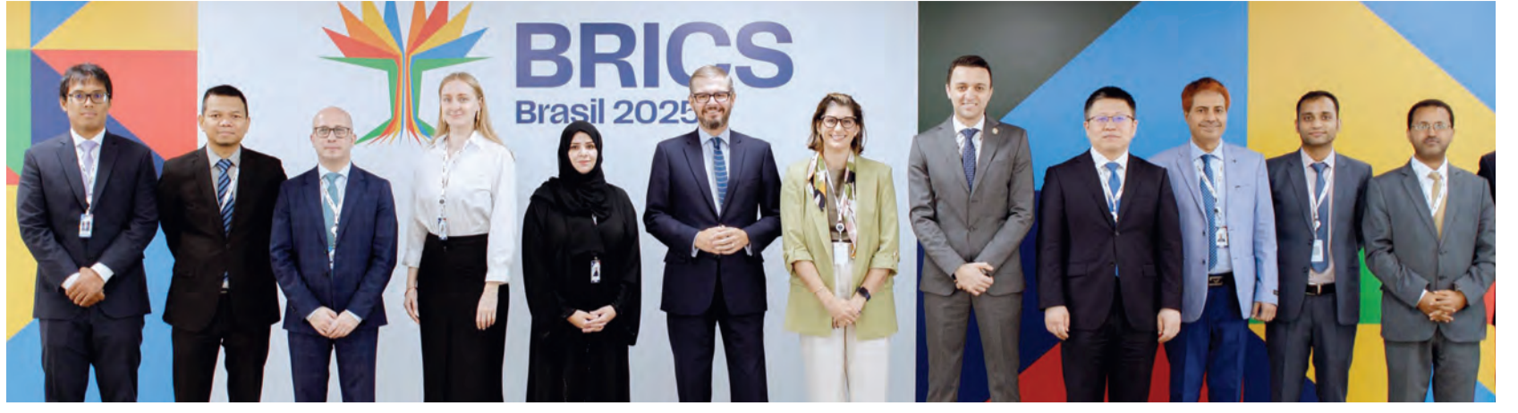
وفد الدولة وجانب من المشاركين في اجتماعات بريكس في برازيليا

ارتفع الين أمس وسجل الذهب ذروة جديدة وسط حالة من الضبابية بسبب الرسوم الجمركية الأمريكية ألقت بظلالها على آفاق التضخم والنمو الاقتصادي في الولايات المتحدة، وأبعدت المتعاملين عن الأصول عالية المخاطر وعن الدولار. وتشهد السوق حالة من التوتر قبيل جولة جديدة من الرسوم الجمركية المضادة من المقرر أن يعلن عنها البيت الأبيض يوم الأربعاء. وقال الرئيس الأمريكي دونالد ترامب في وقت متأخر يوم الأحد: إن رسوماً جمركية ستفرض على جميع الدول تقريباً هذا الأسبوع. ولم يقدم تفاصيل. وارتفع الين إلى 148.7 للدولار خلال التداولات وسجل زيادة 0.37% خلال التعاملات إلى 149.280 للدولار. وارتفعت العملة اليابانية 0.82% الجمعة، عندما أظهرت بيانات أمريكية ارتفاع التضخم الأساسي بأكثر من المتوقع الشهر الماضي، مما أوجع المخاوف من الركود التضخمي. وتراجع اليورو 0.11% إلى 1.0821 دولار، على الرغم من أنه من المتوقع أن يسجل زيادة بنحو 4.5% هذا الربع في أكبر فقرة له منذ الربع الثالث من عام 2022، بدعم من الإصلاح المالي في ألمانيا. واستقر مؤشر الدولار، الذي يقيس أداء العملة الأمريكية مقابل 6 عملات رئيسية، عند 104.01. وارتفع الجنيه الاسترليني 0.19% إلى 1.2955 دولار، ومن المتوقع أن يسجل ارتفاعاً شهرياً بنحو 3% وهو الأفضل منذ نوفمبر 2023. وهبط الدولار الكندي إلى 1.4347 للدولار الأمريكي. كما تراجع البيزو المكسيكي إلى 20.3808 للدولار. وانخفض الدولار الأسترالي 0.6% إلى 0.6252 دولار، قبيل اجتماع السياسة النقدية لبنك الاحتياطي الأسترالي اليوم الثلاثاء.