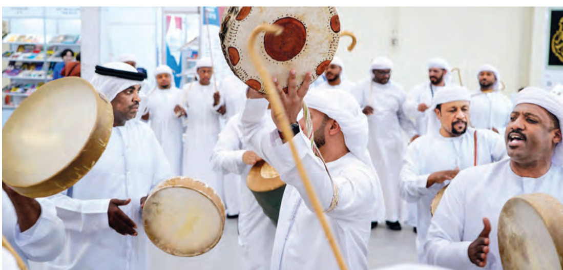
التراث الإماراتي حاضر في مختلف الفعاليات والمهرجانات في الدولة | أرشيفية

وأشاد بالدور اللافت الذي تنهض به الإمارات في سبيل خدمة التراث وتعزيز الارتباط الوثيق به، والذي يظهر من خلال الحركة المتحفية والاهتمام بالمقتنيات التاريخية وتوثيقها ودراساتها واحتضان اللقاءات الفكرية ذات الصلة، منوهاً باختيار دبي لاستضافة المؤتمر العام للمجلس الدولي للمتاحف «آيكوم 2025» لتكون أول مدينة عربية في الشرق الأوسط تحظى بشرف التنظيم.