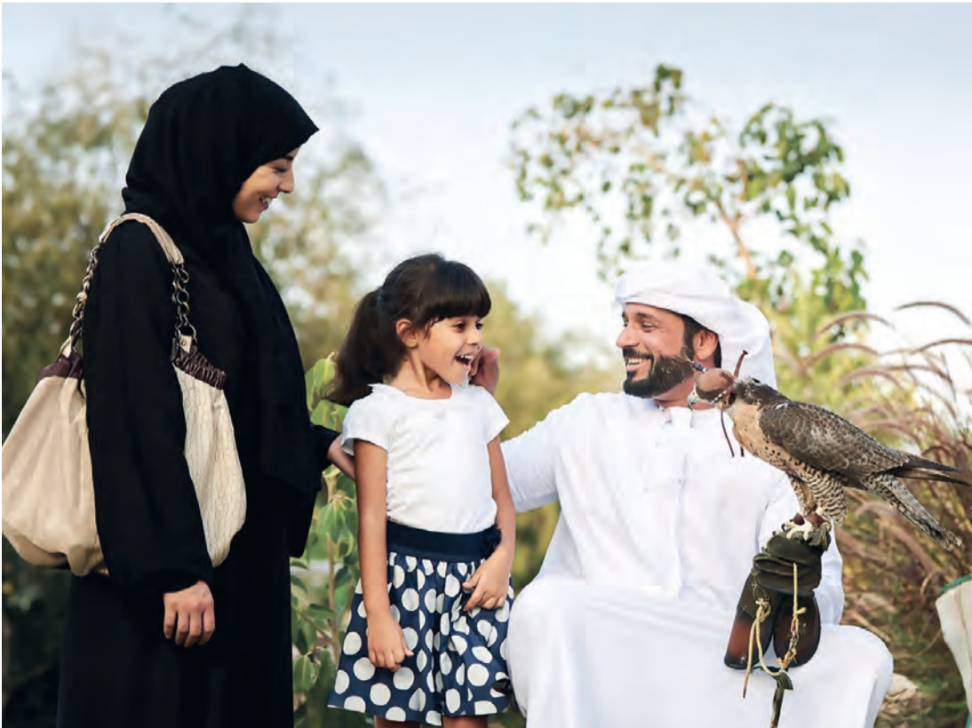
فماليات منطقة العين تسعد الجمهور من مختلف الأعمار | من المصدر

وتترعب حديقة الحيوانات في منطقة العين على قائمة أبرز الوجهات السياحية، وتقدم لزوارها فرصة فريدة لاستكشاف الحياة البرية، وتعزيز وعيهم بقضايا صون الطبيعة، عبر برامج وتجارب تتناسب مع جميع الأعمار، وفي أجواء مليئة بالدهشة والمغامرة. ويتيح سفاري العين للزوار تجربة مشاهدة أكثر من 400 حيوان بري، تمارس حياتها اليومية بحرية دون أقفاص، كما يتيح لهم فرصة إطعام الحيوانات في مناطق مخصصة. وتسهم الكوادر الإماراتية في الحديقة بدور مهم وبارز في المحافظة على صحة الحيوانات، وصون الطبيعة، من خلال عملهم في المجالات الفنية التي تشمل البيطرة وتربية ورعاية الحيوانات والإرشاد السياحي والثقافي.