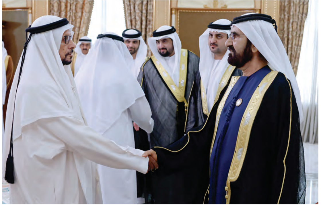
محمد بن راشد يصافح المهنيين بحضور مكتوم وأحمد ومنصور بن محمد