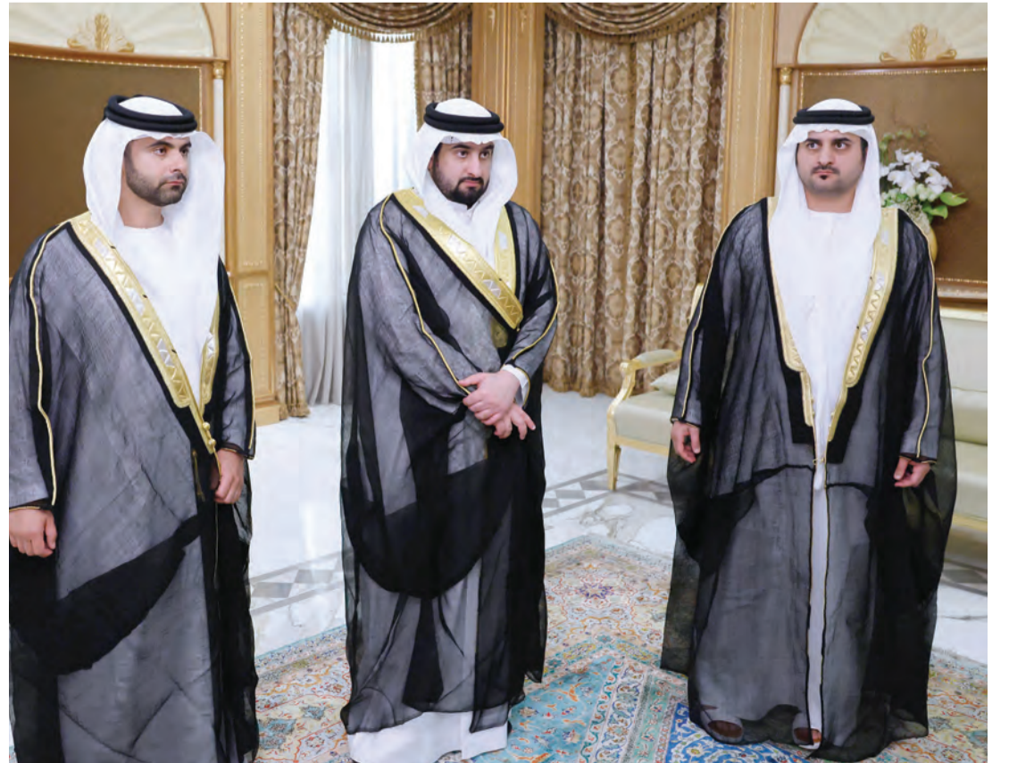
مكتوم وأحمد ومنصور بن محمد خلال تقبل التهاني