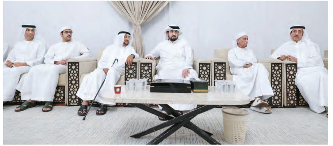
أحمد بن محمد خلال تقديم واجب العزاء بحضور حشر بن مكتوم وخليفة بن سلطان بن خليفة وفيصل القاسمي ومحمد بن فيصل القاسمي وخليفة جمعة النابودة