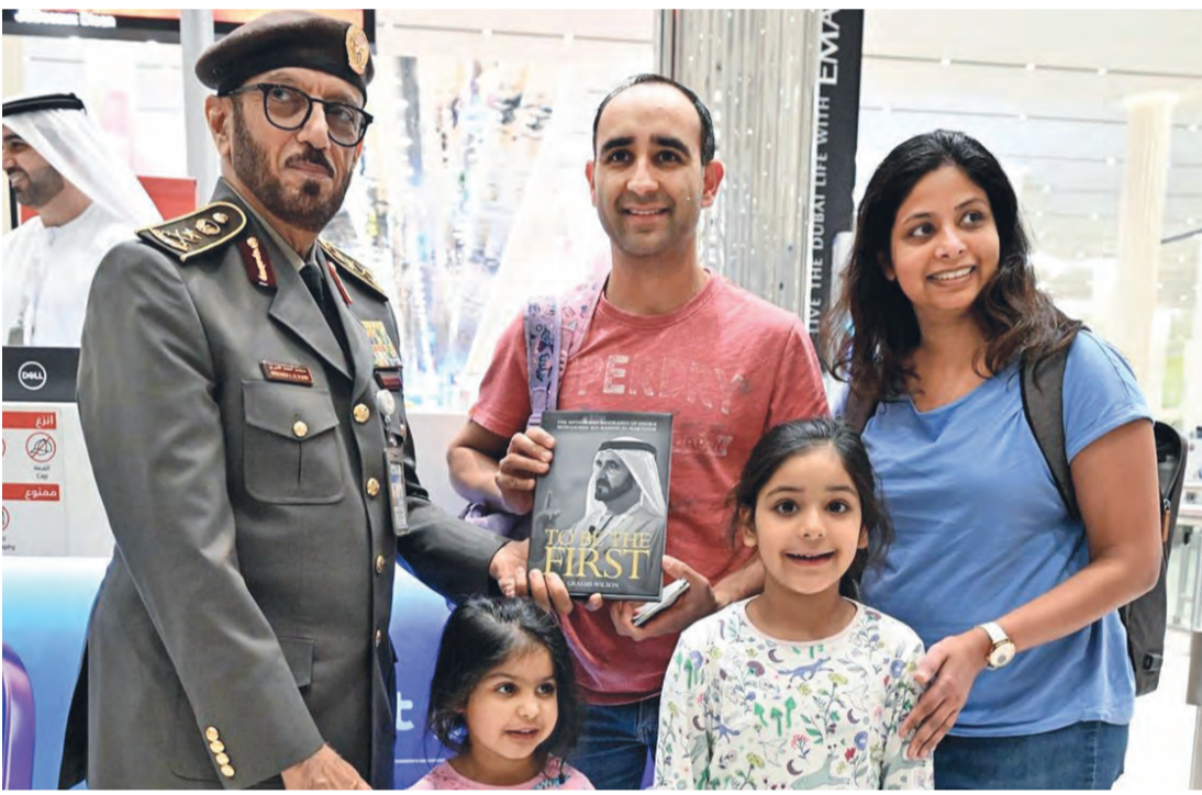
محمد المري يهدي كتاب «الأول» للقادمين عبر المطار | من المصدر

لذلك، قبل أن يُخلق الزمن أبوابه دون وداع، فلنمنحهم ما يستحقونه من حبّ واهتمام صادق؛ فرداً الجميل... من أعظم وأجمل ما يمكن أن نقدّمه لهم.