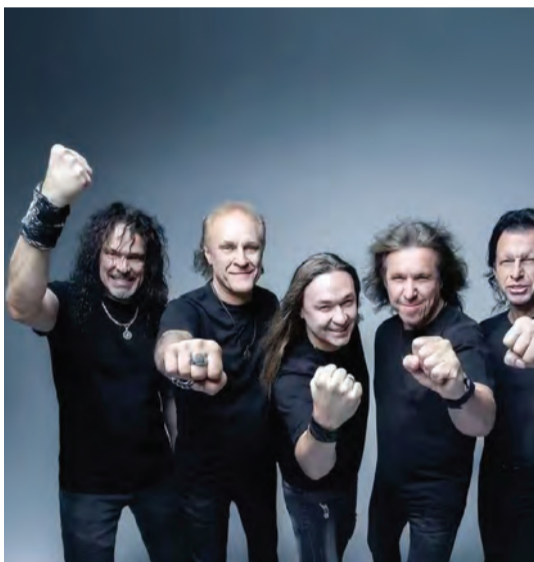
فرقة «أريا» تحيي حفلاً في دبي الجمعة