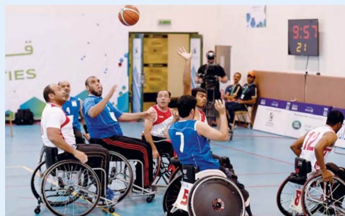
من منافسات نصف النهائي