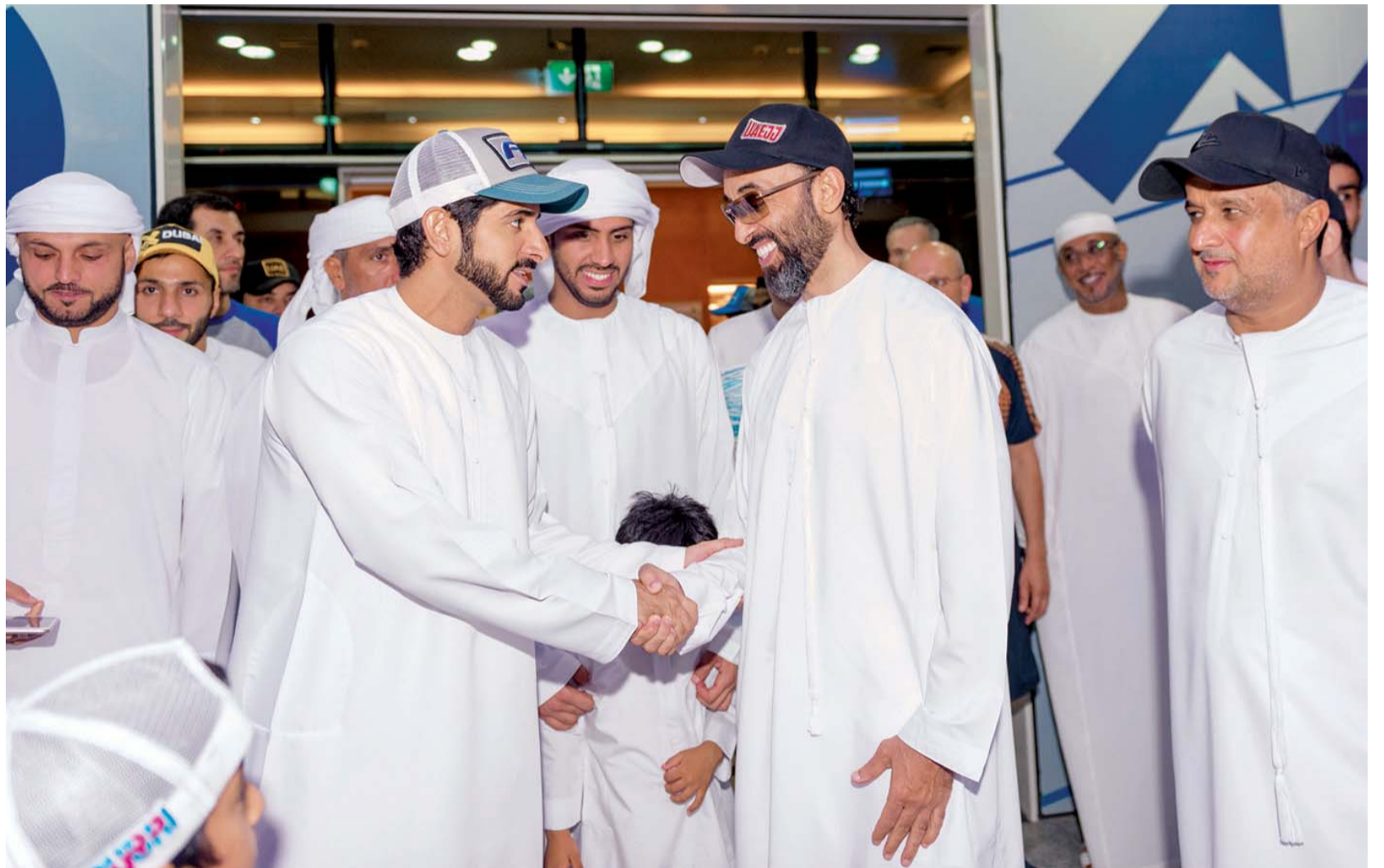
■ حمدان بن محمد يرحب بطحنون بن زايد في دورة ند الشبا