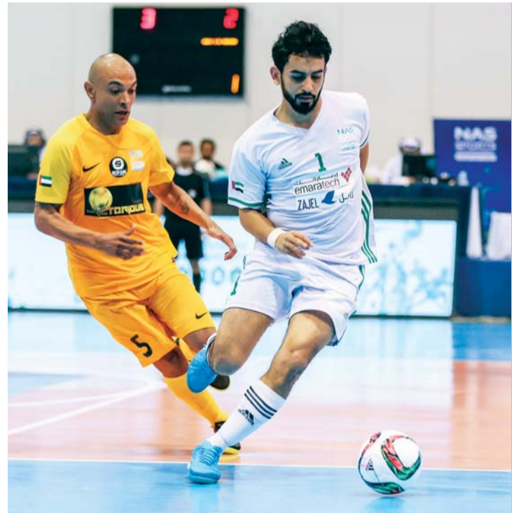
منافسات قوية تشهدها مباريات كرة قدم الصالات في الدورة