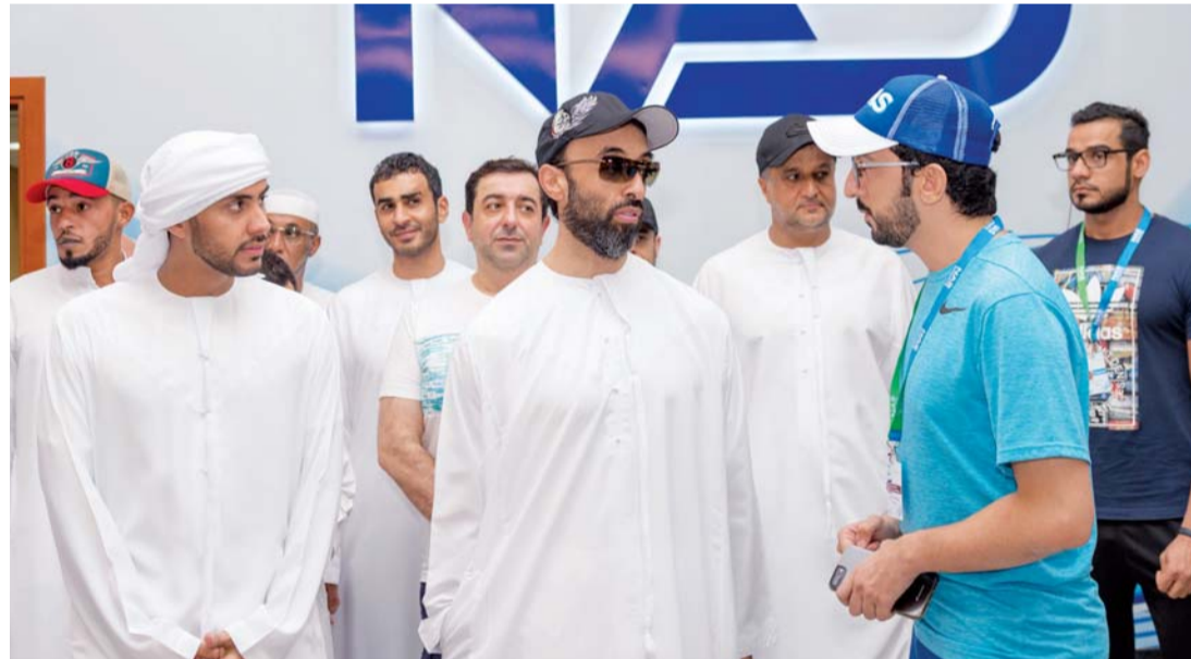
■ طحنون بن زايد يتحدث إلى حسن المزروعى

وعبر سمو الشيخ طحنون بن زايد آل نهيان، مستشار الأمن الوطني، عن تقديره لجهود القائمين على دورة ند الشبا الرياضية، لما تساهم به من دور مهم على صعيد المجتمع بوصفها ملتقى لشباب الوطن والمقيمين على أرض الدولة، عبر أهدافها التي تجسدت على أرض الواقع بتشجيع الشباب على ممارسة مختلف الألعاب الرياضية كونها تضم بطولات رياضية متنوعة، إلى جانب توفير فرصة التلاقي بين أفراد المجتمع في هذه الأجواء الرياضية في شهر رمضان الفضيل.