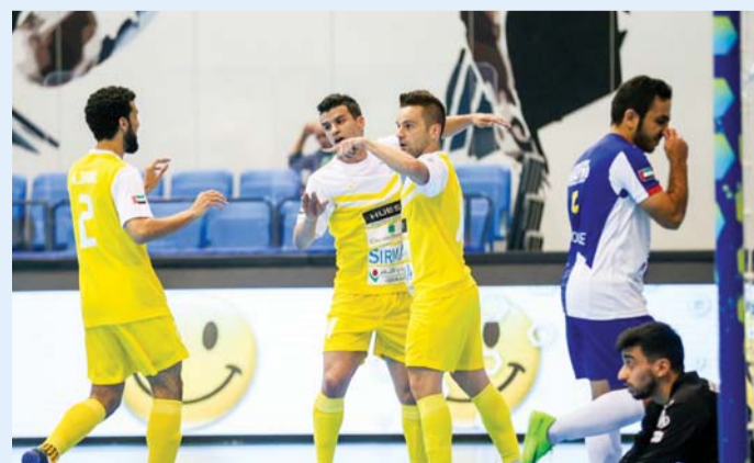
■ فرحة لاعبي الطاهر بالتأهل