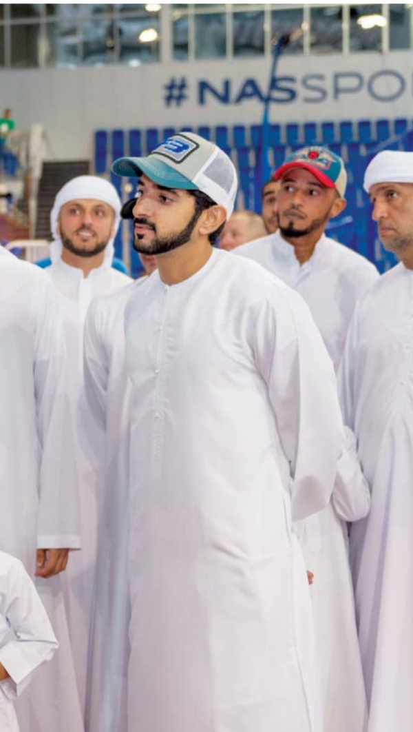
■ سموهما يشهدان ربع نهائي منافسات الصالات