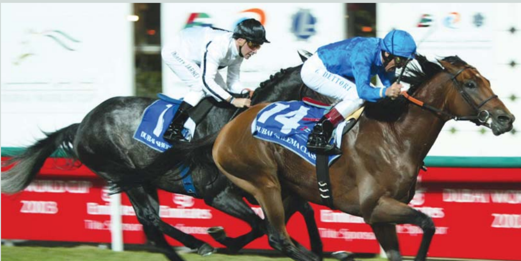
■ خيول جودلفين تشارك في المنافسات

وقال واتسون، إنه سعيد بما حققه في الموسم الماضي من إنجازات، أملاً أن تتواصل هذه المسيرة الموسم الحالي، وتقديم شيء استثنائي، على الرغم من المنافسة القوية.