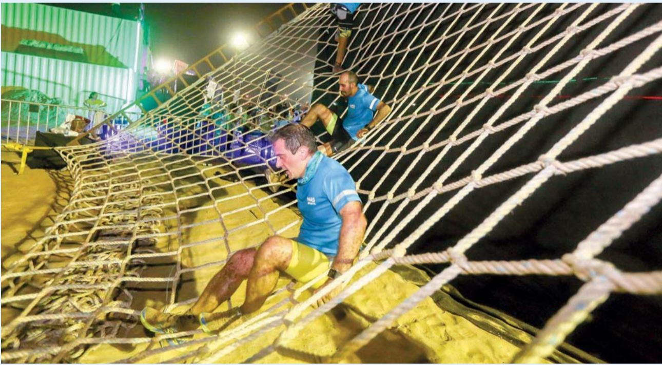
«تحدي ناس» حقق انطلاقة جيدة

العديد من الفعاليات الرياضية المماثلة سابقاً، وهي عموماً تحرص دائماً على ممارسة مختلف أنواع الألعاب الرياضية، وجاء هذا التحدي بمثابة تجربة مميزة من خلال الأجواء والتحدى الموجود فيها، وأوضحت أنها سعت للحصول على مركز جيد على صعيد الفتيات.