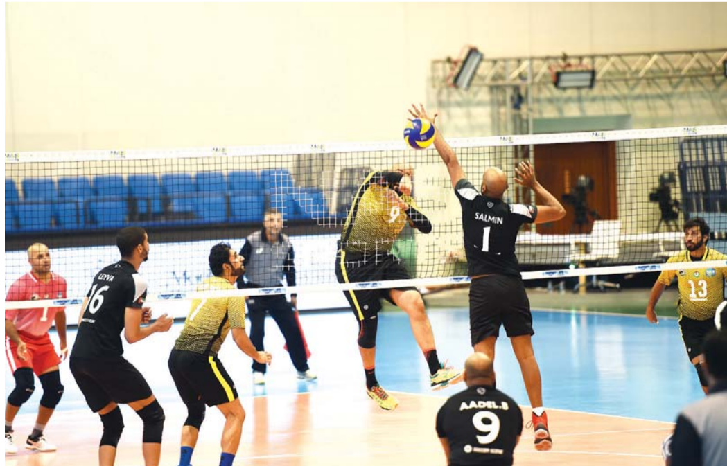
المفاجأة كان في طريق مفتوح أمام فهود زعبيل

جاء الشوط الأول قويا بين الفريقين لكن المفاجأة عرف كيف يستفيد من بعض الأخطاء القاتلة التي ارتكبتها لاعبو فهود زعبيل على مستوى حائط