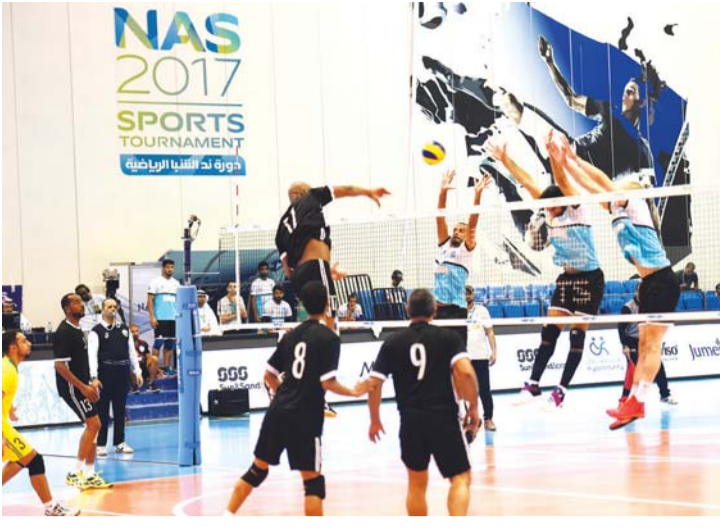
الحزم يواصل تألقه