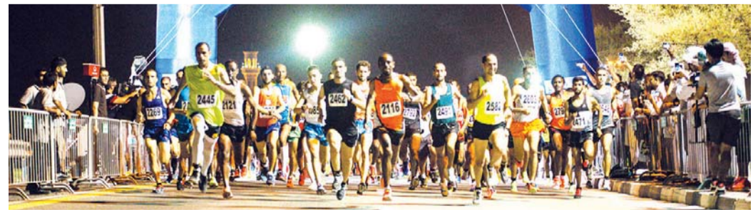
من سباق الجري العام الماضي