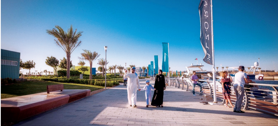
معالم سياحية جاذبة للعائلات في عجمان | أرشيفية

عجمان محطة أساسية للزوار الراغبين في التعرف على تاريخ المنطقة.