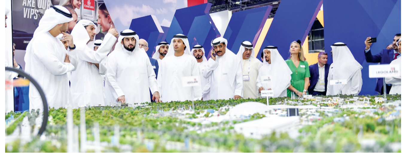
■ سموه يتفقد جناح «دي إكس بي إنترتينمنت» في المعرض