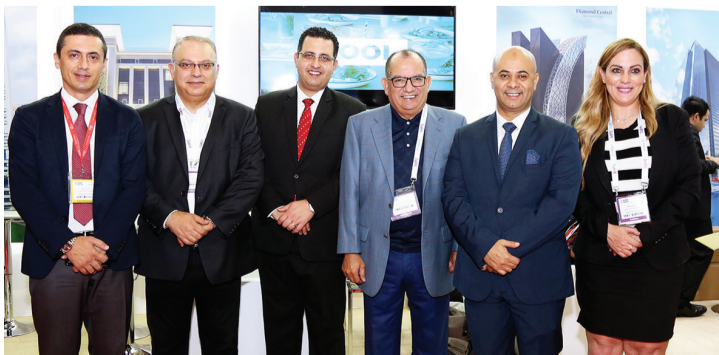
■ مسؤولو المجموعة في سوق السفر أمس | البيان

بدأت ألفا للوجهات السياحية باستفثار كامل طاقتها وجهودها للمشاركة بقوة في معرض سوق السفر العربي 2019 باستضافة أكثر من 100 من وكلاء الشراء الدوليين رفيعي المستوى من أوروبا والولايات المتحدة وآسيا بالتعاون مع دائرة السياحة والتسويق التجاري بدبي. وفي إطار هذه المبادرة الجديدة، وضعت الشركة برنامج استضافة مشوّقاً لوكلاء الشراء المدعوين يتضمن جولات لزيارة وجهات فريدة واستثنائية تم إعداده خصيصاً لاستعراض معالم الجذب الرئيسية في دبي. ويشمل البرنامج القيام بجولات تعريفية إلى مختلف المتنزهات الترفيهية، بالإضافة إلى المعالم الأيقونية مثل برج خليفة. كما من المقرر كذلك أن