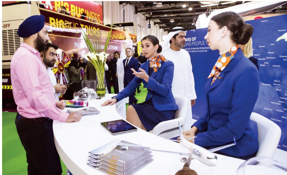
■ جناح «فلاي دبي» في سوق السفر العربي | البيان