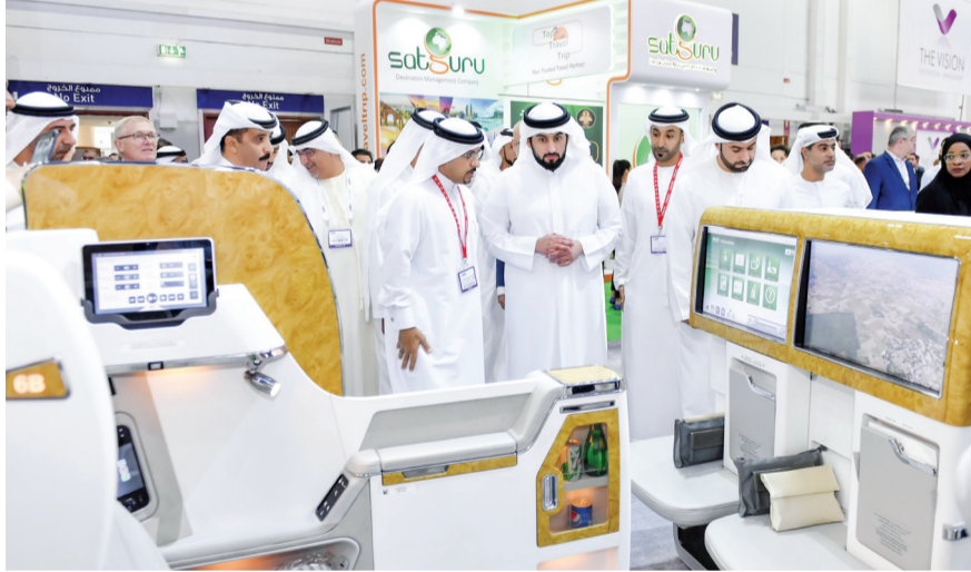
■ ويتفقد جناح «طيران الإمارات»

وتوقف سمو الشيخ أحمد بن محمد بن راشد آل مكتوم في بداية جولته، التي رافقه فيها هلال سعيد المري، الرئيس التنفيذي لسلطة مركز دبي التجاري مدير عام دائرة السياحة والتسويق التجاري في دبي، عند العديد من أجنحة ومنصات عرض الجهات المشاركة في المعرض ومن بينها جناح حكومة دبي الذي يضم عدداً من منصات التعريف بسياحة دبي والتسهيلات التي تقدمها الجهات الحكومية ذات الصلة بصناعة وتطوير السياحة للسياح والمستثمرين