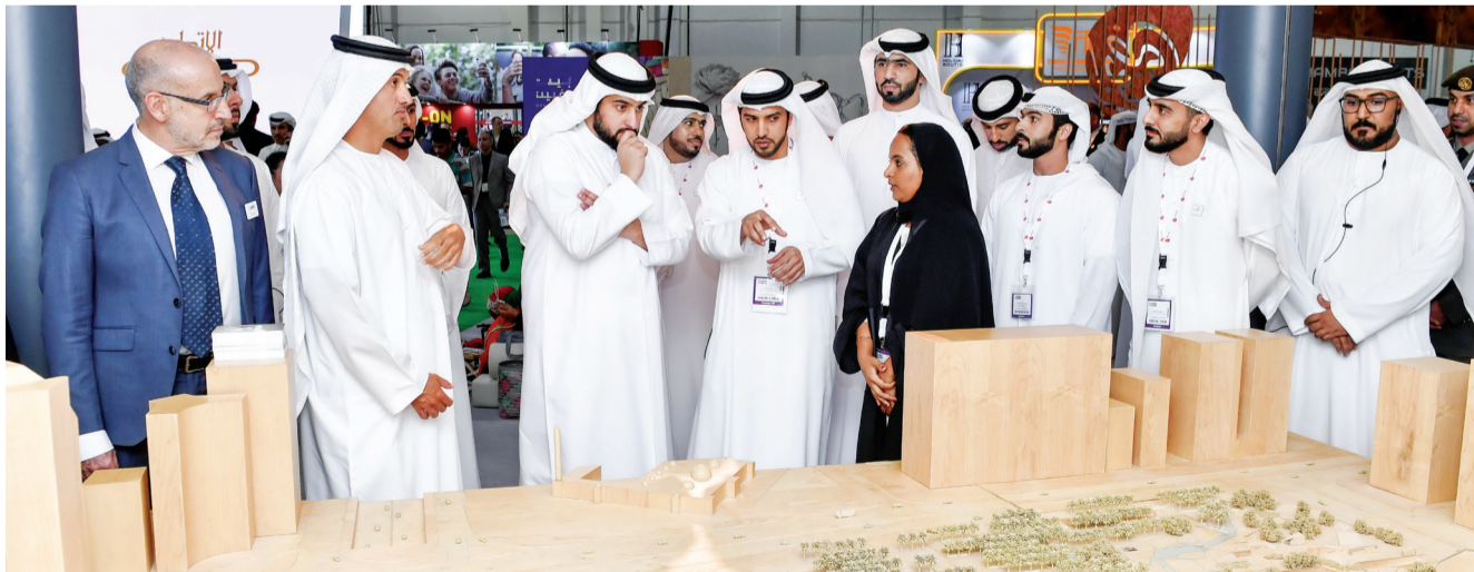
■...ويستمع لشرح حول مجسم بيت الحصن في أبوظبي