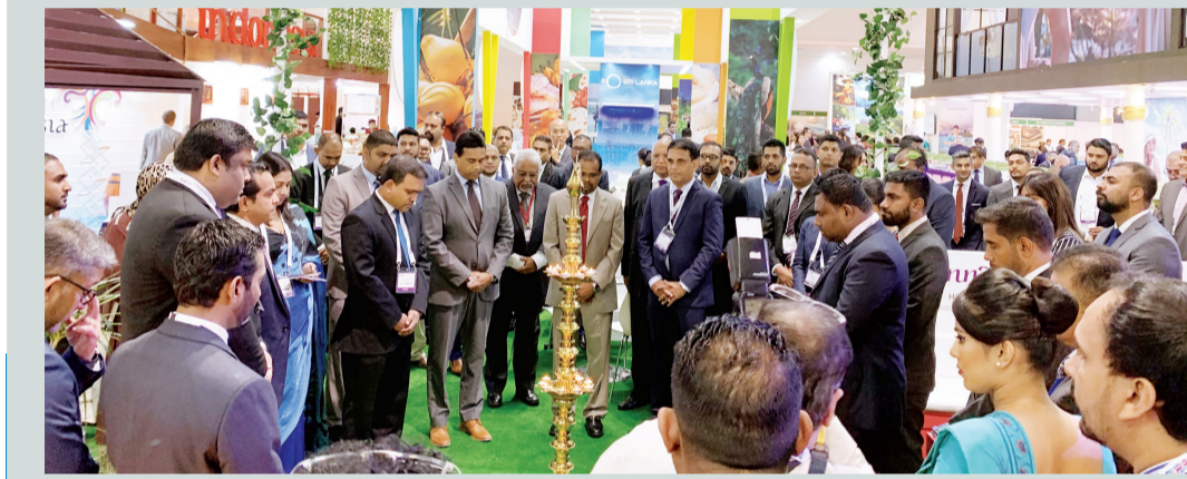
■ تجاوز سوق السفر العربي هدفه كملتقى لصناعة السياحة والسفر والترفيه الى ملتقى للتسامح والإنسانية، هذا ما ظهر من خلال تعاطف الزوار مع الوفد السريلانكي الذي وقف وقفة حداد رمزية تكريماً لضحايا الهجمات الإرهابية الأخيرة في سريلانكا. دبي- البيان

الاحتفالات التي تستضيفها الدولة بمناسبة رأس السنة الصينية وغيرها من الفعاليات الثقافية والسياحية والاقتصادية والترفيهية والمشاريع التجارية والاستثمارية، فضلاً عن دعم الإمارات لمبادرة الحزام والطريق