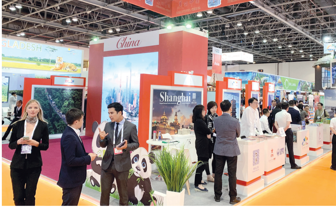
■ الجناح الصيني في سوق السفر العربي | البيان

ولفت جيانغوا إلى أن سوق السفر العربي هو أهم معرض للسياحة والسفر في المنطقة، مشيراً إلى أن العديد من الهيئات السياحية المحلية من مختلف مناطق الصين تحضر على المشاركة في الحدث، لافتاً إلى أن المشاركة الصينية الموسعة في المعرض انعكست إيجاباً على نمو تدفق حركة السياح والمسافرين بين الصين والإمارات وسائر دول مجلس التعاون الخليجي، موضحاً أن الجناح الصيني في النسخة الحالية من المعرض استقطب مشاركات لـ 8 مدن رئيسية.