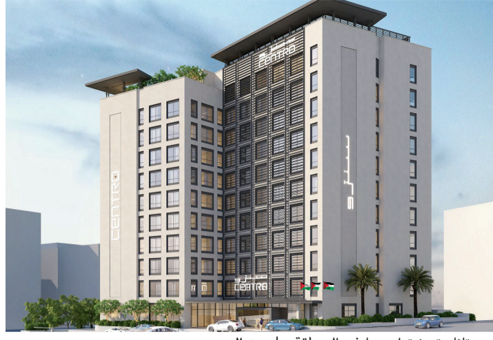
«روتانا» تعزز تواجدها في المنطقة | من المصدر

سلطت «روتانا» الضوء على محفظتها الفندقية وجهودها التوسعية المستمرة، وذلك خلال مشاركتها في «معرض سوق السفر العربي» لعام 2019. وتدير الشركة حالياً 65 فندقاً في 23 مدينة منتشرة في 12 دولة، بما في ذلك 9694 غرفة متوزعة في 35 فندقاً في الإمارات وحدها. ومع عشرة فنادق من المقرر أن يتم افتتاحها قبل نهاية 2020، فإن جميع الظروف مواتية لمواصلة تنفيذ خططها التوسعية الطموحة. ومن المقرر