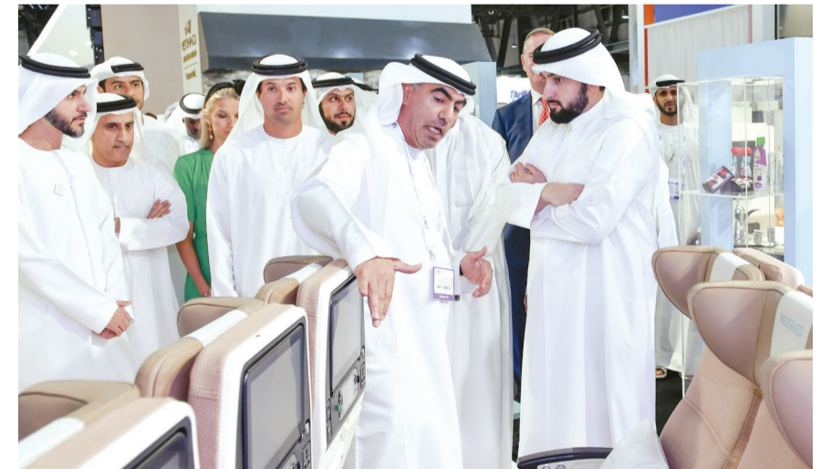
■ سموه يطلع على أحدث ابتكارات «طيران الاتحاد»