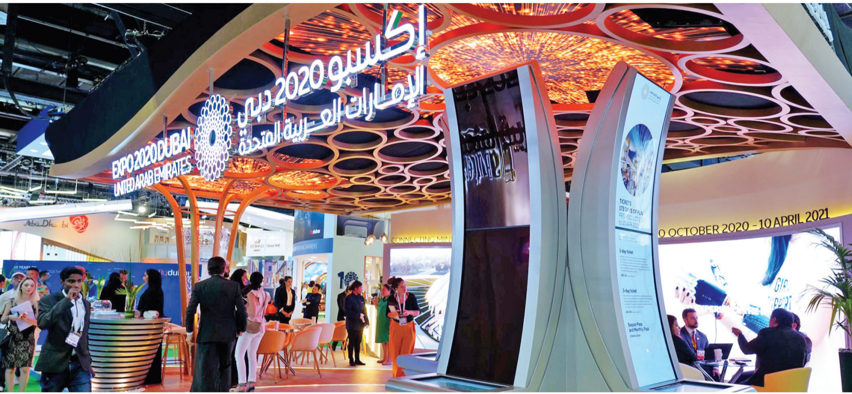
■ جناح إكسبو في المعرض | من المصدر