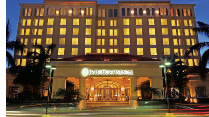
مجموعة «إنتركونتينتال» تمتلك 5600 فندق في نحو 100 دولة | أرشيفية

وقعت مجموعة فنادق «إنتركونتينتال» اتفاقية شراكة عالمية مع مجموعة «سير»، حيث تمكن الاتفاقية مجموعة «سير» من الوصول إلى محفظة مجموعة فنادق «إنتركونتينتال» العالمية والتي تضم 15 علامة تجارية وأكثر من 5600 فندق في ما يزيد على 100 دولة لفئة السفر الترفيهي. وقال باسكال جوفين، العضو المنتدب لمجموعة فنادق «إنتركونتينتال» في الهند والشرق الأوسط وأفريقيا: «يسرنا أن نعلن عن شراكتنا مع مجموعة سير. تمتلك مجموعة فنادق إنتركونتينتال طموحات نمو كبيرة في المنطقة، وستتيح لنا هذه الاتفاقية التواصل مع مجموعة واسعة من المسافرين بغرض الترفيه. أصبح السفر بغاية الترفيه يتزايد بشكل كبير بين المسافرين محلياً وعالمياً في المنطقة، بما في ذلك السعودية، مع انطلاق عدد من المشاريع التي أنشئت في إطار رؤية السعودية 2030. وستتيح لنا محفظتنا التي تضم مجموعة ضخمة من العلامات التجارية والفنادق المعروفة إلى جانب هذه الشراكة، القدرة على نشر الوعي وتقديم خيارات أوسع للمسافرين».