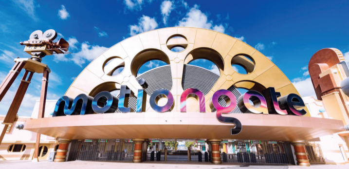
«موشنجيت» وجهة ترفيهية مميزة