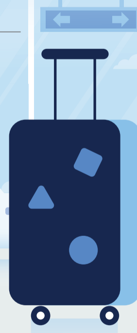
غرافيك: حسام الحوراني