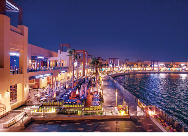
■ الوجهة البحرية «ذي بوينت» تجذب اهتمام الزوار

مولر، ذراع شركة «نخيل» في قطاع التجزئة، مواقف تتسع لـ 1600 سيارة بالإضافة إلى محطة لقطار «ذا بالم مونوريل» مخصصة له على امتداد الوجهة.