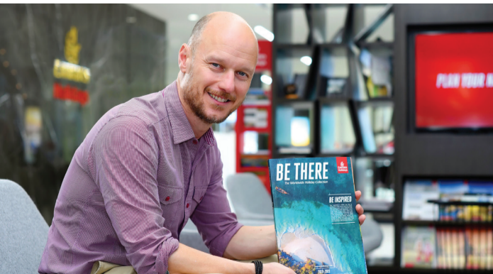
■ الكتيب يوفر برامج رحلات متكاملة تشمل أبرز معالم