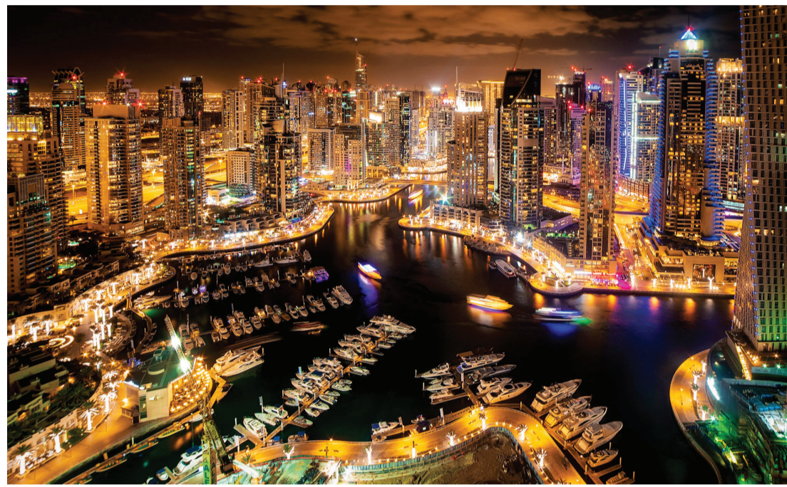
تنوع الفعاليات والوجهات والمنتزهات يجذب السياح | البيان

وعلى الرغم من وجود بعض التحديات ومن ضمنها الفاضل في العروض الفندقية، يوضح بلان أن بعض نماذج العمل على غرار ملكية العطلات بنظام المشاركة بالوقت أو الـ «تايم شير» تشكل حلاً مثالياً في تعزيز الطلب وتطوير العروض الفندقية. وأوضح أن هذا القطاع ظهر للمرة الأولى في فلوريدا بالولايات المتحدة كحل لتباطؤ القطاع الفندقية في ظل تزايد الفاضل من الفنادق في الولاية،