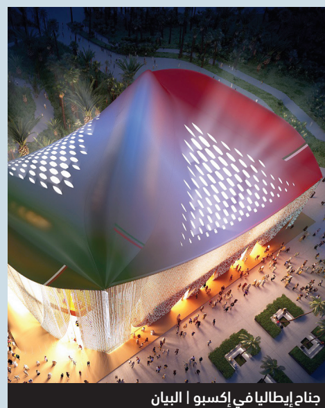
جناح إيطاليا في إكسبو | البيان

جديد؟ وأشار في تصريحات له «البيان الاقتصادي» إلى أن تصميم جناح إيطاليا يستكشف آفاق إعادة التدوير والاقتصاد الدائري وإعادة تشكيل الهندسة المعمارية، لافتاً إلى أن المكون الأبرز للجناح يتمثل