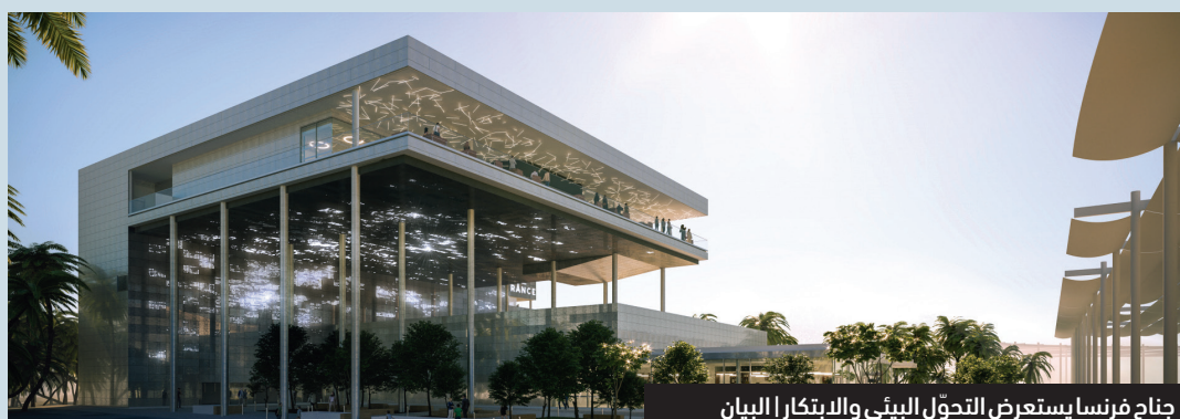
جناح فرنسا يستعرض التحول البيئي والابتكار البيان

فقد أصبح شعار المعرض «تواصل العقول وصنع المستقبل»، أكثر أهمية من أي وقت مضى، حيث ستلتي كل الشعوب معاً، لمدة ستة أشهر، لتبادل الأفكار، واستعراض وتقديم الحلول الملموسة لخدمة البشرية. وفي ظل هذه الأزمة الصحية الحالية، فإن هذا الشعار، لم يعد مجرد اقتراح، بل أصبح أولوية.