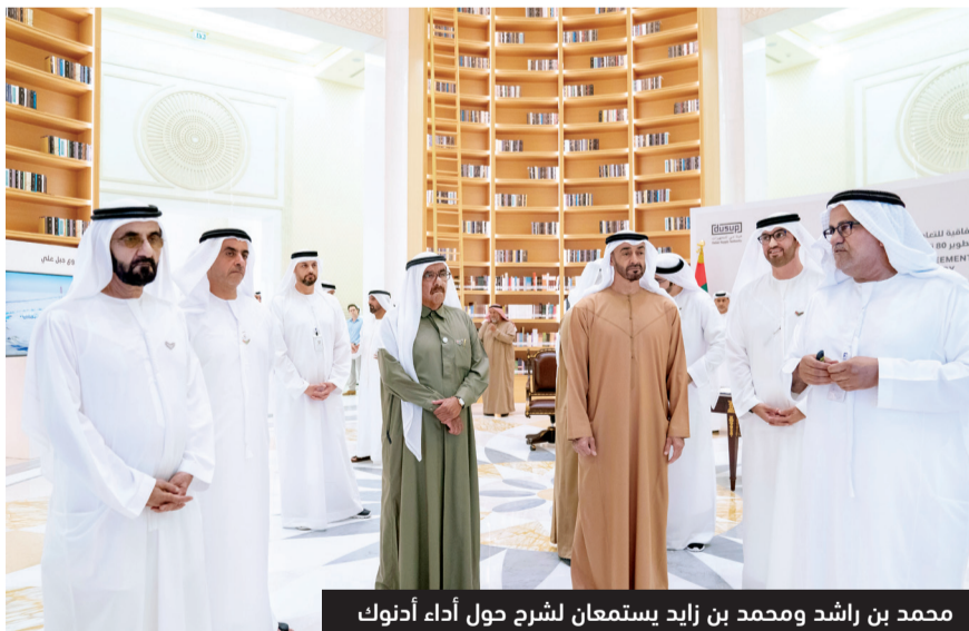
محمد بن راشد ومحمد بن زايد يستمعان لشرح حول أداء أدنوك