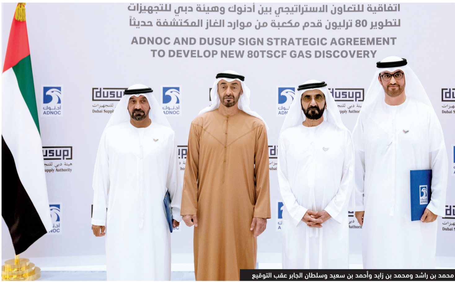
محمد بن راشد ومحمد بن زايد وأحمد بن سعيد وسلطان الجابر عقب التوقيع