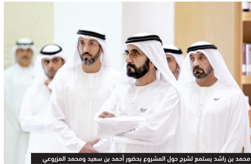
محمد بن راشد يستمع لشرح حول المشروع بحضور أحمد بن سعيد ومحمد المزروعى