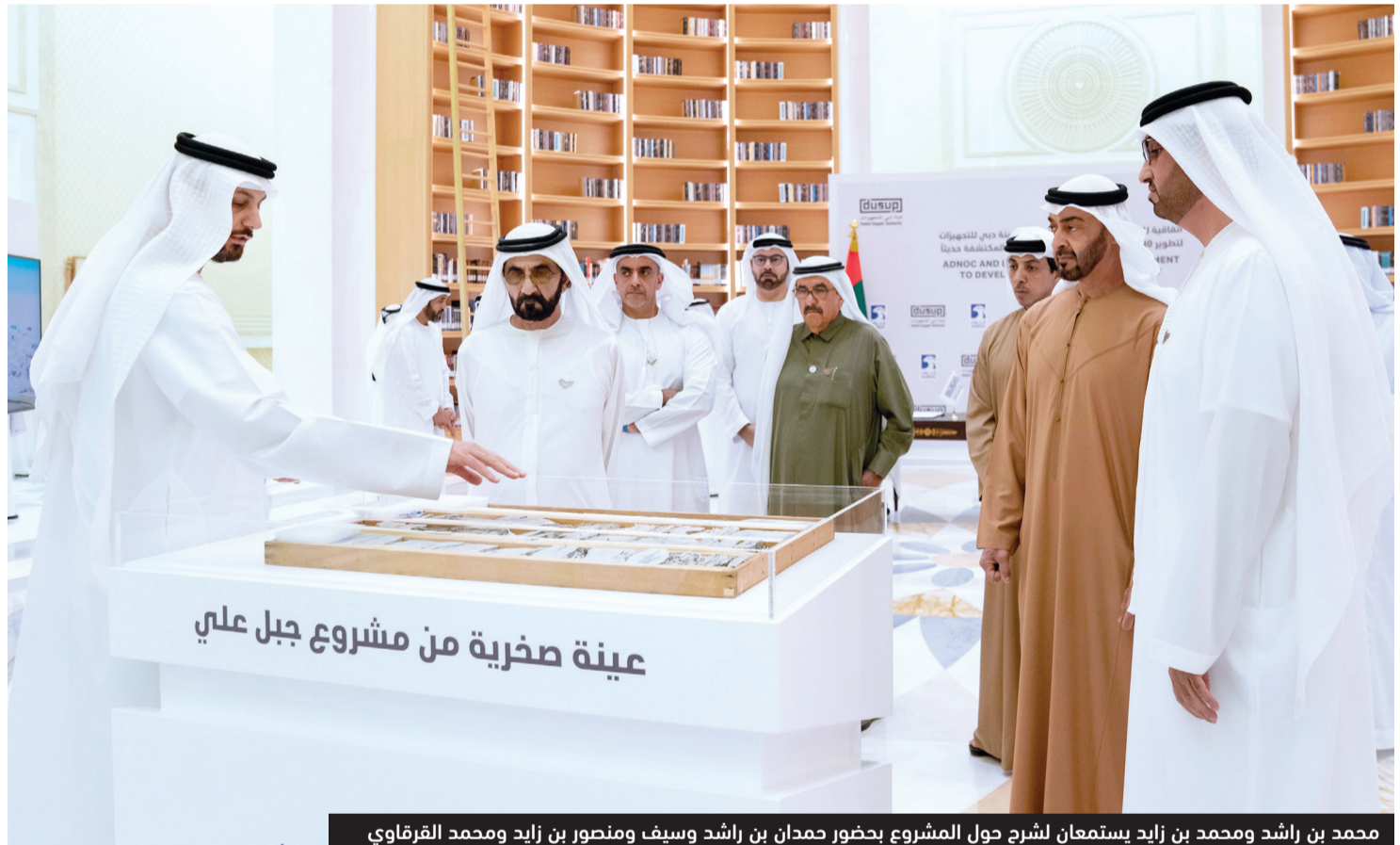
محمد بن راشد ومحمد بن زايد يستمعان لشرح حول المشروع بحضور حمدان بن راشد وسيف ومنصور بن زايد ومحمد القرقاوي

لموارد جديدة للغاز الطبيعي في إمارتي أبوظبي ودبي سعي الشركة الدائم لاستثمار الموارد الهيدروكربونية الوفيرة بما يحقق الفائدة للوطن. وتطلع إلى تسريع أعمال استكشاف وتقييم وتطوير موارد الغاز في المنطقة المستهدفة والاستفادة من الإمكانيات الواعدة المتوفرة فيها، وذلك لخلق قيمة مستدامة على المدى البعيد لدولة الإمارات.