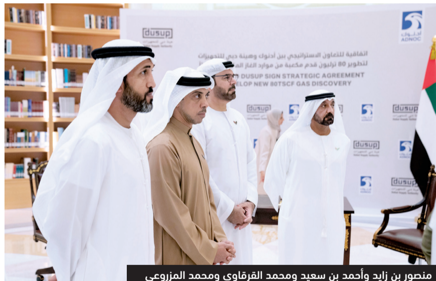
منصور بن زايد وأحمد بن سعيد ومحمد القرقاوي ومحمد المزروعى

وتأتي الاتفاقية بين شركة «أدنوك» و«هيئة دبي للتجهيزات» بعد أقل من ثلاثة أشهر من إعلان المجلس الأعلى للبترول عن اكتشاف وإضافة احتياطيات هيدروكربونية جديدة تقدر بـ 7 مليارات برميل من النفط الخام و58 تريليون قدم مكعبة قياسية من الغاز التقليدي، ما أسهم في تقدم دولة الإمارات من المركز السابع إلى السادس عالمياً من حيث احتياطيات النفط والغاز العالمية، بإجمالي احتياطيات يبلغ 105 مليارات برميل من النفط، و273 تريليون قدم مكعبة من الغاز التقليدي و160 تريليون قدم مكعبة قياسية من موارد الغاز غير التقليدي.