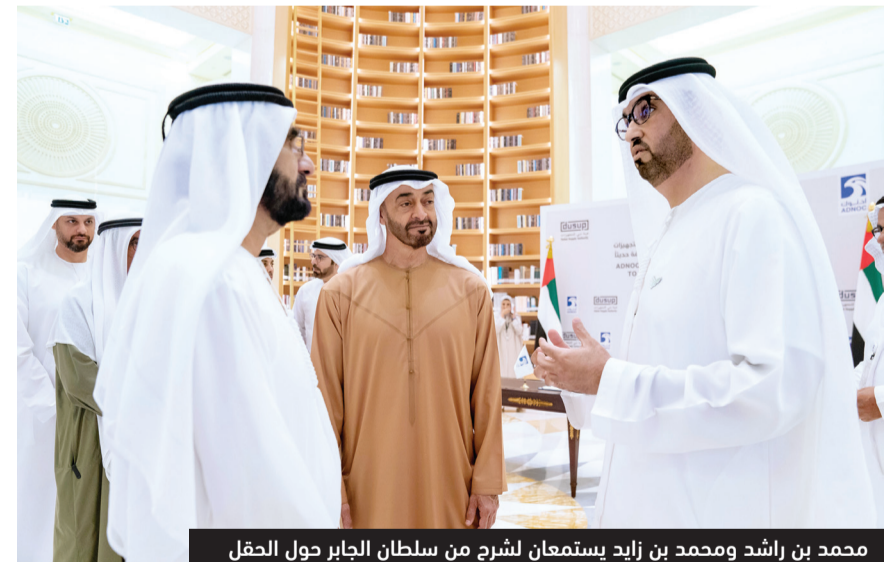
محمد بن راشد ومحمد بن زايد يستمعان لشرح من سلطان الجابر حول الحقل

وجاء اكتشاف المخزون الضخم من الغاز كثمرة أولى عمليات تقوم من خلالها شركة «أدنوك» باستكشاف الموارد الهيدروكربونية في إمارة دبي. ووفقاً للاتفاقية ستقوم «أدنوك» بالاستثمار وتسخير التكنولوجيا والخبرة لتطوير وإنتاج موارد الغاز المكتشفة، إضافة إلى القيام بعمليات مسح واستكشاف جديدة في المنطقة لتقييم المزيد من موارد الغاز وإجراء الدراسة النهائية لتكلفة إنتاجها.