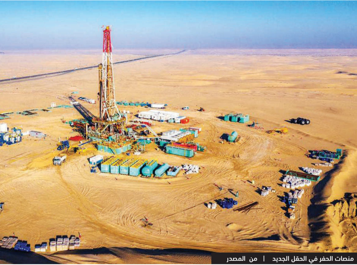
منصات الحفر في الحقل الجديد