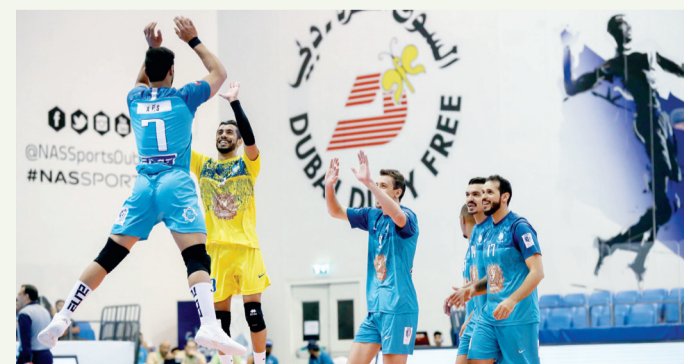
فرحة لاعبي فريق «بن ثاني» بالمركز الثالث | البيان

الشوط الثاني بنفس نتيجة الأول (25-21). ولم يختلف الشوط الثالث عن سابقه، حيث تميز بسيطرة لفريق «بن ثاني» وتحكم في مجريات المباراة بشكل تام ووسع الفارق تدريجياً إلى أن وصل إلى 4 نقاط 10-14 و18-14 ثم 22-17 و24-18 قبل أن يحسم نتيجة الشوط 19-25 محققاً فوزاً مستحقاً.