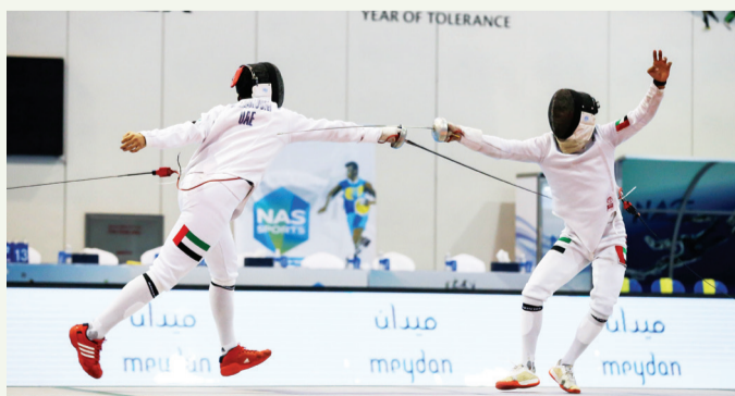
تنظيم متميز لبطولة المبارزة | البيان

ستأتي في توقيت يستعد فيه المبارزون للمشاركة في الأولمبياد، وهو ما يحتم على المنظمين أن يتحركوا قبل وقت كافٍ من انطلاق الدورة في مخاطبة المشاركين لترتيب برامجهم قبل المشاركة في المعترك الأولمبي الكبير.