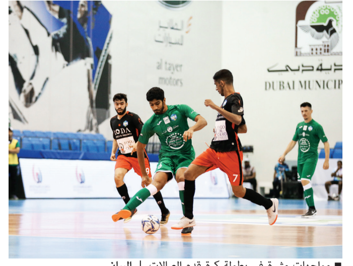
مواجهات مثيرة في بطولة كرة قدم الصالات | البيان

تطلق منافسات كرة الصالات مساء اليوم على وقع 3 مواجهات قوية، حيث يلتقي في المجموعة الأولى فهد زعبيل مع المدرسة السعودية للقيادة، وفي إطار نفس المجموعة يلتقي الفكتوري مع «أف» و«ب»، وضمن المجموعة الثانية يلتقي فريقا البحري والظاهر. وتعد مسابقة كرة الصالات واحدة من أكثر المنافسات شعبية وجمهيرية، وتتميز دائماً بمشاركة نخبة من أفضل