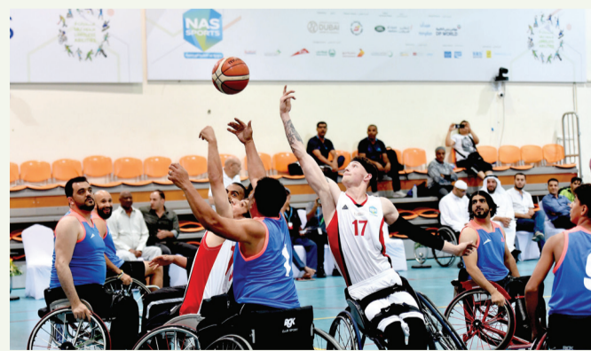
مباريات قوية في كرة السلة على الكراسي المتحركة | البيان

تحققت مفاجآت خلال الجولة الأولى من بطولة السلة للكراسي المتحركة لأصحاب الهمم، والتي انطلقت أمس الأول بصالة نادي دبي لأصحاب الهمم، حيث نجح فريق هيئة كهرباء ومياه دبي «ديوا» في تحقيق أول فوز له في البطولة على حساب فريق دبي لأصحاب الهمم، صاحب الأرض بفارق كبير 38-19، في افتتاح مباريات المجموعة الأولى، وفي المباراة الثانية ضمن المجموعة الثانية تفوق فريق مؤسسة دبي لخدمات الإسعاف على فريق هيئة دبي للطرق والمواصلات بنتيجة 34-15، وفي المباراة الثالثة من السهرة الرمضانية نجح فريق الأنصاري للصرافة في تحقيق الفوز على فريق دناتا بنتيجة ضمن المجموعة الأولى 21-8، فيما كانت المباراة الرابعة والأخيرة من اليوم الأول بين هيئة الصحة بدبي ومركز البستان ونجح الأخير في تحقيق الفوز على صحة دبي 16-14. ويتصدر فريق هيئة كهرباء ومياه دبي