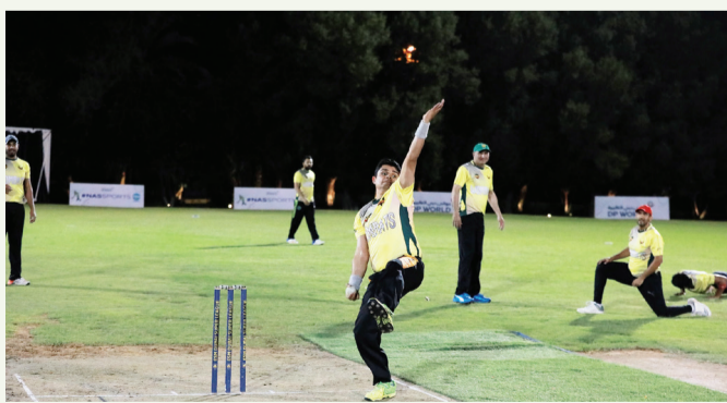
جانب من مباريات الكريكيت