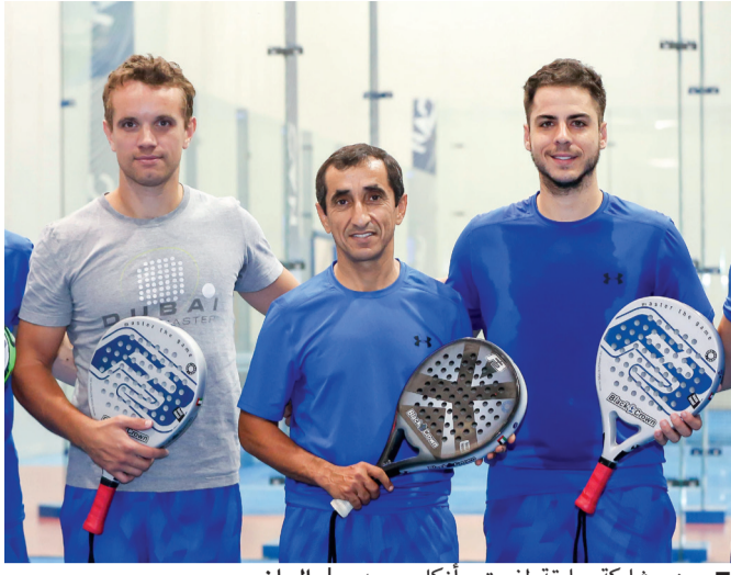
من مشاركة سابقة لفريق «أنكل سعيد»