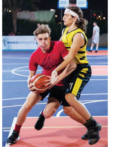
جانب من منافسات كرة السلة

أقيمت مساء أول من أمس منافسات دوري المجموعات بطولة السلة 3*3 في فنتي الشباب والرجال، وأسفرت نتائجها عن تصدر «دبي باليرز» للمجموعة الأولى بعد فوزه في مباراتين على حساب «بوزيتيف سول» و7-15 و«بيتس بيلاني أ» 0-2، فيما تصدر فريق سوق دبي الحرة 1 المجموعة الثانية بفوزه في المبارتين الأولى والثانية على حساب «أليك» 0-2 ثم على حساب فريق سوق دبي الحرة 3 بنتيجة 10-7، فيما أسفرت نتائج المجموعة الثالثة عن فوز فريق سوق دبي الحرة 2 على «باليرز» 8-7 قبل أن يخسر على يد «ريزينغ كينغس» في المباراة الثانية 10-7.