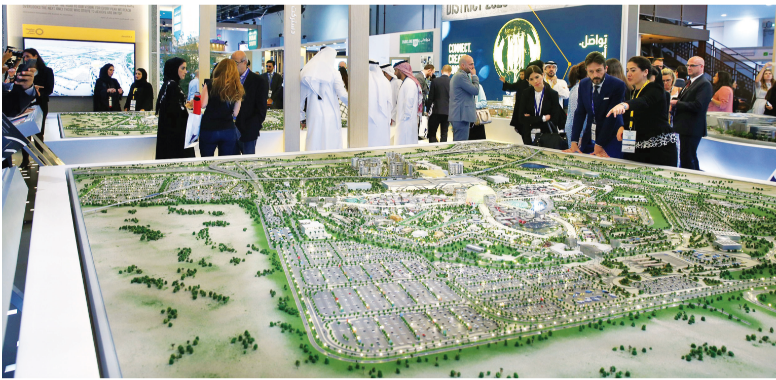
جناح إكسبو 2020 في معرض سيتي سكيب يجذب الزوار | تصوير زفير ولسون