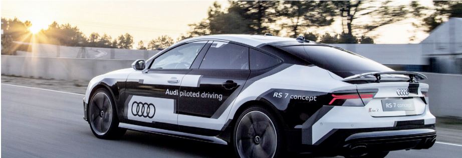
أودي آر إس 7 ذاتية القيادة | البيان

«ذكية» ذاتية القيادة، في منطقة الخليج التجاري، على مسار طوله 650 متراً، وذلك بعد نجاح المرحلتين الأولى والثانية في مركز دبي التجاري العالمي وبوليفارد محمد بن راشد، وتعتبر تلك أولى الخطوات لتنفيذ استراتيجية دبي للتنقل الذكي ذاتي القيادة، التي تهدف إلى تحويل 25% من إجمالي الرحلات إلى رحلات ذاتية القيادة بحلول عام 2030، كما اشترت هيئة الطرق والمواصلات في دبي 200 سيارة تسلا طراز إس سيدان (رباعية الأبواب) وطراز إكس رباعية الدفع، مزودة بقدرات قيادة ذاتية.