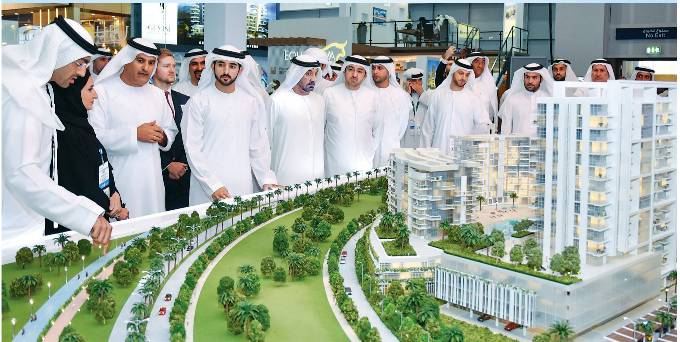
حمدان بن محمد يستمع بحضور أحمد بن سعيد ومحمد الشحي وعلي راشد لوتاه وسعيد الطاير إلى شرح حول مشروع ديستريكت ون بمدينة محمد بن راشد آل مكتوم