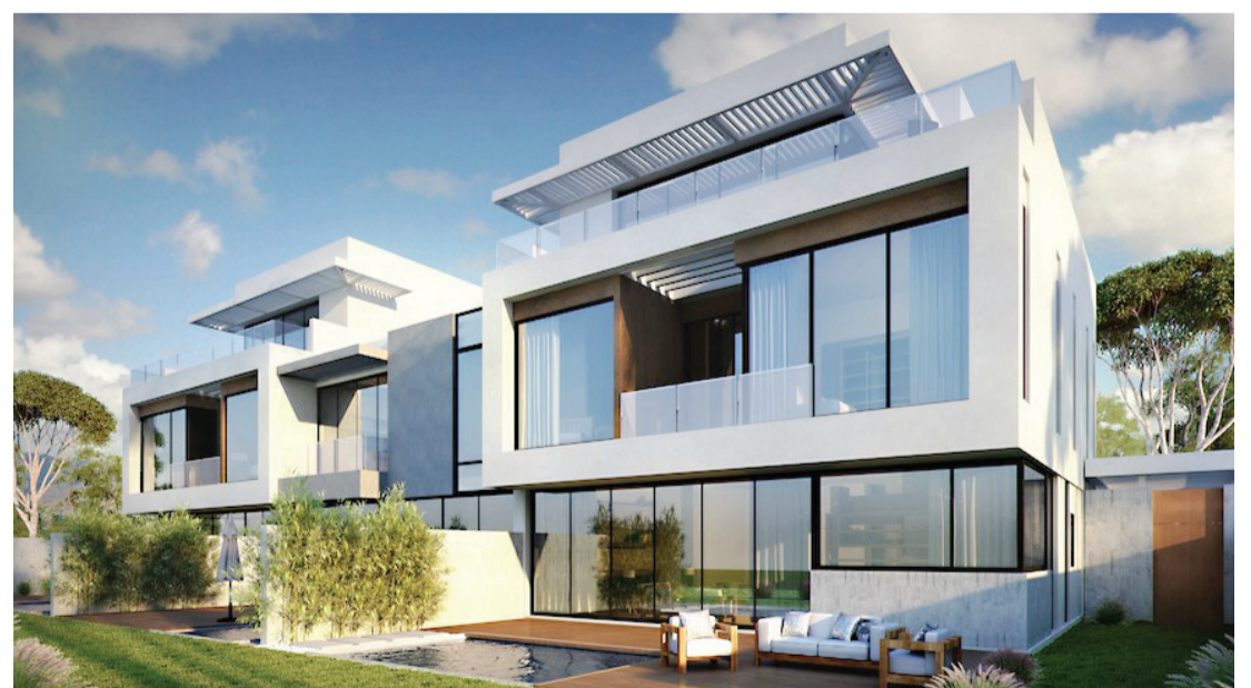
تسليم مشروع جميرا لأكشري ذا لايف في الربع الأخير من 2019