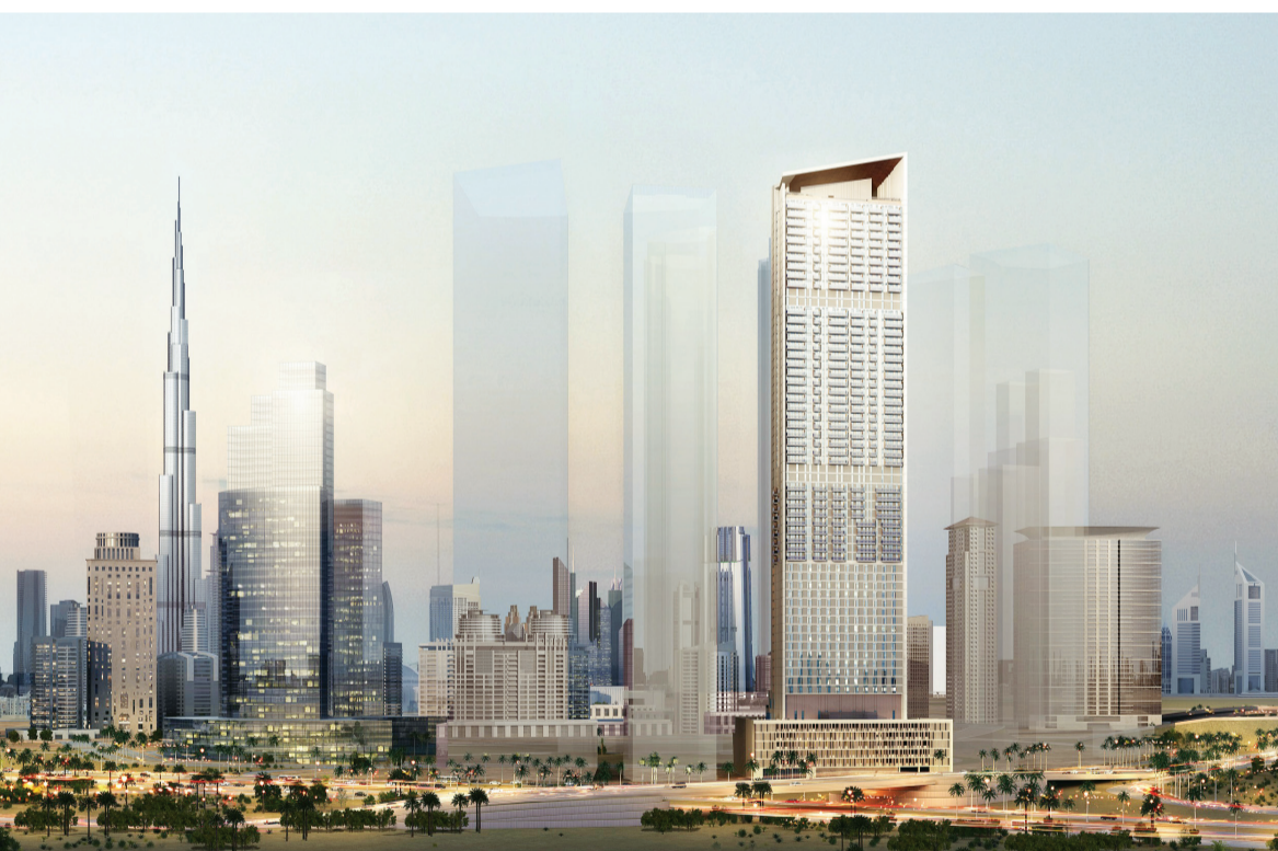
■ مساحة البناء في المشروع تقدر بـ1,3 مليون قدم مربعة | البيان