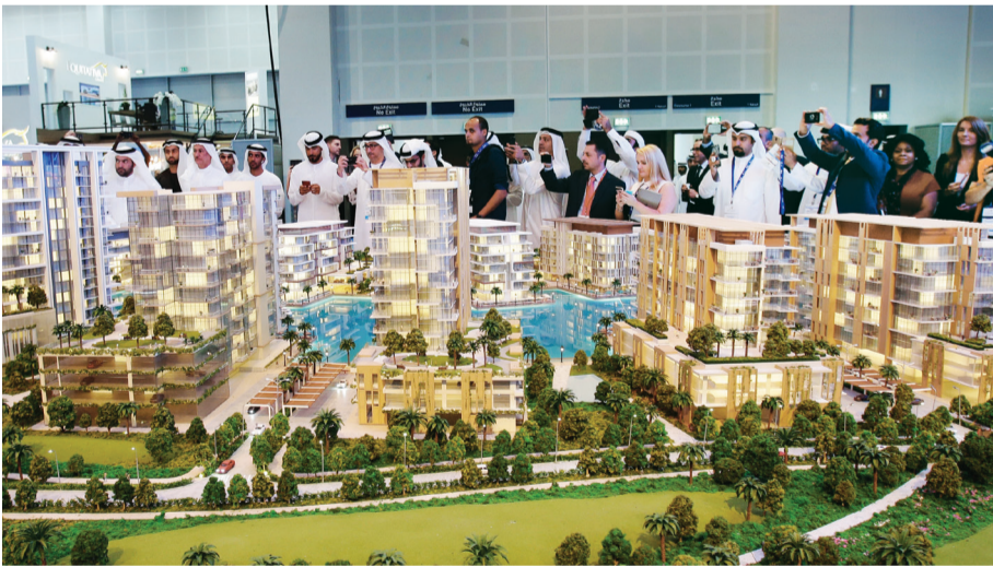
تصوير زفير ولسون

دستركت 2020 الذي سينطلق بعد إسدال الستار على إكسبو 2020 دبي، هو توعية المجتمع والمستثمرين بالمخطط المستقبلي لموقع الحدث، مشيرة إلى أن المنطقة ستضم 5 قطاعات رئيسية. وأضافت أن دستركت 2020 ستكون واحداً من أكثر الأماكن اتصالاً على مستوى العالم، في موقع تفصله ساعة واحدة عن مركز كل من مدينتي أبوظبي ودبي، ويجانب ما سيصبح أضخم مطار في العالم، وميناء جبل علي، كما أنها ستجسد أحدث أنماط العيش والأعمال العصرية بكل جوانبها، فستجمع بينات العمل والعيش والترفيه في منظومة متكاملة تعزز التواصل وتحفز الإبداع والابتكار.