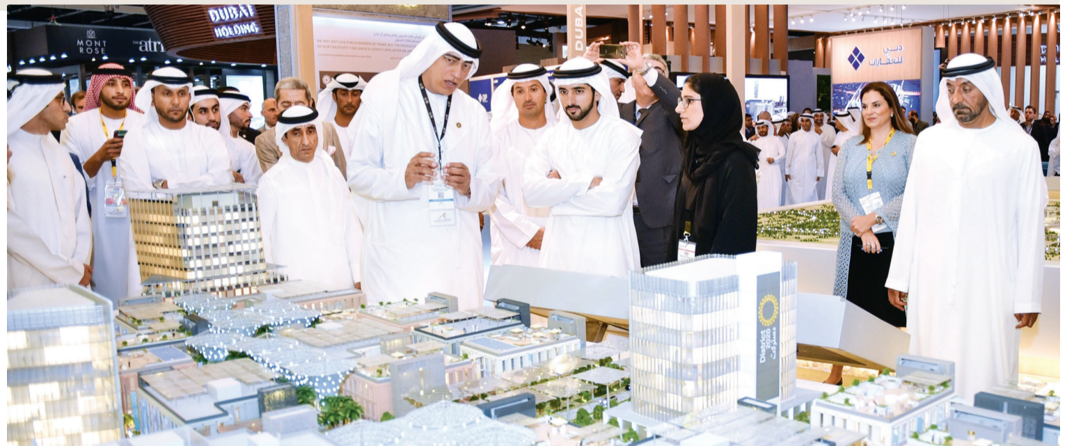
■ حمدان بن محمد يستمع بحضور أحمد بن سعيد وسعيد بن مكتوم وهلال المري إلى شرح من أحمد الخطيب حول مشروع ديستريكت 2020 في جناح إكسبو 2020 دبي

والأمان والأسواق المفتوحة على مستوى المنطقة والشرق الأوسط وشمال أفريقيا، وصولاً إلى جنوب شرق آسيا. وفي تغريدات لسموه على تويتر، أشار سمو الشيخ حمدان بن محمد بن راشد آل مكتوم، إلى افتتاح سموه معرض سيتي سكيب جلوبال، أكبر معرض عقاري في المنطقة، وذلك بمشاركة أكثر من 300 شركة من داخل وخارج الدولة، تعرض مشاريع بالمليارات، وقال سموه إن القطاع العقاري أحد أهم دعائم الاقتصاد المحلي، ومركز جذب للاستثمارات الأجنبية، وخلال النصف الأول، تم تسجيل صفقات بـ 1.32 مليار درهم في دبي. وأضاف سموه في تغريدة أخرى قائلاً: إن سوقنا العقارية مستقرة، وتتميز بالجاذبية الإقليمية والعالمية، ومستمرن في إطلاق المشاريع العقارية ذات القيمة المضافة لاقتصادنا المحلي، وإن الإمارات من أفضل الوجهات العالمية للاستثمار