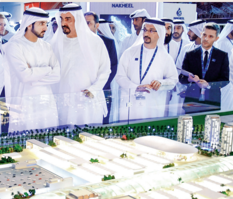
■ سموه يستمع إلى شرح من علي راشد لوتاه حول أحد مشاريع شركة نخيل

■ دبي من المدن الرائدة عالمياً في المجال العقاري ووجهة مفضلة للمستثمرين