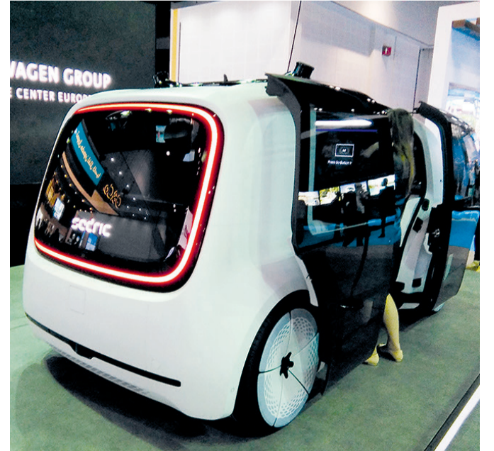
سيارة «سيدريك» لدى عرضها في «سيتي سكيب»

وتعتبر سيدريك سيارة اختيارية لم تدخل بعد مرحلة الإنتاج، وتنتمي إلى مفهوم التنقل المتكامل في المستقبل، وتم ابتكارها وتصميمها وتطويرها بالتعاون مع مركز المستقبل الأوروبي التابع لمجموعة فولكس واجن في بوتسدام ومركز أبحاث مجموعة فولكس واجن في فولفسبورغ. وتم عرضها للمرة الأولى في معرض جنيف الدولي للسيارات الذي أقيم في 6 مارس الماضي، تلاها ظهور نان للسيارة في معرض شانغهاي للسيارات في أبريل، ويمكن أن تأخذ سيدريك بين معالم المدينة، والضواحي والريف، ويعتبر عرضها في حدث عقاري دليلاً على أهمية مستقبل التنقل في صياغة التطوير الحضري والعمراني