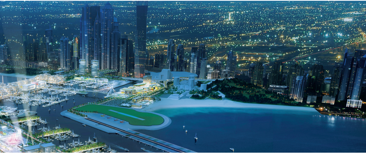
■ أول وجهة سفن سياحية تقوم بإنشاء مبني ركاب في الوقت ذاته | البيان

40 مليون شخص سيسافرون على متن السفن بحلول 2030