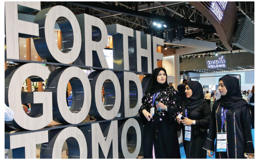
جذب معرض سيتي سكيب مستثمرين من مختلف الفئات وشهد حضوراً ناسياً لافتاً من الباحثات عن فرص استثمار عقارية مجزية وذلك بفضل تنوع المنتجات العقارية المعروضة