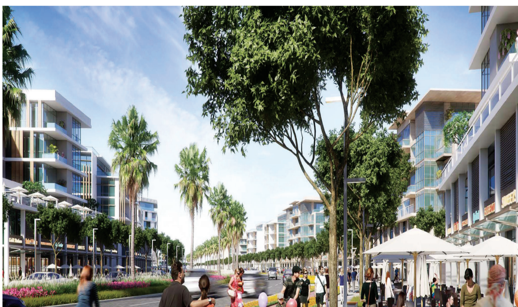
عزيري للتطوير تبيع 50% من المرحلة الثانية من عزيري ريفيرا في اليوم الأول للمعرض | من المصدر

ناجحة عبر عدد من مشاريعها الأخرى خلال معرض سيتي سكيب جولوبال 2017، شملت عقارات فارهاد عزيري ريزيدنس في مدينة دبي الصحية وعزيري مينا للشقق الجاهزة في نخلة جميرا والمشاريع السكنية قيد التطوير في منطقة الفرجان. وتقدر القيمة الإجمالية للاستثمارات في المشاريع الثلاث المعروضة في سيتي سكيب حوالي 20 مليار درهم إماراتي. وحالياً، قامت عزيري للتطوير من إنجاز 9 مشاريع رائدة ضمن محافظة عقراتنا السكنية بمختلف أنحاء الإمارة، ومن المقرر تسليم 9 مشاريع أخرى بحلول العام 2018. وستكون السنوات القليلة المقبلة فترة توسع مستمر.