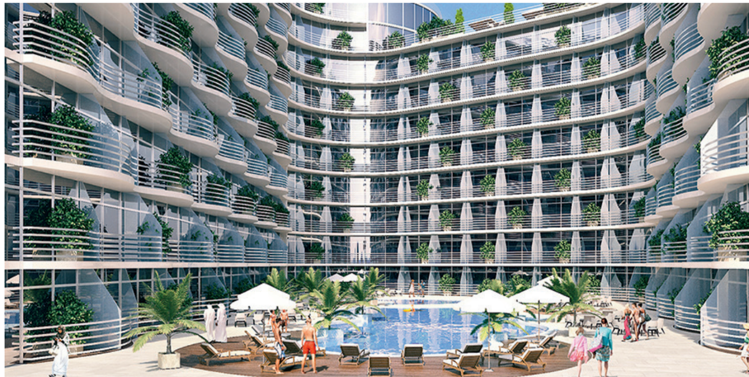
منتجع المهرة

مساحة 126,000 قدم مربعة في جزيرة المرجان، لإنشاء وتطوير «منتجع المهرة»، المقرر افتتاحه عام 2021، ويحتوي على 548 غرفة، وحمام سباحة ومركز لياقة البدنية، ونادي رياضي وسبا، ومساحات خاصة للأطفال، تتيح لهم ممارسة النشاطات في بيئة آمنة وممتعة. كما أعلنت شركة «محمد رقيط العقارية»، العاملة في تطوير العقارات السكنية والتجارية، عن ثاني فندق لها على شاطئ جزيرة المرجان من فئة 4 نجوم، إذ نجحت في تطوير وتشغيل «دبل تري باي هيلتون» داخل جزيرة المرجان، وهو أكبر فندق في الإمارات الشمالية، إذ يحتوي على 723 غرفة فندقية، وهو يعد أكبر فندق من حيث عدد الغرف الفندقية لـ «هيلتون العالمية» في الدولة. كما أعلنت شركة «محمد رقيط العقارية»، العاملة في تطوير العقارات السكنية والتجارية، عن ثاني فندق لها على شاطئ جزيرة المرجان من فئة 4 نجوم، إذ نجحت في تطوير وتشغيل «دبل تري باي هيلتون» داخل جزيرة المرجان، وهو أكبر فندق في الإمارات الشمالية، إذ يحتوي على 723 غرفة فندقية، وهو يعد أكبر فندق من حيث عدد الغرف الفندقية لـ «هيلتون العالمية» في الدولة. تبلغ قيمة الاستثمار في الفندق الجديد 400 مليون درهم، ويضم 500 غرفة فندقية.