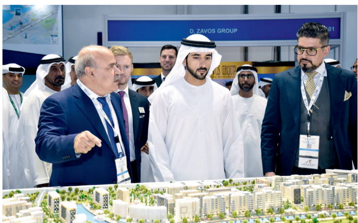
■ ويتفقد أحد مشاريع عزيزي بحضور مرويس عزيزي