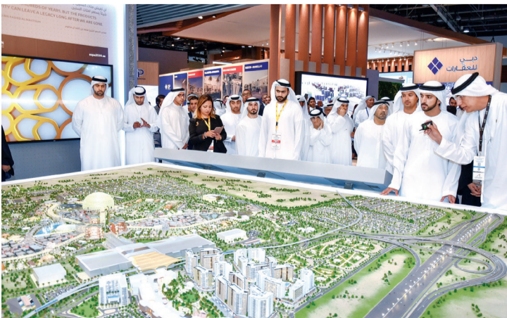
■ ويطلع على مشاريع إكسبو 2020 دبي

وتوقف سمو ولي عهد دبي خلال جولته عند عدد من منصات الشركات العارضة لمشاريعها الحالية والمستقبلية، واستمع من القائمين عليها إلى شروح تناولت خطط هذه الشركات للمساهمة