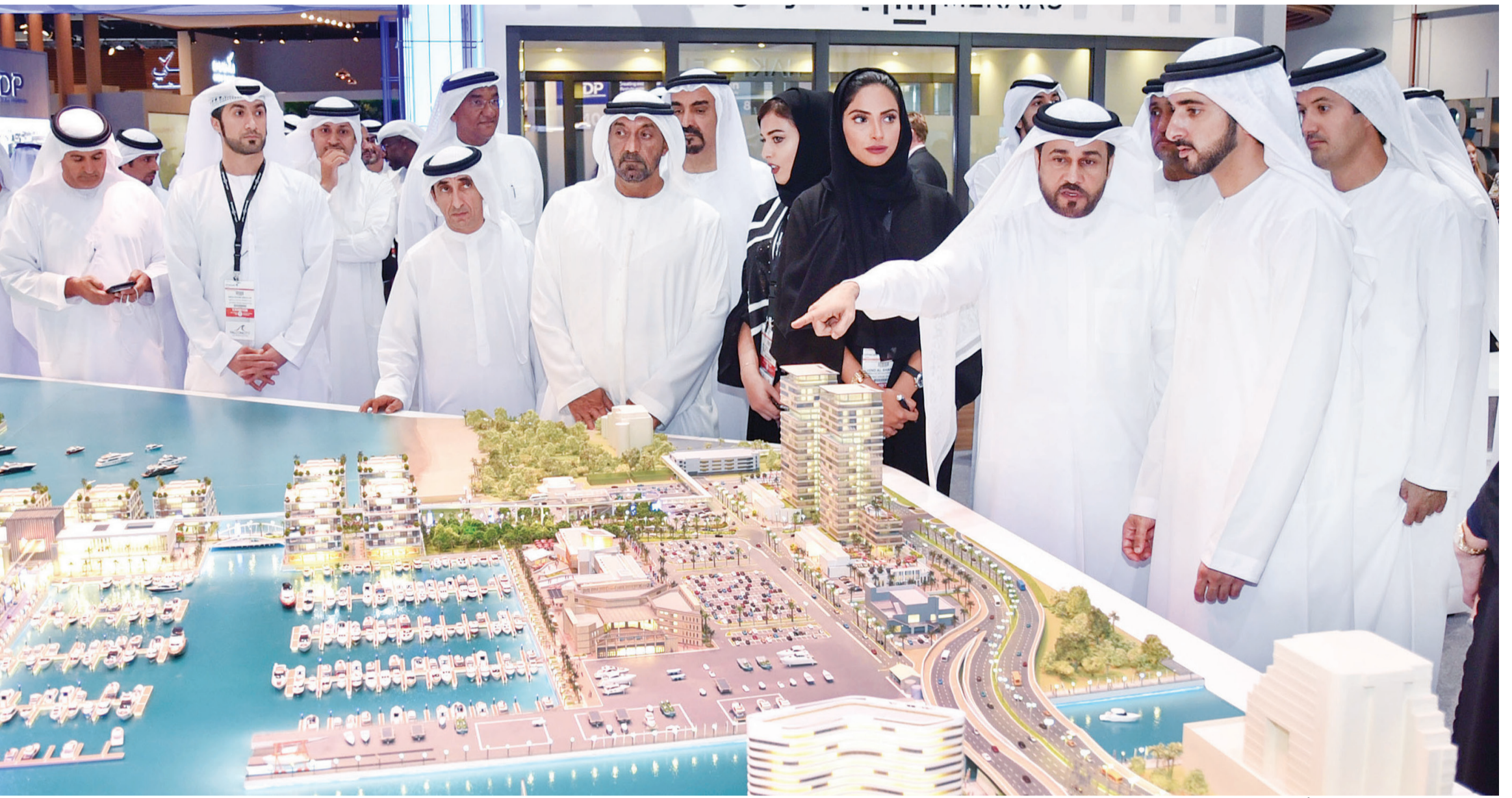
حمدان بن محمد يستمع بحضور أحمد بن سعيد وسعيد بن مكتوم إلى شرح من عبد الله الجبالي حول مشروع دبي هاربور | تصوير: سيف محمد

■ مستمرون في إطلاق المشاريع العقارية ذات القيمة المضافة لاقتصادنا