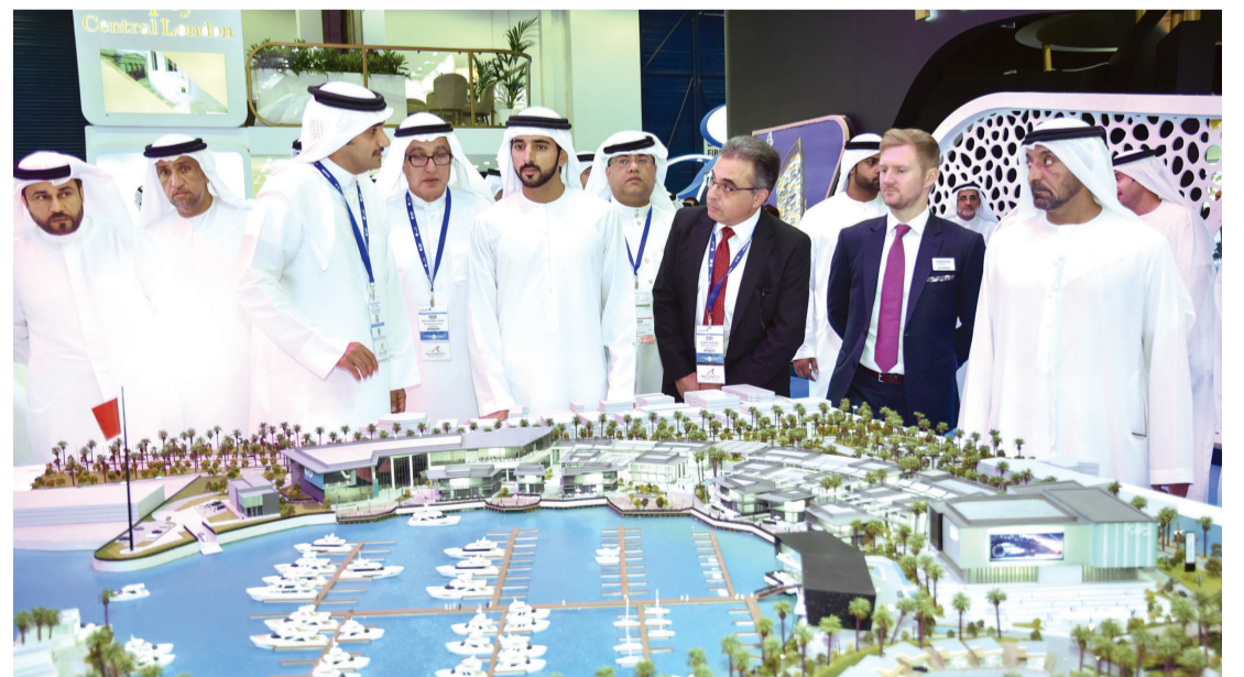
■ حمدان بن محمد يتفقد جناح إحدى الشركات الخليجية

افتتح سمو الشيخ حمدان بن محمد بن راشد آل مكتوم ولي عهد دبي، صباح أمس، معرض «سيتي سكيب جلوبال»، الذي يستضيفه مركز دبي التجاري العالمي على مدى ثلاثة أيام، وأبدى سموه ارتياحه لما تقوم به الشركات الوطنية من جهد وعمل ومثابرة في مجال البناء والتطوير العقاري، مؤكداً أهمية هذا القطاع في دعم اقتصادنا الوطني وتنويع مصادره وإنعاش السوق العقاري وتنشيطه محلياً وإقليمياً وعالمياً، حيث تعتبر مدينة دبي من المدن الرائدة عالمياً في هذا الميدان، والوجهة المفضلة للمستثمرين العالميين والإقليميين. واطلع سموه عند زيارته منصة إكسبو 2020 دبي، على مجسم ضخم للمجتمع الحضري المتكامل «ديستريكت 2020»، كارت إكسبو دبي بعد إسدال الستار على