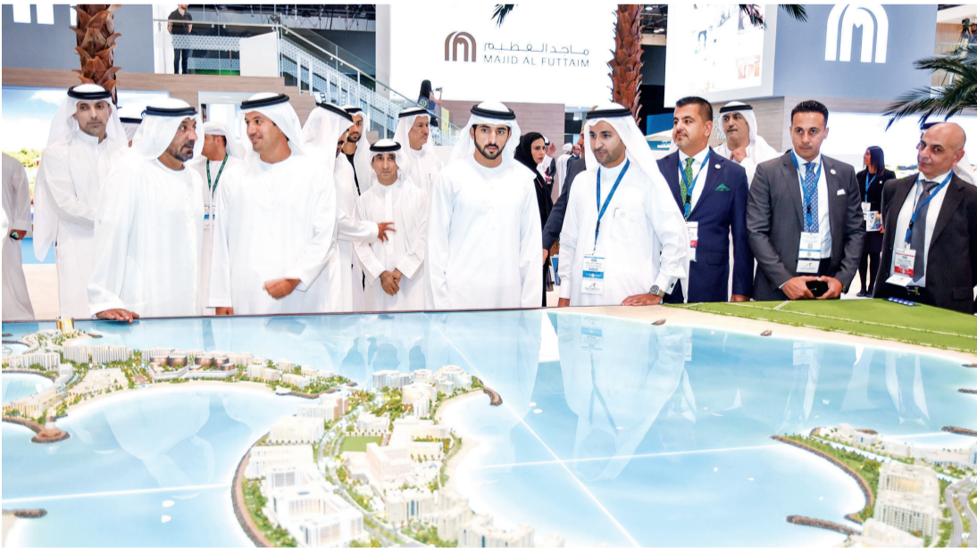
■ ولي عهد دبي يتعرف من عبدالله العبدولي إلى مشروع جزيرة المرجان

جميع مشاريع التطوير العقاري في جميع أنحاء دبي.