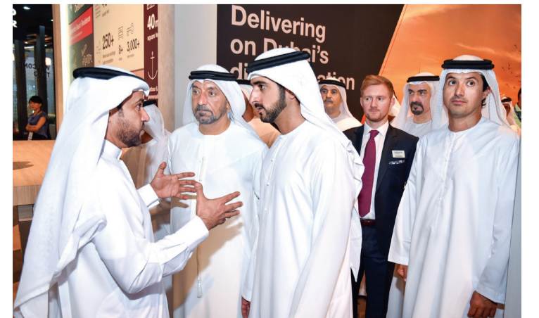
■ حمدان بن محمد يستمع إلى شرح حول مشاريع دبي القابضة من عبدالله الجبالي