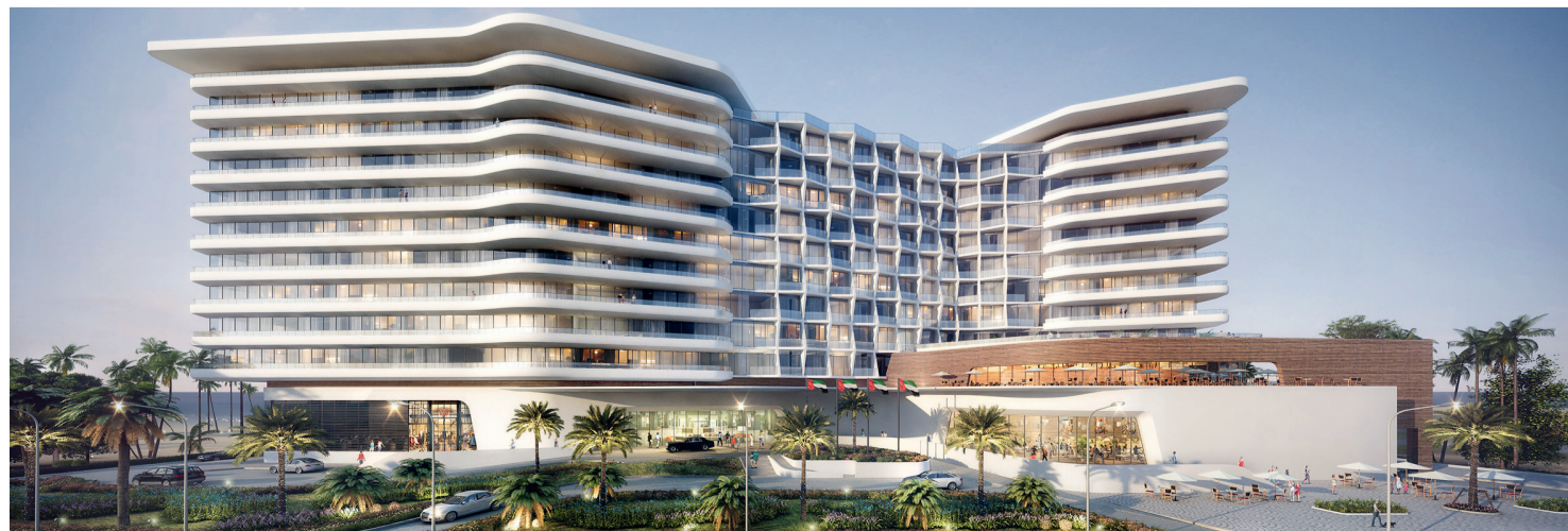
فندق جديد في جزيرة المرجان