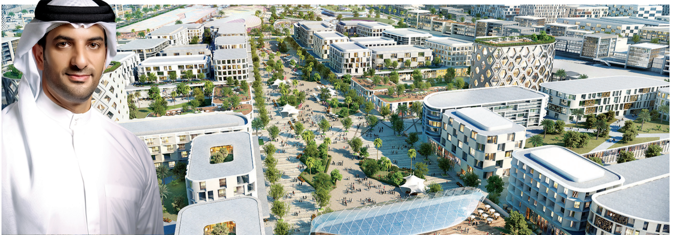
مشروع الجادة أحدث مشاريع الشارقة وأكبرها