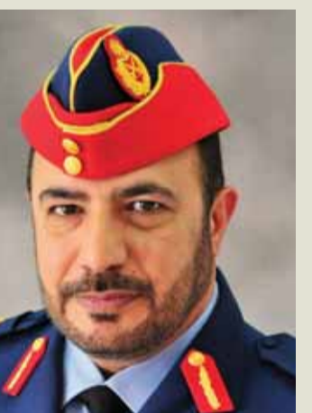
■ إبراهيم العلوي

وأكد اللواء الركن العلوي أنه لا بد لنا أن نتذكر في هذا اليوم أن علينا أن نحمل الراية ونتابع المسيرة؛ فكل أبناء الدولة يدركون خطورة المرحلة التي تمر بها المنطقة وأن هناك تحديات تحرك لمختلف الدول فيها ولا سيما تلك التي حافظت على استقرارها وازدهارها واستمرت في تطورها ولا بد من التأكيد على أن مثل هذه التحديات لن تزيد أبناء الإمارات إلا صلابة وقوة؛ فهم يعون أن اتحاد كلمتهم وحبهم لوطنهم هو مصدر قوتهم وأن خوض غمار المعارك وحمل السلاح في وجه كل من يقدم على النيل من عزة الوطن وكرامته.. هو واجب وطني سام وشرف يتسابقون لترابه وظلوا أحياء في قلوبنا يتنفسون في التعبير عن حب الوطن والانتفاء معنا عزة وكبرياء واستحقوا رضا الله عز وجل ومكانة عنده لا ينالها إلا النيبون والصديقون واستحقوا جنة عرضها السموات والأرض. وأضاف: فهنيئاً للشهيد خلوده