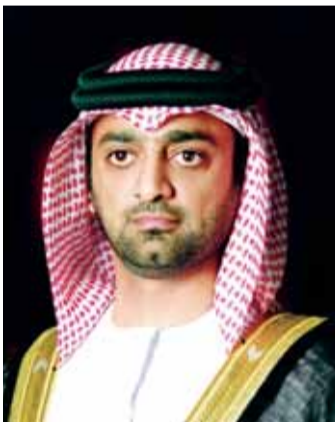
عجمان - وام

أكد سمو الشيخ عمار بن حميد النعيمي ولي عهد عجمان أن تضحيات شهداء الإمارات في ساحات الحرب وميادين القتال أثبتت للعالم أن على الأرض رجالاً لا يتوانون عن نصرته الإنسانية والحق وتسطير البطولات في سجل التاريخ بدمائهم النقية وأرواحهم الطاهرة.