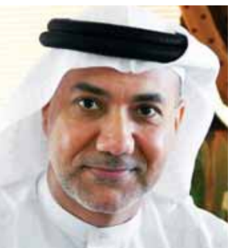
■ طيب الريس

وقال الدكتور علي بن سباع المري، الرئيس التنفيذي لكلية محمد بن راشد للإدارة الحكومية: في مثل هذا اليوم من كل عام نحني ذكري شهدائنا الأبرار الذين ضحوا بأغلى ما لديهم