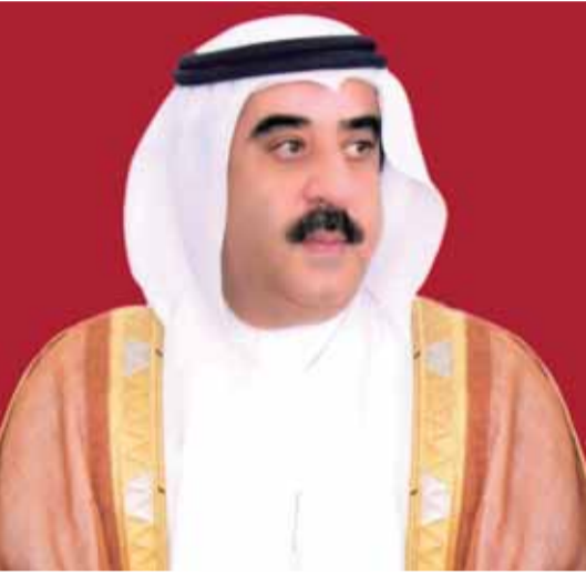
أم القيوين - وام

أكد صاحب السمو الشيخ سعود بن راشد المعلا عضو المجلس الأعلى حاكم أم القيوين، أن أبناء قواتنا المسلحة قدموا نموذجاً في التضحيات وجادوا بدمائهم لرفع شأن الوطن والذود عن حياضه ومبادئه بجانب ترسيخ الأمن والاستقرار وتطبيق المبادئ الدولية وفق رؤية القيادة وصولاً لتحقيق الأهداف الوطنية وصيانة الإنجازات وبناء النموذج الوطني الحسي الذي يؤمن بأسمى مبادئ الوطنية.