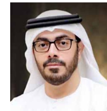
■ خالد آل ثاني

وقال: بفضل تضحيات الآباء المؤسسين الأوائل، والرؤية الحكيمة للقيادة الرشيدة، وبطولات الجنود البواسل، تعززت مكانة دولة الإمارات العربية المتحدة، وازدادت قوة وصلابة في وجه التحديات، تنظّل واحة للأمن، والأمان، والعطاء، والرخاء، ونصيرة لكل شعوب الأرض، كي ينعم العالم بالاستقرار والسلام والازدهار.