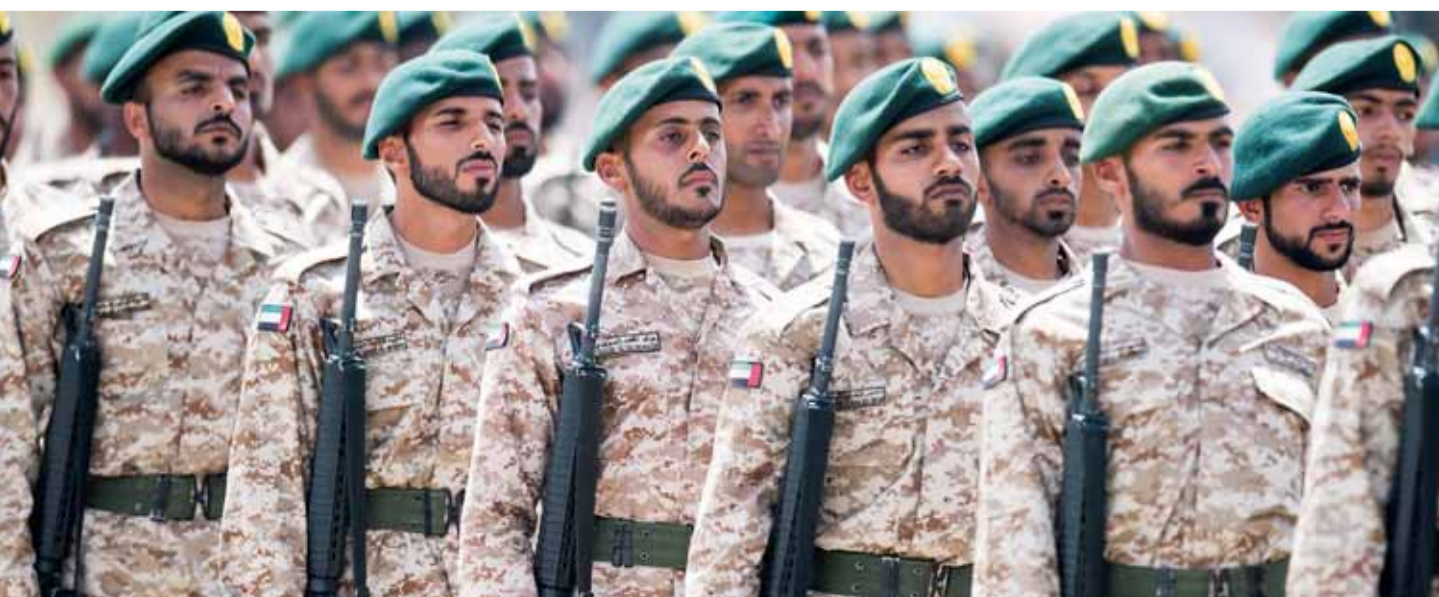
جنودنا البواسل محل فخر واعتزاز