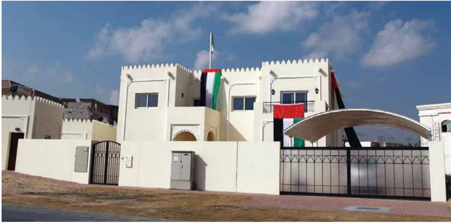
■ منازل أسر شهداء الوطن مصممة وفق أرقى المعايير | وام

وتؤكد حملة #الإمارات_بكم_تفخر مشاعر الفخر والاعتزاز من القيادة والشعب والمقيمين على أرض دولة الإمارات العربية المتحدة بطولات شهداء الوطن وتضحياتهم والوقوف مع أسرهم وذويهم في هذه المرحلة التي تتجسد فيها معالم الوحدة والتلاحم بين قيادة الدولة وشعبها والمقيمين على أرضها الطيبة في أبهى صورها وأسمى أشكالها ومعانيها.