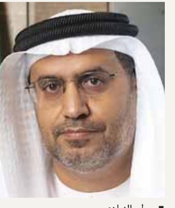
■ مطر النيادي

وفي هذا اليوم نقف دقيقة صمت نستذكر فيها أعظم دروس التضحية وحب الوطن، ونتضرع إلى الله بالدعاء لشهدائنا الأبطال، ونسأل الله أن يلهم الصبر والسلوان لأهلهم وذويهم آباء وأمهات الذين أنشأوا أبناءهم على حب الوطن والتضحية بكل