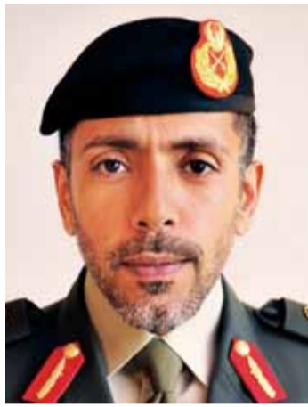
■ أحمد بن طحنون

إن يوم الشهيد وكما أوضح سيدي نائب القائد الأعلى للقوات المسلحة من أنه «رمز، لأنه في نفس الوقت يمثل بدءاً وطنياً واجتماعياً ومعنوياً تتجلى فيه قيم العطاء والبذل والتضحية والشجاعة». وأردف قائلاً: نعم سيظل شهداؤنا الأبرار ملهمة وطنية في تاريخ دولتنا، وستظل دماؤهم الطاهرة عطرًا يعبق به الوطن وأرجائه وسيبقى اسمهم الذي نقشوه بحروف من نور في طريق التضحية والولاء عنواناً للأبناء والأحفاد والأجيال القادمة وستظل الإمارات بقيادتها الرشيدة دوماً مصدر عون للشقيق والصديق فيما يخدم خير الإنسانية وأمن الشعوب وتنميتها. رحم الله شهداء الحق والواجب شهداء الوطن الأبرار وأسكنهم فسيح جناته الخالدة، وجزى أهلهم وذويهم كل صبر وخير وسلوان.