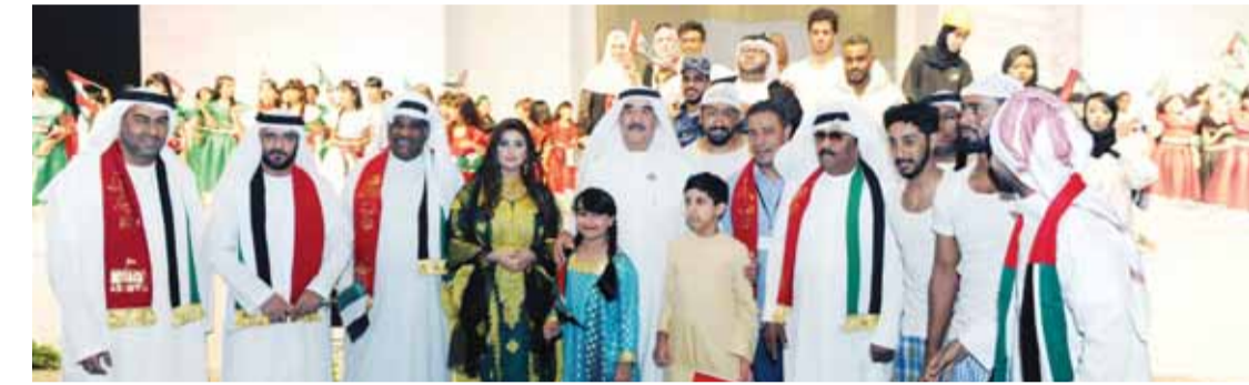
حاكم أم القيوين خلال الاحتفالات

منظومة العمل الحكومي الاتحادي لتخدم كافة القطاعات التعليمية والصحية والبنية التحتية واستشراف المستقبل. إلى ذلك.. حضر صاحب السمو حاكم أم القيوين العرض المسرحي الذي أقيم في قاعة الشيخ خليفة للأفراح منثبا على القائمين عليه معرباً عن سعادته بما شاهده والحضور من فقرات وفعاليات نظمت بجهود كل القطاعات الحكومية والخاصة للمشاركة.. تعبيراً عن الفخر والولاء والانتماء والحب للقيادة الرشيدة ولدولة الإمارات.