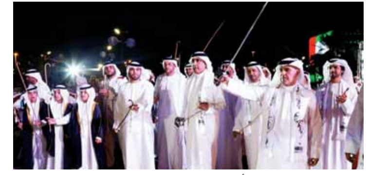
جانب من احتفالات شرطة أبوظبي

ولي عهد أبوظبي نائب القائد الأعلى للقوات المسلحة وإخوانه أعضاء المجلس الأعلى حكام الإمارات، لافتاً إلى أن 2 ديسمبر محطة وطنية مهمة في تاريخ الإمارات الحديث ومرمراً للعرز.