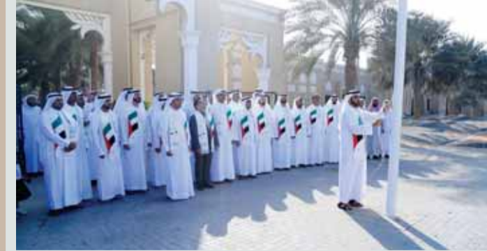
الخطيب يرفع علم الدولة فرحاً باليوم الوطني لإسلامية دبي

المساجد بالإبانة عن الدكتور حمد بن الشيخ أحمد الشيباني المدير العام للدائرة، مع بعض المديرين التنفيذيين لقطاعات الدائرة ومديري الإدارات. وألقى الدكتور عمر الخطيب كلمة الدائرة بالمناسبة، بارك فيها لصاحب السمو الشيخ خليفة بن زايد آل نهيان رئيس الدولة، حفظه الله، وأخيه صاحب السمو الشيخ محمد بن راشد آل مكتوم نائب رئيس الدولة رئيس مجلس الوزراء حاكم دبي، رعاه الله، وإخوانهما أصحاب السمو حكام الإمارات وسمو أولياء العهود والنواب وشعب الإمارات، هذه المناسبة العزيرة على قلوب أبناء الإمارات.