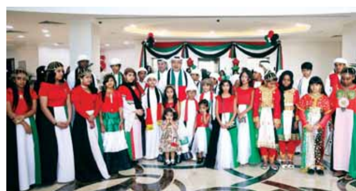
مظاهر البهجة ترتسم على وجوه الأطفال

الفقرات والفعاليات شملت رفع علم الدولة أمام مقر الجمعية في منطقة المحيصة الثانية في دبي وكلمات أكدت حجم المنجزات التي حققتها دولة الإمارات بفضل الاتحاد وما بذله الآباء المؤسسون لهضة هذه الدولة وما تقدمه القيادة الرشيدة لتعزيز ازدهار الإمارات وتقديمها وصولاً لأن تكون من أفضل دول العالم بحلول العام 2021.