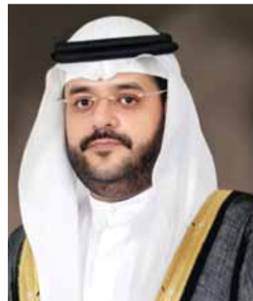
الفرس الطيب يسير وفق نهج الآباء والأجداد

قلوبنا يوم الشهيد.. هذا اليوم الذي يذكرنا بنخبة مميزة وسيرة عطرة لعدد من أبنائنا من شباب الوطن الذين رحلوا عنا وهم في أشرف ميادين العمل وغادرونا في محطة من أعلى وأكبر محطات الشرف والوطنية.