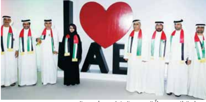
مطر الطائر متوسّطاً المديرين التنفيذيين

وزينت هيئة الطرق والمواصلات في دبي عربات الترام الداخلية بأضواء تسطع بألوان علم الدولة، إضافة إلى تزيين الشوارع الرئيسية في إمارة دبي بـ 1000 علم للدولة، فضلاً عن تزيين 45 مركبة أجرة و10 حافلات من وسائل المواصلات العامة التابعة للهيئة بعلم الإمارات، وكذلك تزيين مبنى الهيئة بـ 125 معلماً، مع وضع شعار اليوم الوطني على بصمة أجهزة الحضور والانصراف، مع توزيع هدايا تذكارية على الموظفين والزوار، وشهد مطر الطائر المدير العام