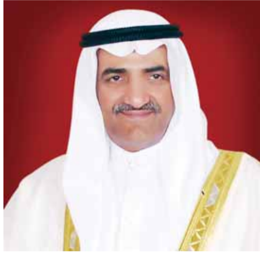
الفجيرة - وام

أكد صاحب السمو الشيخ حمد بن محمد الشرقي عضو المجلس الأعلى حاكم الفجيرة، أن «يوم الشهيد» هو يوم تكريم الرجال الأوفياء الذين حملوا أرواحهم على أكفهم وبذلوا الروح رخيصة من أجل أن تبقى راية الإمارات مرفوعة وخالدة، مشيراً إلى أنه مناسبة وطنية يتم فيها تكريم شهداء الوطن واستذكار بطولاتهم وتضحياتهم وإخلاصهم وولائهم لوطنهم وقيادتهم الرشيدة. وقال سموه - في كلمة وجهها عبر مجلة درع الوطن بذكرى «يوم الشهيد» - إن الأوطان لا تبني دون تضحية أو فداء وإن رجالاً من أبناء الإمارات ضحوا بأنفسهم ليبقى وطنهم شامخاً رافعاً رأسه نحو القمم.