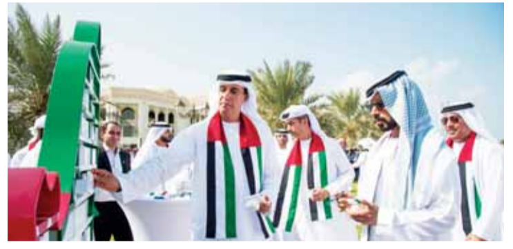
خليفة بن طنونون وجبر السويدي خلال الاحتفالية

ورفع الشيخ خليفة بن طنونون بن محمد آل نهيان وجبر محمد غانم السويدي أسمى آيات التهاني والتبريكات إلى مقام صاحب السمو الشيخ خليفة بن زايد آل نهيان رئيس الدولة «حفظه الله» وصاحب السمو الشيخ محمد بن راشد آل مكتوم نائب رئيس الدولة رئيس مجلس الوزراء حاكم دبي «رعاه الله» وصاحب السمو الشيخ محمد بن زايد آل نهيان ولي عهد أبوظبي نائب القائد الأعلى للقوات المسلحة وأصحاب السمو الشيوخ حكام الإمارات وسمو أولياء العهود ونواب الحكام وإلى شعب الإمارات العزيز بمناسبة اليوم الوطني للدولة.