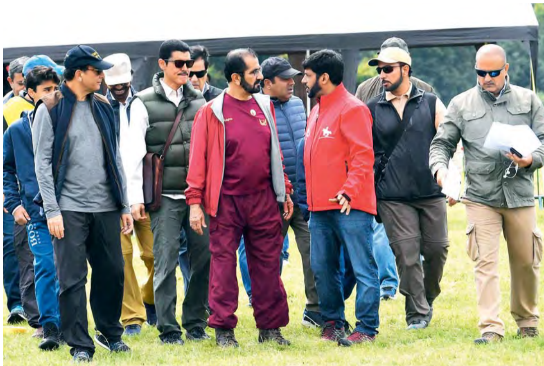
محمد بن راشد في حديث مع إسماعيل محمد بحضور سعيد الطاير وسلطان السبوسي وعلي الصابري

أوستن بارك - علي الظاهري، وام متابعة - خالد المهيري