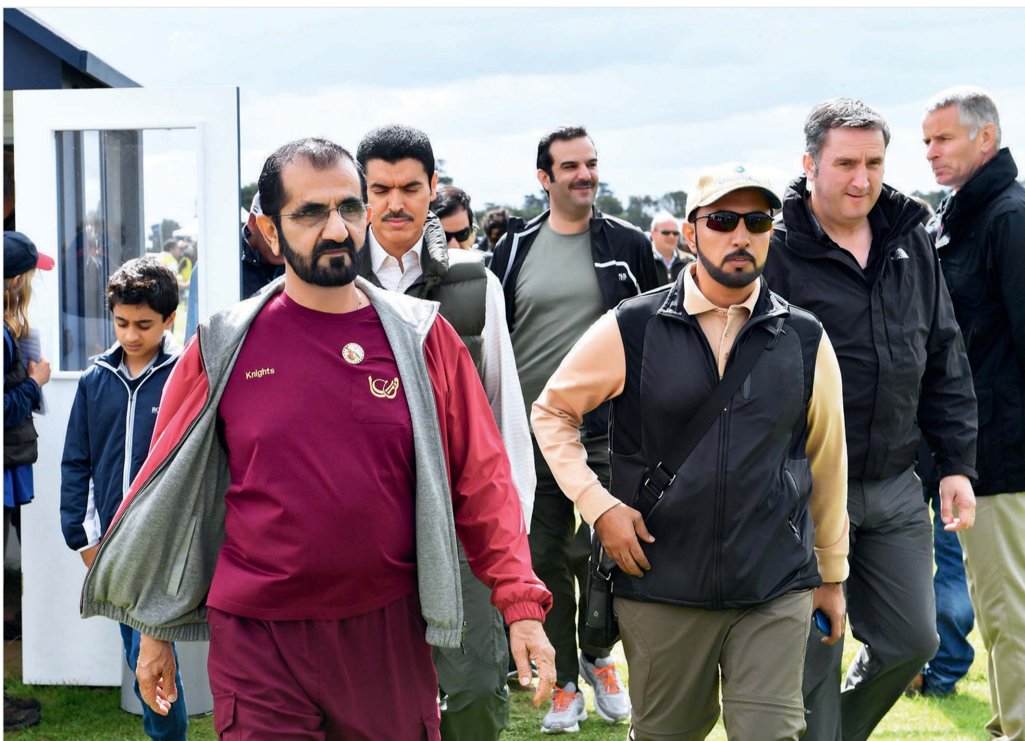
■ محمد بن راشد خلال متابعته مهرجان القدرة في أوستن بارك بحضور دعيج آل خليفة وسلطان السبوسي