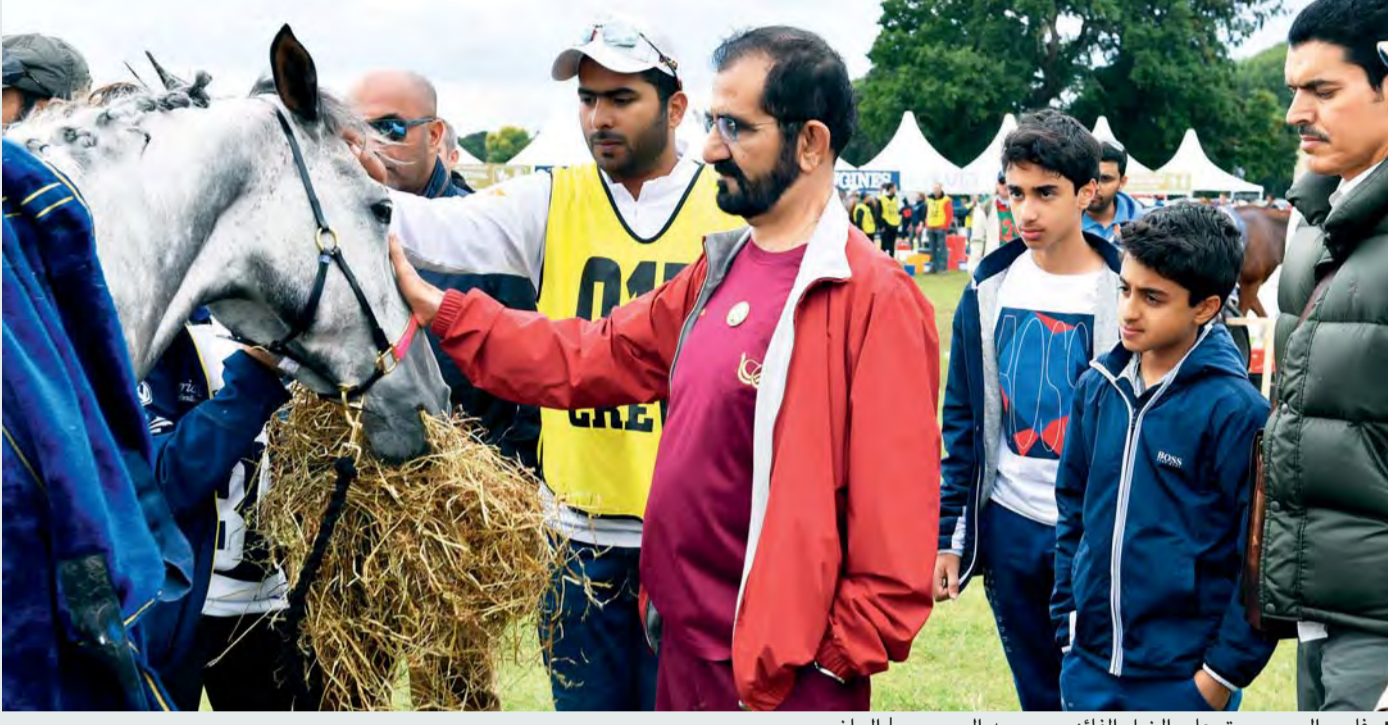
فارس العرب يربت على الخيل الفائزة مع محمد السبوسي | البيان

إذ بإمكان المالك أن يكون هو المدرب والفارس في الوقت نفسه، على خلاف سباقات السرعة. وأشار صاحب السمو الشيخ محمد بن راشد آل مكتوم إلى أن ارتباطه بالخيل لا يزال قوياً حتى الآن، مشيراً سموه إلى أنه يستمتع حينما يشرف ويتابع رياضة الآباء والأجداد عن كثب.