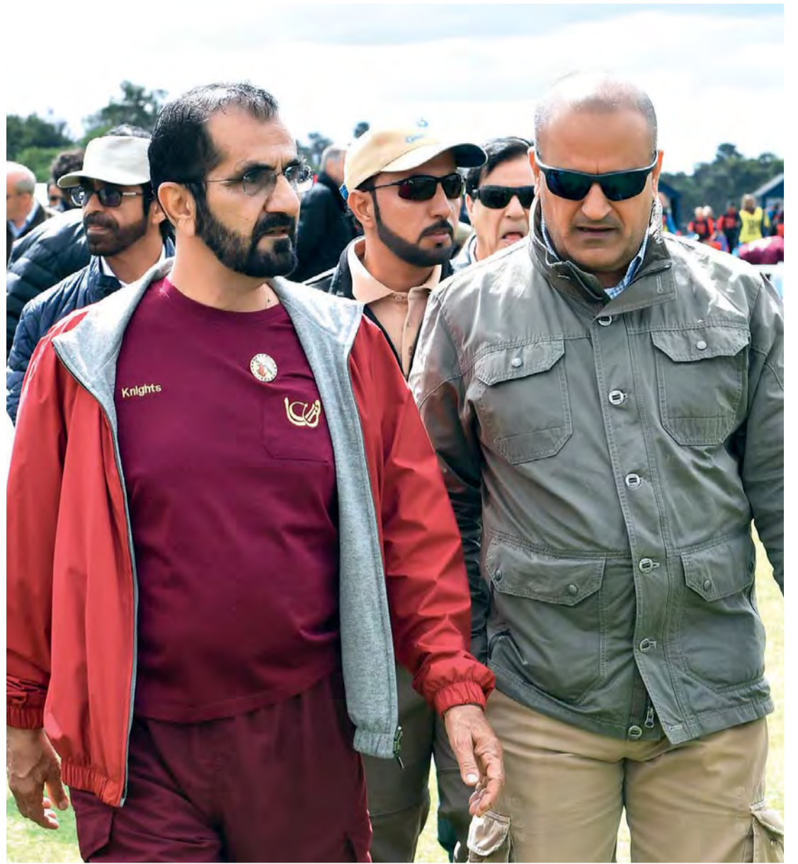
محمد بن راشد في حديث مع سعيد الطاير بحضور سلطان السبوسي وسيف الكتبي وعلي رضا | البيان