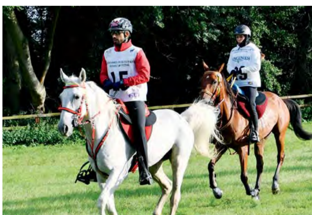
فرساننا استطاعوا مجارة الأرضية الصعبة | البيان

واهتمام سمو الشيخ حمدان بن محمد آل مكتوم، ولي عهد دبي، لفرسان إسبيلات إف 3، مما قاد إلى هيمنة الإسبيل على المراكز الثلاثة الأولى في السباق.