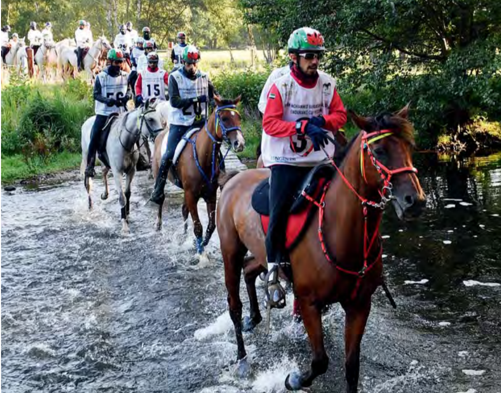
منافسة قوية من الفرسان المشاركين في المهرجان | البيان

للفروسية، حرصهم على التعامل الراقى مع جميع المشاركين في الحدث، وعكس الصورة الحضارية المشرفة للإمارات في هذا المحفل العالمي، مشيراً إلى أنهم سفراء للوطن يحرصون دائماً على نشر رسالة سامية في المهرجان للعالم أجمع وأعرب العضب عن سعادته بهذا التجمع العالمي في المهرجان الذي يتحدث بكل لغات العالم من أوروبا ودول الخليج وأميركا الخليجية، مؤكداً أن السباقات شهدت منافسة قوية من الفرسان المشاركين، وذلك في سبيل الظفر بأغلى الألقاب.