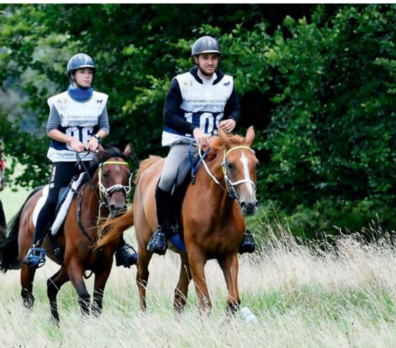
المهرجان شهد مشاركة قياسية من كافة الدول