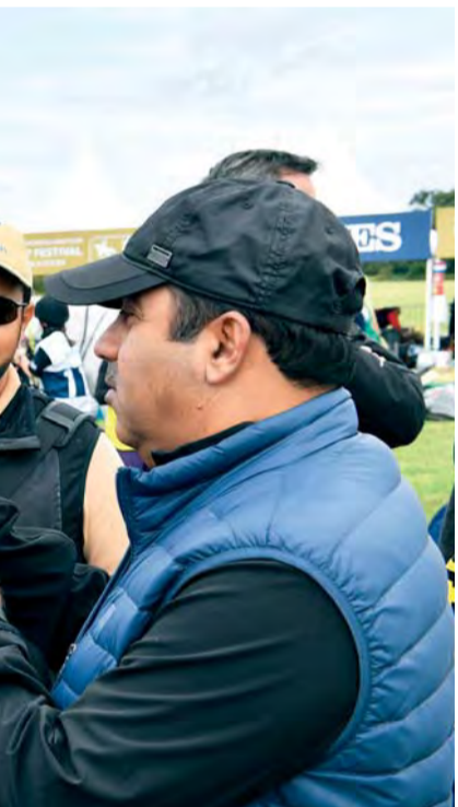
محمد بن راشد في حديث مع علي الصابري بحض