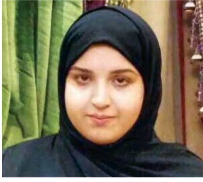
■ مزون الزعابي